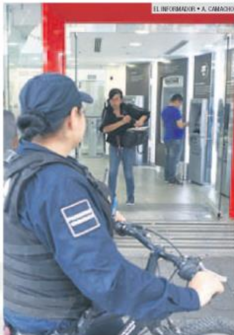
ESTRATEGIA. La medida comenzó en 2016.