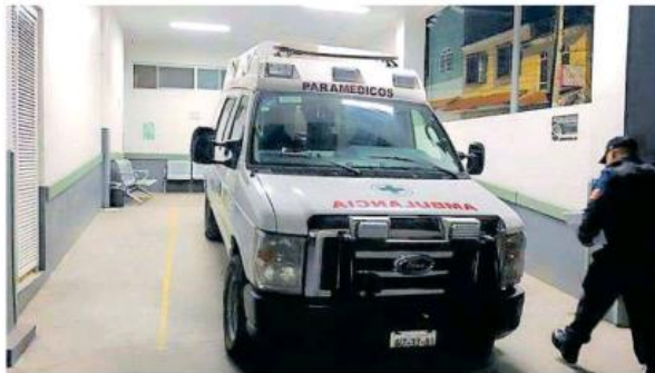
La pelea campal se llevó a cabo en un bar ubicado en 8 de Julio y Morelos.

"Hay un masculino que presenta cuatro impactos de arma de fuego. En el lugar se localiza en tres casquillos de arma corta. Se piden los servicios médicos y lo