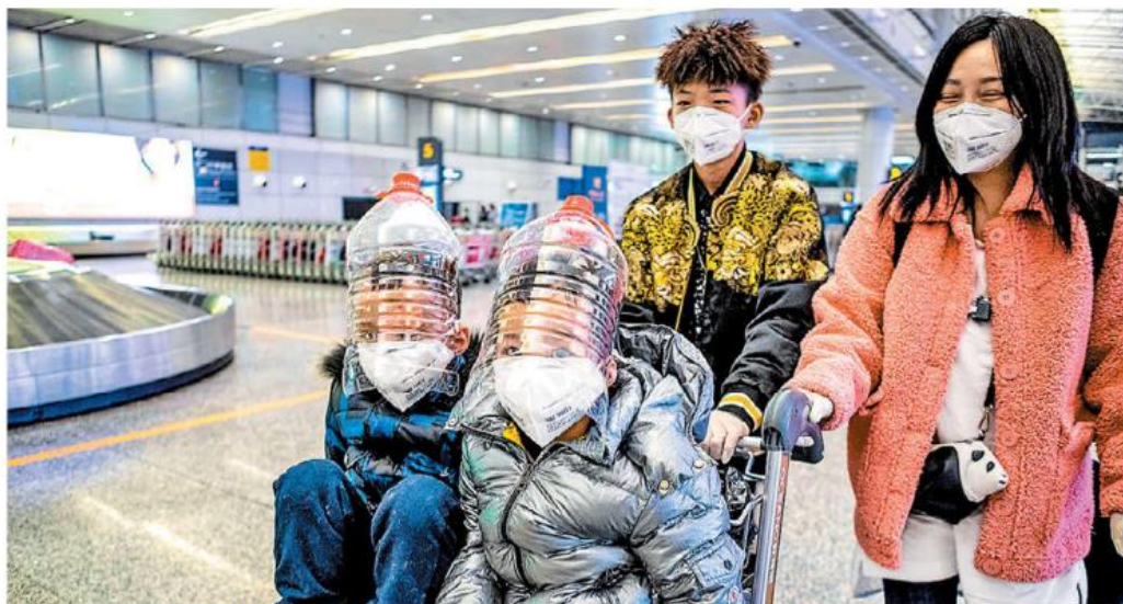
Niños con protección facial improvisada hecha con botellas de agua en el aeropuerto de Guangzhou, China.

— A partir de una denuncia, la Guardia Nacional arrestó a un hombre, lo que dio pistas para investigar otros delitos. PAG. 13