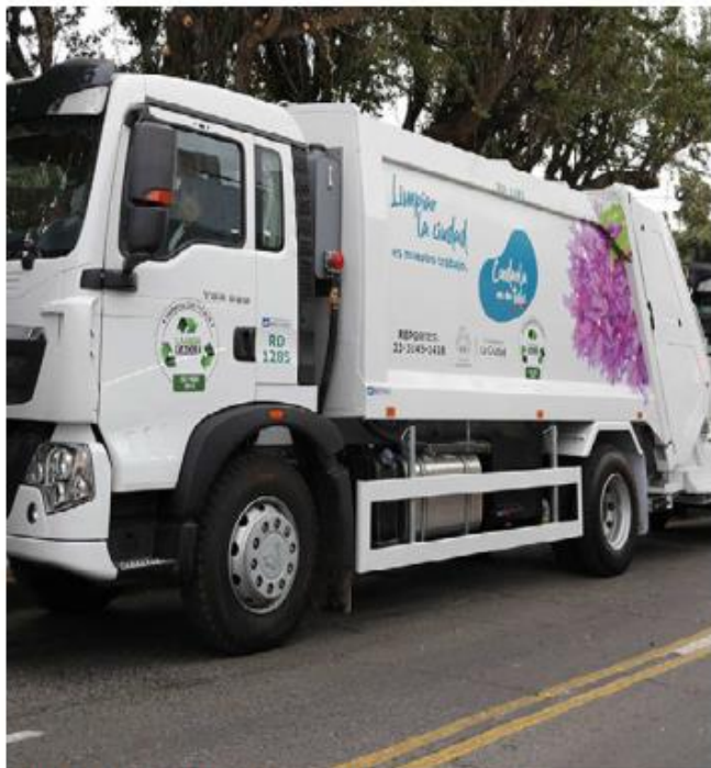
El alcalde prometió mejorar el servicio.