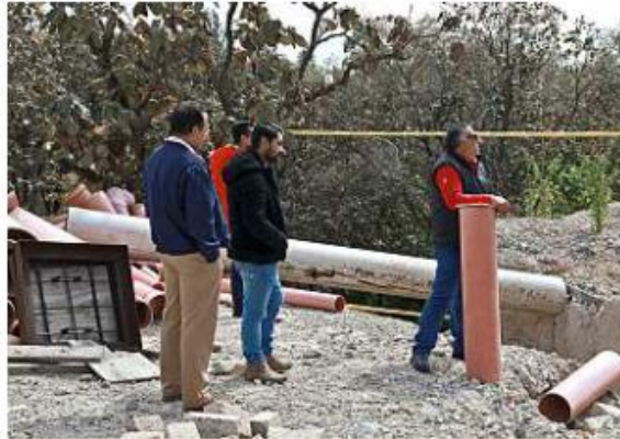
Personal de la Fiscalía Ambiental de Tlajomulco y de la Conagua inspeccionaron la zona.