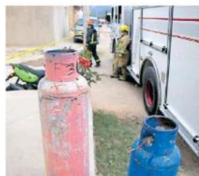
Un total de 50 vecinos fueron evacuados por este hecho.

Detalló que con el camión de bomberos se desplegaron mangueras y estuvieron a la expectativa hasta lograr contener el gas LP en el cilindro. Para controlar la situación se formaron