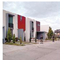
Casa de crímenes.

Capturan a integrante de banda dedicada a levantones