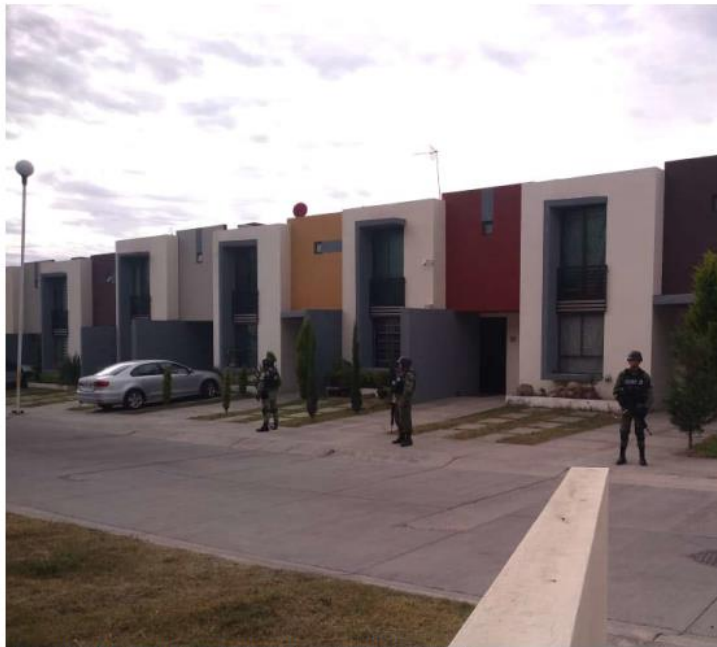
Elementos de la Guardia Nacional capturaron al sujeto.

Tlajomulco. Fue detenido en la calle principal de Bosques de Santa Anita; quedó a disposición del Ministerio Público