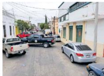
En el cruce de Eulogio Parra y Mezquitán fue encontrado uno de ellos.

Vecino de la zona reportaron al 911 un bulto extraño, detrás de una camioneta de caja seca,