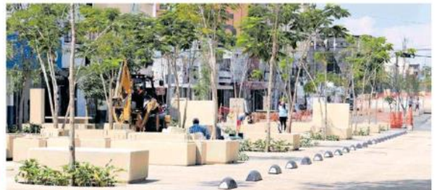
El tránsito por avenida Alcalde es peatonal y restricción vehicular. AGAPITO ESPINOZA.

Los tapatíos refirieron las complicaciones a las que se tienen que enfrentar cuando transitan por el lugar, nada más cae la noche.