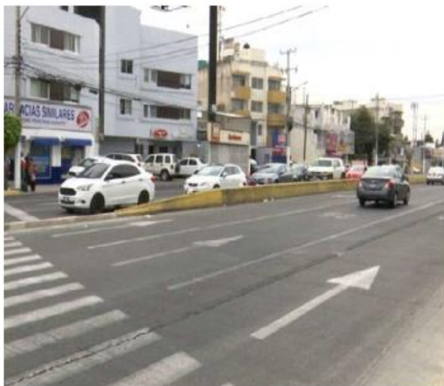
Varias personas piden dinero por esta zona. ESPECIAL