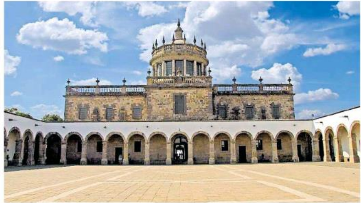
El Instituto Cultural Cabañas será sede del evento.

Para esta edición, el IMA capacitará a 25 profesionales seleccionados mediante una convocatoria conjunta entre British