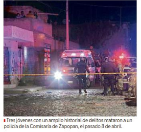
■ Tres jóvenes con un amplio historial de delitos mataron a un policía de la Comisaría de Zapopan, el pasado 8 de abril.

Acusa especialista falta de seguimiento a programas para orientar a jóvenes TANA CASILLAS De la "lealtad" al barrio, los pandilleros pueden brincar a las filas de la delincuencia organizada y aunque algunos se salvan, sus miembros generalmente cometen delitos cada vez más graves, coincidieron especialistas y miembros de las Comisarias. Como ejemplo está el caso de tres jóvenes, familiares entre sí, que asesinaron a un policía de Zapopan, cuando éste intentó revisar un vehículo en la Colonia Miramar, en abril de 2019. Ellos tenían un historial de actos vandálicos, faltas administrativas y drogadicción, que luego escaló a robo de autopartes, robo de vehículo estacionado y robo con violencia. "Si no se lleva a cabo un proceso de seguimiento en