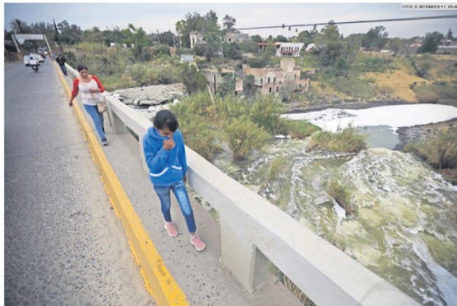
UN TUFO QUE NO SE VA. Vivir cerca del río Santiago es así: con la mano en la nariz. El hedor a descomposición que ya no debía existir sigue molestando a los serritos.

RÍO SANTIAGO TRAS 11 AÑOS DE OMISIÓN, VAN POR NUEVA MACRORECOMENDACIÓN