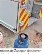
■ Por el riesgo de explosión, bomberos de Zapopan decidieron evacuar a medio centenar de habitantes de una cuadra.