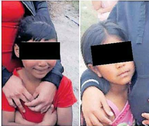
El ocupante de la moto, quien era un mayor de edad, les ofreció dinero para que se subieran.

Israel García, supervisor general de la Comisaría de San Pedro Tlaquepaque, dio a conocer que recibieron una llamada a la cabina de radio en la cual se informaba que "dos menores que estaban desaparecidas. Al arribo de la unidad nos mencionan otros pequeños y la progenitora, que