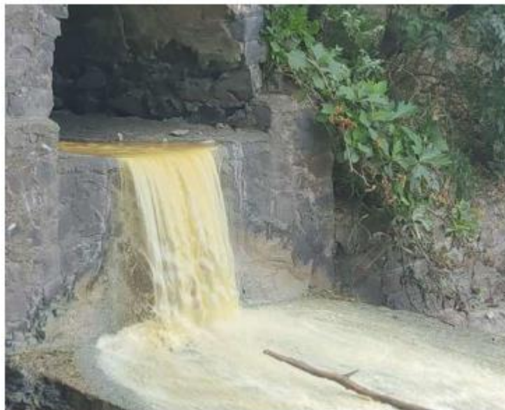
Vecinos atribuyen los desechos al rastro.

Los vecinos de la zona alrededor del Deán atribuyen estos desechos al rastro municipal y exigen a las autoridades municipales y estatales pronta solución, pues mencionaron que ya se encuentran cansados de vivir todos los días con esta pestilencia. ■