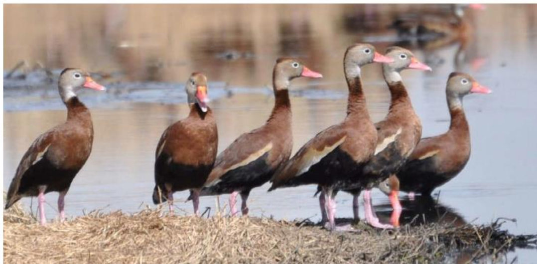
En La Presa La Vega habitan más de 190 especies de aves.

Naturaleza. La Semadet llevará a cabo una serie de actividades alrededor del estado para destacar la importancia del cuidado y conservación de estos cuerpos de agua, en el marco de su día mundial