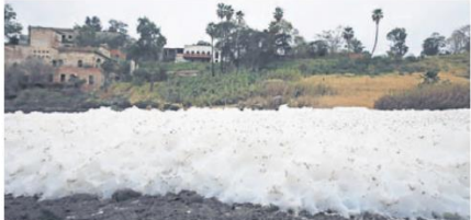
ESPUMA DE DOLOR. La alta concentración de desechos industriales continúa generando este escumante, uno que no debería ser más.