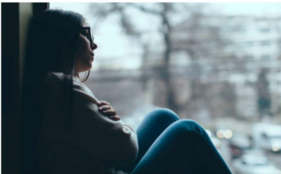
Tiene síntomas comunes con la depresión, sin embargo, no siempre están ligadas. ESPECIAL

Otra forma frecuente de manifestación, apuntó, es el trastorno mixto ansioso-depresivo,