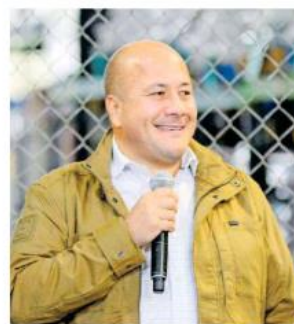
El gobernador Enrique Alfaro, cambió de parecer.

El INSABI tiene por objeto proveer y garantizar la prestación gratuita de servicios de salud, medicamentos y demás insumos asociados a las personas sin seguridad so-