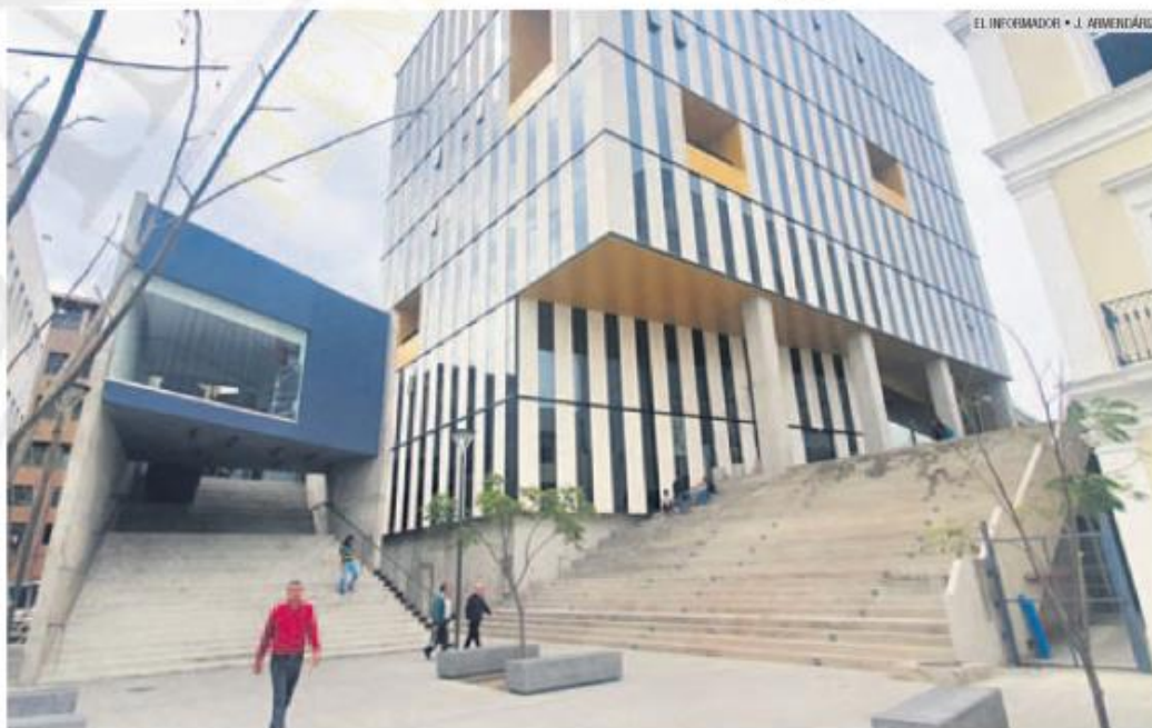
DESARROLLO. Ciudad Creativa Digital ya registra actividad constante.

Sin embargo, todavía está pendiente que concluya la remodelación de la Casa Baeza Alzaga. En el recorrido que hizo este medio por la zona, se pudo compro-