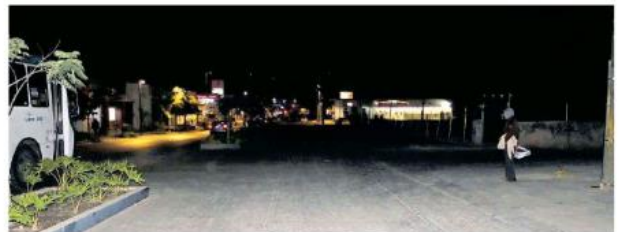
Las personas se sienten inseguras de transitar por la vía. AURELIO MAGAÑA.

los flujos de patrullaje y de acciones. Revisamos el proceso del socavón y nos informa SCT que también en las fechas del 14 de febrero se podrá retirar el confinamiento de esta zona, lo que nos va a permitir ya todos los servicios, tanto iluminación, limpieza, seguridad como prioridad, poderlo ligar ya a la totalidad de la obra del Paseo Fray Antonio Alcalde”.