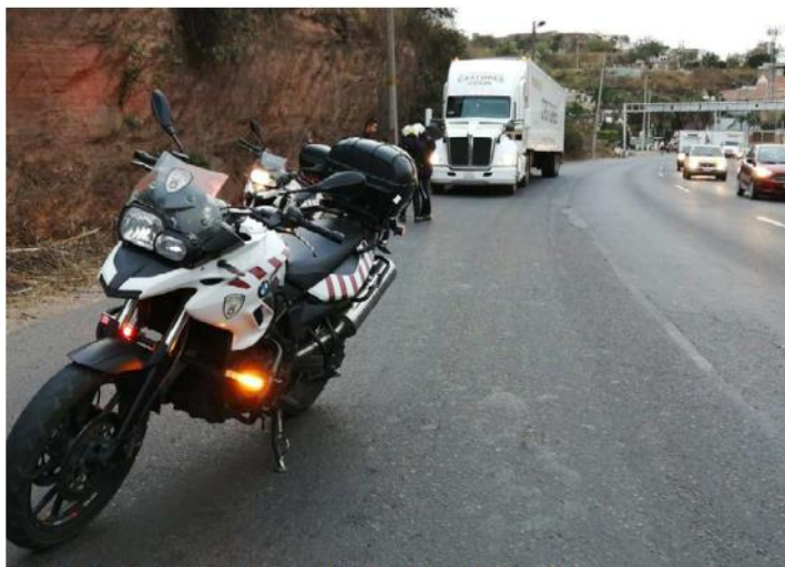
Un tráiler fue retirado de circulación y enviado al depósito vehicular.