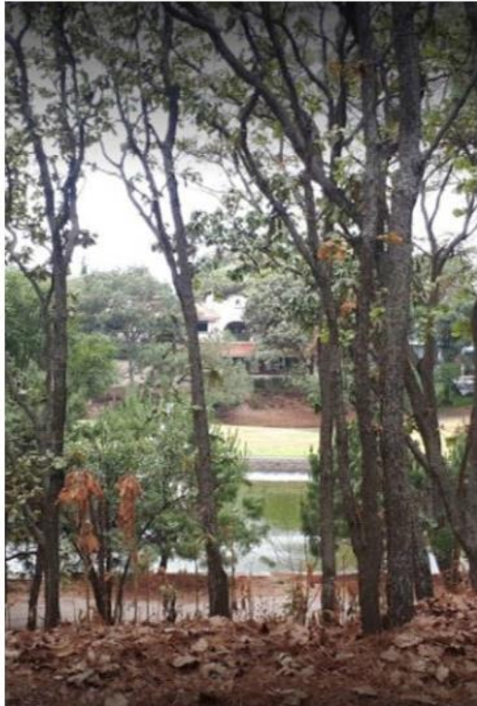
Aseguran que hay un estudio desde 2019. ESPECIAL

“Los funcionarios del Gobierno municipal de Tlajomulco de Zúñiga han intentado culpar a la empresa y el desarrollo El Cielo Country Club para distraer la atención y ocultar la responsabilidad que absolutamente les corresponde, toda vez que los cauces federales en esas zonas han sido gravemente alterados con