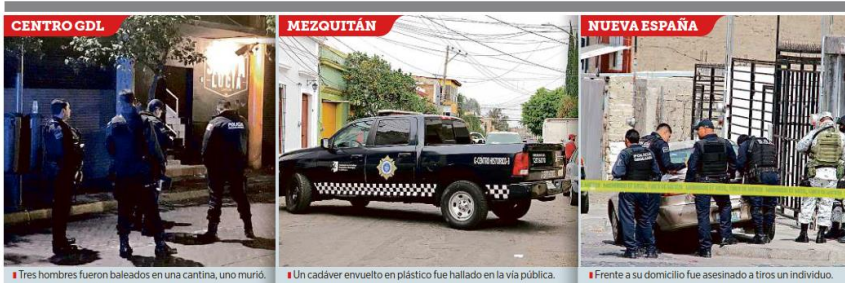
■ Tres hombres fueron baleados en una cantina, uno murió. ■ Un cadáver envuelto en plástico fue hallado en la vía pública. ■ Frente a su domicilio fue asesinado a tiros un individuo.