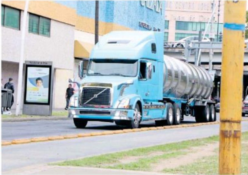
Comienza la aplicación de multas al transporte de carga. AGAPITO ESPINOZA.