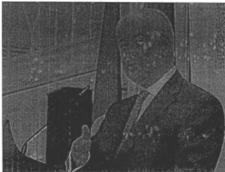
JALISCO. El exgobernador encabeza el grupo de apoyo a Cordero, en el tema de los desvíos de fondos dejó en claro que se trata de personas, no del PAN.

"Tampoco el Partido Acción Nacional (PAN) puede ser rehén de temas políticos cuando se le antoje a la autoridad en turno, ya hace varios meses que dieron esos datos y no se ha visto ninguna otra situación. El Partido Acción Nacional no será rehén de nadie, ni de un partido político ni de un gobierno. Si el actual gobierno tiene datos para poder fincar responsabilidades frente alguna autoridad anterior, que lo haga y que lo haga de forma clara y precisa, porque tampoco se vale que una vez que se accionan los temas electorales vuelvan a sacar el discurso y sigan sin hacer su tarea", expuso el economista panista.