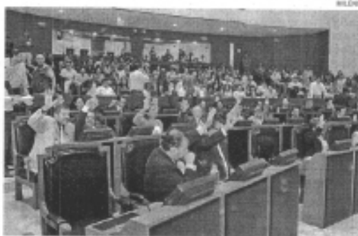
A partir de ayer se realizan talleres sobre planeación en el Congreso