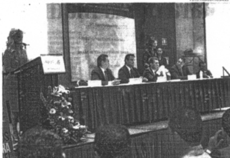
» DIERON a conocer las Reglas de Operación de Programas Sociales del Ramo 33 y del FAIS.

Sandoval Díaz subrayó que se trata de una renovada política social de amplio impacto mediante la conjun-