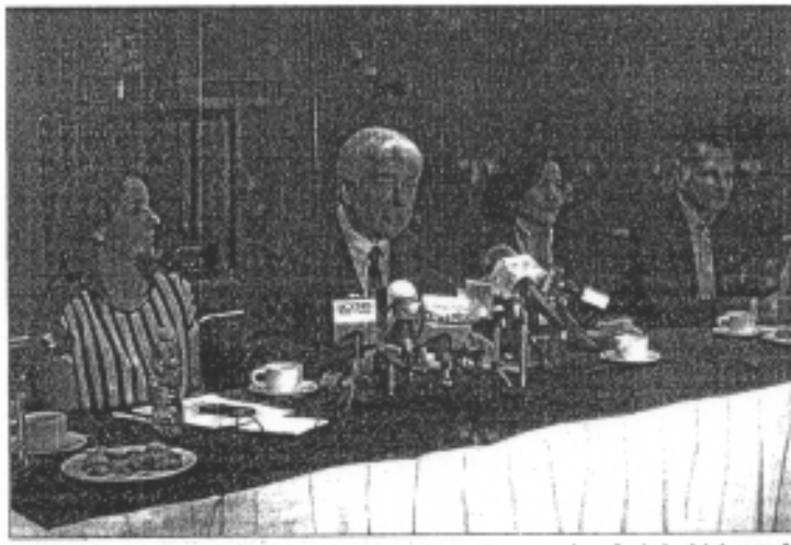
El exgobernador jalisciense ofreció una rueda de prensa para presentarse como el coordinador local de la campaña de Ernesto Cordero a la dirigencia nacional del blanqueuzul.

"Estos tres años de trabajo que le conocemos al presidente Madero, como le gusta que le llamen, al frente del CEN del PAN hemos