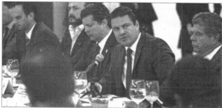
» EL GOBERNADOR de Jalisco estuvo con los Integrantes del Consejo de Cámaras Industriales.