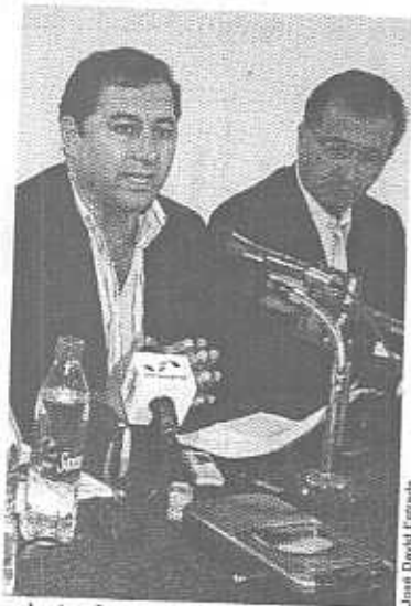
► Javier Guizar Macías, líder del PRI, dio al Gobierno un mes de plazo para integrar las mesas de trabajo.

En año no electoral y gracias a la reforma aprobada por sus diputados, el PRI pasará de administrar 7.5 a 45 millones de pesos al año.