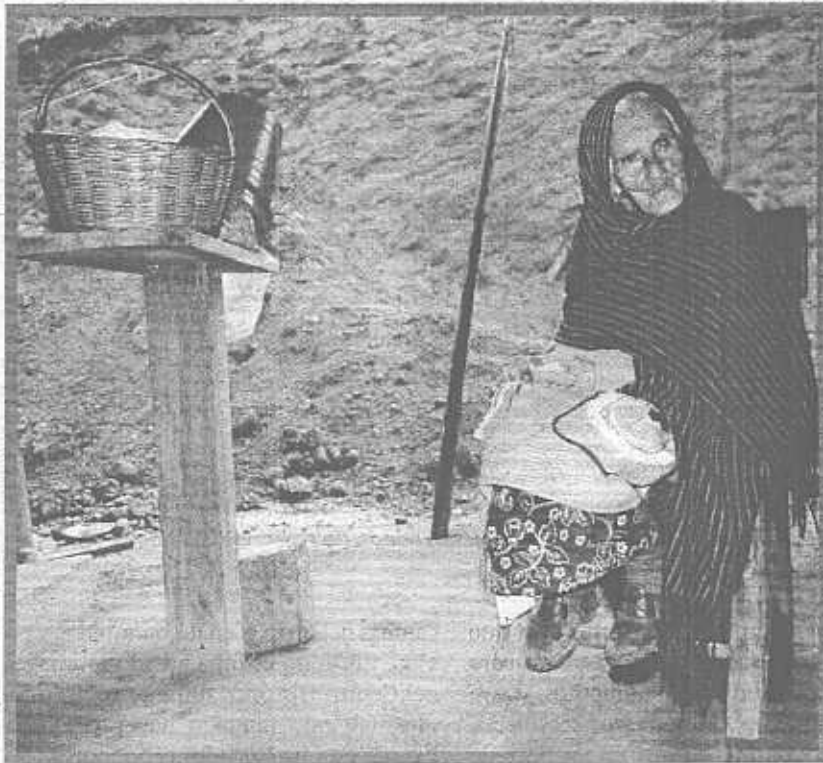
MEJORA. Se brinda ayuda a las familias de escasos recursos económicos.

C on la implementación de programas federales y estatales, la ayuda de dos marcas comerciales de cemento y la Secretaría de Desarrollo Humano del estado de Jalisco se activa el programa «Mejora tu casa» en la región.