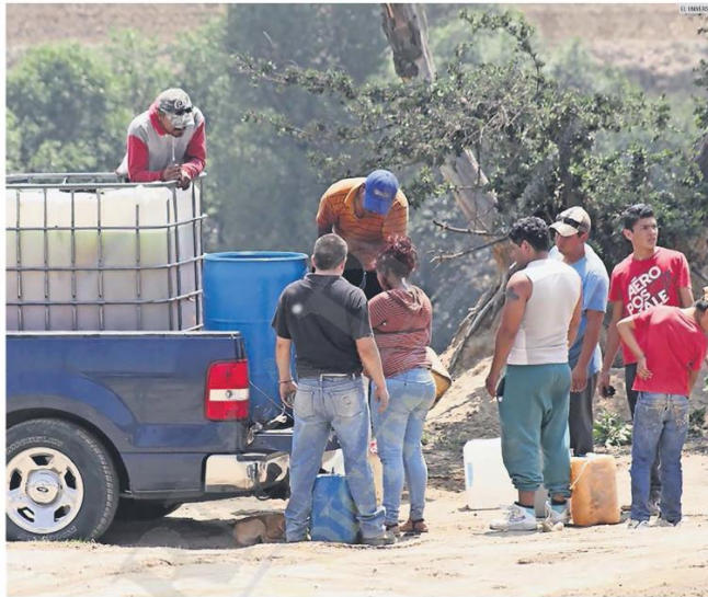
REFORMAS. Entre los delitos que se agregaron al catálogo de prisión preventiva figura el robo de hidrocarburos.

La reducción en la incidencia se logrará, en cambio, con más capacitación entre policías, los Ministerios Públicos y jueces. "Y que se den castigos por un trabajo deficiente".