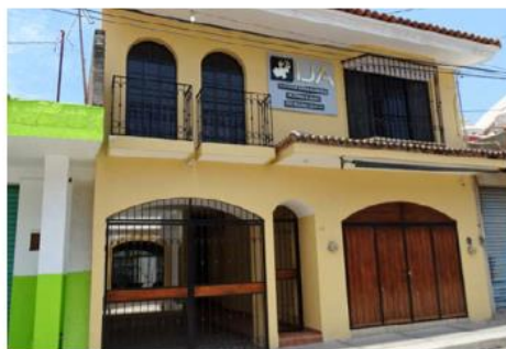
Estrenan instalaciones. ESPECIAL

"La justicia debe estar en la canasta básica de los jaliscienses, y por ello se debe acercar a la pobla-