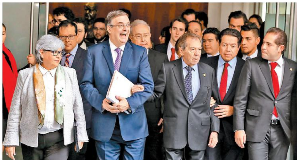
Marcelo Ebrard y Porfirio Muñoz Ledo fumaron la pipa de la paz tras la comparecencia del canciller en el Senado.