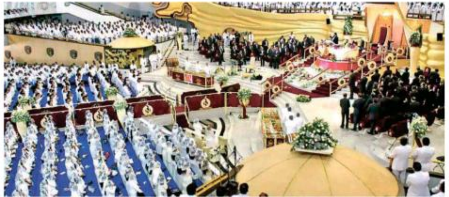
Aumentó la vigilancia policial al oriente de la ciudad.

Esto, luego de la presencia de lonas, pintas en fachadas y actitudes discriminatorias hacia personas que profesan dicha religión y hacia sus inmuebles, tras los señalamientos