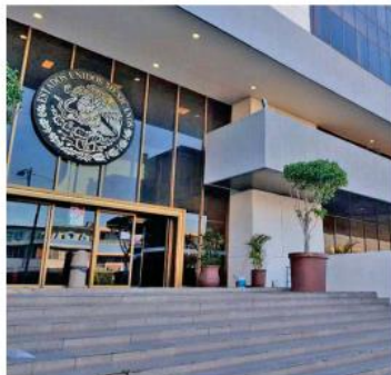
Cuatro personas fueron sentenciadas por los delitos de contra la salud y posesión ilícita de

Por tal motivo, las autoridades estatales procedieron a realizarles una inspección, y aseguraron 51 bidones con mil 20 litros de hidrocarburo, seis costales con 48 kilos 520 gramos de marihuana, 29 envoltorios con cuatro gramos 800 miligramos de cocaína y 120 envoltorios con 20 gramos 300 miligramos de metanfetamina, según informó la FGR.