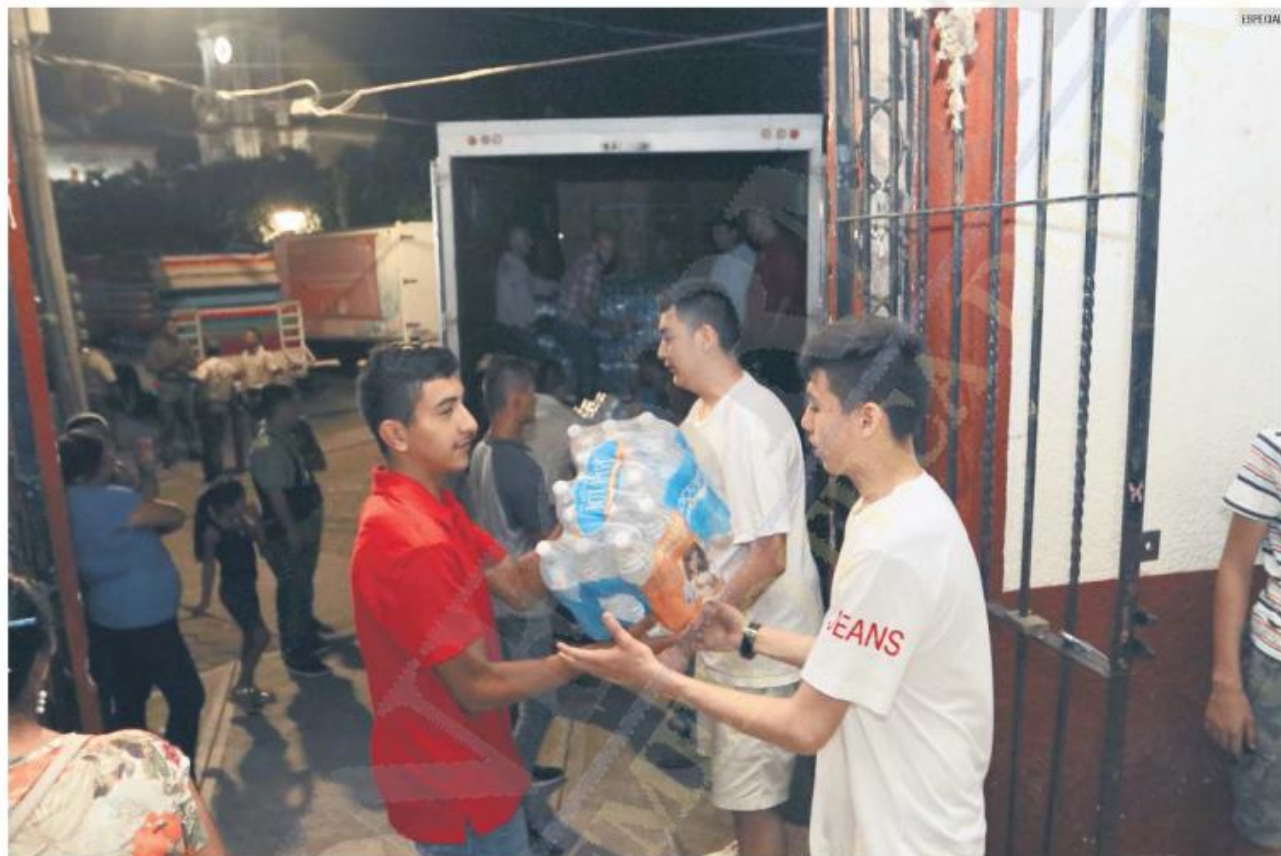
VÍVERES. La ayuda para los residentes afectados ya comenzó a llegar.

Tras el reporte de 148 viviendas con daños por la inundación registrada en el municipio de San Gabriel, el secretario general de Gobierno, Enrique Ibarra Pedroza, explicó que sigue el análisis de las obras necesarias para la rehabilitación de infraestructura clave como los puentes que comunican al