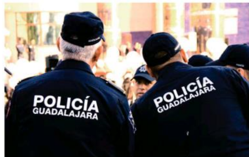
Los gendarmes habrían dejado escapar a un conductor que viajaba en un coche con placas reporte de robo.

El juez los vinculó a proceso y dictó una medida diversa el de firmar cada quince días durante seis meses y no salir del estado de Jalisco además ordenó como plazo de la investigación complementaria tres meses.