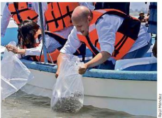
■ El Gobernador Alfaro acudió a sembrar crías de tilapia y carpa, pero omitió inaugurar la obra del malecón de Chapala.

a una mujer de la tercera edad que estaba dentro, a quien le robaron dinero y objetos de valor. "Es un modo de operar que ya vienen manejando con distintos uniformes, incluso con algunos uniformes de telefonía o de Internet", explicó Castellanos. El comisario recomendó que si no solicitó ningún servicio, llame al 1201-6070 de la Policía de Guadalajara, donde se comunicarán a las compañías correspondientes para confirmar que de verdad sean empleados.