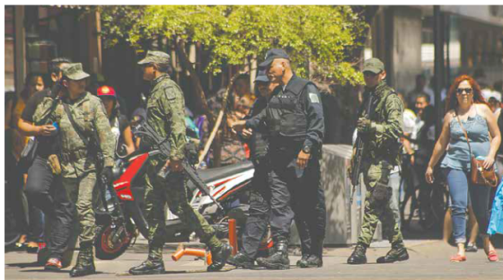
MÁS. En la entidad ya hay mil 400 elementos federales, a los cuales se sumarán 2 mil 200 a partir de julio.

La institución indicó que había 10 cuerpos, mas no detalló si una de las bolsas estaba vacía o alguno de los cuerpos estaba repartido en dos. Los peritos forenses lograron determinar que siete de las víctimas eran hombres, de las otras tres todavía no se había clarificado el sexo hasta ayer. Juan Levorio