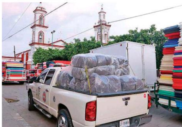
Poco a poco llegan los enseres y víveres al municipio.

La Secretaría de Educación del Gobierno de Jalisco (SE), informa que este lu-