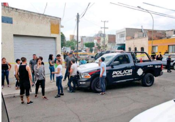
Los hechos en la calle Violeta al cruce de 5 de Mayo, en la Colonia San Carlos. AURELIO MAGANA

El ataque ocurrió la tarde de este viernes, en el negocio que se encuentra ubicada en la calle Violeta al cruce de 5 de Mayo, en la citada zona vecinal. Los agresores al ver a su víctima dentro del negocio porque había ido a cortarse el pelo, la obligaron a meterse al baño y una vez dentro le dispararon en la cabeza.