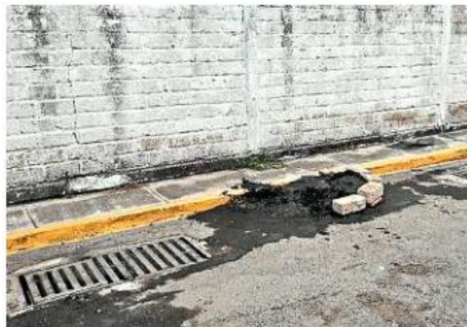
La alcantarilla que estaba sellada y no podía desazolverse fue limpiada por personal del Siapa el 8 de junio.

El hombre de 81 años teme especialmente por su esposa, pues está enferma postrada en una cama al interior de la casa con tanques de oxígeno.