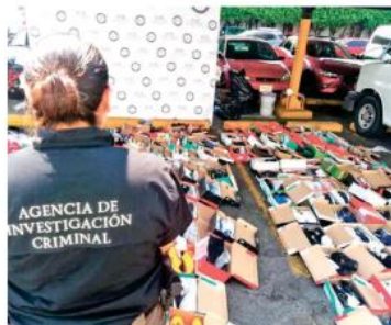
Fue en el tianguis de la colonia la Loma que se hizo el decomiso.

Dicha carpeta de investigación, se abrió después de que el apoderado legal de una marca registrada, presentó una denuncia ante el fiscal federal, en la que señalaba que en la colonia la Loma, en el municipio de Guadalajara, se instala un tianguis con diversos puestos, que comercializa artículos que ostentan falsificaciones de la marca registrada.