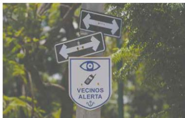
ANTE LA DELINCUENCIA. En algunas de las calles del fraccionamiento hay símbolos de alerta; los robos aquejan a la zona.

“No habrá en mi administración una sola obra o desarrollo inmobiliario que violente la ley (...) Sobre el cambio de sede del