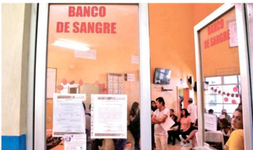
Venden la donación de sangre entre 500 y mil pesos.

de Salud (OMS) en los lugares donde hay donación forzada de sangre se forma un mercado negro: "Al hospital que ustedes vayan afuera hay gente que está vendiendo la sangre. Usted tiene su paciente aquí, necesita sangre, sale y pregunta oye me podría apoyar donando sangre, van a decir que sí, pero es tanto (beneficio económico) y hay grupos de gente en cualquiera que ustedes me digan, quien diga que no, está mintiendo", sostuvo la titular del CETS.