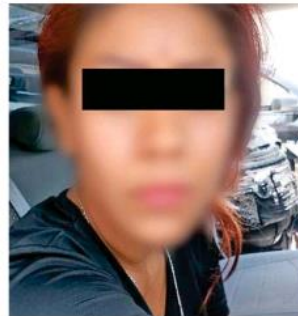
Una mujer participó en el asalto.

tes y grasas, pero que cuando se encontraba laborando, la pareja lo sorprendió y le puso la pistola en la cabeza para obligarlo a entregarles el dinero que portaba y su teléfono, lo cual hizo.