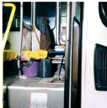
El infortunado se reporta en estado regular de salud.

Personas que escucharon los disparos y algunos de los pasajeros, dieron aviso a paramédicos, los cuales llegaron y encontraron solamente al chofer lesionado por una bala en la pierna izquierda, por lo cual fue trasladado.