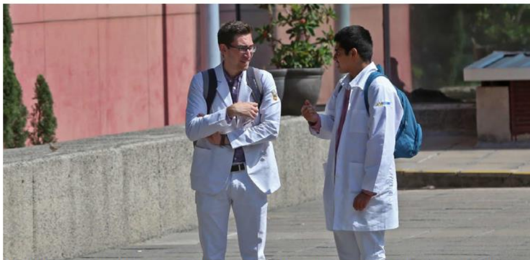
La medida impactará a los pueblos, donde no cuentan con personal médico por los graves problemas de inseguridad. F.CARRANZA

Presupuesto. Por su parte, el rector de la UdeG, Ricardo Villanueva, lamentó la disminución de mil 200 mdp que la federación hizo a esta casa de estudios