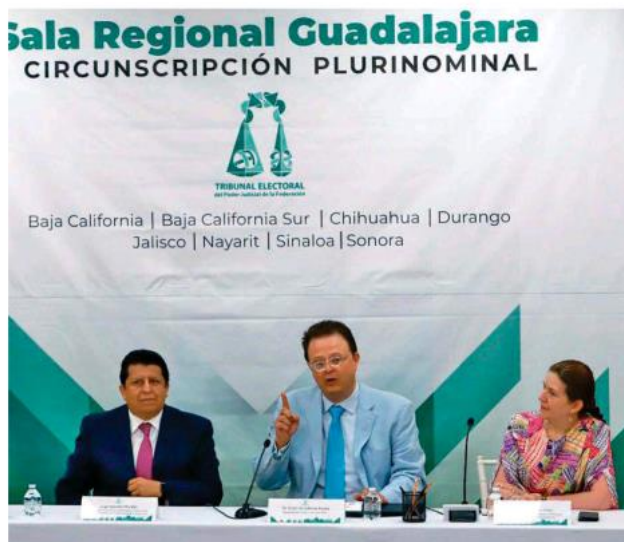
Felipe de la Mata Pizaña, magistrado.

En conferencia que impartió el magistrado en la Sala Regional Guadalajara, la Circunscripción Plurinominal del TEPEF, sobre la propaganda electoral y el interés superior de la niñez, mencionó "tenemos que reflexionar si la línea de jurisprudencia que ha establecido el tribunal respecto de algunas restricciones que se han establecido a la aparición de menores en propaganda electoral es razonable y por lo