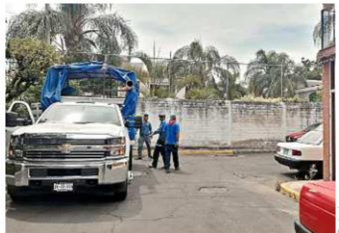
Personal del Siapa rehabilitó el sitio en la Colonia La Vigusa para evitar que vuelva a inundarse este temporal.