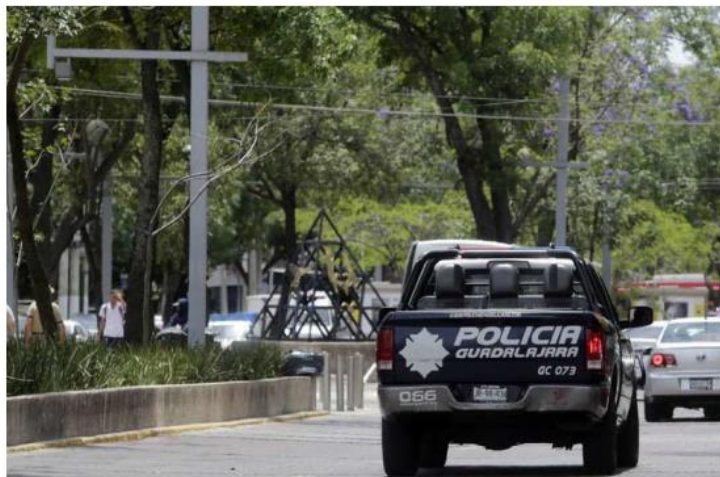
Los uniformados estaban adscritos a la comisaría tapatía. ESPECIAL

Ese día, por medio del sistema de monitoreo de cámaras de videovigilancia "El escudo Urbano C5" se detectó un vehículo de la marca Kia tipo Sportage,