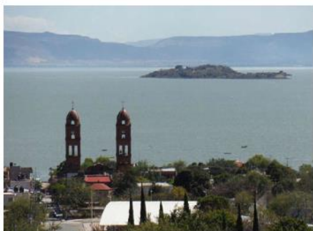
Se dará fomento acuícola y pesquero. MILENIO