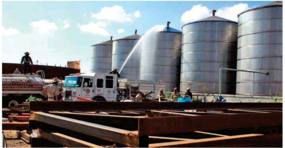
Elementos de Protección Civil y Zapopan llegaron para apagar las llamas.

Se presume que el incendio ocurrió por una falla en un motor del área de tanques de almacenamiento.