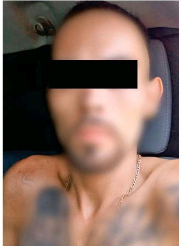
Ambos detenidos portaban una pistola de plástico.