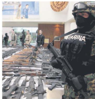
PROTECCIÓN. Organizaciones exigen frenar el tráfico de armas desde el Estado Unidos.