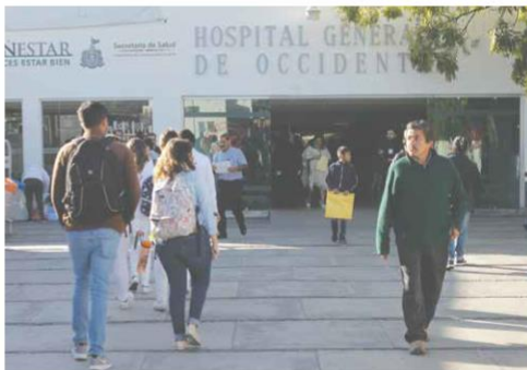
EN LA ILEGALIDAD. El CETS ha detectado a grupos de personas que venden su sangre a las afueras de los hospitales.

● De junio de 2018 a junio de este año, en Jalisco se realizaron