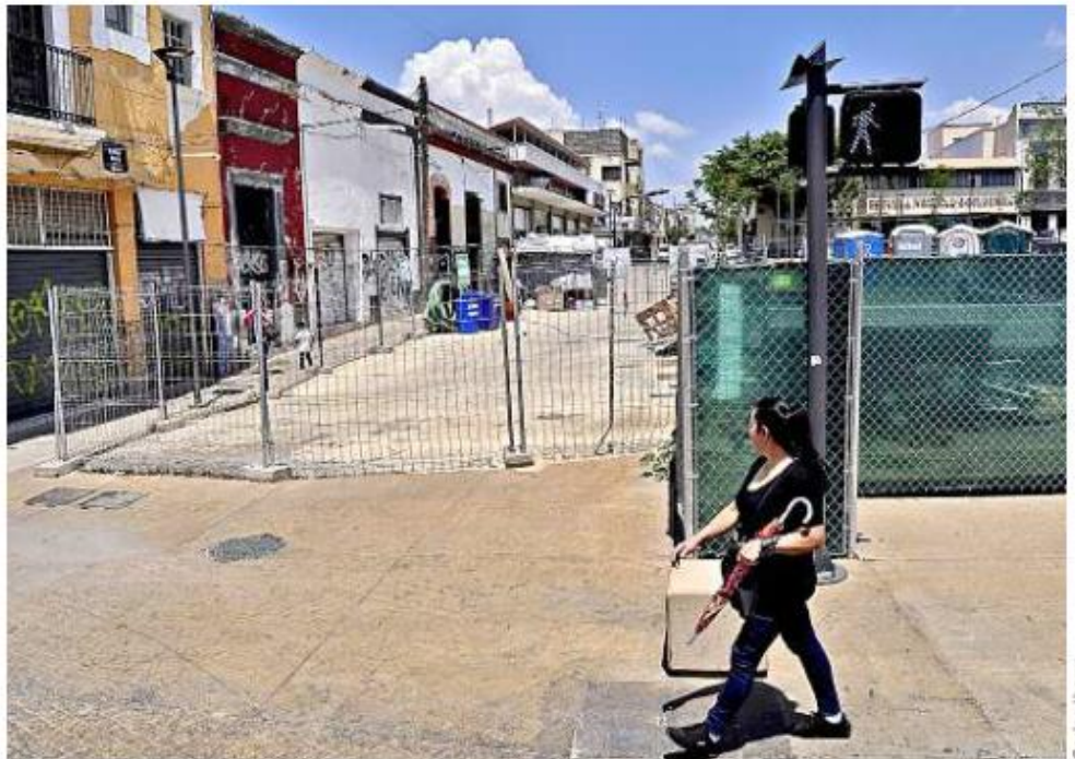
Entre las vialidades que siguen cerradas figuran Juan Álvarez y Manuel Acuña.

“Ya no es tanto, pero todavía tenemos que estar limpiando cada rato porque se hace mucho polvo y se ve que todavía les falta”, desta-