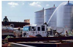
■ Los bomberos zapopanenses arrojan agua a los contenedores para bajar la temperatura y reducir la presión.

"A nuestra llegada ya estaba pasando por servicios