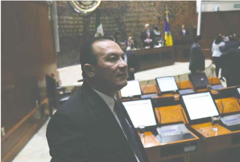
MAL ACTUAR. El legislador señala que la Fiscalía ha hecho un escándalo en Unión de San Antonio.