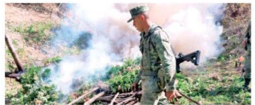
Los hechos en la zona serrana del municipio de Mascota.

PARES DE tenis fueron los que se decomisaron en este tianguis.