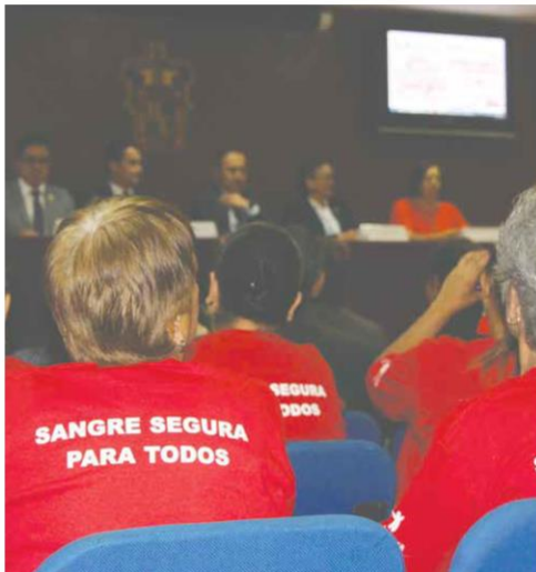
LUGAR. La entrega de reconocimientos se realizó en el Hospital Civil de Guadalajara Fray Antonio Alcalde.

Ante la falta de donadores voluntarios, se ha detectado que afuera de algunos centros médicos de la Zona Metropolitana de Guadalajara (ZMG) existen personas que ofertan su sangre por una remuneración económica.