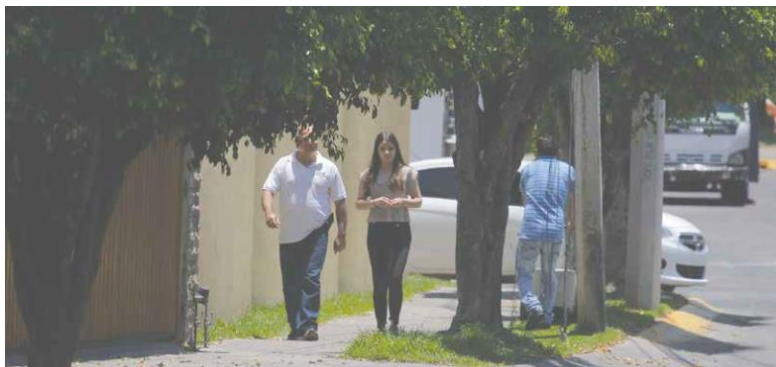
He sabido que la gente que vive por aquí se queja (de una construcción en Manuel Acuña) porque les afecta su patrimonio" RUBÉN TRABAJADOR DE UN BAR DE LA ZONA

SEDE. A la colonia se mudará el nuevo consulado de Estados Unidos; vecinos temen que esto genere embotellamientos y ambulanteaje.