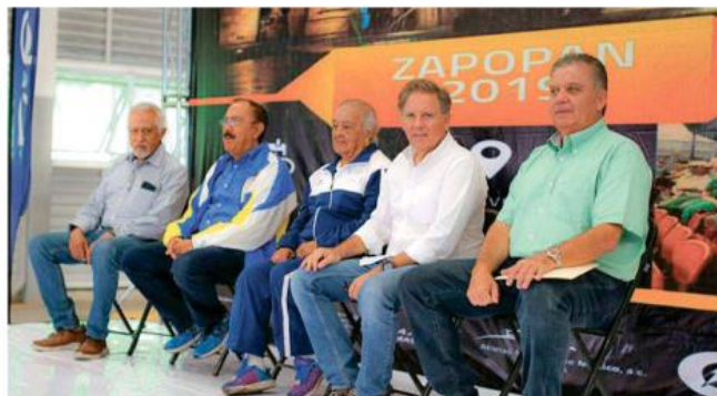
Se prevé la participación de al menos 16 atletas extranjeros en calidad de invitados. COMUDE ZAPOPAN

de Zapopan, CODE Jalisco, Servicios Médicos Municipales de Zapopan, Comisaría de Zapopan, DIF Zapopan, Secretaría de Movilidad, entre otras.