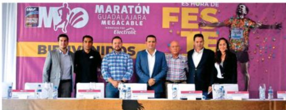
En rueda de prensa dieron a conocer los detalles.