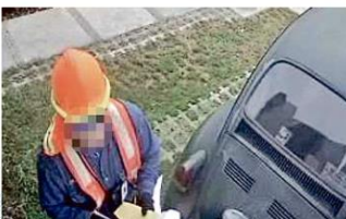
■ Cámaras de seguridad de la zona captaron a los presuntos ladrones, con uniforme de la CFE.