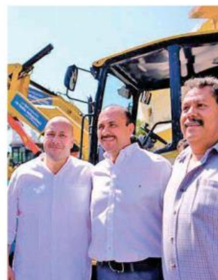
El gobernador Enrique Alfaro entregó la maquinaria.

En Chapala arrancó el proyecto piloto de repoblamiento con siembra de tilapia