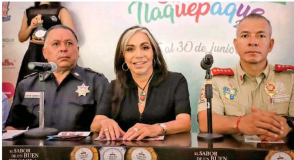
La Feria de San Pedro Tlaquepaque se realizará del 15 al 30 de junio.