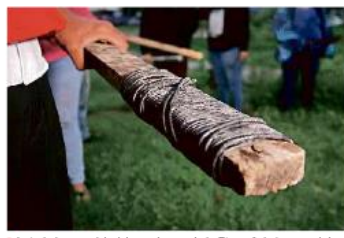
Ante la inseguridad, los colonos de la Etapa 1 de Lomas del Mirador decidieron hacer rondines por su cuenta.

Ante esto, han desarrollado su protocolo de seguridad: se avisan en el grupo "ALERTAS" y entre varios encaran a los intrusos, les exigen que demuestren que son los dueños o que están rentando el inmueble y si no lo comprueban, los corren.