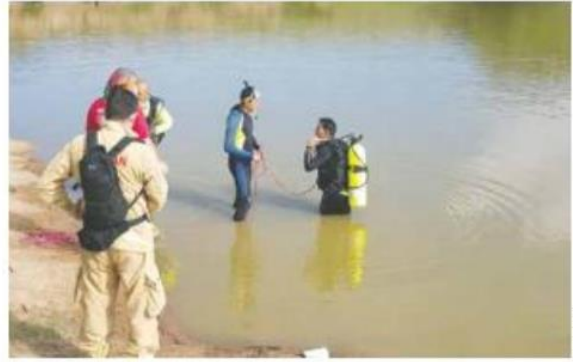
LABORES. Uno de los cadáveres fue hallado el sábado y otro el domingo.

“Los perímetros de búsqueda se realizaron en zigzag en tiempos operacionales de 20 minutos. Se tardó un aproximado de 31 minutos en la localización del cuerpo. Esta zona hidrográfica (tiene) 4 metros de profun-