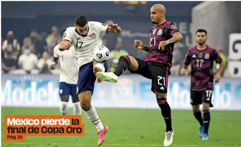
México pierde la final de Copa Oro Pág. 10

Trámite obligatorio. La Secretaría de Medio Ambiente y Desarrollo Territorial aprobó el inicio del Programa de Verificación Vehicular Responsable a partir de este domingo. Pág. 02