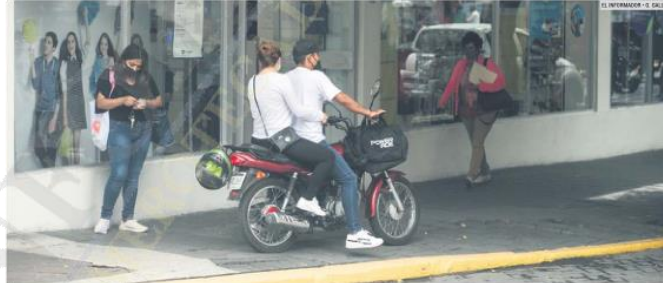
BANQUETAS. Los conductores utilizan las vías destinadas para los peatones.