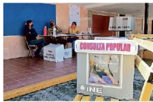
Las casillas lucieron semivacías a lo largo del día, como esta del Fraccionamiento Revolución, en Tlaquepaque.