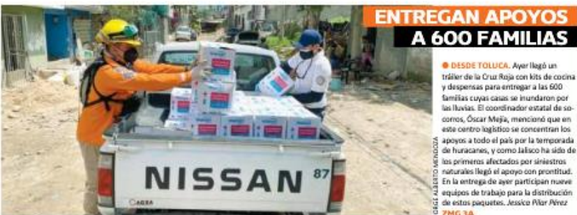
LOGO ALBERTO MENDOZA