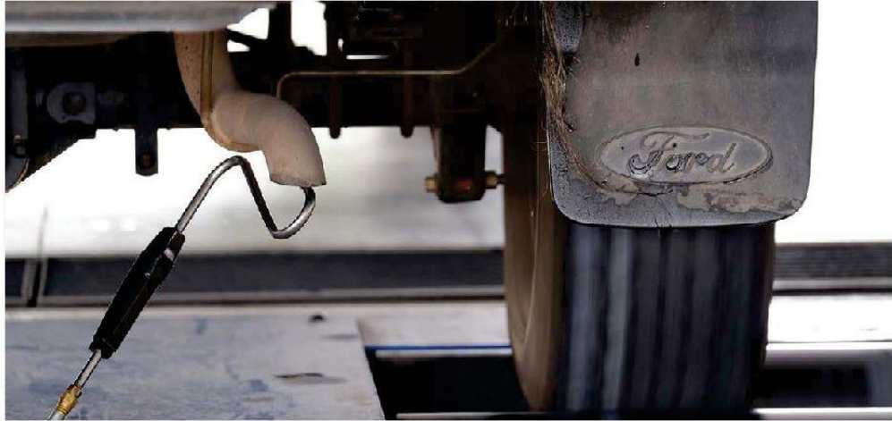
Actualmente se cuenta con 12 líneas para este servicio. ESPECIAL

Los ciudadanos deberán realizar una cita para la Verificación Responsable, deberán ingresar al sitio web verificacion-responsable.jalisco.gob.mx con su tarjeta de circulación a la mano; seleccionar el Centro de Verificación Responsable (CVR)