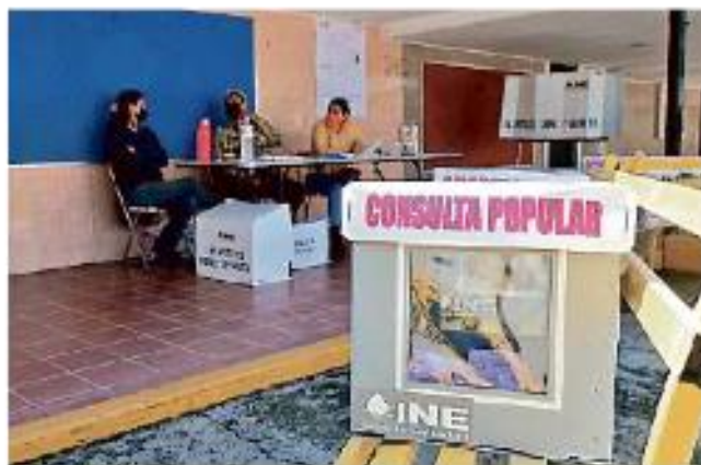
Las casillas lucieron semivacías a lo largo del día, como esta del Fraccionamiento Revolución, en Tlaquepaque.