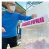
LOGO ALBERTO MENDOZA