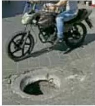
Entre 2016 y 2020 se declararon procedentes 134 reclamaciones.

Las afectaciones fueron provocadas por desperfectos en alcantarillas, fugas de agua, inundaciones y socavones