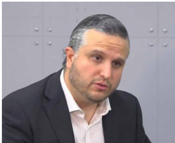
Carlos Alonso Reynoso, epidemiólogo y experto en salud, médico de la Universidad de Guadalajara, la variante Delta no es más mortal, pero sí es más contagiosa y al ser más contagiosa va a tener más casos y por lo tanto las defunciones en proporción a los contagios se incrementará sustancialmente.

La seriedad con la que el médico epidemiólogo expone la gravedad de la situación