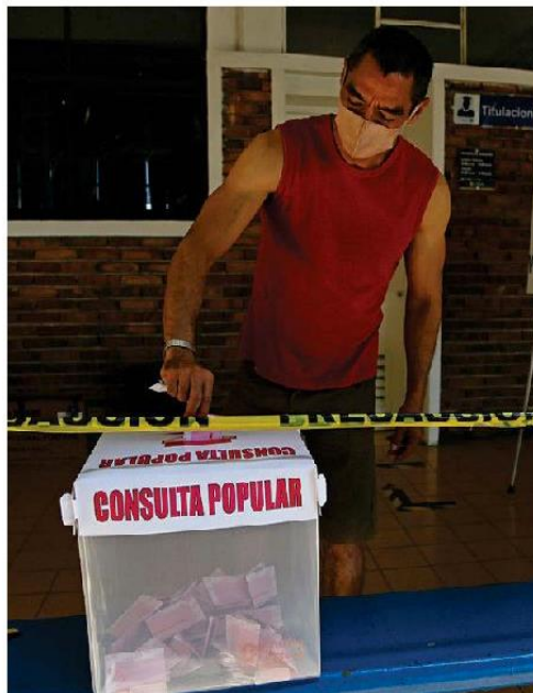
Se instalaron 3 mil 375 mesas receptoras. FERNANDO CARRANZA

tán asistiendo y que a lo mejor ya juntamos 30 votos son personas mayores, y están informados de lo que pasa en nuestro país, pero de los jóvenes nadie se ha parado a votar".