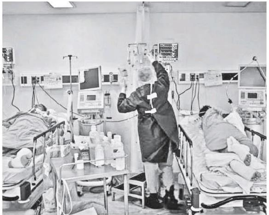
Las camas comienza a saturarse de enfermos en Puerto Vallarta.

Asimismo, se menciona que actualmente se maneja una estrategia flexible