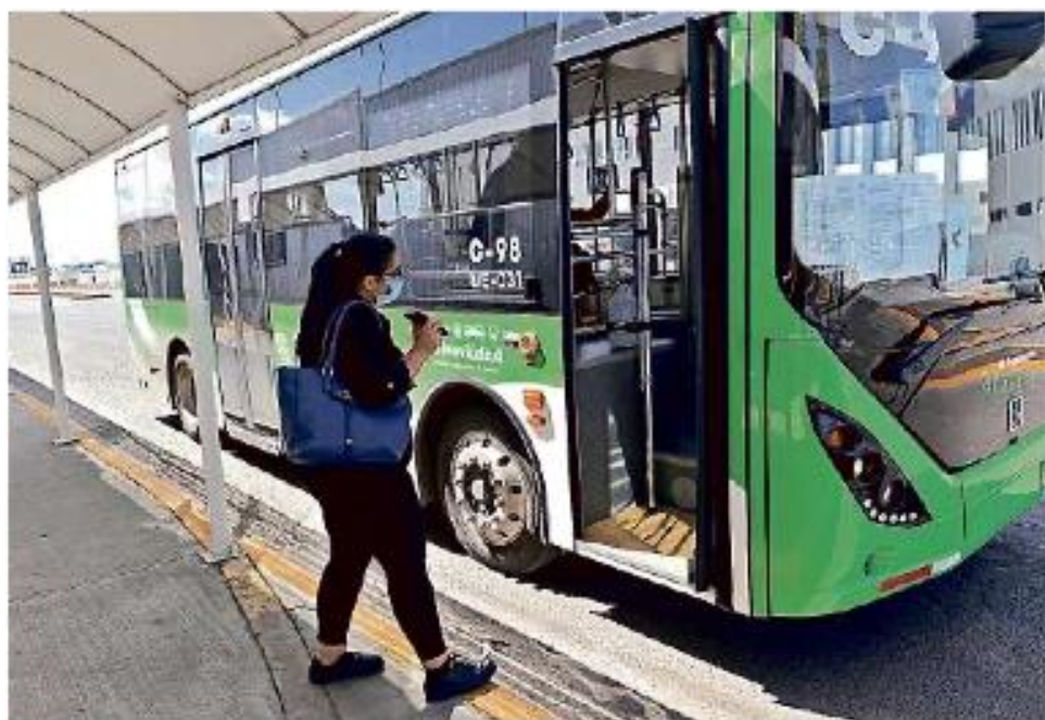
■ Camiones de la Ruta C-98 llegan a la parada a un costado del estacionamiento del Aeropuerto.

tores de las unidades aseguraron que durante las primeras horas de operación, la afluencia de pasajeros había sido baja y recordaban a algunos pasajeros que las paradas dentro de la Carretera a Chapala estaban prohibidas.