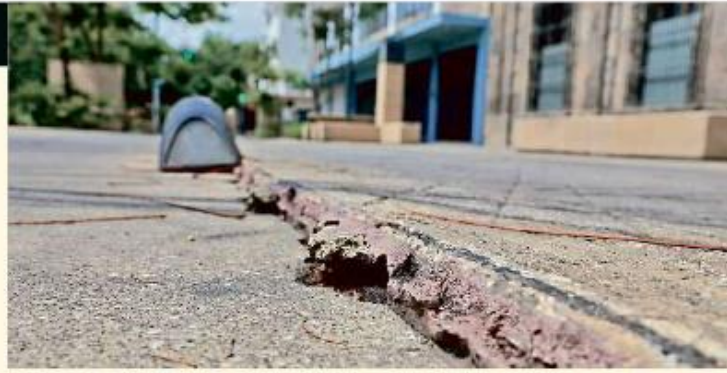
■ En Paseo Alcalde, entre Reforma y San Felipe, hay desnivel de losas.

Aunque no proporcionaron más detalles sobre la situación actual del suelo en la zona, aseguraron que mantendrán vigilancia y muestreos para revisar su comportamiento futuro.