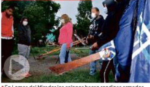
En Lomas del Mirador los colonos hacen rondines armados con lo que pueden para vigilar sus calles.