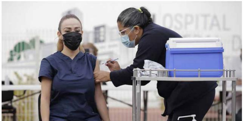
El comunicado de la Secretaría de Salud de Jalisco destaca que los pacientes infectados con alguna de estas variantes, el 49 por ciento ha requerido manejo hospitalario, y de los 57 pacientes infectados con VOC, solo el 26 por ciento requirió manejo hospitalario.

litlán, Chiquilistlán, Tonalá, Puerto Vallarta y Tala.