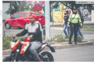
FALTAS. Transita sin medidas de seguridad frente a un agente vial.