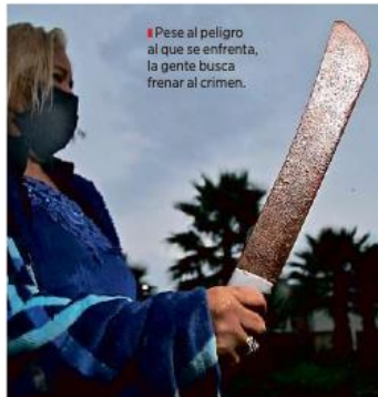
Pese al peligro al que se enfrenta, la gente busca frenar al crimen.

Caminan tranquilamente en toda la Etapa 1 y a su paso se suman los vecinos para tomar el camión. Sin embargo, el punto recurrente es alrededor del parque, porque tiene salidas a la Etapa 2 y la Etapa 4, que son las más conflictivas y donde, cuentan, los criminales atracan a los transeúntes