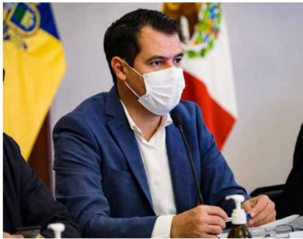
Diego Monraz Villaseñor, Secretario de Transporte del Estado entrevistado en Tula de Jalisco.

“Estamos en los últimos detalles con el Grupo Aeroportuario del Pacífico y con la Secretaría de Comunicaciones y Transportes, es inédito, toma como una novedad que una ruta de transporte de Guadalajara, entre al aeropuerto y tenga instalaciones dentro del mismo. Es un servicio de SITEUR, es nuestro, no solamente son unidades de trans-