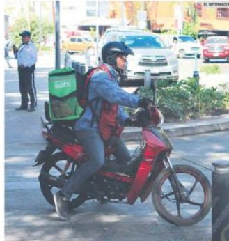
SERVICIO. Debido al incremento de repartidores y las fallas en la prestación del servicio, éstos ya pueden acceder a una certificación en el Estado.

En medio del aumento de motos que circulan en la Entidad, no se ha visto una mejora en materia de cultura y seguridad vial. Los conductores incumplen el Reglamento de la Ley de Movilidad y Transporte.