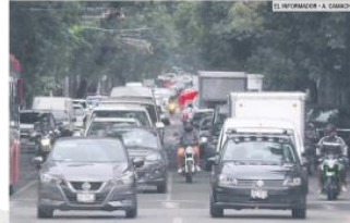
INVADEN. Circulan entre los autos, aumentando el riesgo de sufrir accidentes.