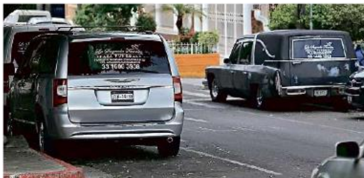
Carrozas fúnebres aguardan afuera de la Clínica 110 del IMSS, donde se atiende el Covid-19.