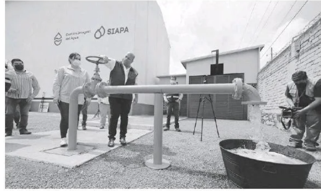
El mandatario estatal encabezó la reapertura del sistema de abasto de agua, un alivio para la ZMG.