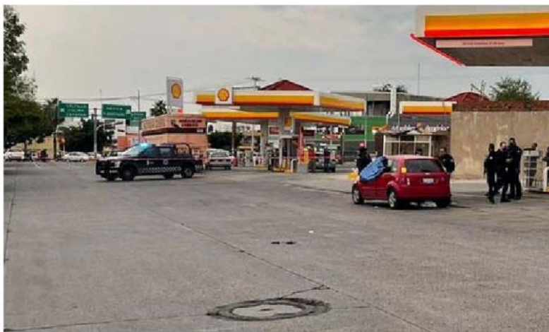
Las autoridades investigan el caso bajo el protocolo de feminicidio, ESPECIAL