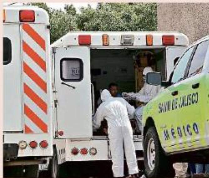
■ El trabajo de los paramédicos se ha incrementado durante las últimas semanas.

Sin embargo, desde el inicio de la pandemia, en marzo de 2020, Jalisco se ha desmarcado de las res-