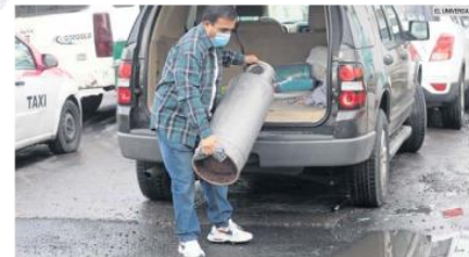
COSTOS. El Gobierno federal pretende bajar los precios del combustible.