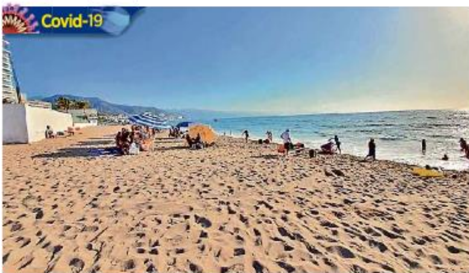
Quienes dijeron que sí vacacionarán, la mayoría lo hará en el Estado.