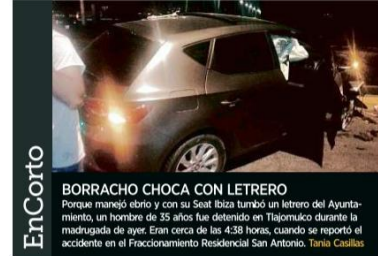
BORRACHO CHOCA CON LETRERO. Porque manejó ebrio y con su Seat Ibiza tumbó un letrero del Ayuntamiento, un hombre de 35 años fue detenido en Tlajomúco durante la madrugada de ayer. Eran cerca de las 4:38 horas, cuando se reportó el accidente en el Fraccionamiento Residencial San Antonio. Tania Casillas

sión en la pierna derecha, otra en el tobillo izquierdo, y dos más de cañera y en abdomen. No quiso describir a quienes le dispararon. De manera extraordinaria se difundió que Alexis era identificado como ladrón en la zona, aunque los vecinos negaron conocerlo. Por otro lado, cuatro hombres fueron asesinados durante la tarde del viernes y la madrugada del sábado. En Paseos del Valle dos hombres, de 34 y 25 años, fueron atacados a balazos, uno murió en el lugar y otro en un puesto de socorro. La tarde del viernes fue localizado el cadáver de un hombre envuelto en una lona en Unión de San Antonio. Y más tarde, otro hombre fue asesinado en Tabahación de los Membrillos.