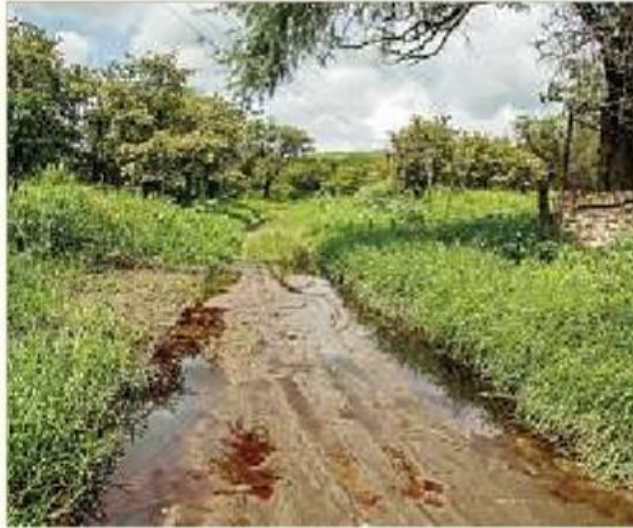
■ Fuga de lixiviados proveniente del relleno sanitario Los Laureles visto desde Tlolotlán.