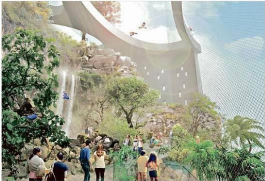
El edificio fue diseñado por el despacho noruego Snøhetta.

“Estoy confundido. La decisión me sorprendió y sigo sin entender bien cómo priorizaron, pero los diputados están planeando quitarle