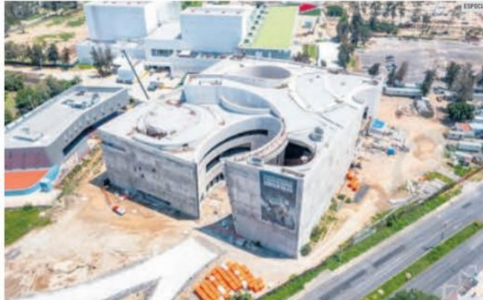
CENTRO CULTURAL UNIVERSITARIO. Uno de los proyectos más importantes de la UdeG.