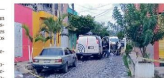
La Policía del Municipio encontró uno de los cuerpos en la banqueta y el otro tirado a media calle, donde, se presume, lo alcanzaron los proyectiles al correr.

Al encontrarse fuera de un domicilio en la Colonia Bosques de Tonalá, dos hombres fueron asesinados a balazos ayer en la tarde. Los responsables no fueron localizados. De acuerdo con las autoridades, los hechos ocurrieron alrededor de las 17:30 horas en la Calle Andador Laurel, entre Encino y Fresno. Las víctimas se hallaban en la banqueta cuando sujetos no identificados llegaron en su contra de forma directa. "Al arribó de los primeros responsables corroboraron que en el sitio se localizaron a dos masculinos lesionados por la misma causa.