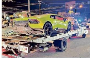
La Policía Vial informó que se retiraron los vehículos debido a la falta de documentos y de placas.

Judicial que han permitido que la gente sienta más confianza para denunciar. "Tuvo también mucho que ver que las organizaciones aquí en Vallarta, las feministas, nos las pasamos haciendo campañas en el tema de la denuncia, tanto de la denuncia por razón de genero como la de abuso sexual infantil", añadió. Este año, reveló, además, han notado que los casos de abuso sexual infantil contra niños y niñas extranjeras han empezado a incrementarse. "El porcentaje de menores extranjeros que estamos detectando comparado con el año pasado es que, por cada cinco casos, hay uno que empieza a reportarse de menores extranjeros", lamentó.