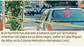
Un hombre fue atacado a balazos ayer por la mañana mientras circulaba en un Bora negro, sobre la Calle Miguel de Alba, en la Colonia Heliodoro Hernández Loza.

mas, aunque no descartaron que una de ellas viviera en la cuadra. Los fallecidos, cuya identidad no se pudo establecer, aparentaban entre 35 y 40 años. Según los vecinos, los asesinados dispararon en múltiples ocasiones, lo que causó pánico y temor por los niños que en ese momento se encontraban en la calle. De acuerdo un oficial municipal, en el lugar quedaron seis casquillos, cuatro que aparentaban ser de calibre 22 y dos más de calibre 40. Otra hablante dijo que los hechos violentos como este no son raros en las inmediaciones, pese a que a 3 kilómetros está situada la Comisaría tonalteca.