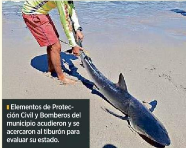
■ Elementos de Protección Civil y Bomberos del municipio acudieron y se acercaron al tiburón para evaluar su estado.

Estas maniobras generaron gran interés entre los bañistas quienes se arremolinaron a apreciar el ejemplar, aunque los ele-