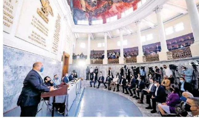
Las disposiciones son para cumplir con la Reforma Laboral federal.

"Es enorme el reto de lo que viene, estamos haciendo una especie de corte de caja, es un punto de partida para lo que yo llamaría la parte de aterrizaje de todas las acciones que tenemos que hacer, es un punto de partida porque presentamos al Congreso las dos iniciativas que nos permiten primero crear los tribunales labora-