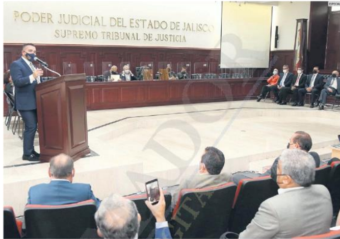
PRIVILEGIOS. Los magistrados que se jubilan promedian pensiones de 200 mil pesos mensuales, además de un bono millonario por terminar su carrera judicial.