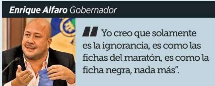
Enrique Alfaro Gobernador

“Nosotros no somos parte del Insabi y es una de las decisiones que más or-