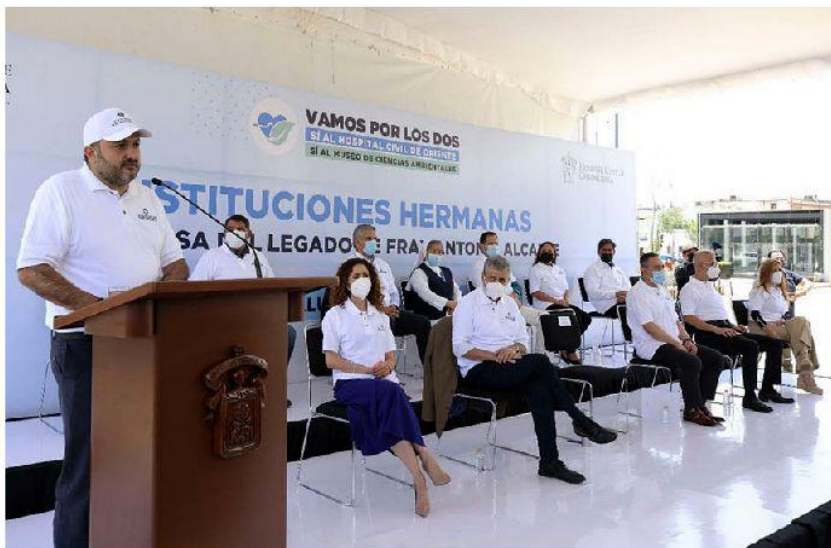
Señaló que interpondrán las acciones legales que defina el Consejo General Universitario.

“¿En verdad nos quieren hacer pensar que de más de 11 mil millones de deuda que se han adquirido en esta administración, los 140 millones del Hospital Civil sólo podían salir del presupuesto ya asignado a la Universidad? Y que por cierto es un recurso federal, que en caso que no lo ejerzan a tiempo ahí será un subejercicio. Ese dinero por moverlo está en riesgo de que se pierda y se regrese a la Federación. Poner en riesgo 140 millones de pesos que son federales, para que se regresen en lugar de dejárselos a la Universidad me sigue pareciendo enormemente preocupante”, manifestó el rector Ricardo Villanueva Lomelí.