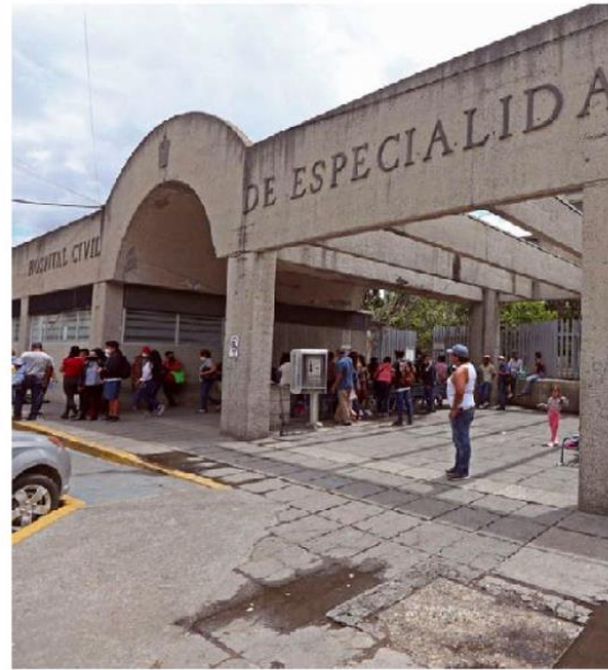
Hay alrededor de 250 internados en los HCG. FERNANDO CARRANZA

Reconoció que desde el 6 de agosto los casos se han estabilizado, sin embargo, se prevé que el 23 de agosto, por diferentes modelos, "pudiera ser el pico máximo, y a partir de ahí podemos estar bajando de tal forma que alrededor de septiembre podremos estar en condiciones aceptables, que es más o menos