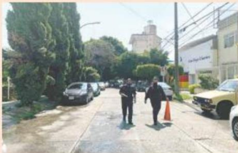
UNA MUJER, LA VÍCTIMA. Uno de los crímenes ocurrió en la colonia Circunvalación Vallarta, en Guadalajara.