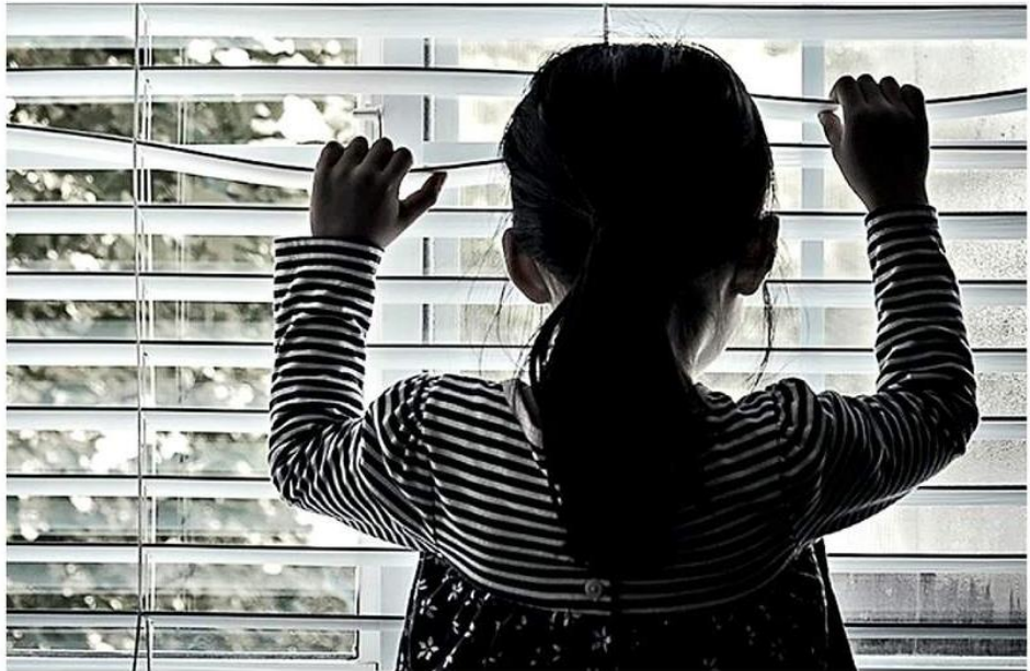
Algunos de los focos rojos son el mostrarse irritado, aburrido, inquieto o más distraído.

En términos clínicos este síndrome puede catalogarse como un trastorno adaptativo, es decir, un malestar generado a partir de la dificultad para adaptarse a una nueva