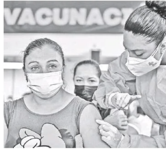
La recomendación es vacunarse contra el coronavirus.