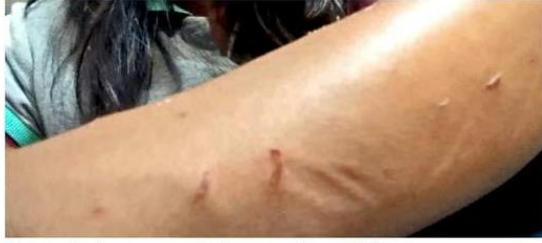
■ La mujer busca un refugio para ella y su hijo.

En los refugios a los que ha ido, sostuvo, le han negado