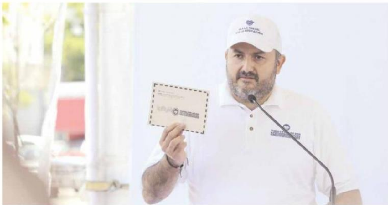
MISIVA. El rector de la UdeG fue el primero en firmar la carta con la que se hará presión social ante la reasignación.