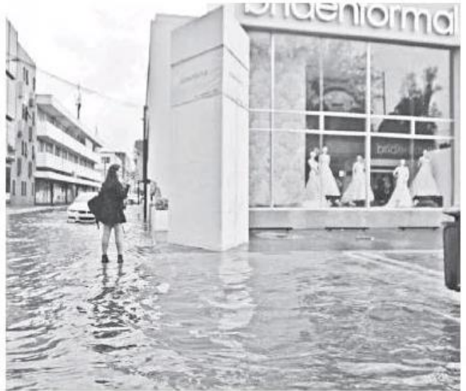
Tapatíos se vieron sorprendidos por la lluvia matutina. AURELIO MAGAÑA

portados en la vía pública fueron en Matías Romero y Tuberosa en donde el agua llegó a 60 centímetros; en Río Tuxcueca el nivel fue de 30 centímetros; otros puntos fueron en Sierra Nevada y Paricutín; Calle 4 y Calle 9 en la colonia Ferrocarril; San Diego y Calzada Independencia; Américas y Montevideo en donde el agua llegó a un metro; Colón y Lázaro Cárdenas; Lázaro Cárdenas y Rotonda; Calzada Independencia y avenida La Paz; avenida México y Bernardo de Balbuena, así como en Enrique Díaz de León y Vallarta, además de la avenida González Gallo.