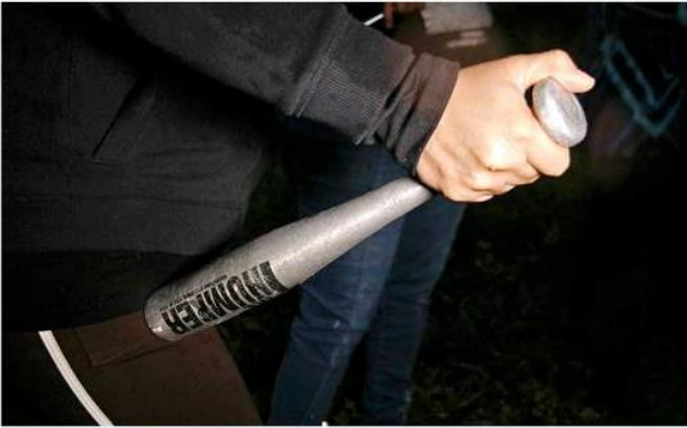
■ En Lomas del Mirador, etapa 1, los vecinos continúan con su vigilancia ciudadana.