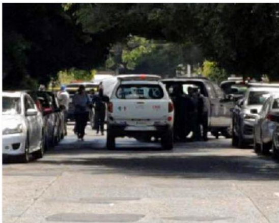
El crimen ocurrió en la colonia Circunvalación.

La víctima, de 72 años, fue atacada por un hombre en situación de calle