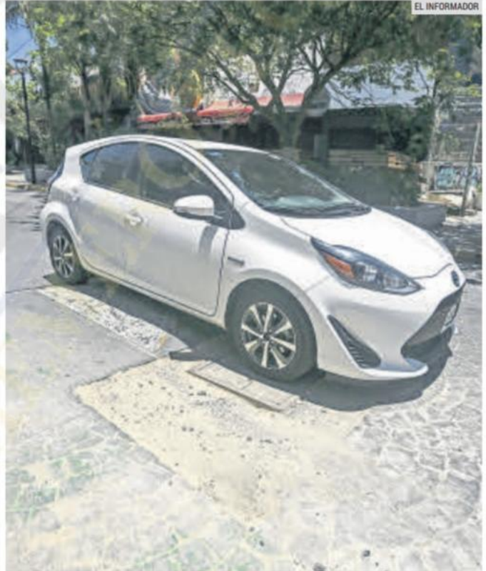
CAMBIO. Buscan ajustar la ley para que la sanción no sea tan alta.

El castigo actual de casi 18 mil pesos está vigente desde 2016, cuando se aprobó una iniciativa del entonces diputado local Enrique Aubry, que planteó la medida para penalizar a quienes colocan micas o cualquier elemento para impedir la visibilidad de las placas y evitar las fотомultas.