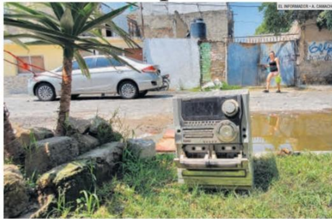
PROBLEMA. Este tipo de residuos debe tener un destino distinto.

En México existen 153 empresas dedicadas al procesamiento de residuos electrónicos y eléctricos distribuidas en 15 entidades. Del total, en Jalisco hay instaladas 38 compañías de este tipo, lo que representa 24% de la capacidad para procesar estos residuos a nivel nacional.