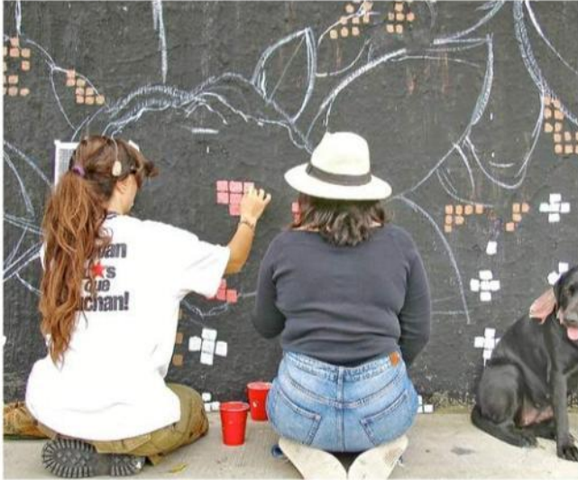
La obra es realizada en una fachada de la Avenida Federalismo.