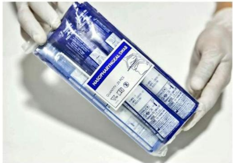
■ La SSJ aplicará pruebas de antígenos en 21 municipios.

La estrategia Radar Jalisco ha permitido identificar a las personas que tienen Covid-19 para atenderlas con oportunidad y que recuperen su salud además de evitar contagios.