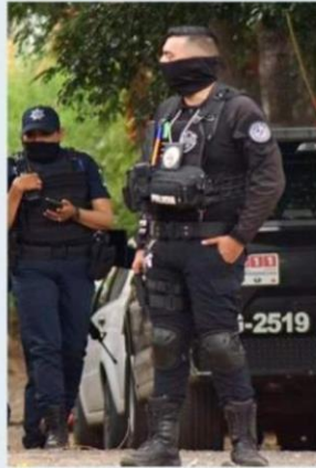
■ Policías tapatíos resguardaron la escena del crimen en Rancho Nuevo.

“En ambos casos, personal de la FE ya se encuentra recabando indicios