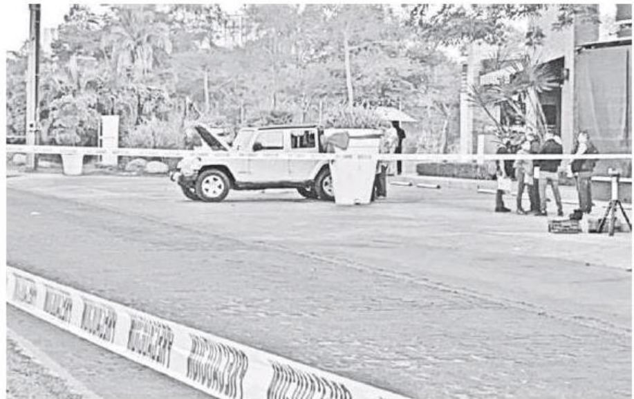
Siguen las investigaciones sobre este lamentable hecho.

8 MESES HAN pasado ya desde el asesinato del exgobernador Jorge Aristóteles Sandoval.