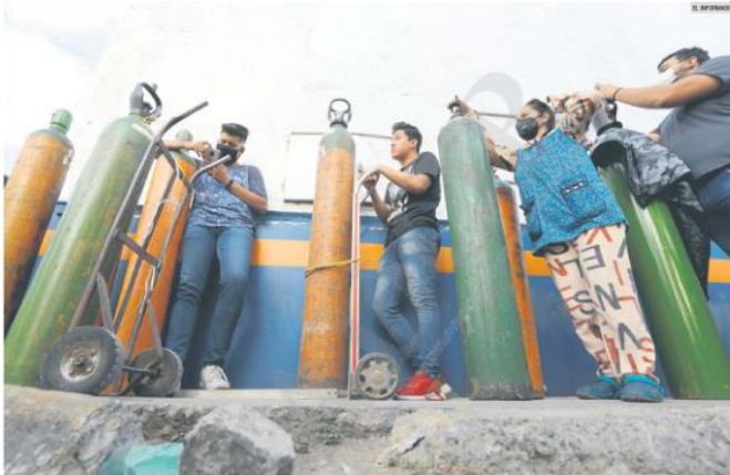
ANOMALÍAS. Las principales quejas de los consumidores son por el incremento injustificado de los precios y porque no se exhiben éstos. También porque dan menos producto del pagado.