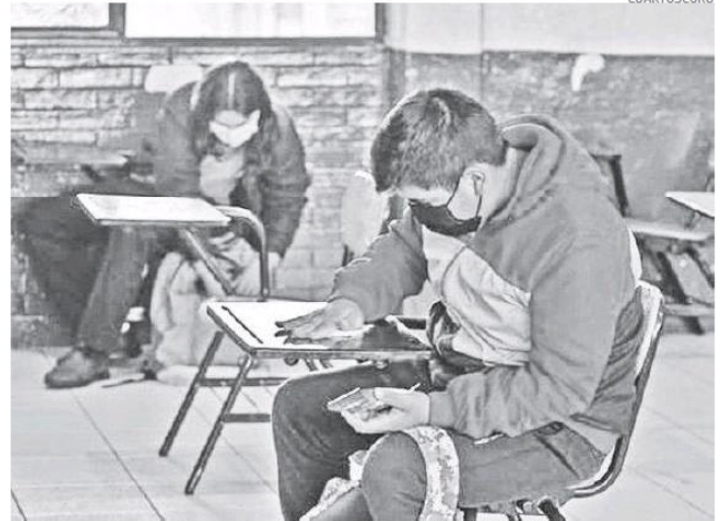
Cada vez falta menos para el regreso a clases presenciales en Jalisco.

Pero también el 38.2% señaló que no han tomado clases de manera presencial en las escuelas desde marzo del 2020 cuando se emite el decreto para el aisla-