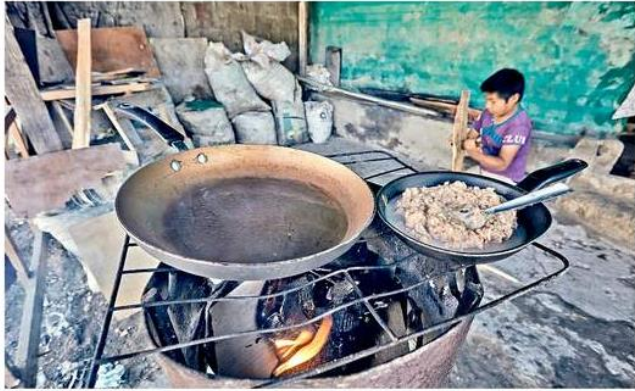
Emilio de la Cruz

Cocinar con leña puede ocasionar daños a los pulmones.