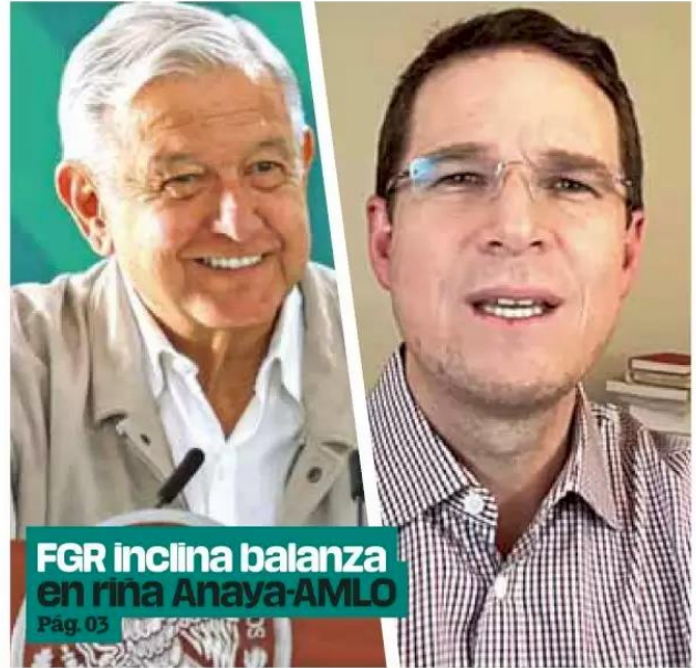
FGR inclina balanza en rina Anaya-AMLO Pág. 03

Postura. Señala que Anaya recibió 6.8 mdp de soborno para reforma energética.