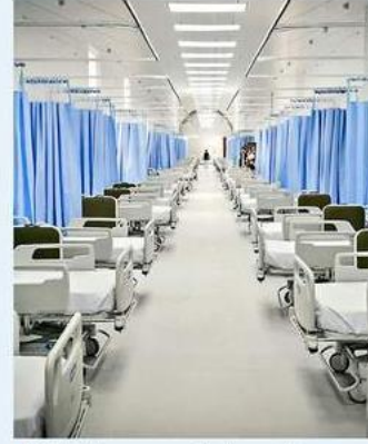
■ Esta fue una de las salas renovadas.