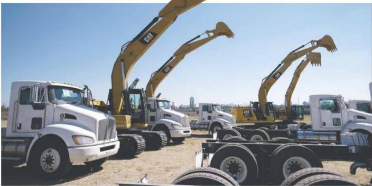
MILLONES Y MILLONES. La administración estatal pagará 3 mil 634 millones de pesos a lo largo del sexenio por el arrendamiento de maquinaria pesada.