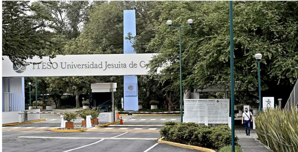
Universidades como el ITESO cuidan el aforo máximo de estudiantes en el plantel.