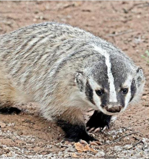
■ El tlatcoyote es una de las especies protegidas por la norma oficial mexicana, y que se habría detectado.