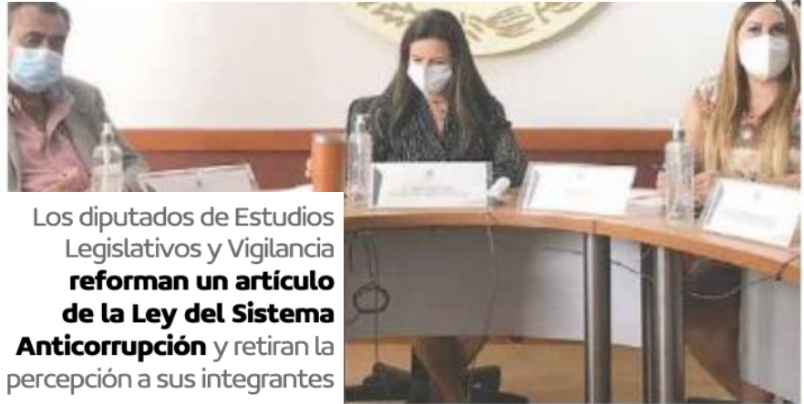
Los diputados de Estudios Legislativos y Vigilancia reforman un artículo de la Ley del Sistema Anticorrupción y retiran la percepción a sus integrantes

“(La reforma es para que) no tuvieran honorarios, para que esto no viciara ni su entendimiento ni su interés por su participación. Se tenían que dejar las bases claras, generar política pública, consensos, estos posicionamientos desde la ciudadanía, para que pudiera la ciudadanía tener un visor dentro de