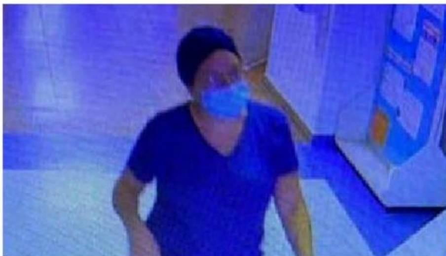
Revisan las cámaras de videovigilancia. ESPECIAL

La dependencia estatal informó que se activó el Código Rojo en el nosocomio para restringir accesos y salidas, así como revisión del perímetro, y se hizo un llamado a las autoridades de seguridad, mientras dentro se llevó a cabo la inspección por el personal de seguridad y operativo. A la vez se dio parte y entregaron los archivos del Circuito Cerrado a las autoridades para el esclarecimiento de este lamentable hecho.