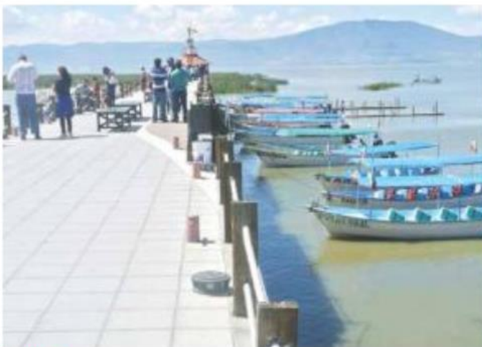
CIÉNEGA. El ataque en contra de los agentes se registró en la Zona Centro del municipio.

Ese día se toparon con tres patrullas en la intersección de la avenida Hidalgo con Aquiles Serdán, en la Zona Centro del municipio, donde los miembros del grupo criminal bajaron de las camionetas y abrieron fuego contra las patrullas usando rifles semiautomáticos calibre 223 Remington.