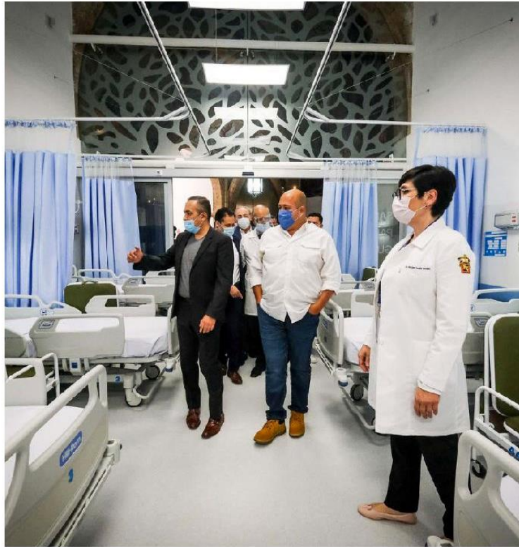
El mandatario estatal recorrió las salas que fueron intervenidas.

Puntualizó que la segunda etapa arrancará el próximo año con una inversión de 50 millones de pesos para renovar otras áreas, entre ellas las salas “Fran-