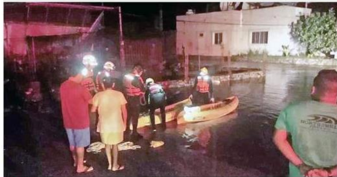
Alfaro informó que se intensificaron las labores de apoyo en los municipios costeros.