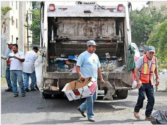
Con el nuevo dictamen, Caabsa operará la concesión de recolección de basura en Guadalajara hasta diciembre de 2039.

En el dictamen se prevé pagar 20% más por tonelada recolectada