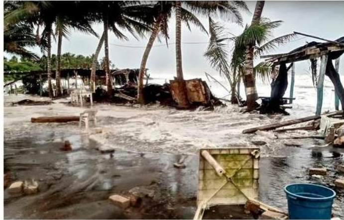
Colima fue uno de los estados con más afectaciones con inundaciones y destrozos en Playa Pascuales.

Al cierre de esta edición, también se reportaron 11 derrumbes y 55 árboles caídos, además de 16 personas albergadas en los 12 refugios habilitados por el DIF Jalisco.