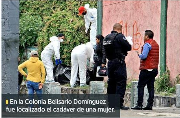
En la Colonia Belisario Domínguez fue localizado el cadáver de una mujer.