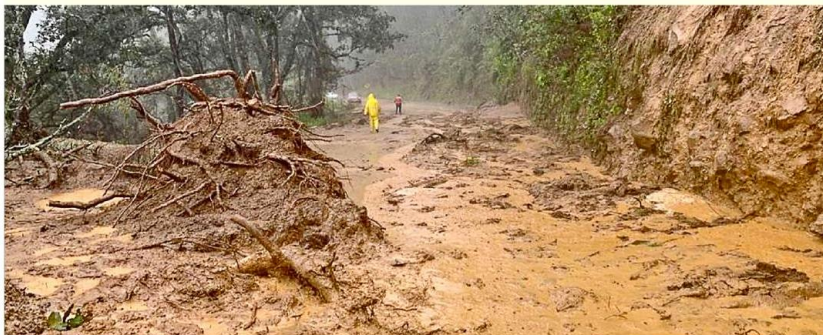
■ Por un deslave sobre la carretera estatal 429 en el sentido El Grullo-Cd. Guzmán, dos personas resultaron lesionadas.

También fue cerrado en su totalidad el paso de la carretera del "Camino Viejo" que conecta con el poblado de Usmajac, a causa de la creciente de agua provocada por las lluvias.