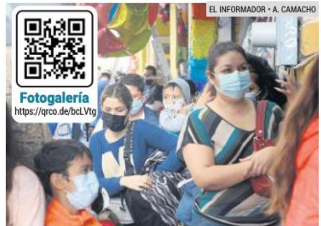
ESPERA. Los padres de familia tuvieron que esperar afuera de los negocios por las medidas sanitarias.

El 26 de agosto, este medio publicó que ocho de cada 10 niños en Jalisco quieren retomar las clases presenciales. Así lo reveló la encuesta “Caminito de la escuela”, que elaboró la Comisión de Derechos Humanos de la capital, y en la que participó la Comisión Estatal de Derechos Humanos Jalisco (CEDHJ).