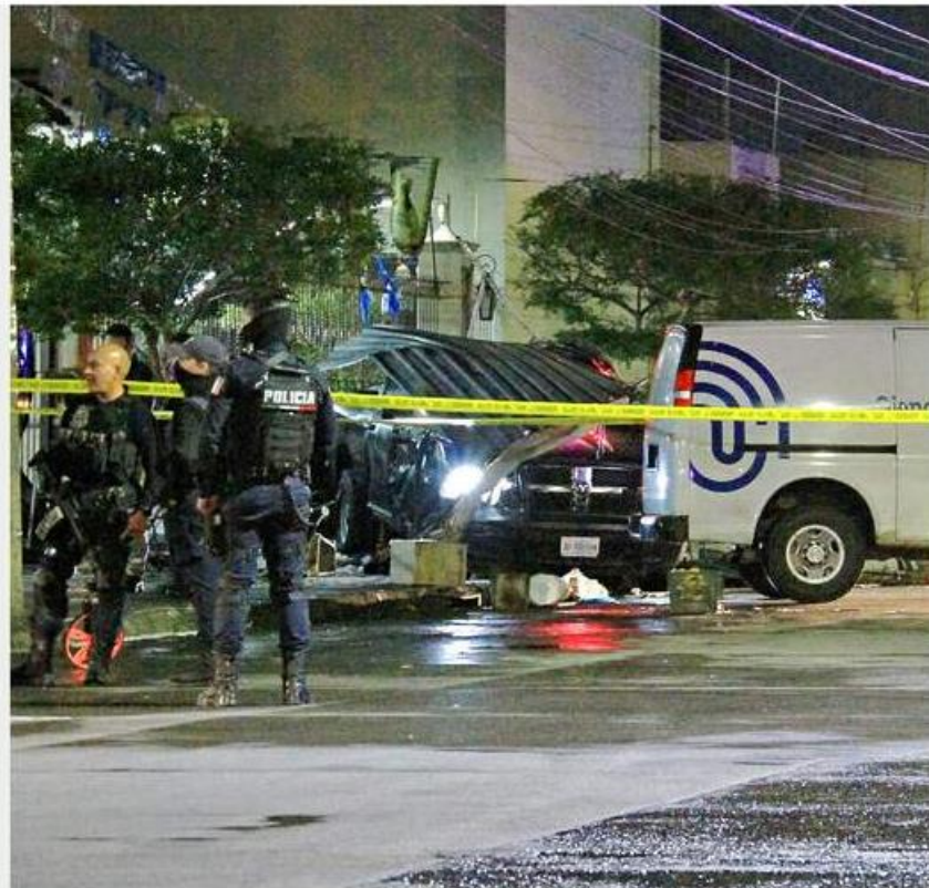
■ Un vehículo de la Policía de Guadalajara se fue contra un local de comida y embistió a dos hombres y una mujer.

La Comisaría de Guadalajara informó que el chofer de la patrulla fue presentado ante un Ministerio Público mientras se investiga el hecho.