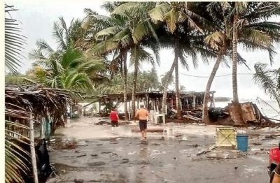
■ Protección Civil de Tecomán atendió la emergencia que se presentó en la Playa Boca de Pascuales, en Colima.

El tramo de la carretera libre que conecta Sayula con Amacueca fue cerrado debido al desbordamiento del