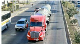
Los tráileres de doble remolque no deben circular a ninguna hora por el Área Metropolitana de Guadalajara.

Patria, entre Mariano Otero y Moctezuma, es común que los tráileres le roben un carril de circulación o entorpezcan la vialidad al ingresar o salir de las empresas.