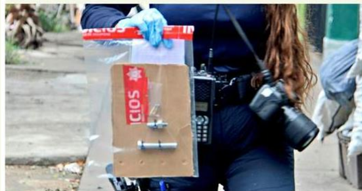
■ El arma está fabricada con un tornillo.

El 26 de agosto, la Secretaría de Seguridad del Estado alertó que este tipo de armas de fuego están prohibidas y son inseguras incluso para quienes las portan.