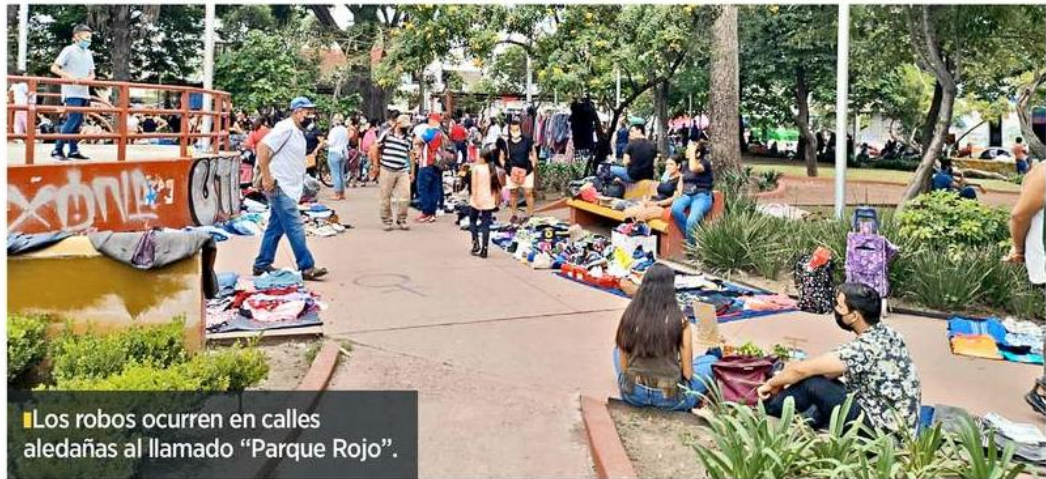
Los robos ocurren en calles aledañas al llamado "Parque Rojo".

"Desde el año pasado entregaba afuera del tren, pero cada vez había más gente y por la pandemia y el Covid me daba miedo, mejor me iba