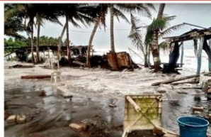
Colima fue uno de los estados con más afectaciones con inundaciones y destrozos en Playa Pascales.