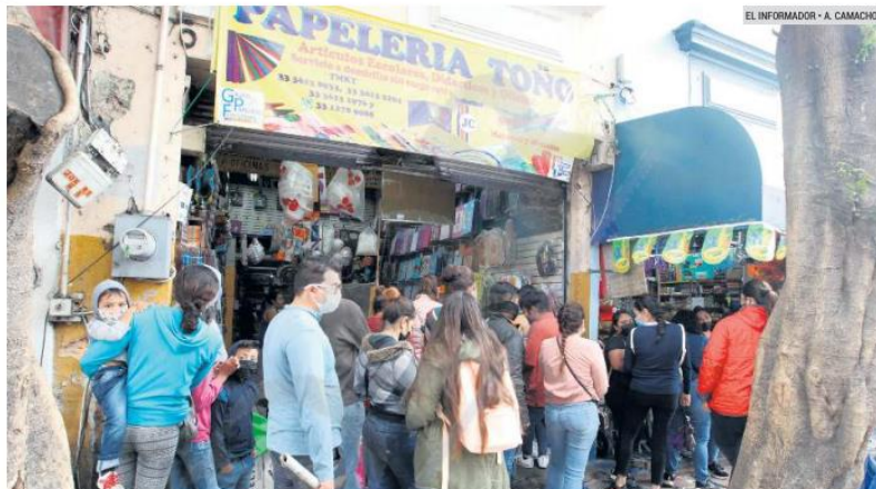
A DOS DÍAS DEL REGRESO A CLASES. Este medio observó cómo las personas agolparon las papelerías del Centro tapatio.

Se buscó precisar y actualizar el dato, pero no se obtuvo respuesta del Gobierno del Estado. En el calendario de actividades, se indica que el mayor avance en la entrega se tendría en septiembre, una vez iniciado el ciclo escolar.