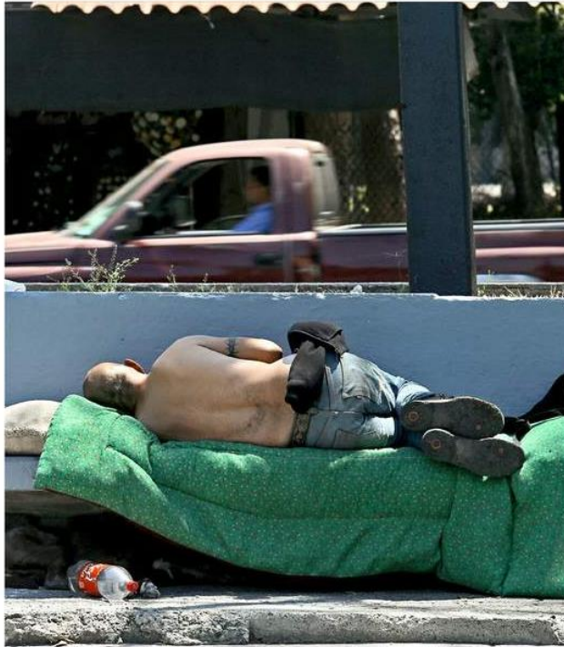
El Centro Histórico y Plaza Tapatía son algunos de los sitios que concentran personas en situación de calle.