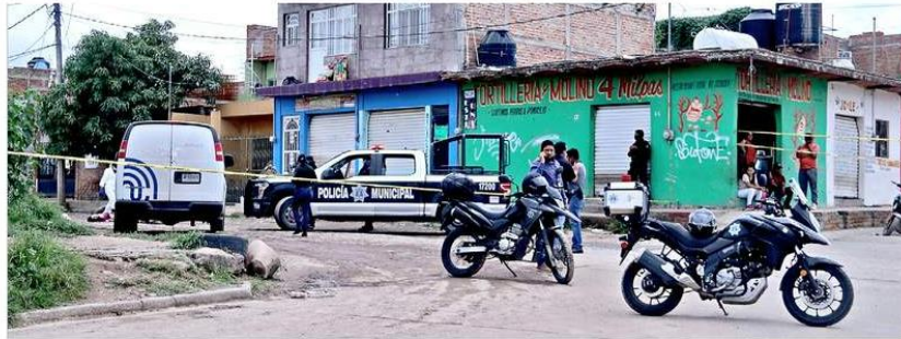
■ En la Colonia Los Santibáñez, en Tlaquepaque, fue baleado un joven.

La Policía municipal informó que la víctima, quien se dedicaba a recolectar materiales en desuso, recibió un impacto de bala en el cráneo. Su cuerpo fue identificado