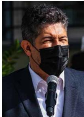
El Secretario de Educación de Jalisco, entrevistado en el programa radiofónico Tula de Juicio habló de los protocolos y medidas para evitar y/o contener los contagios del virus en las escuelas en el regreso a clases.

Y reveló: “Nuestro registro en el ciclo escolar pasado cuando tuvimos esta reapertura de las escuelas, solo tuvimos 8 casos de niños reportados con COVID-19, que no quiere decir que lo adquirieron en la escuela, sino que en la escuela se reportó que los niños los canalizó, se les detectó el virus y se les aisló por 14 días, así como a todas las personas que tuvieron contacto con ellos, para de esta manera poder parar las cadenas