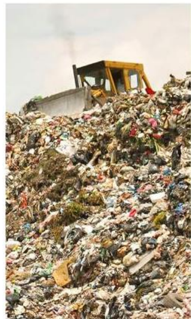
■ El Ayuntamiento de Guadalajara renovó por 15 años concesión a Caabsa.

El Gobierno del Estado respalda que Caabsa abra otro relleno sanitario en Tala para sustituir a Laureles, con la promesa de que va a cumplir con las normas ambientales.