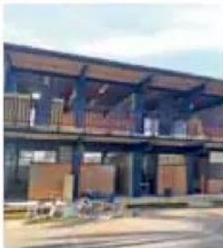
Desde mayo se realizan reparaciones en las instituciones.

Después de un año y cinco meses que se suspendieron las clases presenciales por la pandemia, este lunes regresarán a las escuelas, en formato "híbrido", 1.6 millones de estudiantes de preescolar, primaria y secundaria, informó la Secretaría de Edu-