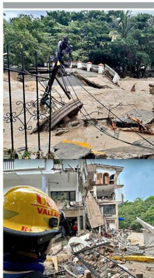
Los ríos Cuale y Pitillal se desbordaron tras el paso de "Nora" por Puerto Vallarta.