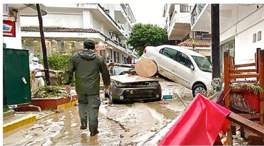
El Centro de Vallarta, afectado por el desbordamiento del Cuale, fue cerrado al tránsito. Un vehículo quedó sobre otro.

Aunque aún no se ha estimado el valor de los daños ocasionados por "Nora" en Puerto Vallarta, funcio-