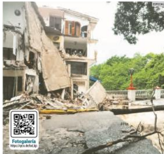
BUSQUEDA. Los rescatistas trabajaron durante ocho horas en los escombros del hotel CoWork y alrededor de las 14:30 horas hallaron el cuerpo del menor español.

El Gobierno de Jalisco contactó a la familia, residente de Va-