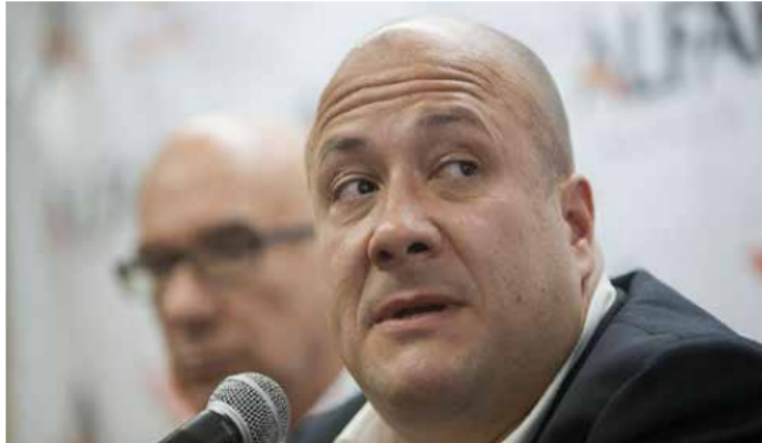
Un gobierno que no quiere voces críticas. Quieren unanimidad y entrega total.

EL PODER DESCALIFICA A QUIEN SE ATREVE A ALZAR LA VOZ CONTRA LAS IMPOSICIONES DEL PODER, LOS NEGOCIOS A SU AMPARO Y LA CORRUPCIÓN QUE HAY DETRÁS DE MUCHAS DE LAS DECISIONES Y NO PODEMOS CONFÍAR EN EL DISCURSO OFICIAL QUE SIEMPRE TRAE CARTAS BAJO LA MANGA, NI SOBRE ESTE ASUNTO NI SOBRE EL CPS.