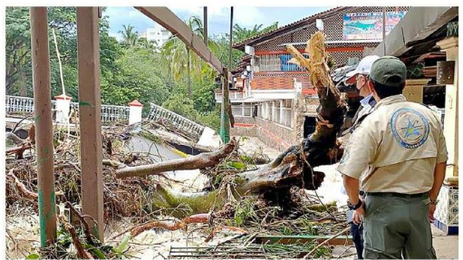
El Alcalde interino de Vallarta aseguró que en 50 años no se había registrado una crecida tan grande del río Cuale.