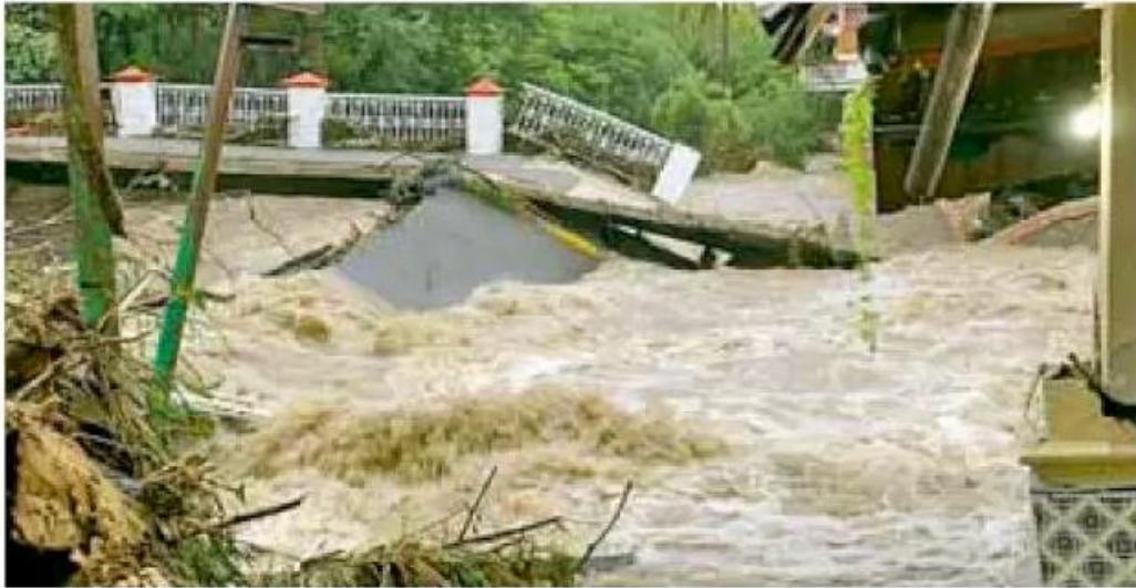
Derrumbes. Se han registrado deslaves y colapsos en carreteras.