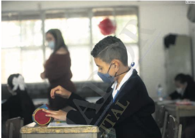
CLASES. Hoy inicia el nuevo ciclo escolar. Más de 1.6 millones de alumnos seleccionarán el modelo presencial o virtual.

Lo anterior se da en medio de la decisión del sector educativo, tanto federal como estatal, de volver a las clases presenciales este lunes.