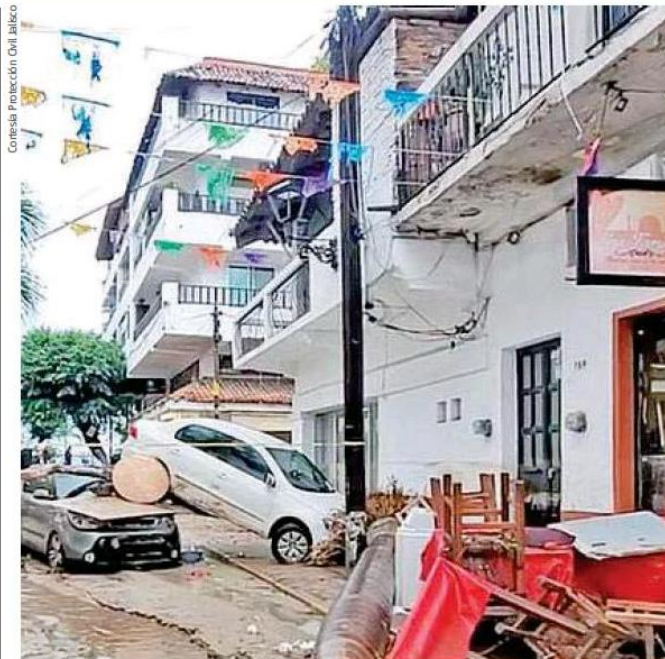
El desbordamiento de los Ríos Pitillal y Cuale provocaron la tragedia en el hotel CoWork e inundaciones severas.

Del 1 al 7 de agosto, el litro para tanque estacionario costaba 12.01 pesos y de cilindro, el kilo costaba 22.24 pesos. Esta semana subió, de 12.52 y por kilo de 23.19 pesos, respectivamente. Pág. 5