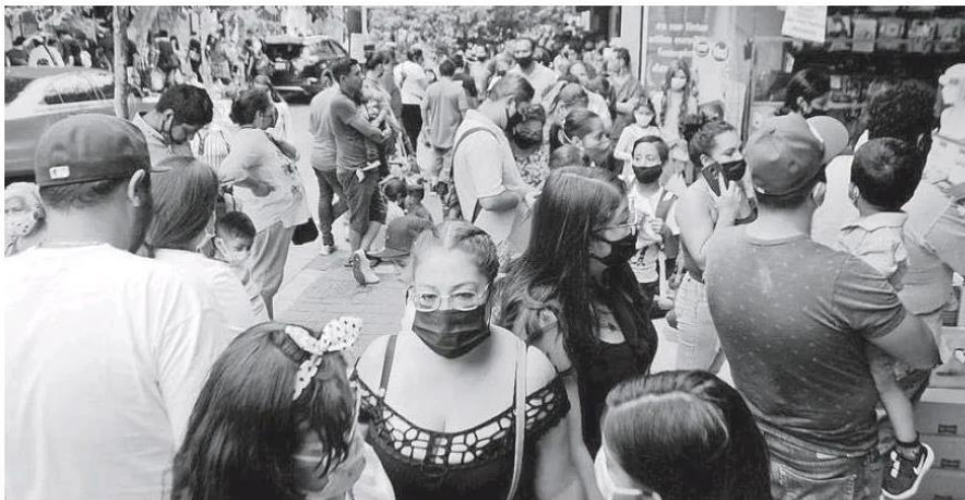
Último domingo de vacaciones y las compras de pánico en papelerías.

Hasta este domingo previo al regreso a clases presenciales, en Jalisco suman 331 mil 464 contagios y 14 mil 387 fallecimientos a causa del coronavirus.