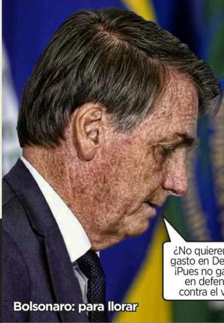
Bolsonaro: para llorar

En Brasil: quiere terminar con el uso de cubre- bocas