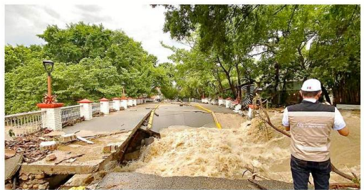
La SIOP informó que trabaja en materia de ingeniería y diseño del puente que cruza el río Cuale para sustituir su infraestructura.