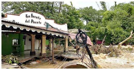
Tras un recorrido, se detectaron afectaciones en un perímetro de alrededor de 12 cuadras, tras desbordarse el río en Vallarta.