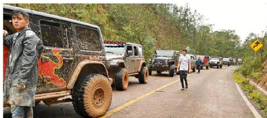
Tras un derrumbe en la brecha que conduce al Bosque del Maple, 132 conductores de jeeps fueron rescatados en Talpa de Allende.