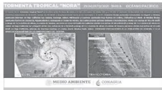
La ficha informativa de Conagua. CAPTURA DE PANTALLA

Las extensas bandas nubosas de "Nora" aportarán abundante entrada de humedad e interaccionarán con un canal de baja presión en el interior del país, produciendo lluvias fuertes a muy fuertes en el