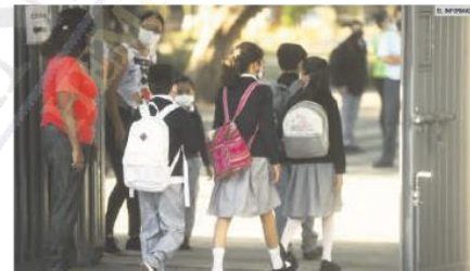
PROGRAMA. Padres de familia esperan la entrega de los útiles y uniformes escolares gratuitos.

En 2017, la pasada administración estatal informó que, de las mil 384 aulas provisionales que se comprometieron a retirar, la Secretaría de Educación reportaba un avance del 90%. En esa fecha se habían construido 580 salones y 679 se encontraban en proceso. José Lomeli Rodríguez, entonces director del Instituto de Infraestructura Educativa, detalló que otras 125 aulas se mantenían en proyecto, pero prometió que se harían las contrataciones para sustituir el 100% de los salones prefabricados en los que estudiaban 50 mil alumnos, con una inversión de 800 millones de pesos.