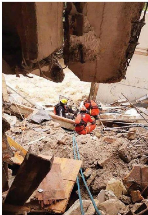
Protección Civil rescata el cuerpo del menor.