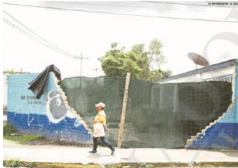
PADRÓN. La autoridad reporta que sólo 15 escuelas no regresarán a las clases presenciales por las malas condiciones estructurales, como la Primaria "Emiliano Zapata", en El Colli de Zapopan.