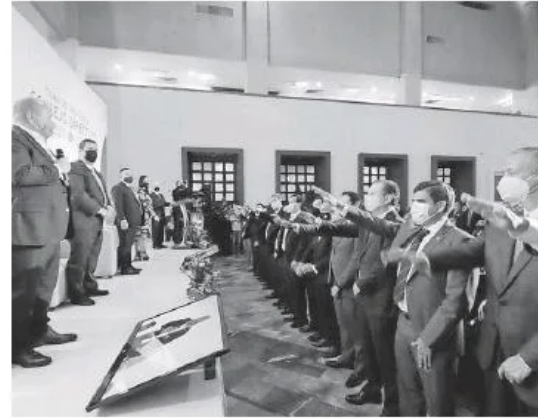
La nueva mesa directiva de Canaco.

de medir de forma objetiva y clara, tanto los avances en las políticas públicas en materia anticorrupción, como la eficacia del Sistema.