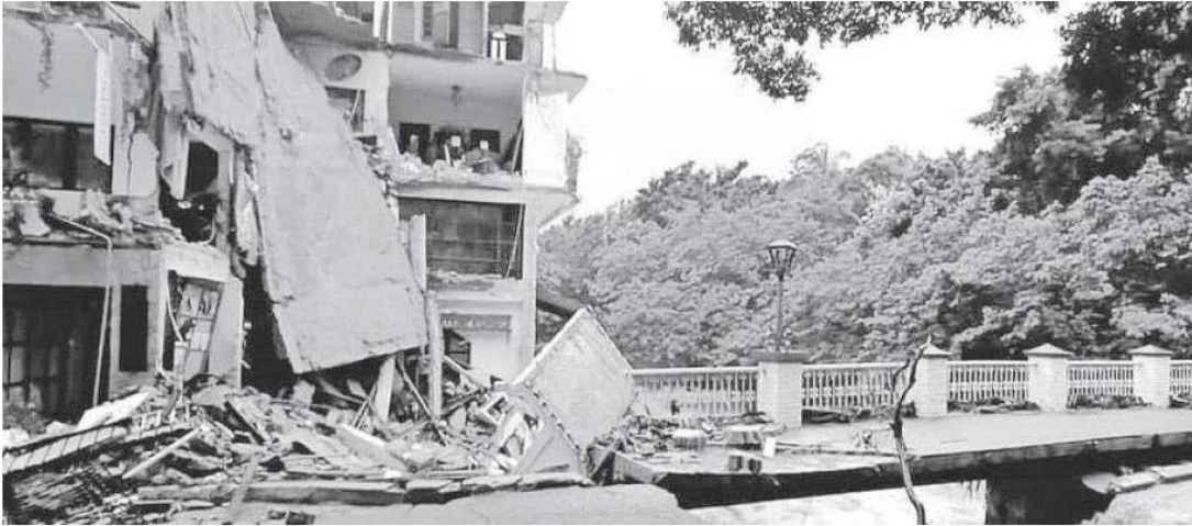
La creciente del río Pitillal provocó el derrumbe de una finca en Vallarta.