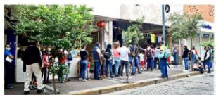
Padres y madres abarrotaron las papelerías del Centro tapatío para comprar lo necesario para el regreso a clases.