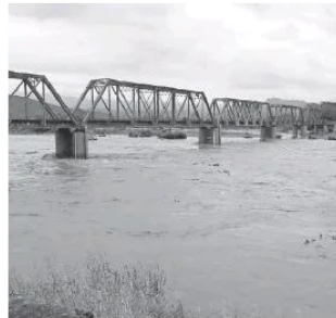
El río Las Cañas afectó a La Bayona y El Tigre, municipio de Acaponeta.

En Cihuatlán continúa el recuento de daños en las casas afectadas por el des-