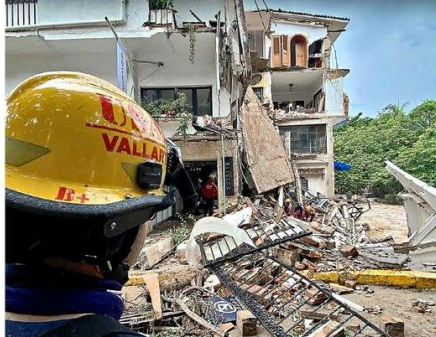
Los ríos Cuale y Pitillal se desbordaron tras el paso de "Nora" por Puerto Vallarta.