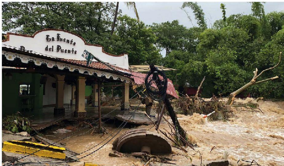
Las inundaciones causaron daños en infraestructura.