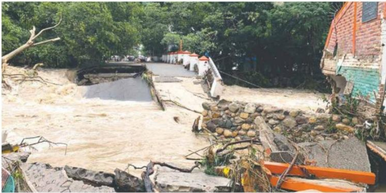
COSTA. El desbordamiento del río Cuale provocó el colapso de un puente en Vallarta.

132 JEEPERS fueron rescatados en Talpa de Allende por personal de la UEPCBJ tras quedar incomunicados sobre la carretera que conduce al bosque de mangle