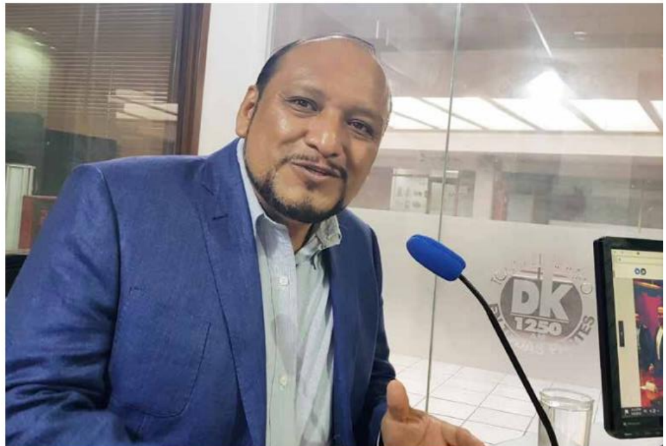
El Presidente de la Comisión Estatal de Derechos Humanos de Jalisco, Alfonso Hernández Barrón, considera que ningún estado como el nuestro se ha vivido la situación tan trágica en materia de desaparecidos, como el caso de los estudiantes de cine, el caso del tráiler, entre otros.

tuaciones, las familias plantean que hasta cinco veces más que las cifras oficiales. A nivel nacional la cantidad anda en 90 mil personas desaparecidas, si atendemos esta lógica de las familias y colectivos son cinco veces más. Es un asunto que ha rebasado a todas las instituciones, si se crean instituciones, hemos avanzado en Jalisco en mecanismos estructurales, en legislación, instalación de oficinas como la propia fiscalía especializada, pero todo eso no logra traducirse en indicadores de resultados, ahí está un terrible problema en ciencias forenses que está recurriendo a la identificación de personas con perfil de ADN que es lento, es costoso, tienen que generarse nuevos mecanismos para la identificación de personas".