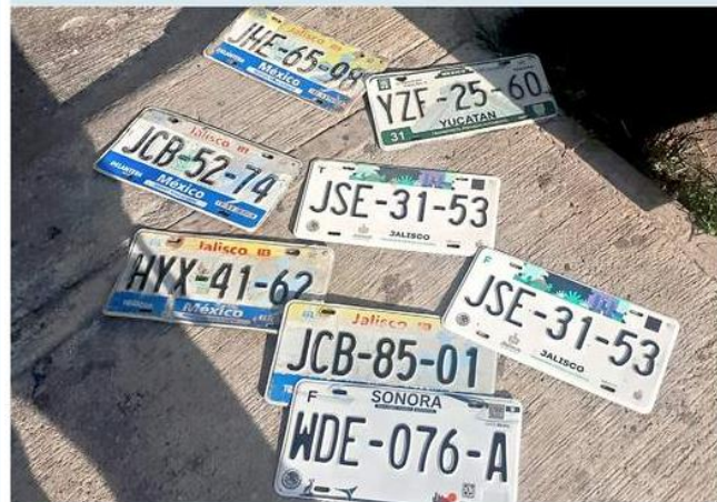
■ Autoridades aseguraron 12 placas durante un operativo en una finca de la Colonia Echeverría, en Guadalajara.