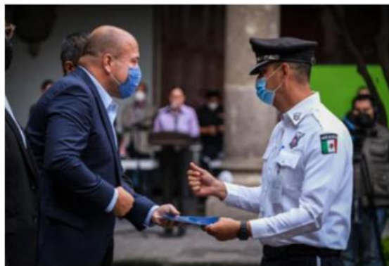
Cumple Gobernador con promesa de hacer realidad la Carrera Policial.

“Estamos entregando 176 acuerdos de definitividad, dándoles esa seguridad laboral pero inmediatamente después de esto, iniciamos conforme lo establece el reglamento la siguiente etapa del proceso que es la revisión de los grados y los ascensos, no en