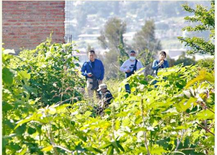
■ El asesinato se registró en Jardines de San Martín.

Paramédicos confirmaron el deceso y dijeron que ambas víctimas presentaban heridas de bala en el cráneo. En el sitio no fue-