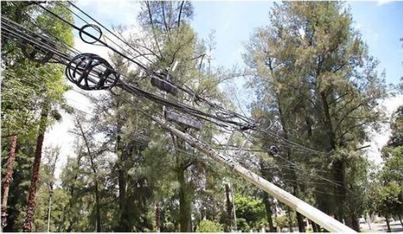
■ En la Calle Boyero, entre Osa Mayor y Sagitario, en la Colonia La Calma, se encuentra un poste roto a punto de colapsar.