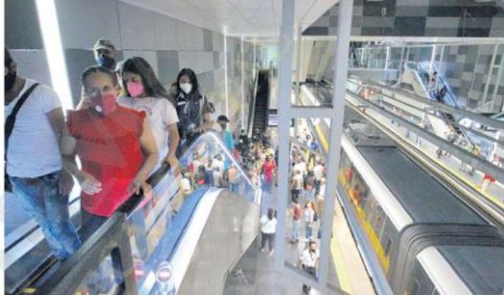
CUIDADO. Las instalaciones se mantienen en buen estado.

Destacan la frecuencia de paso y la limpieza de las estaciones de este nuevo medio de transporte