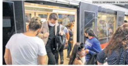
PUNTO POSITIVO. La frecuencia de paso es de los puntos más favorables.