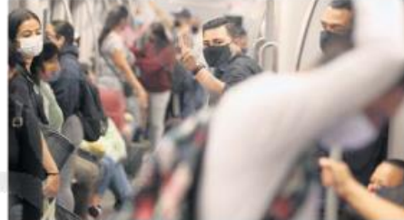
APOYO. Los pasajeros destacan el servicio.