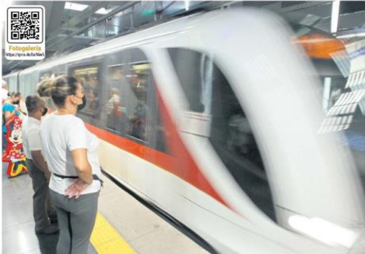
CELEBRACIÓN. La Línea 3 cumple un año hoy y lo festeja con el incremento de usuarios.

Fotogalería https://www.elinformador.com.mx/ver-noticia/123456789