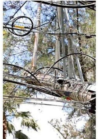
■ Vecinos de La Calma se quejan del exceso de cableado en la zona.