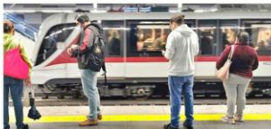
De acuerdo con el Sistema de Tren Eléctrico Urbano, desde el 21 de septiembre de 2020, cuando se empezó a operar en la L3, se han movilizado a casi 29 millones de pasajeros.

La meta: la Línea 3 (L3) del Tren Ligero movería a 233 mil pasajeros al día. La realidad: moviliza, en promedio, a 67 mil 800. Hey, a un año de que entró en operación este corredor que va de la Carretera a Tesisitán, en Zapopan, a la Central Nueva de Autobuses, en Tlaquepaque, no se ha concretado el plan para "limpiar" el derrotero y evitar que otras rutas le quiten pasaje al Tren. Todavía quedan 11 rutas que tienen un trazado similar al derrotero de la L3, incluso algunas hacen el mismo recorrido por algunos tramos. La L3 entró en operación