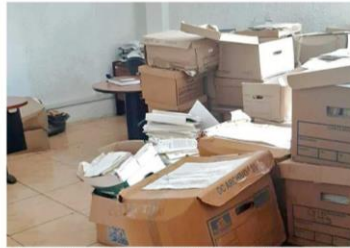
Personal de agencias ministeriales foráneas ha denunciado carencias, como la falta de mobiliario.