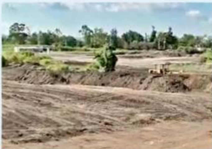
Durante este viernes se realizó el retiro de arbolado del predio donde se construirá Iconia.

que había tierra removida en el predio y que eran visibles las marcas de maquinaria en el suelo.