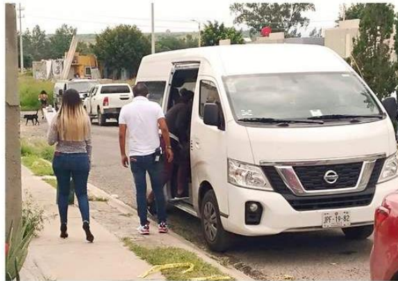
La Fiscalía continúa con la investigación del caso.