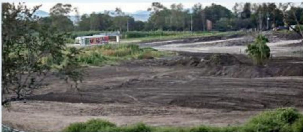
En el predio ayer se mantenían patrullas resguardando la zona.

Tras un recorrido en el lugar, MURAL constató