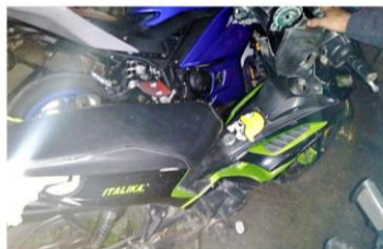
Cuatro de las motocicletas aseguradas tenían reporte de robo.

La servidora pública ha sido acusada de favoritismo, sobre todo con algunos de los integrantes de esa Fiscalía, como es el caso de un agente del Ministerio Público de Tepatlán, a quien presuntamente le asignó un vehículo oficial, lo que no sucede con otros empleados de rango similar.