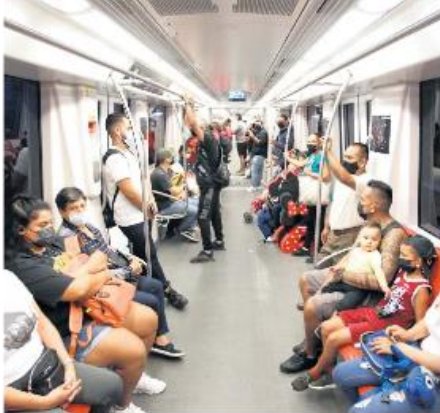
ORDEN. Todos los pasajeros suben con cubrebocas para evitar contagios de COVID-19 en el transporte público.