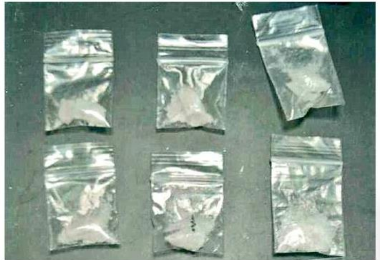
■ La metanfetamina impacta principalmente a jóvenes de entre 15 y 19 años.

Las personas que necesitan orientación para sobrellevar el problema de drogadicción pueden comunicarse de lunes a viernes de las 8:00 a 16:00 horas a las líneas 3338-232-020, 3338-546-077 y 3338-546-088, que pone a disposición la Secretaría de Salud Jalisco (SSJ).