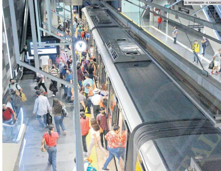
ESTIMACIÓN. El director del Siteur dijo que si bien el proyecto original contemplaba trasladar a más de 230 mil pasajeros al día en la metrópoli, se trató de un estimado a futuro. Actualmente se suben 110 mil, en promedio.

Para Valle Favela, la operación de la L3 se convirtió en el impulso de la conectividad en la Zona Metropolitana de Guadalajara, ya que las personas han ido aprendiendo sobre los puntos donde se vincula con las Líneas 1 y 2, el Macrobús y las rutas alimentadoras.