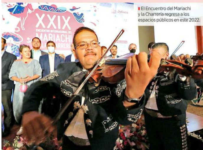
El Encuentro del Mariachi y la Charrería regresa a los espacios públicos en este 2022.

El Encuentro Internacional del Mariachi vuelve a las calles y espacios culturales