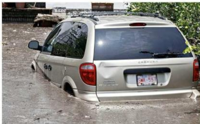
■ El daño por inundación, no está cubierto en todas las pólizas para auto.

“Es muy importante ver en la póliza el apartado en donde se especifican qué si-