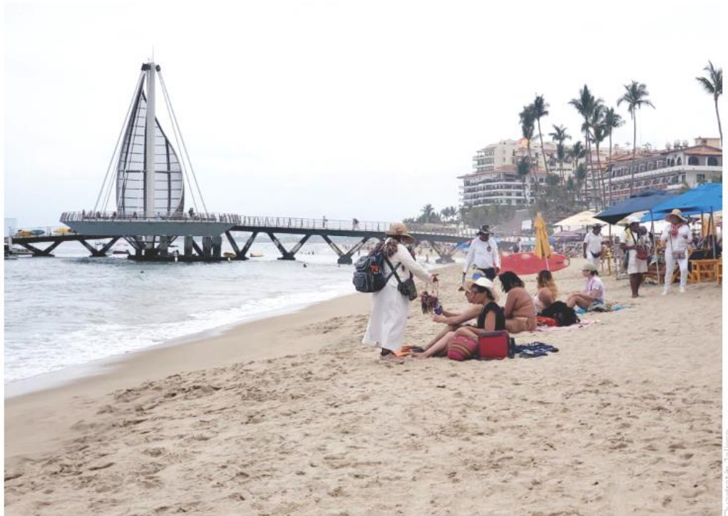
En Puerto Vallarta ya se busca a los que tuvieron contacto con el enfermo.