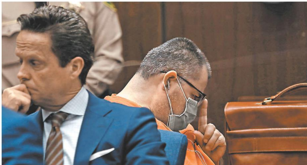
El autoproclamado Apóstol de Jesucristo , con uniforme de preso, en la sesión donde el juez dictó la sentencia en su contra.