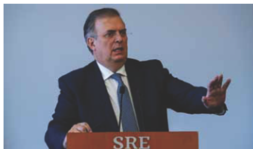
Marcelo Ebrard Casaubon , secretario de Relaciones Exteriores.

Los enterados de la política jalisciense aseguran que a Uribe Camacho se le ve conforme y concentrado en las labores que le confió el canciller mexicano: tejer alianzas y acuerdos con los diversos sectores del estado, tales como el empresarial, el social, e inclusive gremiales y políticos. Sin embargo, como decíamos, la alternativa de Ebrard Casaubon puede volverse muy atractiva en el estado, y eso seguramente removerá las aguas.