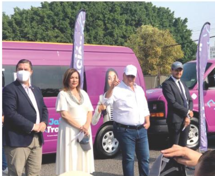
El gobernador Enrique Alfaro dio el banderazo de salida.