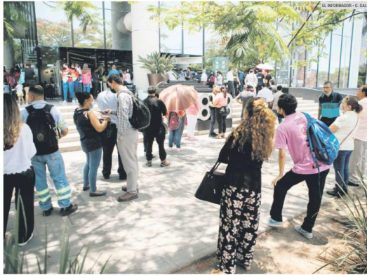
CIDADANOS ESPERAN. Las oficinas del Servicio de Administración Tributaria (SAT) ubicadas en la Zona Metropolitana de Guadalajara (ZMG) tuvieron ayer, desde temprano, largas filas de contribuyentes que esperaron para hacer sus trámites.

El sector empresarial agradece al Servicio de Administración Tributaria por aplazar la nueva versión, ante la saturación de oficinas públicas