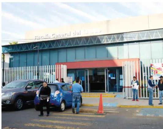
SIN HERIDOS. La Fiscalía del Estado informó que ninguno de sus agentes resultó lesionado.