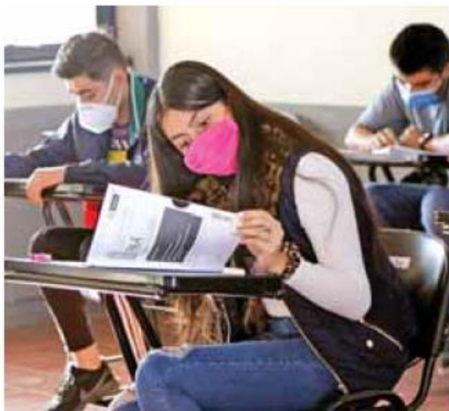
Postura. El gobierno se mantiene atento a los casos.

“En este momento no hay necesidad de modificar ninguna medida. Aunque hay un ligero incremento en el número de casos, estamos moni-