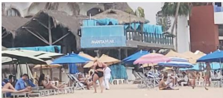
El Club donde acudió el contagiado sigue operando normal.

"Ellos (los dueños del club de playa) ha estado colaborando desde que se tuvo conocimiento de la notificación, ellos a su vez están en su personal buscando a las personas que tuvieron contacto y síntomas y están muy colaborativos", detalló el médico de profesión.