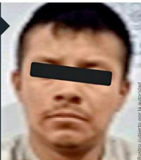
Rostro cubierto por la autoridad