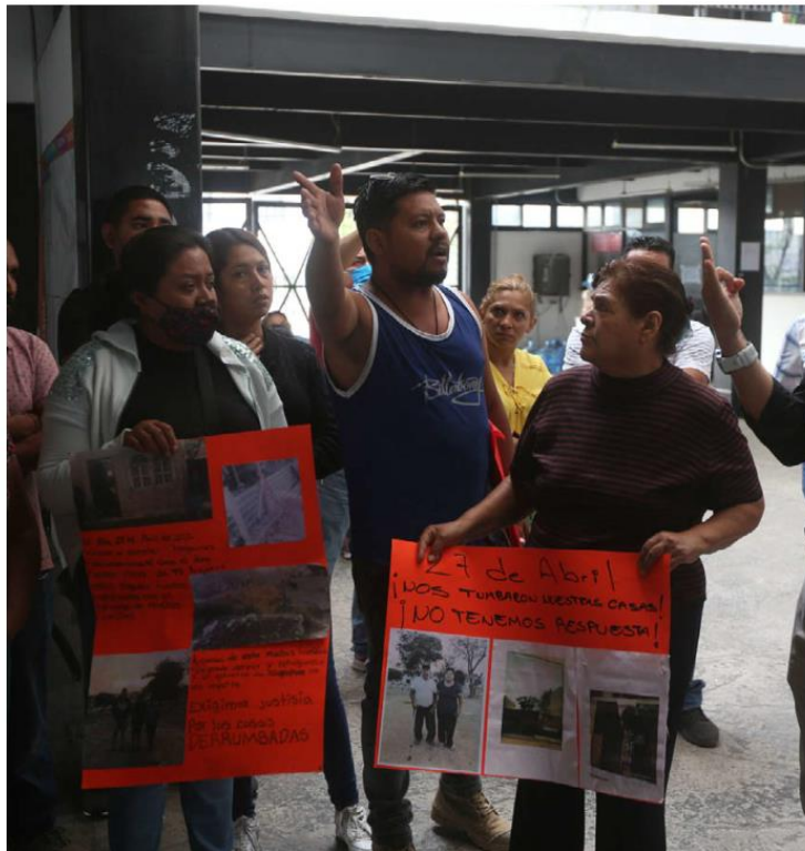
Vecinos de La Floresta desmintieron que solo 14 viviendas sean las afectadas. FERNANDO CARRANZA

“Entonces nosotros tenemos que buscar otras alternativas, ya estamos desesperados porque ya tenemos mes y medio sin recibir un solo peso del ayuntamiento de