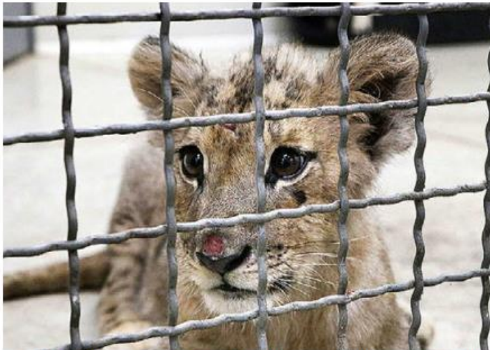
ANIMAL. Un cachorro de león de cinco meses que era resguardado por un vecino de Zapopan fue entregado a la Unidad de Manejo Ambiental Villa Fantasía. Presentaba signos de desnutrición.