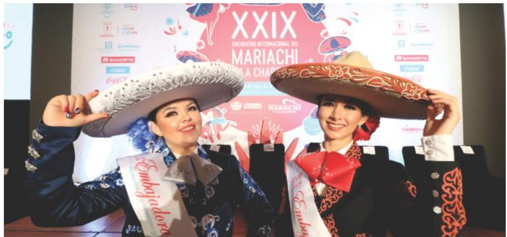
Estarán presentes cerca de 25 agrupaciones de Mariachi de diferentes partes del mundo.

los cantantes de música vernácula, además de la presentación de cada uno de los mariachis internacionales.