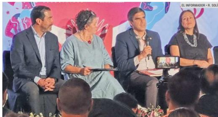
PRESENTAN EL PROGRAMA. Autoridades y organizadores detallaron el alcance y las expectativas económicas que tendrá el encuentro tradicional.

Para algunas galas y actividades, los boletos están disponibles desde este día. El programa completo se puede ver en: www.mariachi-jalisco.com.mx .