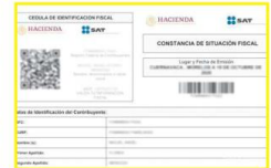
La Constancia de Situación Fiscal puede ser un requisito para pedir un empleo o un préstamo, conocer el régimen fiscal en el que se está inscrito y las obligaciones del contribuyente.

Los trabajadores de la Secretaría estuvieron ayer en Lomas del Paraíso y Miramar, colonias ubicadas en Guadalajara y Zapopan, respectivamente.