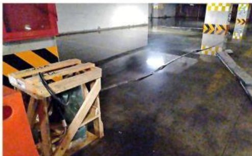
El agua acumulada es extraída con una bomba y, a diferencia de otras ocasiones que se mandaba al drenaje, se pone en pipas.