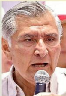
ADÁN AUGUSTO LÓPEZ SECRETARIO DE GOBERNACIÓN