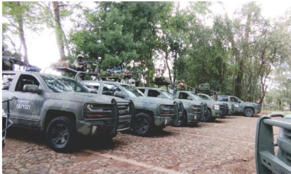
El miércoles 22 llegaron 300 elementos para fortalecer la seguridad en Jalisco.

Silva Ramírez descartó que la gente este abandonando el municipio, pues aseguró que existen fuentes de empleo, además