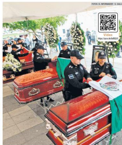
GUARDIA. El homenaje se llevó a cabo en la Plaza Juárez, en El Salto.