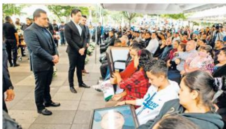
COMPROMISO. Autoridades refrendaron el apoyo económico a familias.