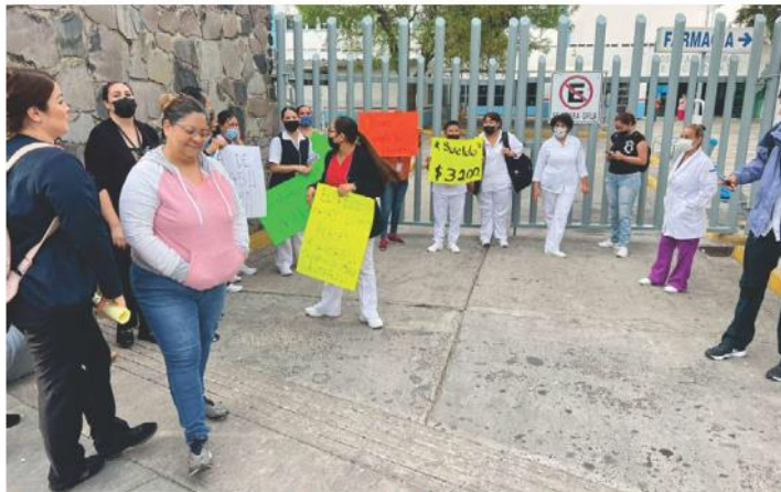
Alrededor de 20 empleados protestaron afueras del hospital. PABLONÚÑEZ