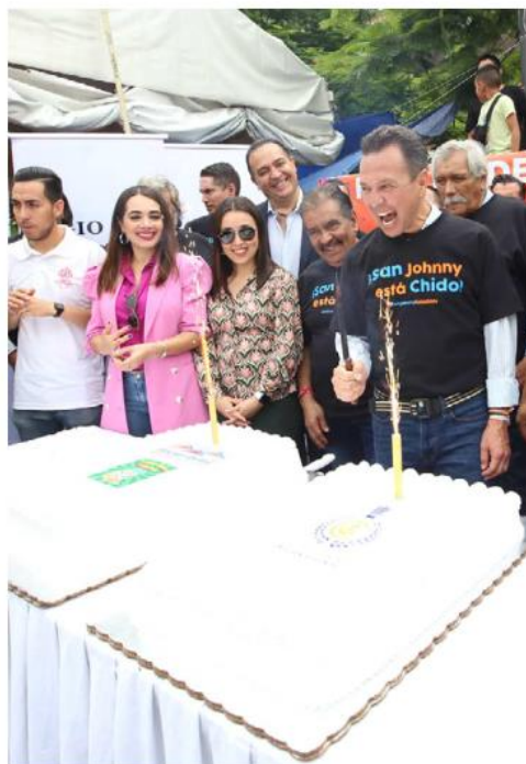
Se partió el pastel por el Día de San Juan Bautista. ESPECIAL