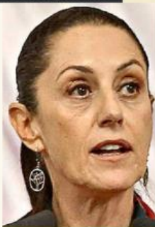
CLAUDIA SHEINBAUM JEFA DE GOBIERNO DE CDMX

Para los posibles aspirantes de Morena, ya algunos cierran filas.