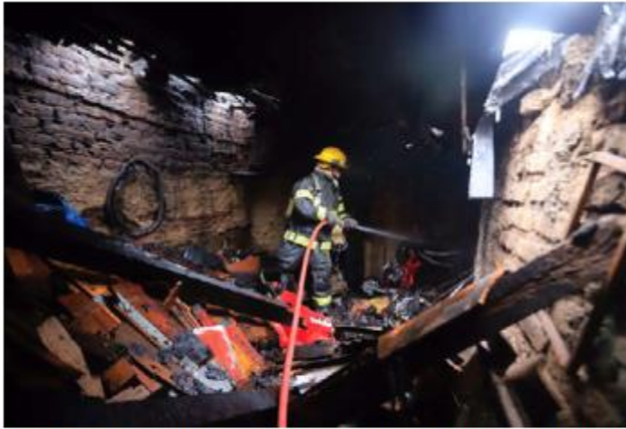
INCENDIO. Elementos de Protección Civil y Bomberos de GDL sofocaron las llamas de un incendio en la habitación de una casa en la colonia Echeverría. No hay lesionados por este hecho.