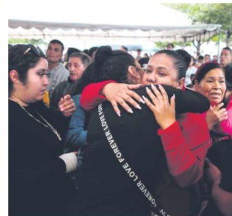
DOLOR. Los elementos caídos son recordados por su heroísmo.