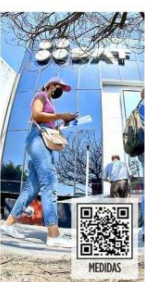
MURAL / STAFF

El desarrollo urbano, agregó, facilitó las condiciones para que se diera la violencia.