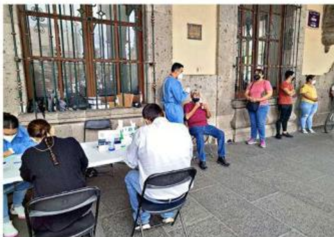
■ Módulo de pruebas de detección de Covid en el Centro de Guadalajara.

Normalmente, lo máximo que se juntaban eran de