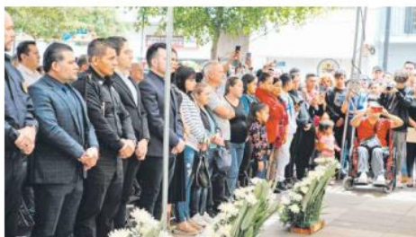
DESPEDIDA. Acudieron familiares, amigos y compañeros.