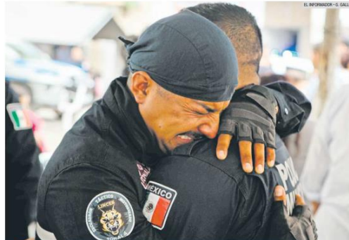
HOMENAJE. Ayer se realizó un homenaje a los cuatro policías que fallecieron en el enfrentamiento que se desató el miércoles en El Salto. Tanto autoridades municipales como estatales aseguraron que se brindará apoyo a sus familias.