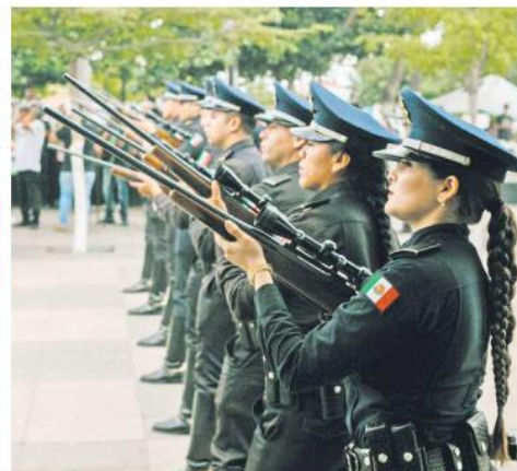
DEBER. Realizaron disparos de salva en recuerdo de sus compañeros.