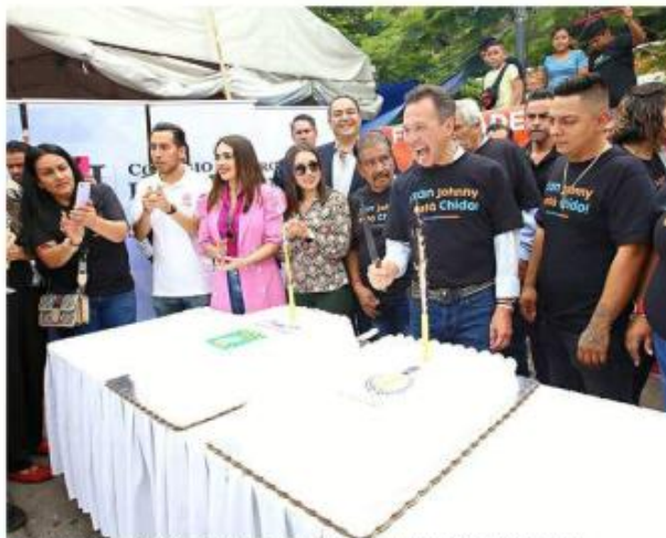
El Alcalde Pablo Lemus entregó locales rehabilitados en el Mercado San Juan de Dios.