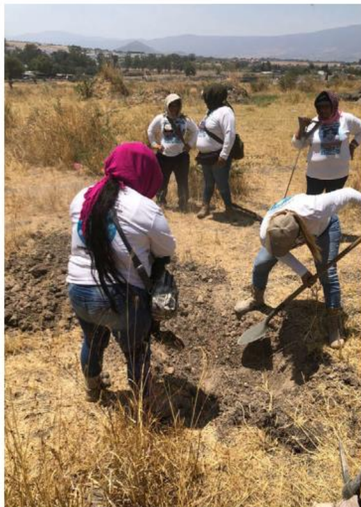
El colectivo ha realizado 40 brigadas de búsqueda. D. BARAJAS

“Es comida, agua, sueros porque la verdad pues es bajo el sol.