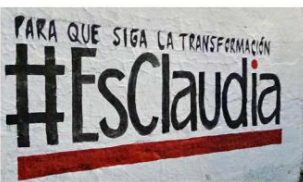
50 pintas con propaganda a favor de Claudia Sheinbaum aparecieron ayer en la Perla Tapatía.

REQUIERE INE INFORMACIÓN En la Ciudad de México, la misma pinta luce en las alcaldías Iztacalco, Iztapalapa,