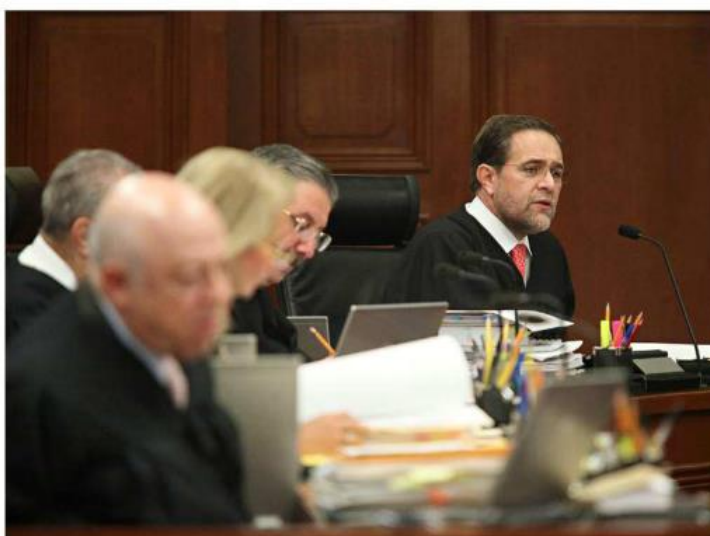
La Suprema Corte de Justicia de la Nación ya declaró inconstitucional la penalización del aborto voluntario.

“Creemos que no afectará en nada a México porque de entrada nuestro sistema es diferente, y segundo, hasta ahorita la posición que han asumido los integrantes de la Corte en nuestro País va en