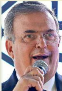
MARCELO EBRARD CANCELLER