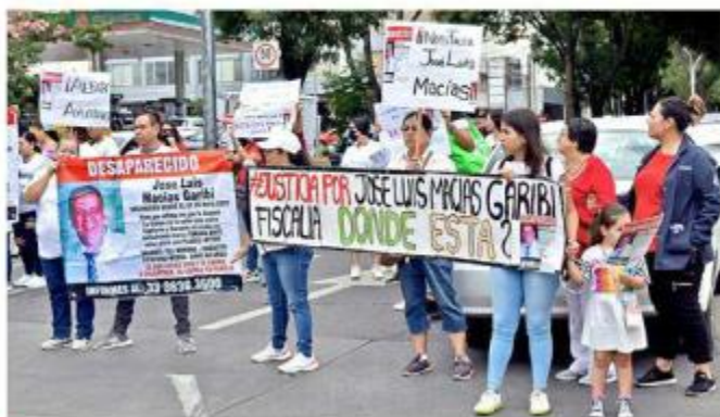
■ Cerca de 50 personas marcharon a Casa Jalisco.

La manifestación comenzó a las 16:30 horas en la Glo-