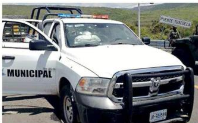
El anterior Comisario de Tizapán el Alto fue asesinado en una emboscada el 12 de junio.

El mando viajaba por carretera en una patrulla cuando los ocupantes de tres camionetas lo interceptaron y le dispararon. Otros dos gendarmes resultaron heridos.