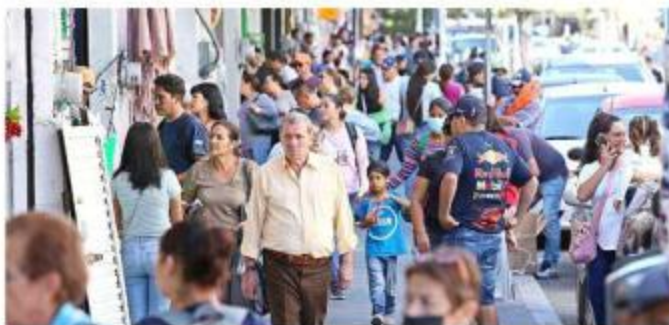
■ Comerciantes de la zona de Obregón esperan incremento de ventas gracias al Buen Fin.

“En este tiempo nos suben las ventas un 50 por ciento, poco más. Baja y en Navidad vuelve a subir. Pero más ahora porque muchos anticipan sus compras para esos días”, afirmó.