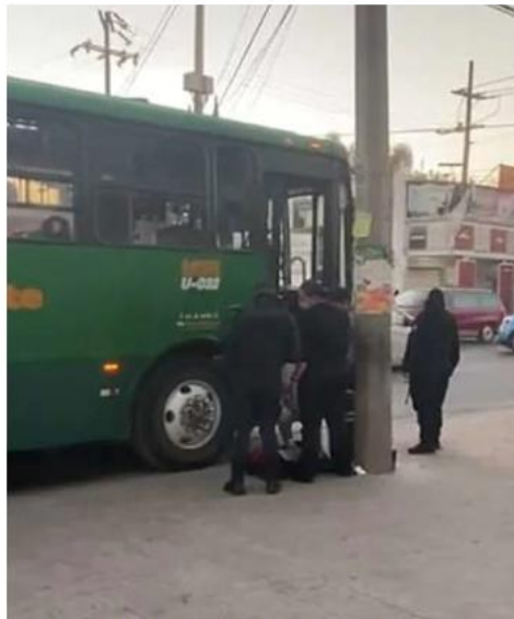
Los hechos se registraron en Tlaquepaque. J. C. MUNGUÍA

La policía municipal llegó e implementó un operativo para dar con el sujeto