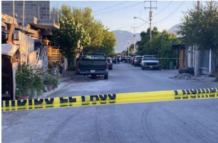
La víctima fue asesinada a balazos. ESPECIAL