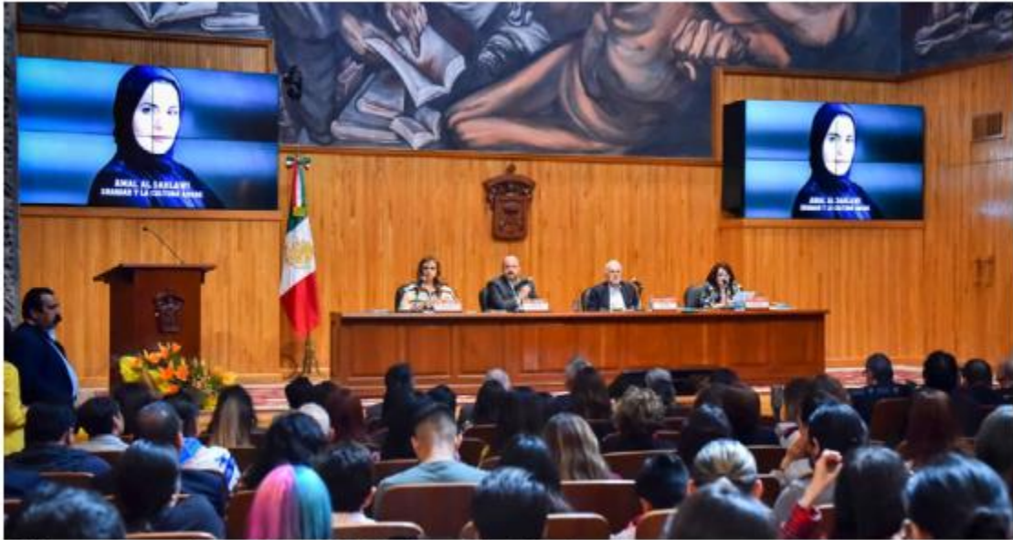
Hicieron el anuncio en el Paraninfo Enrique Díaz de León.