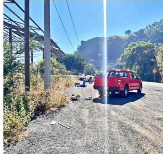
El hallazgo ocurrió en el kilómetro 19 de la Carretera a Saltillo.

Ambos fueron trasladados al puesto de socorro, sin embargo, el primero perdió la vida.