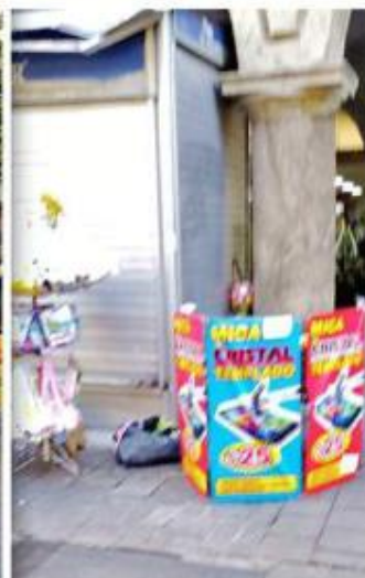
■ Vendedores ambulantes se han instalado en los andadores del primer cuadro de Guadalajara, principalmente en Colón y Santa Mónica.

La mayoría, comercializan artículos para celular, principalmente micas de cristal. También se encontró personas ofertando bolsas para niñas, juguetes, dulces y productos como rodilleras, muñequeras y tobilleras.