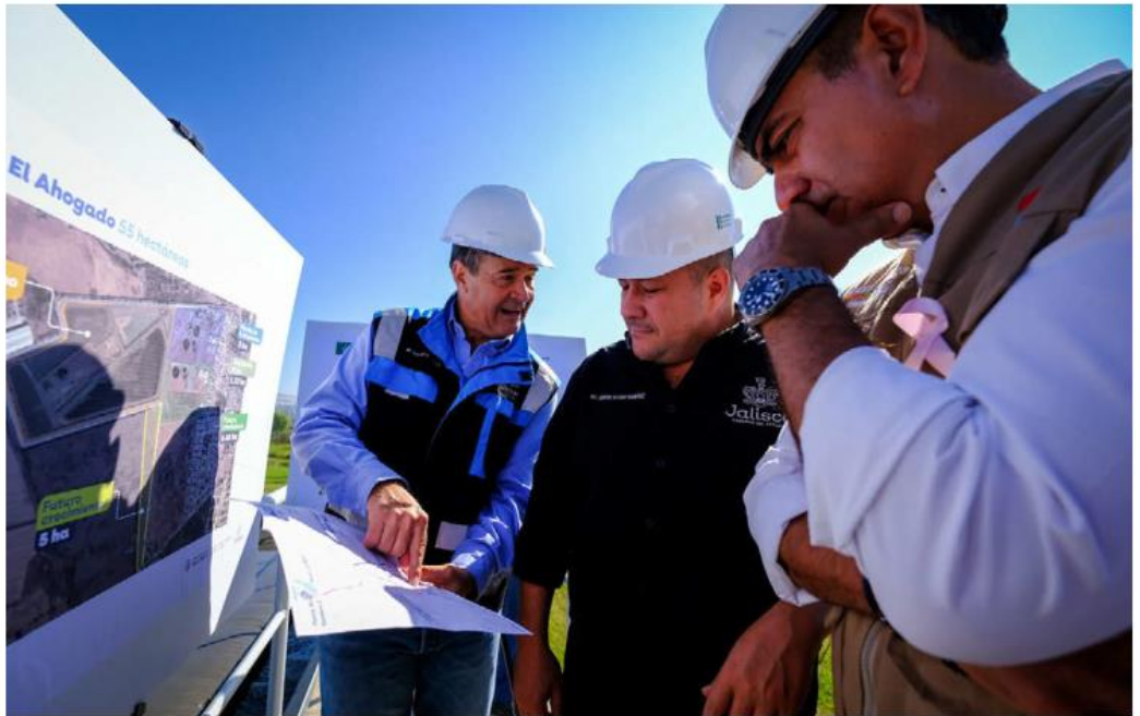
El gobernador Enrique Alfaro Ramírez supervisó la planta de tratamiento.

La planta inició su operación y mantenimiento en mayo de 2012, sin embargo, debido al crecimiento poblacional del Área Metropolitana de Guadalajara (AMG), la planta saturó su capacidad de tratamiento, por lo que requiere su ampliación para tratar mil litros de agua residual