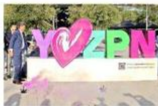
■ Tótem de “Yo Amo ZPN” en la estación Zapopan Centro de la Línea 3.

La Dirección de Turismo y Centro Histórico subrayó que “Yo Amo ZPN” y “Zapopan Travel” pretenden un posicionamiento internacional del Municipio que reditúe en mayores ingresos económicos.