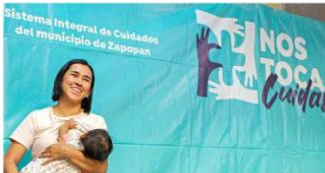
El Gobierno de Zapopan entregará apoyos económicos mensuales a 200 madres cuidadoras.

Proyectan para el 2023 aumentar 300 beneficiarias del programa.