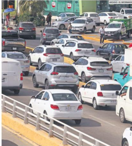
CONTAMINAN. El aumento de parque vehicular de autos usados propicia mayor emisión de partículas contaminantes en el aire.

En los últimos siete años aumentó en casi 50% el número de atenciones relacionadas con enfermedades respiratorias como EPOC y asma atribuidas a