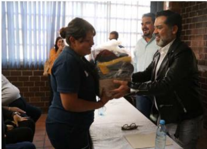
LABOR. Elementos operativos y administrativos de la Dirección de Mercados de Guadalajara recibieron uniformes y equipos de protección en las instalaciones del Mercado 18 de Marzo.