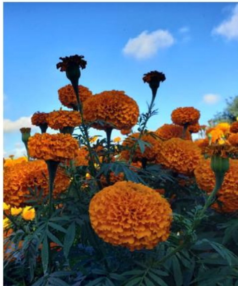
Algunas muestras del Rancho San Juan Diego. DIANA BARAJAS

Antes de la cosecha, la gente asiste al rancho para presenciar y tomarse fotos en el bello paisaje de cempasúchil.