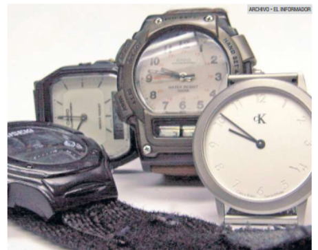
AJUSTE. Recuerde retroceder una hora sus relojes para este domingo.

En México, el Horario de Verano comenzaba el primer domingo de abril, cuando los relojes se adelantaban una hora, y terminaba el último domingo de octubre, excepto en los Estados de Quintana Roo (sureste) y Sonora (noroeste), que no cambiaban, además de la frontera norte, que adopta el cambio de Estados Unidos.