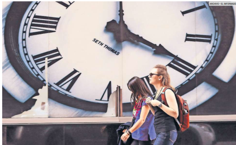
PLAN. La propuesta del cambio de horario ha sido para ahorrar energía eléctrica y aprovechar la luz del Sol.

Un estudio de la Sener indica que el ahorro anual fue de más de tres mil 200 millones de pesos