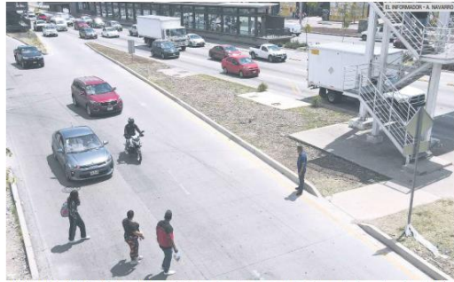
TORLEAN A LOS VEHICULOS. Ante la falta de infraestructura vial y agentes de tránsito que disminuyan la rapidez del flujo vehicular, las personas se ponen en peligro al cruzar la lateral del Periférico Norte a la altura de la calle División del Norte.

En los recorridos, que se realizarán en distintos horarios, participarán militares, agentes de la Guardia Nacional, estatales y municipales