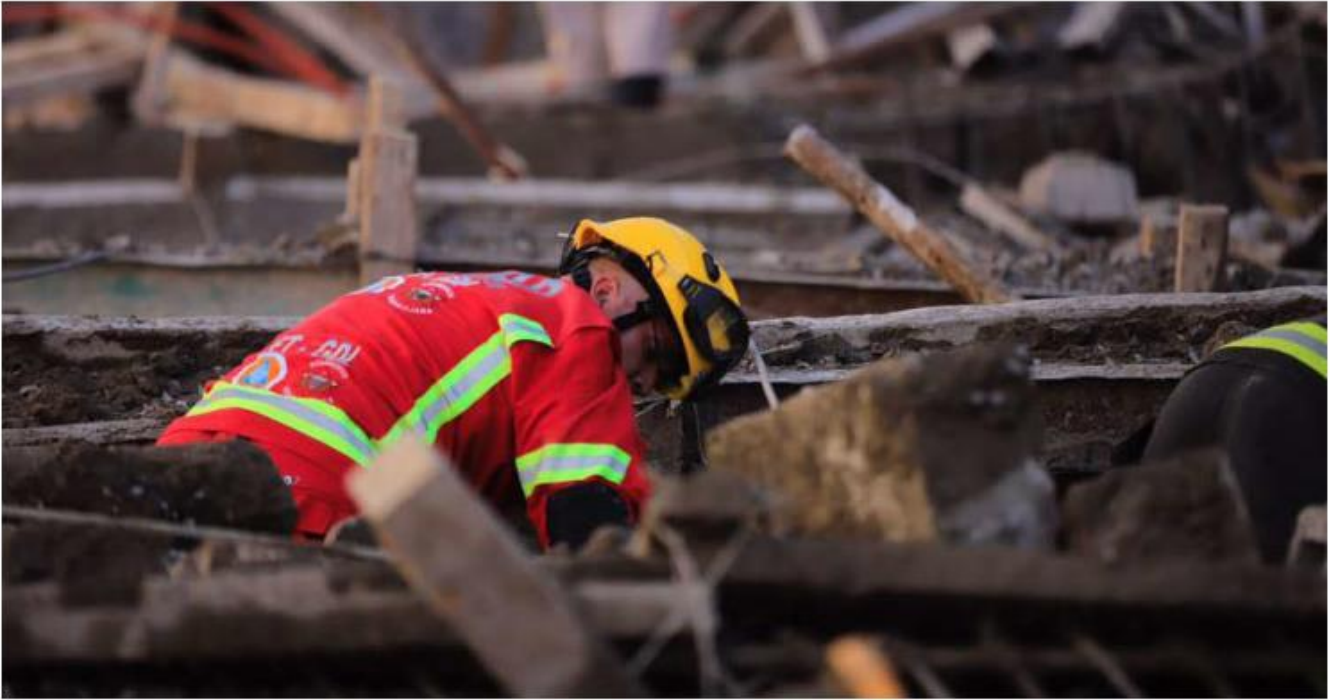
Elementos de Protección Civil y Bomberos de Guadalajara atendieron la emerge. ESPECIAL