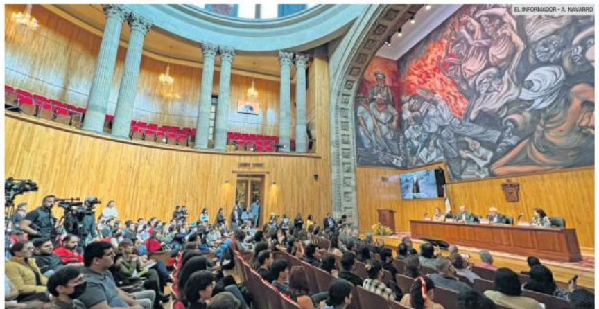
PRESENTACIÓN DEL PROGRAMA. El evento se realizó en el Paraninfo Enrique Díaz de León de la Universidad de Guadalajara.

•FIL Niños. Más de mil 500 sesiones de 17 talleres de fomento a la lectura y escritura creativa: 77 funciones de 27 espectáculos infantiles.