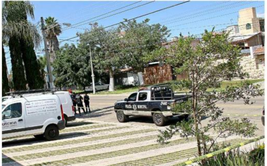
■ Luego de participar en un percance vial, un hombre fue atacado con arma de fuego la tarde del miércoles en la Colonia Arcos de Guadalupe, en Zapopan.

Aunado a la incidencia delictiva, los vecinos se quejaron porque al solicitar la