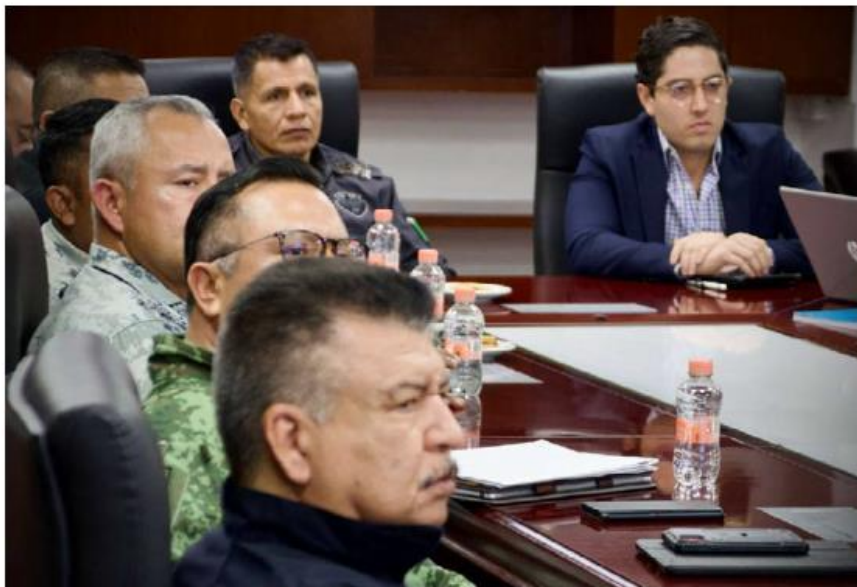
Ayer se tomó la decisión en Casa Jalisco. ESPECIAL