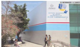
PARA TODOS. El Instituto de Cirugía Reconstructiva se ubica en Avenida Federalismo Norte 2022, en la colonia Guadalupeana.

Salinas Larios explicó que los pacientes que se atienden en la parte reconstructiva provienen de todos los Estados del Occidente mexicano.