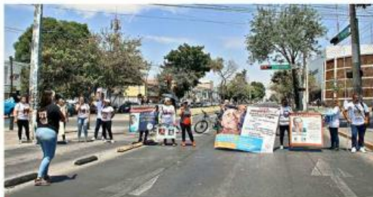
■ Los manifestantes cerraron el paso y buscaban hablar con la Fiscal Blanca Trujillo Cuevas.