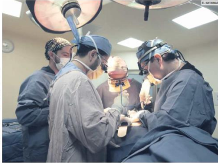
AL ALZA. Los procedimientos por cirugía estética se han incrementado año con año en el país.