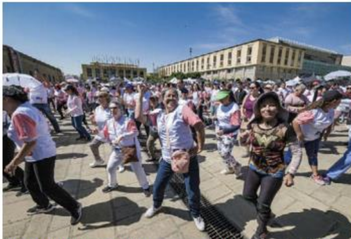
DEPORTE. Más de 5 mil personas arribaron a la explanada del Instituto Cultural Cabañas para participar en el Actíivate Conade, un evento para promocionar la actividad física.