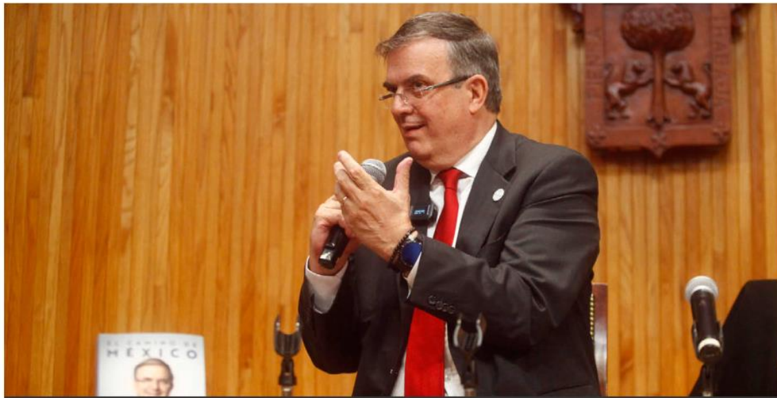
Marcelo Ebrard presentó su libro en el Paraninfo de la Universidad de Guadalajara.