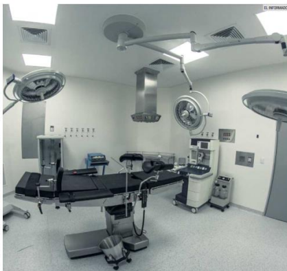
INFORMACIÓN. Es fundamental tener todos los datos tanto del médico que realizará una cirugía plástica, así como del lugar en el que se llevaría a cabo el tratamiento.

Su recuperación total fue de tres semanas.