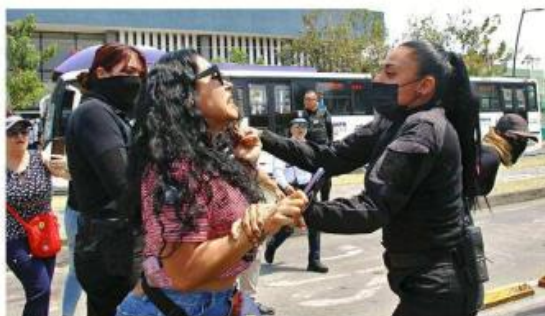
■ Policías del Estado forcejearon con las personas que protestaban en la Calzada Independencia y Hospital.

Poco después de las 12:00 horas salió de las oficinas y comentó a los manifestantes