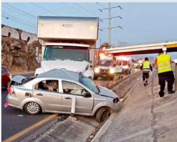
El accidente ocurrió a la altura de La Providencia.

Dos de los carriles de la autopista fueron cerrados por más de tres horas, lo que complicó la circulación en la zona. Personal del Servicio Médico Forense trasladó los cuerpos de las personas a la morgue de la Ciudad.