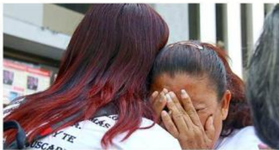
■ El bloqueo terminó cerca de las 15:00 horas, tras un diálogo.

que pidió hablar con la Fiscal Blanca Trujillo Cuevas y acordó que, si no le daban respuesta, cerraría la circulación en la calzada.