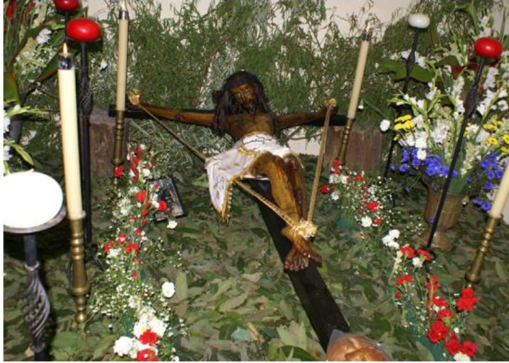
Algunas de las piezas que se exhibirán. ESPECIAL