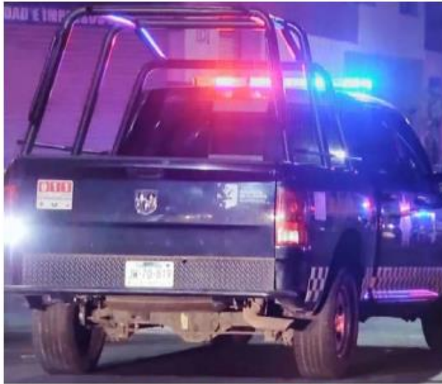
Los elementos pertenecen a la Policía de GDL.