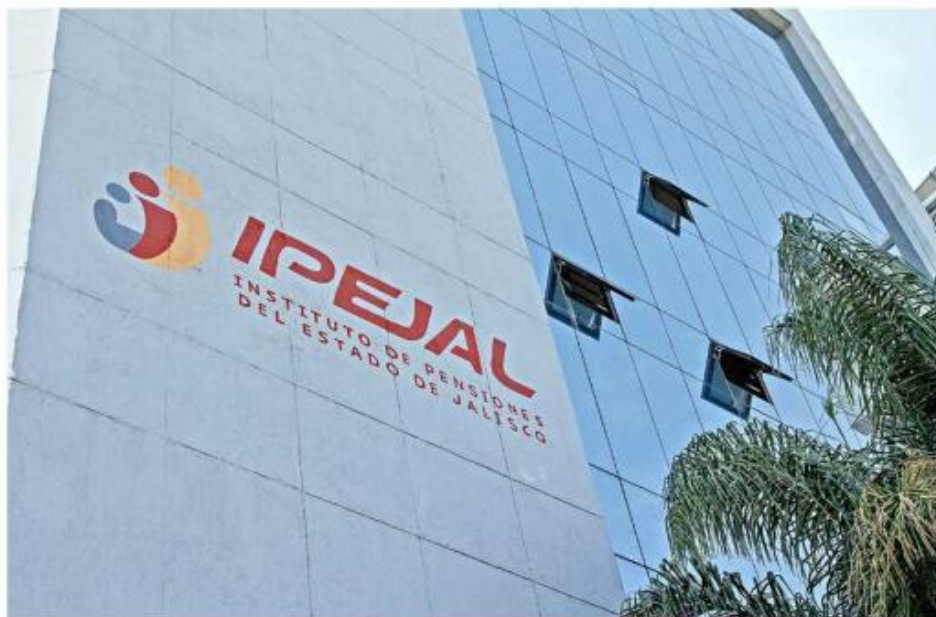
Alfaro pide también que los trabajadores den visto bueno a reforma al sistema pensionario.

"Después de la absurda resolución en el terreno judicial que permite que sigan existiendo 'pensiones doradas', vamos a ir a otro análisis para ver el camino que tenemos que seguir para poder terminar este abuso y este despropósito de gente inmoral que sigue recibiendo una pensión que no corresponde