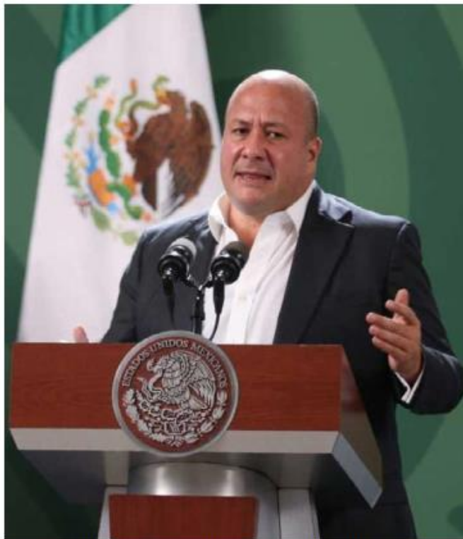
El gobernador no había sufrido problemas de salud.

En septiembre de 2014 Enrique Alfaro se sometió a una an-