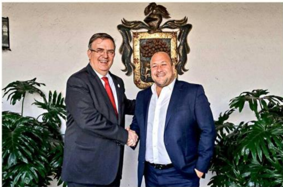
El Canciller Marcelo Ebrard se reunió con el Gobernador Enrique Alfaro en Casa Jalisco.

“Me dio mucho gusto recibir a @m_ebrard en Casa Jalisco. Es un hombre al que respeto y con quien desde hace muchos años he tenido una relación de amistad”, dijo el Gobernador.