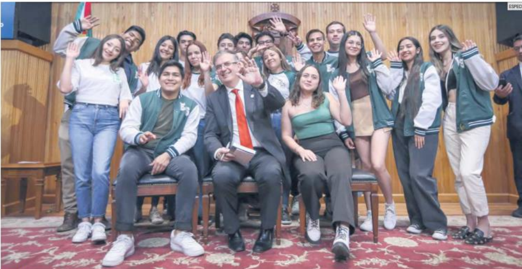
BIEN RECIBIDO. Marcelo Ebrard presentó su ponencia en el Paraninfo de la Universidad de Guadalajara.

"Digamos, canciller, a los universitarios, si en el libro podemos encontrar las pistas de cómo va a combinar cabeza, corazón y carácter cuando se tenga que decidir. ¿A poco no dan ganas de leerlo?", finalizó.