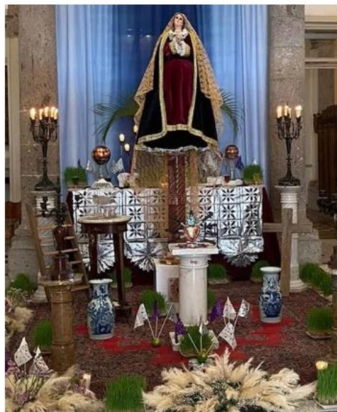
El altar de Viernes de Dolores. ESPECIAL

Los horarios de atención de la Casa Museo López Portillo son de martes a sábado de 10:00 a 17:00 h. los domingos de 10:00 a 15:00. Para el Viernes de Dolores los horarios se extenderán hasta las 21:30 horas.