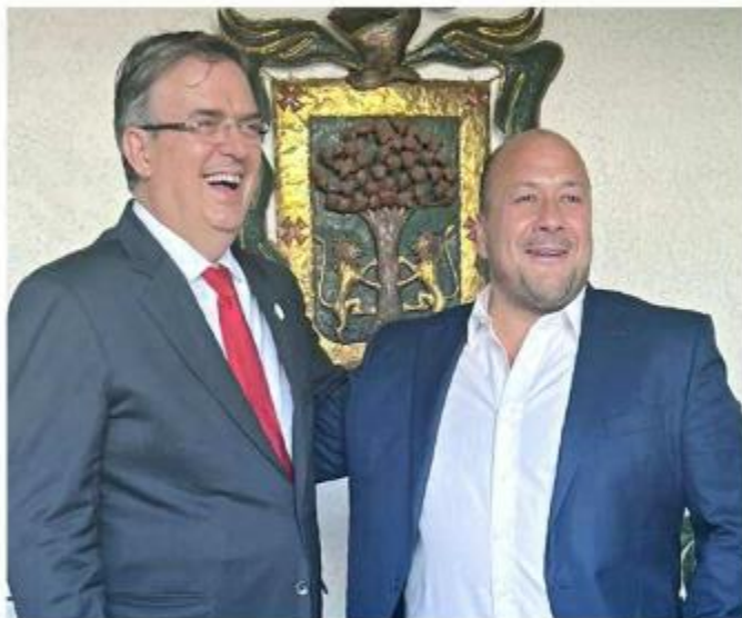
■ Enrique Alfaro (der.) recibió ayer en Casa Jalisco al Canciller Marcelo Ebrard, quien le deseó una pronta recuperación.

“El día de hoy (ayer) por la tarde, hace unos minutos, acaban de hospitalizar a Enrique Alfaro, me pidió que se los comunicara con mucha responsabilidad, se sintió mal y por eso no nos pudo acompañar”, dijo el funcionario, quien acudió al evento partidista en representación del Gobernador.