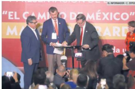
ACUERDO. El Consejo Regulador del Tequila formalizó su convenio con la Secretaría de Relaciones Exteriores.