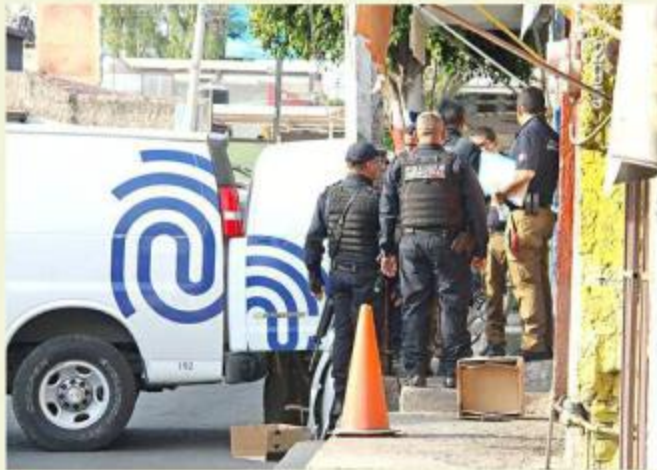
■ Un homicidio se registró en Las Huertas.

Policías municipales resguardaron la escena del