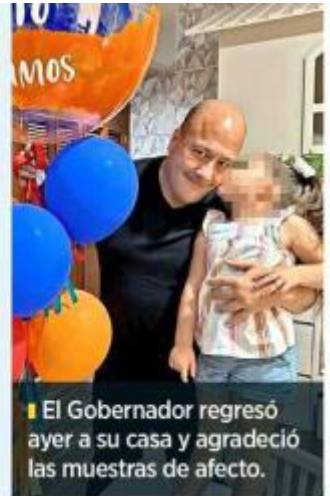
El Gobernador regresó ayer a su casa y agradeció las muestras de afecto.

Hasta el cierre de esta edición no se precisó cuál fue el padecimiento que le detectaron al Gobernador, quien agradeció las muestras de apoyo y afecto.