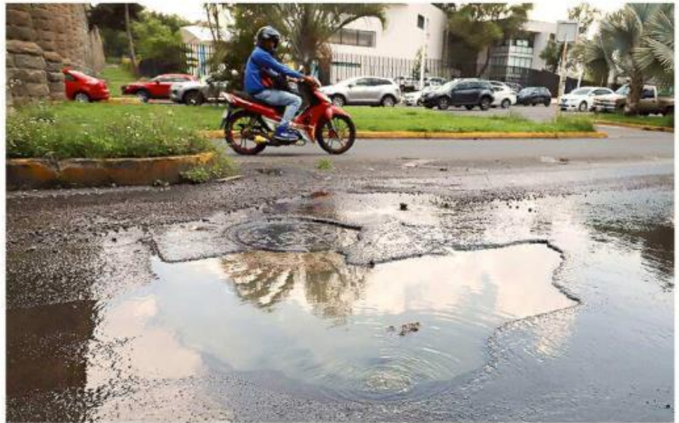
Algunos usuarios aseguran que han reportado fugas durante semanas.

cierre de válvulas para aislarla y se procede a su localización y reparación, además de considerar variables como la duración de la misma, el tipo de daño en la red, el diámetro y la presión hidráulica, entre otras”.