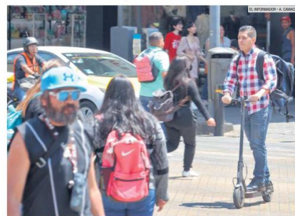
CAUIDADO. Si bien el uso del patin eléctrico está en aumento, los usuarios deben cumplir con las indicaciones mínimas de seguridad, pues no están exentos de accidentes viales.

En su programa de Movilidad Activa pública que se propone iniciar a desarrollar una estrategia que incentive la participación de estas empresas de STIR en la ciudad, “que nos permita incrementar la oferta tanto de vehículos como de cobertura de movilidad activa de la mano de la participación de la iniciativa privada. Por lo que se plantea realizar acercamientos con las empresas que prestan servicios de STIR privados, para la formulación de una agenda en conjunto”.