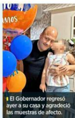
El Gobernador regresó ayer a su casa y agradeció las muestras de afecto.

Hasta el cierre de esta edición no se precisó cuál fue el padecimiento que le detectaron al Gobernador, quien agradeció las muestras de apoyo y afecto.