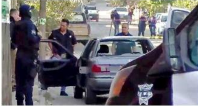
■ Vecinos de San Pedrito encontraron el cadáver de un hombre a bordo de un vehículo abandonado.