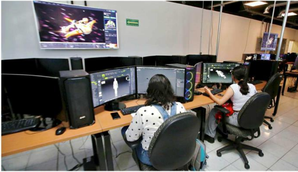
Las instituciones renuevan sus programas académicos para las exigencias laborales actuales.

Quiéren industrias creativas, tecnología, empresas y gastronomía