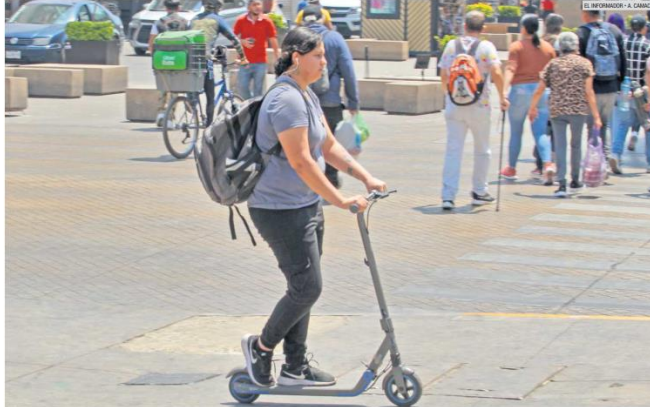
ALZA. El uso de "scooters" aumentó en la ciudad. Los usuarios deben respetar la Ley de Movilidad, en la que el peatón es el actor principal.

Se consideran como un vehículo no motorizado, mientras no alcancen más de 25 kilómetros