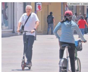
ATENCIÓN. Muchos usuarios del patín eléctrico acostumbra no portar casco durante sus viajes.

"Para mí la experiencia es buena por el ahorro de tiempo y menor gasto por lo que ahorras