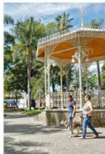
De acuerdo con el Instituto Estatal de Información Estadística y Geográfica, se estima que Chapalita tiene una población de 18 mil habitantes.

También, la Glorieta Chapalita mantiene un programa inintermitido de actividades artísticas y culturales.