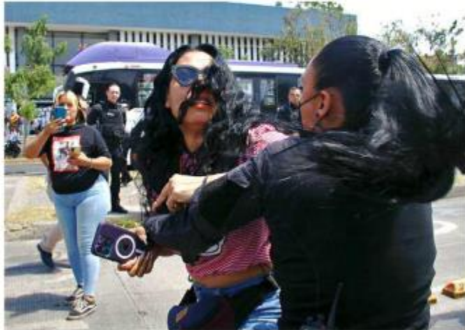
■ Policías estatales forcejearon con manifestantes el viernes.

MURAL reportó que el colectivo Luz de Esperanza y familiares de Esthela blo-