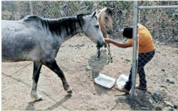
Los animales serán atendidos en el hospital La Hípica.