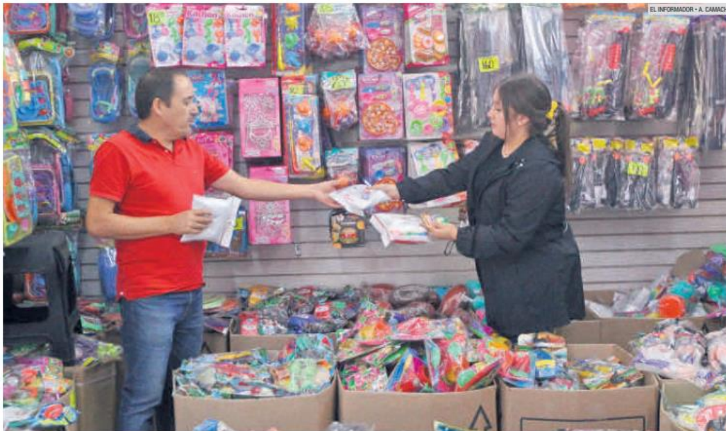
POSITIVO. Las nuevas plazas creadas en Jalisco durante los primeros dos meses del 2023 representan la cifra más alta de generación de empleo desde 1997.

Zapotlán El Grande fue el que mayor pérdida de empleos formales tuvo en el mes, con -604 trabajadores. Le siguen, Chapala con -583 y Ahualulco de Mercado con -165 empleos formales.