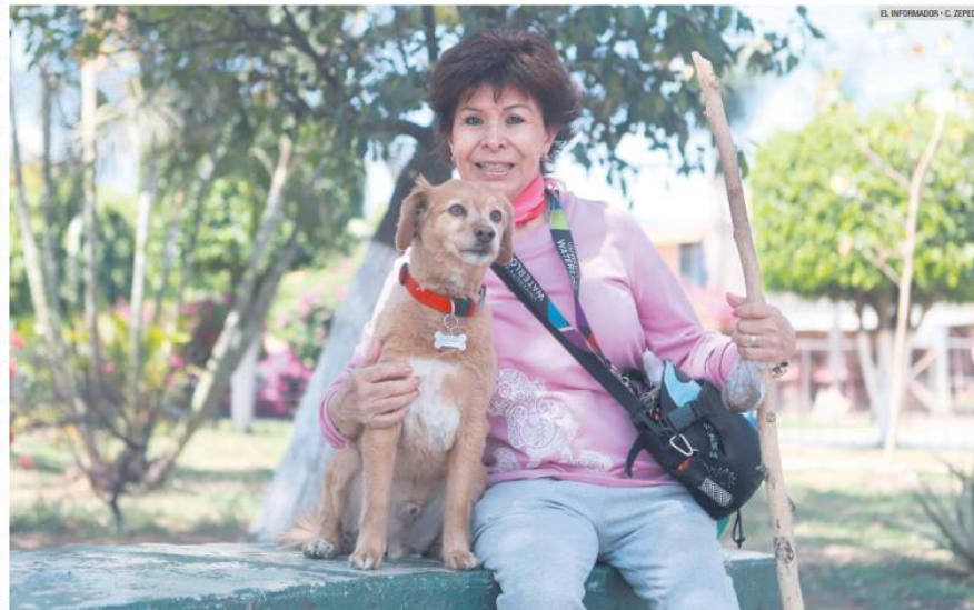
CONVIVENCIA. Vecinos pueden disfrutar con sus familias y con sus mascotas, gracias a la vigilancia en el lugar.