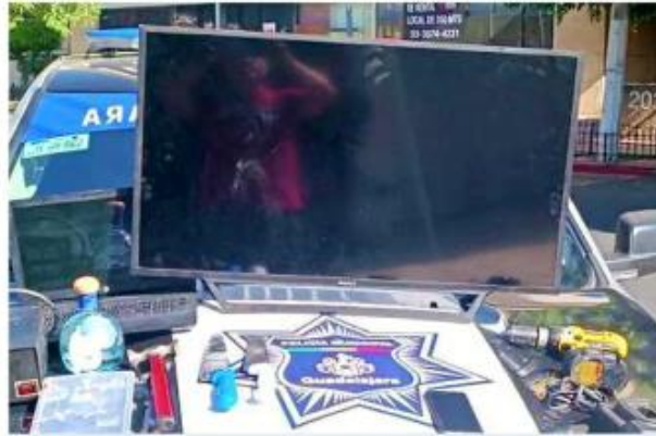
■ Había desde un televisor hasta una botella de tequila entre lo robado.