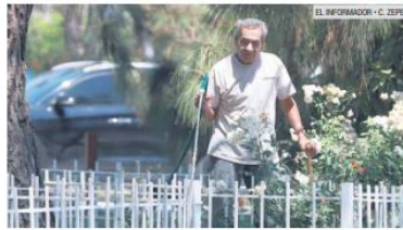
COMPROMISO. La organización vecinal permite tener un ambiente más seguro.

Estos ciudadanos se coordinaron con grupos de emergencia, donde se cuenta con la participación de comandantes de sector y capitanes de la Policía, además de teléfonos que funcionan las 24 horas, donde se reciben reportes preventivos (vehículos o personas sospechosos, o en estado inconveniente; incluso, situaciones de desaparición), que han tenido siempre una respuesta inmediata. "Además, hay reuniones mensuales o bimestrales con el comandante de sector y los líderes de cuadra, para retroalimentar. La coordinación es evidente y