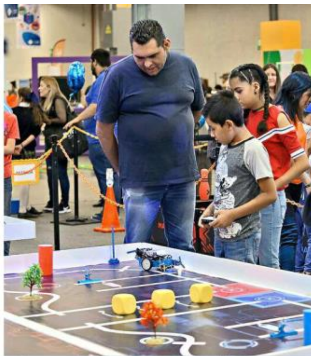
■ Es un espacio educativo para que los asistentes se capaciten en diferentes disciplinas.

Para las personas interesadas en inscribirse, pueden hacerlo a través de la página web www.recrea-land.mx . Se podrá participar tanto de forma presencial como virtual y la inscripción es totalmente gratuita.