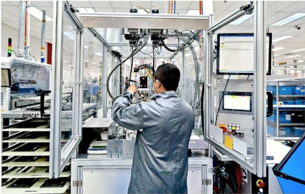
■ Buscan mejorar la condición laboral y emocional de los colaboradores.