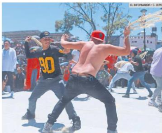
SALDO. Protección Civil y Bomberos de San Pedro Tlaquepaque informó que solo hubo dos personas con heridas leves que no requirieron acudir a un hospital.

Para culminar con las actividades de la Jueza 2023, ayer se llevó a cabo la tradicional "cuereada" del Sábado de Gloria en la plaza principal de San Martín de las Flores, en Tlaquepaque, una actividad que reunió a más de cuatro mil habitantes que presenciaron los "cuerosos" entre devotos. Los que estuvieron en torno al atrio de la parroquia de la comunidad vieron cómo los participantes se "cuerearon" con cuerdas de gente, simbolizando la oportunidad de "limpiar" los pecados de quienes ofendieron a Jesús en su camino a la cruz. Los primeros en tomar la tarama fueron los personajes que participaron en la representación de la Jueza, quienes disfrazados con capas, pantalones de manta y descubiertos del pecho comenzaron con el espectáculo, que estuvo amenizado con música de banda.