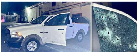
La agresión ocurrió el viernes a las 23:00 horas en el kilómetro 86+200 de la Carretera Encarnación-Lagos de Moreno.

encontrado sin vida en el asiento del conductor, mientras que el subdirector alcanzó a ser llevado al hospital, donde declararon su muerte en la madrugada de ayer.