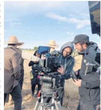
CINE. "Concepción. La Película" es una producción de Cross Entertainment.

Concepción nació el 8 de diciembre de 1862 en San Luis Potosí, fue la séptima de 12 hermanos. Llegó a este mundo en la fiesta de la Inmaculada Concepción de María, de ahí el origen de su nombre. Según se describe en el sitio oficial de la película https://concepcionlapelicula.com/es .