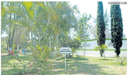
BUENAS PRÁCTICAS. Vecinos mantienen limpia la colonia y el Ayuntamiento da seguimiento a los servicios públicos.

mento contra el ruido, con el que se busca crear condiciones para que los vecinos que sientan vulnerado su descanso tengan herramientas para reportar estos incidentes. En la pasada administración, en febrero de 2020, la alcaldía se encargó de la apertura de la oficina Recaudadora número 12 en Plaza Ciudadela Urban Village, para acercar los servicios de pagos y trámites municipales a los habitantes del sur del municipio, como Arboledas, Pasos del Sol, Jardines Tepetlac y El Colli, entre otras zonas. Y se realizó una inversión de 78 mil pesos para la compra de cámaras de videovigilancia, alarmas, luminarias y material para mantenimiento de la infraestructura, además del remozamiento de sanitarios en la Secundaria Técnica 45. Lo anterior, como parte del programa "Zapopan Escuela Segura", en busca de beneficiar a casi dos mil alumnos.