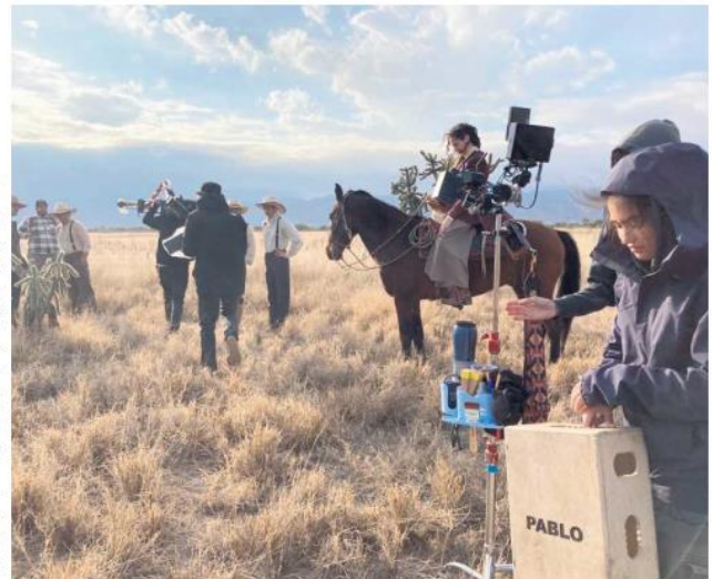
RODAJE. La cinta fue filmada en San Luis Potosí.

"El personaje es bastante amplio, cuando me dijeron que lo iba a interpretar, sentí