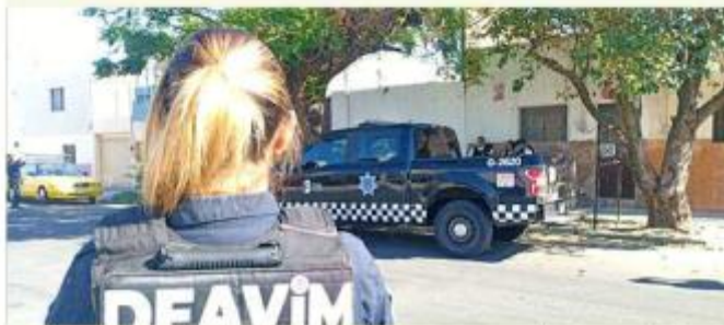
■ Un reporte ciudadano alertó sobre una mujer que estaba siendo agredida en la Colonia Blanco y Cuéllar.