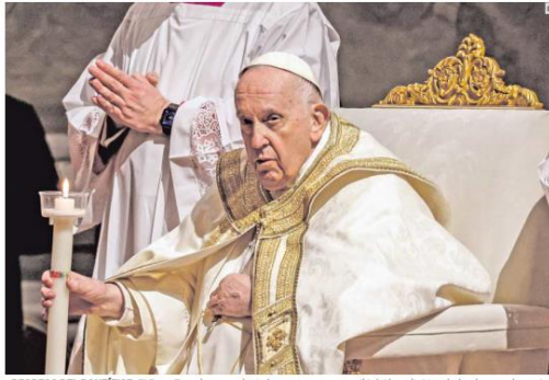
REGRESO DEL PONTIFICE. El Papa Francisco, que justo hace una semana salió del hospital tras haber ingresado por los problemas que le causó una bronquitis, presidió el rito en la Basílica de San Pedro.