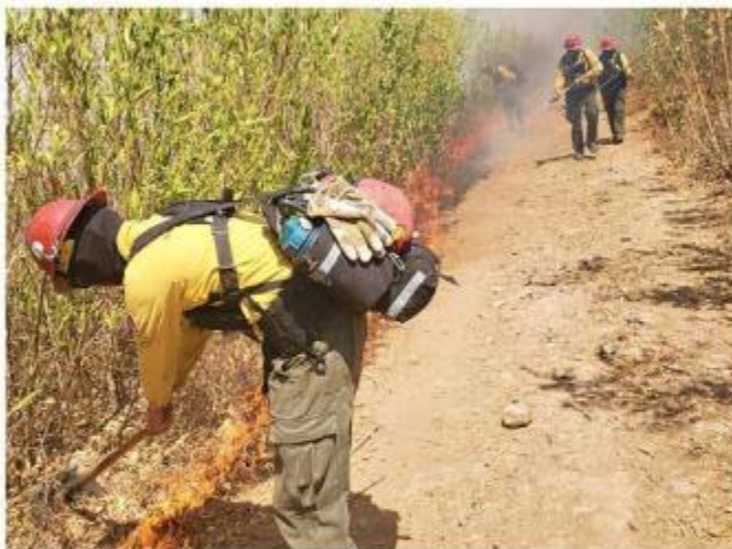
Por el incendio ocurrido en Cerro Viejo, en Tlajomulco, se activó una alerta atmosférica en municipios del AMG.

Por el panorama adverso se han resentido las afecta-