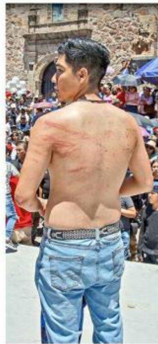
Se queda con lesiones tras participar en esta actividad.

Durante los tres días de actividades Protección Civil reportó saldo blanco.