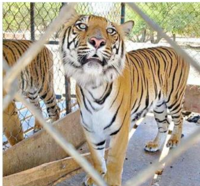
También hallaron 10 tigres, 3 de ellos cachorros.