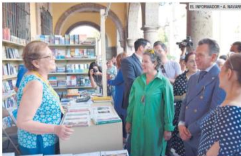
CULTURA. Autoridades recorren la Feria Municipal del Libro de Guadalajara.

Para conocer el catálogo completo de esta editorial o adquirir alguno de sus libros, ingresa a mandragoraediciones.mitiendanube.com ; cuenta con envíos a todo México.