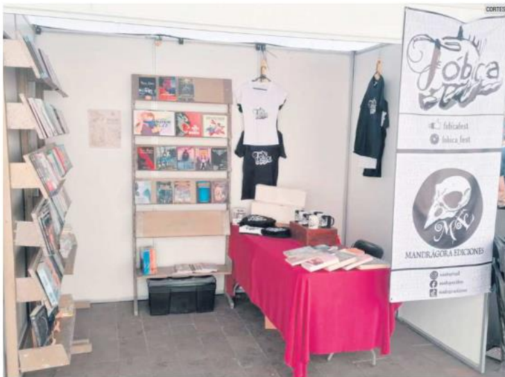
PARTICIPACIÓN. Mandrágora Ediciones está en el Stand 16 de la Feria Municipal del Libro de Guadalajara.

Además de contar con una variedad de actividades, la feria de este año también se caracterizará por contar con literatura de diversos géneros, y como prueba