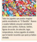
Todos los juguetes que puedas imaginar podrás encontrarlos en “El Baratillo”. Nuevos o usados hallarás una gran variedad de piezas como camión, muñecas, barbie, figuras de acción, de colección, legos, rompecabezas, incluso juguetes de antaño que te traerán recuerdos que quizá ya habías olvidado.