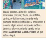
Jaulas, peceras, alimento, juguetes, accesorios, camas y hasta una estética canina, se hallan especialmente en la plaza del Parque Mirador. Si encuentras a la venta algún animal o mascota exóticos denuncia al Ayuntamiento basado en las líneas 33330898 o 3338172938, ya que esto es ilegal.