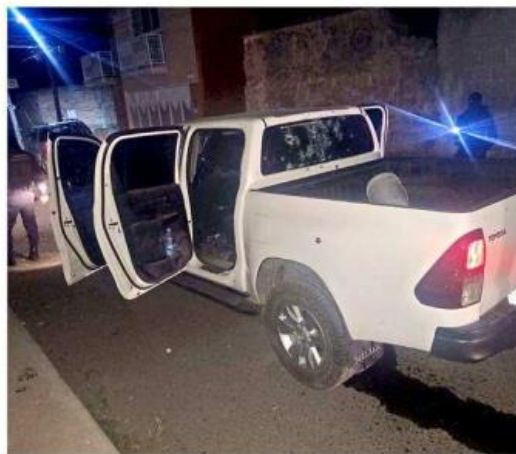
■ Dos de los vehículos baleados contaban con reporte de robo.

A dos cuadras del primer punto, en el cruce de Pariancito y Privada Pariancito, se hallaron una Toyota Hilux con placas de Aguascalientes,