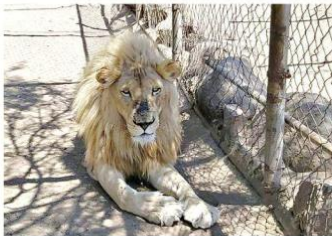
Entre los animales localizados había cinco leones.

Semanas antes, las autoridades hallaron un águila y un oso negro disecados, además de un colmillo blanco y pieles de león y ocelote, en Tepatlán.