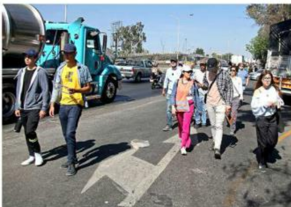
La seguridad peatonal ocupa el último lugar en el presupuesto.

El tema de “acupunturas urbanas”, presente en la planeación del Gobierno de Jalisco, debe garantizar conectividad y continuidad con el resto de las opciones para moverse, añadió.