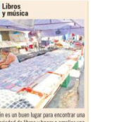
También es un buen lugar para encontrar una gran variedad de libros y hacer o ampliar una biblioteca. En cuanto a la música, hallarás desde un acordeón, un CD o vinilo, hasta memorias USB con música pregrabada para animar tus eventos, o simplemente pasar la tarde escuchando a tus artistas favoritos.