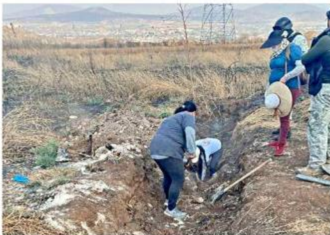
■ El colectivo ha realizado búsquedas en diferentes municipios.

“Fue a lo puro loco (la búsqueda), el MP ni siquiera sabe hacer algunos cuadrantes en el terreno para descartarlo todo y prácticamente las cosas las hicieron a fuerzas; lo que querían era irse porque ya era la una y media y ya le estaban diciendo a mi herma-