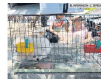
OFERTA. Diversos animales, domésticos y exóticos, se pueden conseguir en el tianguis.

Los animales exóticos forman parte de las mercancías que lamentablemente suelen ser ofrecidas en "El Baratillo", intentando burlar a las autoridades.