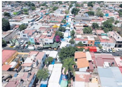
EL MÁS GRANDE. "El Baratillo" cuenta con más de cuatro mil 500 puestos registrados, aunque operan otros sin regulación.

Del total de animales, más de 500 correspondieron a las aves y alrededor de 100 a insectos y reptiles. El resto eran perros, arañas, conejos y hasta un primata, de acuerdo a datos oficiales.