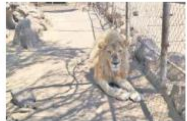
LA BARCA. En el inmueble aseguraron 10 tigres, seis jaguares, cinco leones, dos antílopes y una llama, entre otros.

disposición del Ministerio Público para continuar con la carpeta de investigación correspondiente, por el delito de