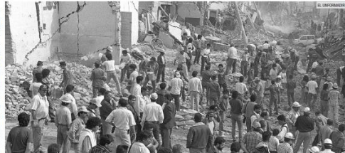
SOLIDARIDAD. La ciudad de Guadalajara dio una mano a todos los afectados de la tragedia en el Sector Reforma.

Agregó que no se busca que se les adhiera al fideicomiso, sino que este tipo de eventos públicos y sus representantes dejen de realizarse, ante una situación "injusta y corrupta" a más de tres décadas de ocurrida.