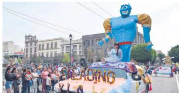
CREATIVIDAD. En este evento participaron diferentes preparatorias y centros académicos de la Universidad de Guadalajara con carros alegóricos.

Todos los carros alegóricos acompañados de grupos con disfraces, maestros que fungían como coordinadores del desfile y todos marcando el proyecto con el que, siguiendo las bases de una convocatoria, tomaron parte en el desfile.