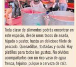
Toda clase de alimentos podrás encontrar en este espacio, desde unos tacos de awala, ligito o pastor, hasta un delicioso filete de pescado. Quesadillas, tostadas y sushi. Hay platillos para todos los gustos. No olvides acompañarlos con un rico vaso de agua fresca, hijas, purique o cerveza de raíz.