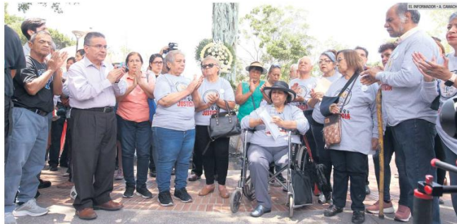
EVENTO. A 31 años de la tragedia, los afectados asistieron al parque de San Sebastián de Análico para dejar una ofrenda por las víctimas.

Todos los beneficiarios tendrán un aumento en el monto que perciben mensualmente