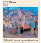
“El Baratillo” siempre sorprenderá por lo que puedes encontrar en él. Por ejemplo, una sala convertible, una sesión de masaje o una consulta psicológica, aunque no quedan de lado los comestibles, los pasteles de dulces o artículos para celulares, solo por mencionar algunos.