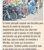
Si tienes pensado comprar una bicicleta para hacer tu medio de transporte, o simplemente para llevar una vida más saludable o salir a pasear, en este tianguis encontrarás una gran variedad de bicis de todo tipo, para la ciudad, de montaña o híbridas, así como sus accesorios y refacciones. También podrás encontrar todo lo que tengas que ver con motocicletas.