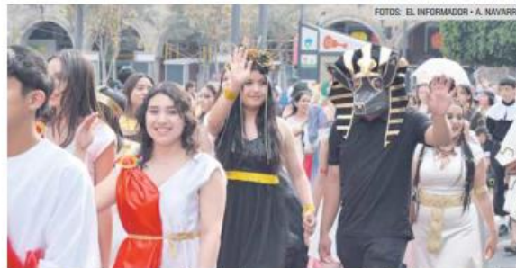
TALENTO. Desfilaron contingentes de alumnos caracterizados como personajes de diferentes obras literarias.