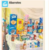
En este tianguis puedes surgir tu despesa entre. Puedes encontrar desde la papa de la semana, la caja de cereal, latas de atún, aceite, jalone, champi, lo que necesitas para llenar la alacena estará aquí.