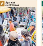
Entre los artículos electrónicos que se venden en “El Baratillo”, por ejemplo, hay freidoras de aire, hornos microondas, secadoras para cabello, planchas y televisores, entre muchos otros más.