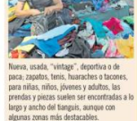
Nueva, usada, “vintage”, deportiva o de picnic, zapatos, tenis, huacaches o barcones, para niños, niñas, jóvenes y adultos, las prendas y piezas suelen ser encontradas a lo largo y ancho del tianguis, aunque con algunas zonas más destacadas.