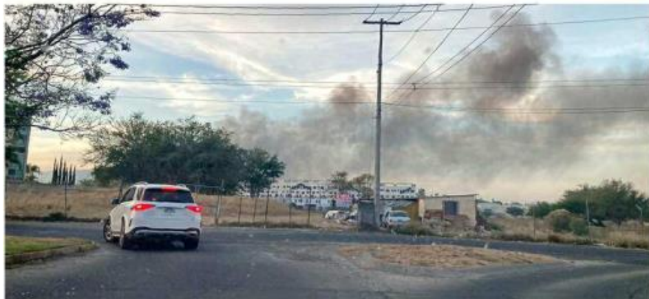
El martes 18 de abril la columna de humo se podía apreciar durante el día.