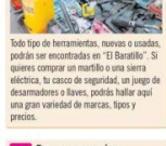
Todo tipo de herramientas, nuevas o usadas, podrás ser encontradas en “El Baratillo”. Si quieres comprar un martillo o una sierra eléctrica, tu casco de seguridad, un juego de destornilladores a mano, podrás hallar aquí una gran variedad de marcas, tipos y precios.