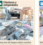
Es esta área del tianguis podrás encontrar cosas de segunda mano y antigüedades que quizá ni siquiera hubieras imaginado. Lámparas, monedas, seleros, gartera, postales, cables, teléfonos viejos, máquinas de escribir, computadoras y cuadros para adornar tu sala.