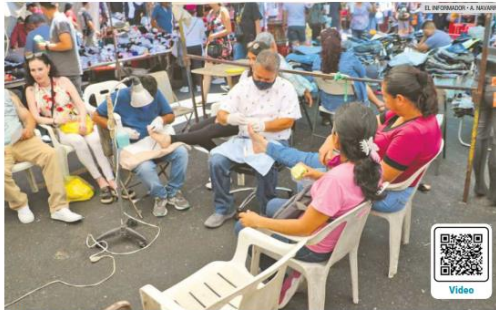
VARIEDAD. En "El Baratillo" hay cuatro mil 500 puestos registrados ante el Ayuntamiento. Y encierras de todo, hasta podólogos y masajistas.

En el tradicional tianguis encierras de todo y es considerado como uno de los más grandes de Latinoamérica