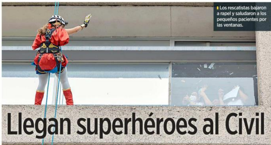
Los rescatistas bajaron a rapel y saludaron a los pequeños pacientes por las ventanas.