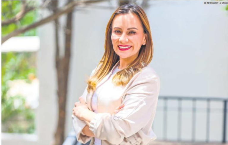
CAMPAÑA. La candidata comparte para los lectores de EL INFORMADOR su visión de la política y algunas experiencias personales.