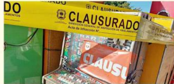
El efectivo que se encuentre dentro de las máquinas decomisadas irá a la Tesorería Municipal.

nes incautados por violar el reglamento, los cuales se quedarán en la bodegas de la Dirección de Inspección y Vigilancia durante cierto periodo, pero cuando se cumpla el plazo y si el contribuyente que cometió la infracción no ha pagado la multa, la mercancía e inmuebles se usarán para su distribución entre "personas de escasos recursos".