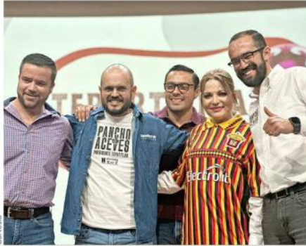
Delgadillo atendió las inquietudes de los estudiantes del Centro Universitario de Los Altos.

Los candidatos a la Gubernatura de Jalisco realizaron propuestas tanto en favor de procurar la salud psicológica de estudiantes, así como fortalecer las condiciones carreteras y dar impulso a ganaderos y lecheros.