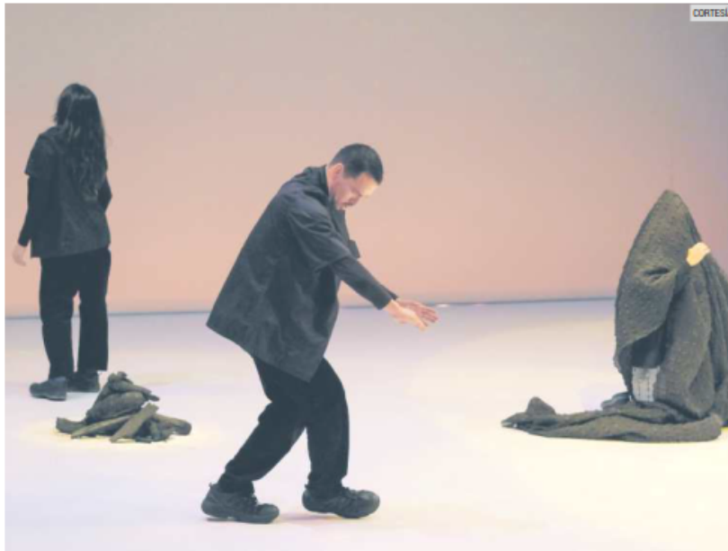
PROPUESTAS. Una jornada llena de opciones para toda la familia.

Este 29 de abril se conmemora el Día Internacional de la Danza y entre las actividades del programa Re Unirnos, destacan tres presentaciones con las que se cerrarán las celebraciones dancísticas, que comenzaron el pasado 14 de abril con la presentación de “Leib”, en el Teatro Degollado.