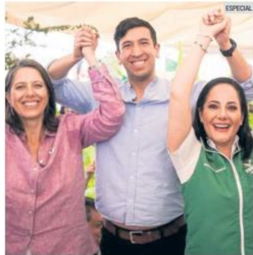
PROYECTO. El representante de Futuro acompañado por las candidatas de la coalición en la Colonia Miramar.

"Para nosotros es prioridad devolver los espacios públicos a la gente. Cuando el dinero del pueblo no se desperdicia en los negocios de unos cuantos, resulta que las calles ya no se inundan, que la basura no se acumula afuera de las casas, que los terrenos baldíos se convierten en parques y que Miramar puede tener la unidad deportiva que tanto merece", indicó.