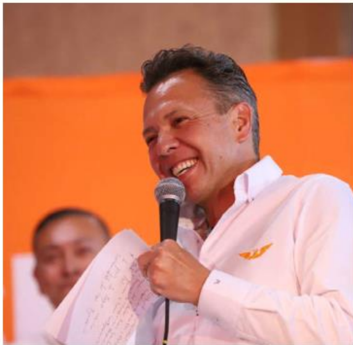
Aseguró que apoyará a productores de maíz.