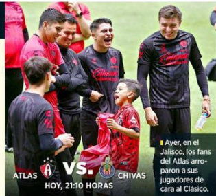
Ayer, en el Jalisco, los fans del Atlas arrojaron a sus jugadores de cara al Clásico.

"Iremos a buscar esos 3 puntos que nos ayuden para la siguiente temporada y terminarla con una alegría para nuestros aficionados", comentó Camilo Vargas, portero de los Rojinegros.