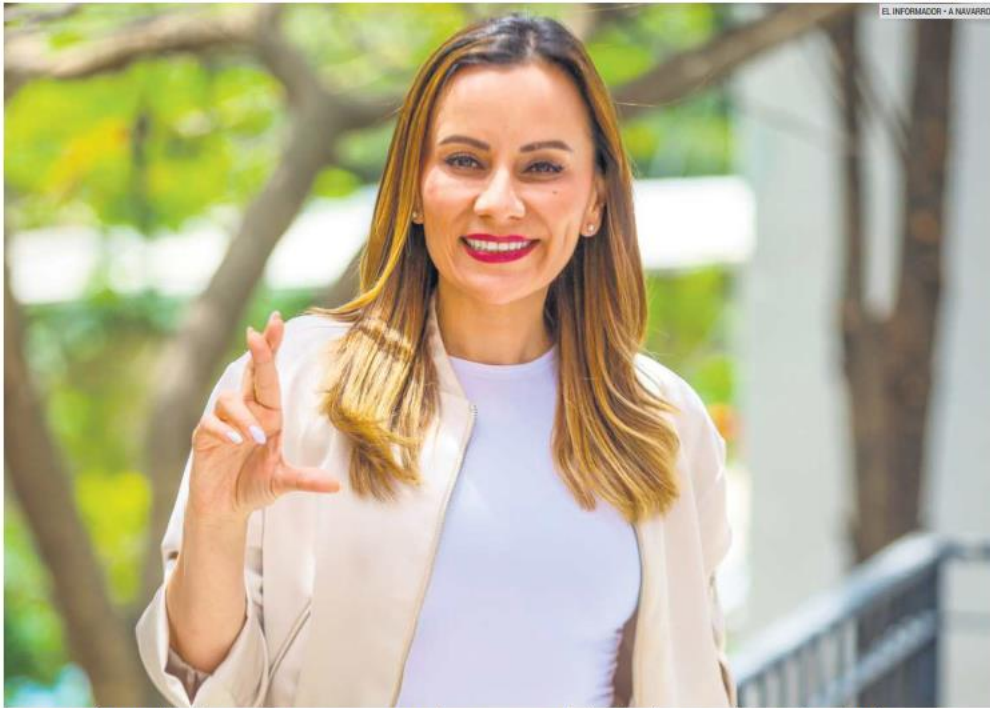
COORDINACIÓN. La candidata de la coalición "Fuerza y Corazón por Jalisco" apuesta por el trabajo colaborativo entre los diferentes niveles de Gobierno.