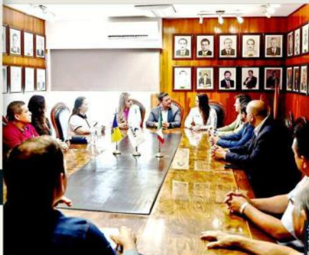
Haro señaló que se debe priorizar el cuidado del medio ambiente en el desarrollo de proyectos de infraestructura.

“Esta tarde nos reunimos con un grupo de empresarios industriales de la región. Antes de presentar mis propuestas, les agradecí por ser quienes le apuestan a nuestra patria, pero sobre todo, por ser una fuente de empleos para cientos de familias”, compartió sobre el encuentro en sus redes sociales.