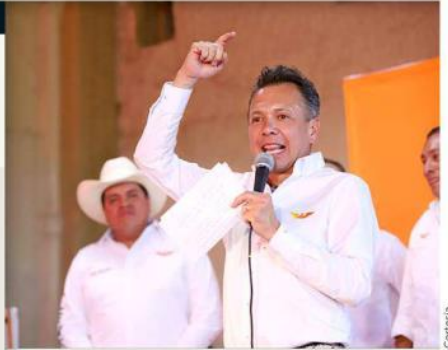
Lemus se comprometió a mejorar la atención médica, brindando atención las 24 horas.