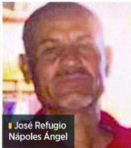
José Refugio Nápoles Ángel