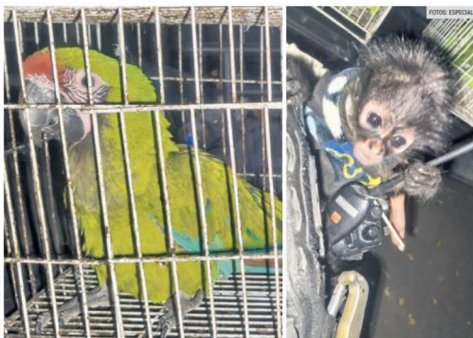
EL BARATILLO. Al detenido le aseguraron un mono araña, cinco loros cucha, una guacamaya verde, además de una boa y varias tarántulas durante el operativo.