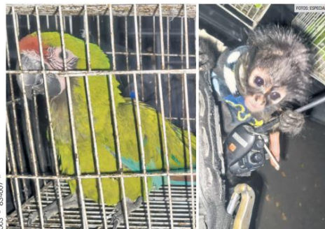
EL BARATILLO. Al detenido le aseguraron un mono araña, cinco loros cucha, una guacamaya verde, además de una boa y varias tarántulas durante el operativo.