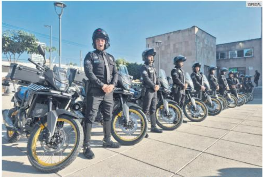
EQUIPADOS. Autoridades estatales dieron el banderazo de salida a las 140 motocicletas, que reforzarán la vigilancia vial y de seguridad en Jalisco.