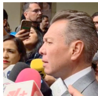
El Gobernador dijo que es una campaña de desinformación con tintes políticos.

"Son mentiras. Es una campaña orquestada principalmente a través de redes sociales para golpear al Gobierno Federal, pero denostan gravemente a Jalisco", insistió.