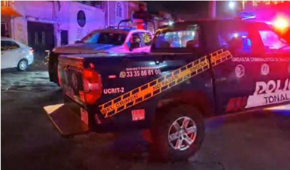
Los afectados fueron atacados al salir de un establecimiento. ROBERTO HURTADO