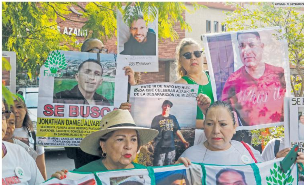
LUCHA CONSTANTE. Integrantes de colectivos y activistas se manifiestan para exigir justicia y avances en la búsqueda de personas desaparecidas.

Autoridades estatales y municipales fueron señaladas por violaciones graves