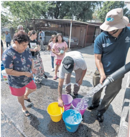
ADELANTE. El SIAPA reprogramó el corte de agua en enero para evitar la suspensión del servicio durante la temporada de la Semana Santa, cuando el consumo es mayor. Habrá servicio gratis de pipas en el 073.

Siga las noticias minuto a minuto en: www.informador.mx