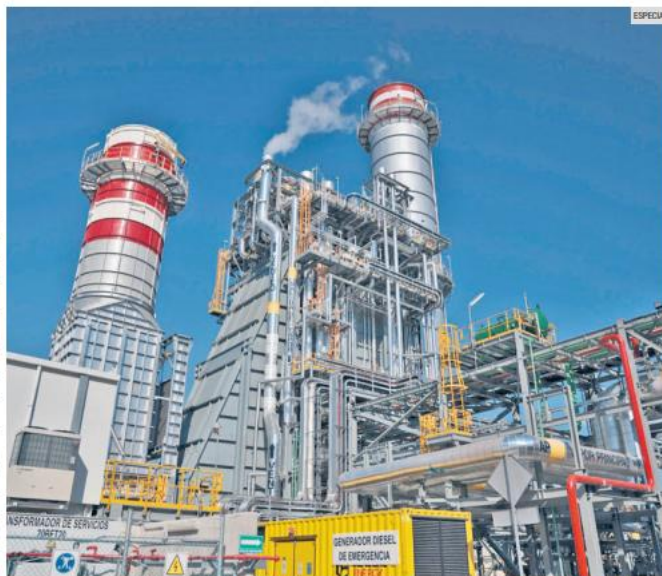
El pasado 20 de diciembre, en Pedro Escobedo, Querétaro, la Presidenta Claudia Sheinbaum inauguró la Central de Ciclo Combinado "Josefa Ortiz de Domínguez".

De acuerdo con cifras del Centro Nacional de Control de Energía (CENACE), la región Noreste del país—que incluye el principal corredor industrial de Nuevo León—registra una demanda neta cercana a los 6 mil