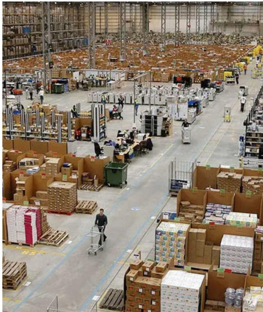
México es de los pocos países en los que el comercio digital tiene amplia competencia.

Otra recomendación fundamental es priorizar las compras en comercios formales que cuenten con respaldo legal, tiendas físicas y plataformas digitales oficiales. Esto permite al consumidor acceder a garantías, políticas de devolución y mecanismos de atención en caso de que el pro-