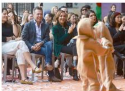
Niñas, niños y adolescentes disfrutaron.

Durante el encuentro se realizó un festival artístico, con bailables navideños y presentaciones musicales, entre ellas