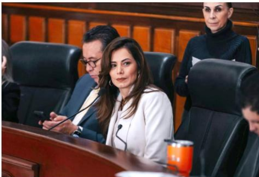
La alcaldesa dijo que con el aumento se reconoce el trabajo cotidiano de los servidores públicos.

La administración municipal indicó que esta decisión forma