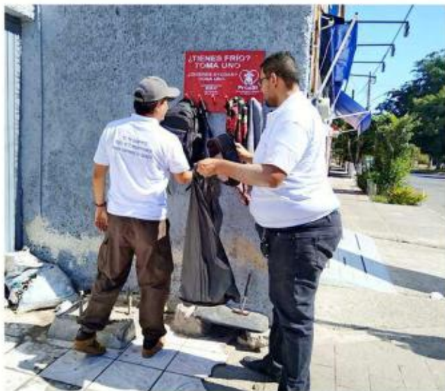
Los percheros se instalan en la vía pública para beneficio de personas en situación de calle y vulnerabilidad.

“Era el único Estado que nos hacía falta (del norte) (...)”