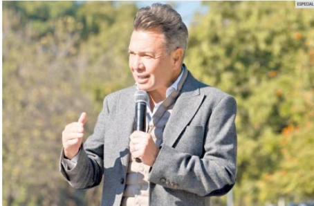
REUBICACIÓN. La central de ciclo combinado que originalmente se proyectó en Juanacatlán no se cancelará en Jalisco. Pablo Lemus prevé instalarla en otro municipio cercano al AMG. En enero se darán los detalles.

La postura del Ejecutivo estatal contrasta con la evaluación técnica de especialistas del