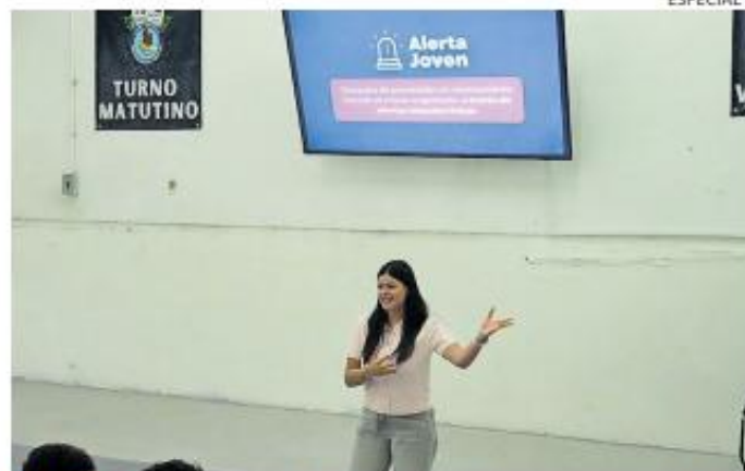
A CARGO. Las acciones de Alerta Joven son impulsadas desde la Dirección de Juventudes del gobierno del estado.

Como parte de Alerta Joven, estudiantes han presenciado exhibiciones del Escuadrón canino K9, donde se muestra como los binomios detectan narcóticos, explosivos y personas a tra-