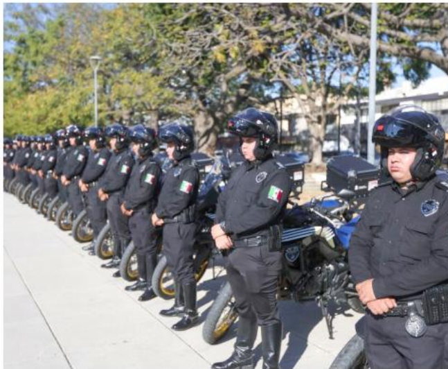
De las unidades entregadas, 80 fueron destinadas a la Policía Estatal Preventiva y 60 a la Policía Vial.