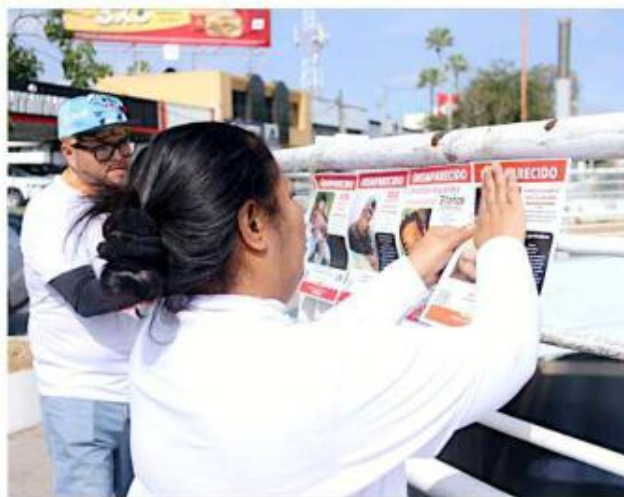
Las autoridades siguen fallando en torno al tema de desaparecidos.

La CEDHJ acreditó actuaciones deficientes del Ministerio Público, Policías