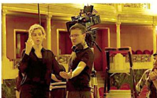
La película Ceremonia, que se filmó en el Teatro Degollado, estuvo entre las obras beneficiarias de Industria Local 2024 de Filma Jalisco, con 2 millones 987 mil 928 pesos.

Este año, quien consulte los resultados de la convocatoria Industria Local 2025 encontrará únicamente una lista de proyectos seleccionados organizados por categorías: largometrajes, cortometrajes, festivales, cursos y reescrituras de guiones, pero sin ninguna cifra asociada. Tras solicitar información a través de la Plataforma