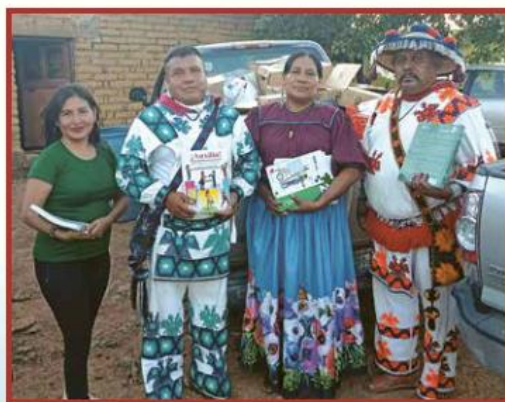
Los pueblos originarios de Jalisco se encuentran entre los grupos sociales de Jalisco con los cuales trabaja de cerca la organización Casa Cem.

Creada por dos mujeres en un espacio doméstico, con el simple fin de separar la basura, esta iniciativa está por cumplir dos décadas de ser parte esencial en la gestión de los residuos y el reciclaje en Jalisco