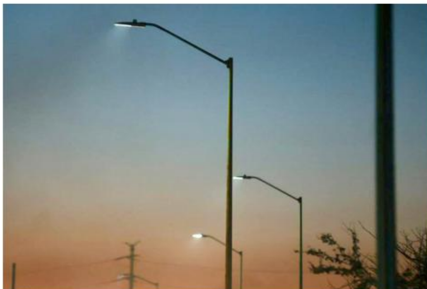
Se han colocado alrededor de 32 mil luminarias.

Durante diciembre inició la segunda etapa del programa, que incluye la instalación de tres mil 444 luminarias en vialidades y zonas habitacionales como Pedro Parra, avenida 8 de Julio, Circuito Sur a la altura de Santa Cruz de