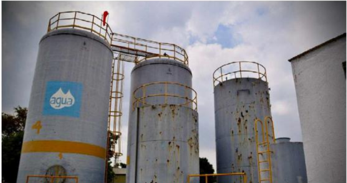
Realizarán trabajos de mantenimiento preventivo en la planta de la zona.