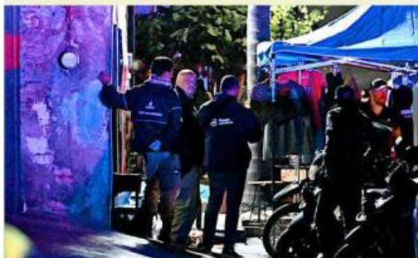
■ El multihomicidio se dio afuera de un bar en Tonalá.

Tras el tiroteo, las autoridades encontraron a "La Güera" junto a dos hombres muertos en el sitio, mientras que otra víctima que resultó lesionada en una pierna llegó a un puesto de socorro por su cuenta.