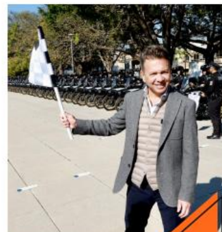
El mandatario confirmó que existen al menos cinco denuncias.

"Los partidos políticos aquí es donde deben verdaderamente echarles un ojo a los perfiles", puntualizó.