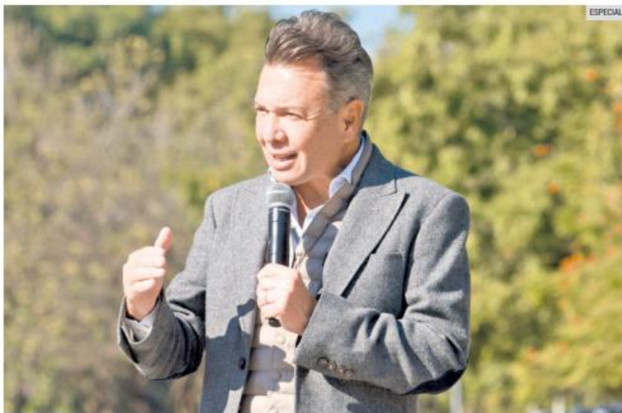
REUBICACIÓN. La central de ciclo combinado que originalmente se proyectó en Juanacatlán no se cancelará en Jalisco. Pablo Lemus prevé instalarla en otro municipio cercano al AMG. En enero se darán los detalles.

La postura del Ejecutivo estatal contrasta con la evaluación técnica de especialistas del