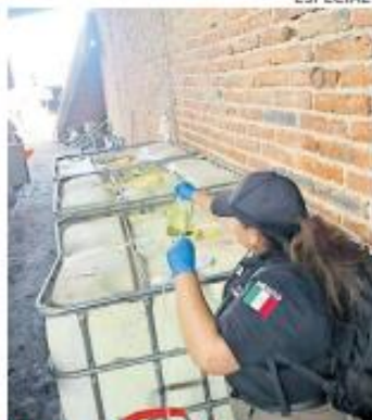
PUNTO. El hidrocarburo fue localizado en una bodega del poblado La Arena.