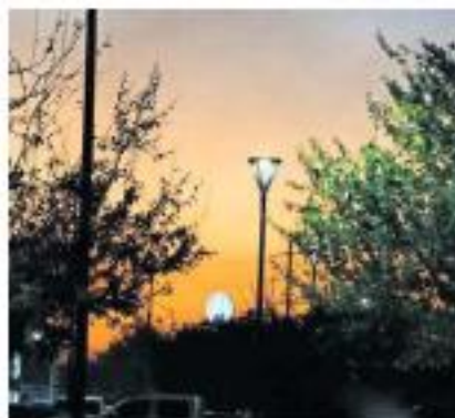
LUCES. El programa Iluminemos Tlajo contempla la colocación total de 40 mil lámparas.

Las lámparas instaladas tienen potencias a partir de 45 watts, lo que permite una mayor iluminación nocturna y un ahorro energético.