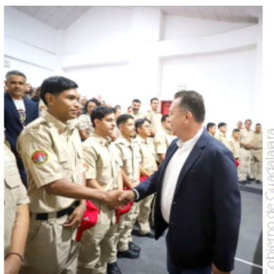
Los nuevos elementos cumplieron con su formación inicial.