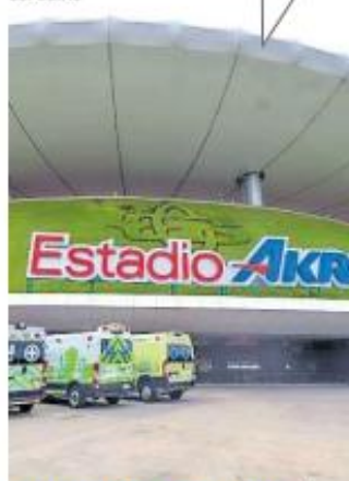
INHUMACIÓN CLANDESTINA. El gobernador sostuvo que no hay fosas cerca del Estadio Akron.