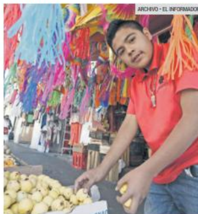
APROVECHAN. Comerciantes reportaron incrementos en precios de frutas y verduras.