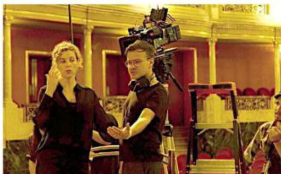
La película Ceremonia, que se filmó en el Teatro Degollado, estuvo entre las obras beneficiarias de Industrial Local 2024 de Filma Jalisco, con 2 millones 987 mil 928 pesos.

Tras solicitar información a través de la Platafor-