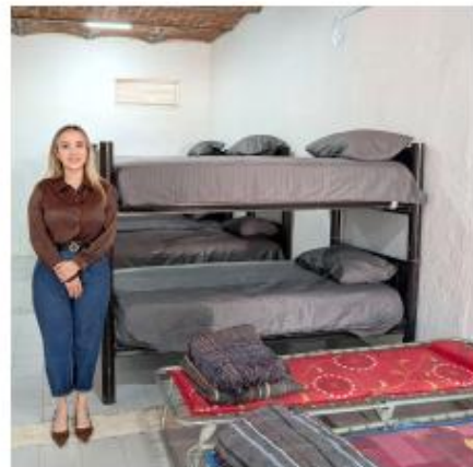
Atienden a personas en situación de calle.

Mediante esta estrategia se ofrecerá abrigo, apoyo y acompañamiento a quienes atraviesan situaciones de vulnerabilidad, priorizando siempre un enfoque humano.