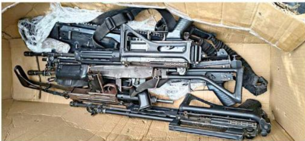
■ Las armas que fueron encontradas tras el engaño, están en manos de la FGR.