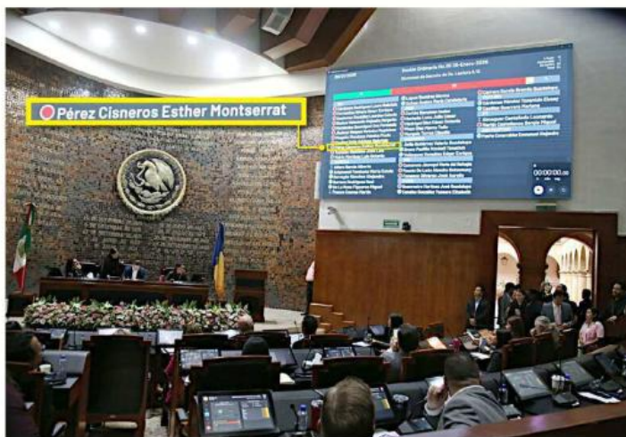
La reforma legal a favor de las infancias trans recibió el miércoles 22 votos en contra; uno de estos, de la diputada emecista.