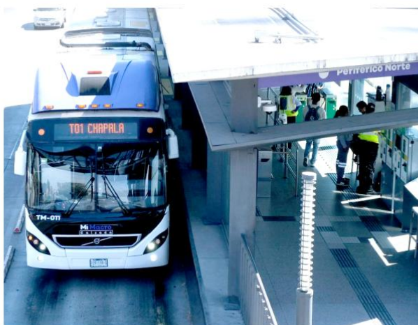
Hasta ahora Mi Macro Periférico ha realizado más de 411 millones de viajes.

Conecta a Guadalajara, Zapopan, San Pedro Tlaquepaque y Tonalá con 46 estaciones y 49 km, con accesibilidad universal