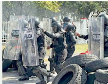
■ El curso en tácticas de alto riesgo estará dirigido a 150 policías estatales.

En marzo y abril se prevén otros cursos a través de las Policías Nacionales de España y Argentina, sobre emergencias con explosivos y negociaciones ante situaciones con rehenes.