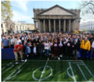
La presentación.