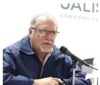
El Fiscal señaló que el abogado, objetivo de la agresión, sigue hospitalizado.