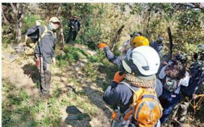
■ Integrantes de Luz de Esperanza revisaron un terreno.

La revisión del terreno fue compartida a través de una transmisión en Facebook, desde la Colonia Indígena de Mezquitán, donde integrantes de la agrupación informaron a sus seguidores sobre el inicio de la jornada.