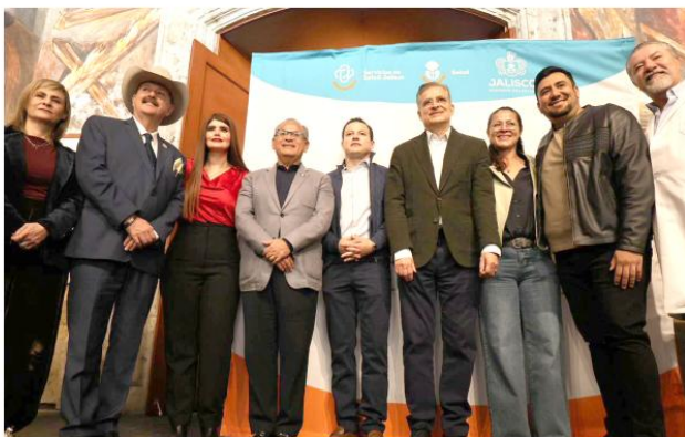
Subrayaron la importancia de fortalecer las campañas de vacunación.

En las instalaciones del Legislativo fue instalado un módulo de vacunación al que podrá tener acceso la ciudadanía en general