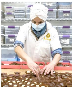
Esto que posiciona al Estado como uno de los más resilientes del país en materia económica.