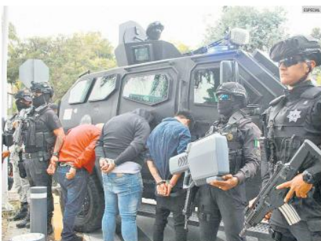
OPERATIVO. Los tres integrantes de una banda dedicada al robo de relojes de lujo fueron detenidos en Colinas de San Javier. Los aseguraron armas de fuego y vehículos.