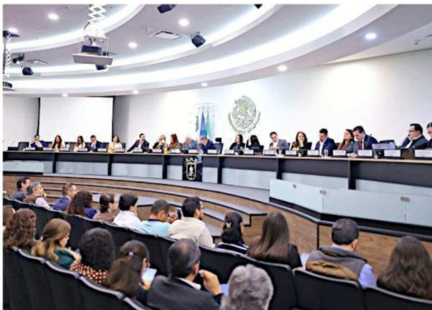
El Cabildo modificó el convenio por la concesión de los baños en unidades deportivas.