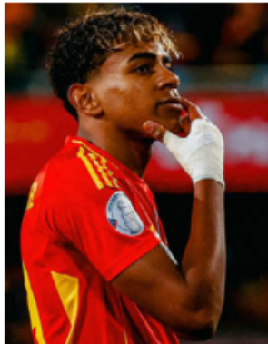
Lamine Yamal, figura de España. ESPECIAL