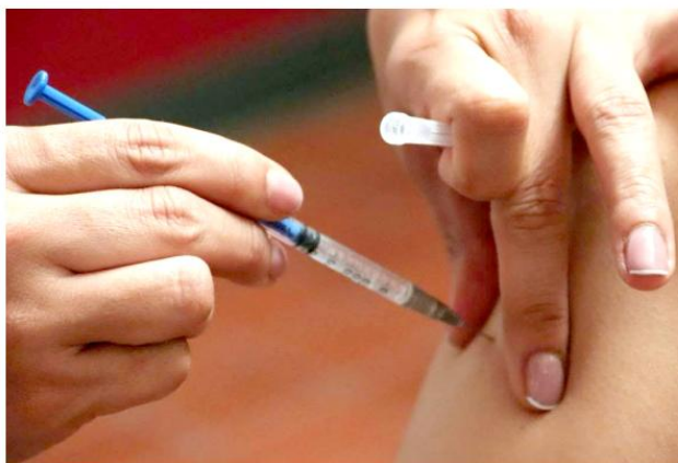
Actualmente, autoridades de salud reportan 2 defunciones confirmadas.

"Nos preocupa y que nos ocupa. He tenido conferencias diarias con el secretario de salud federal, con el doctor Kersnovich. Estamos pidiendo el apoyo de las presidentas y presidentes municipales, sobre todo porque la mayor parte de los contagios se están presentando en municipios donde vienen muchos trabajadores jornaleros. Entonces necesitamos concientizar a la gente de la vacunación. Es muy importante que la gente que tenga de 49 años para abajo se vacune. En