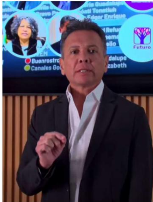
Publicó un video en el que criticó a morenistas.

“Morena quiere destruir a nuestras niñas y niños en Jalisco no lo podemos permitir. Por eso felicito a las diputadas y diputados que se opusieron a esta propuesta de Morena para que niñas y niños de Jalisco pudieran cambiar de género. En Jalisco no lo podemos permitir. Si en otros estados de la república quieren aceptar estas ideologías que se imponen de otras partes del mundo, ideologías de izquierda, radical, en Jalisco no lo vamos a permitir”, concluyó. ■