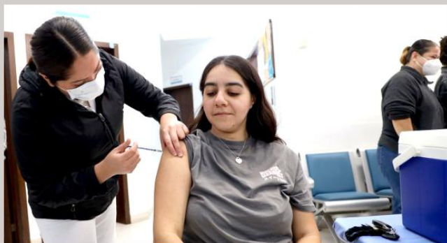
Zapopan registra alrededor de 155 casos acumulados de sarampión.