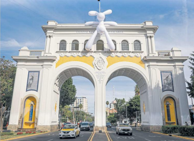
ARTE. Pieza monumental titulada "No Bunny", de Diego de Erice, quien explica que este nombre es un juego de palabras inspirado en el concepto "nobody" (nadie).

Guadalajara convierte sus museos y calles en un gran escenario abierto durante el ART WKND GDL 2026