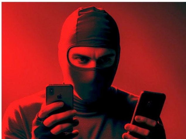
Autoridades hacen un llamado a los padres de familia para estar atentos de los hijos menores de edad.

En lo que va de la administración, han sido localizadas 28 personas con reporte de desaparición