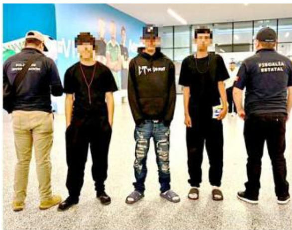
Los jóvenes fueron reintegrados a sus familias.