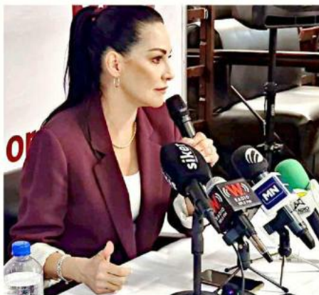
■ Gómez Pozos, diputada federal por Morena, espera una homologación de seguridad en las terminales de autobuses.