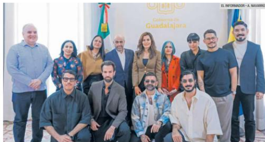
CULTURA. Artistas y autoridades culturales presentes en la presentación del programa de ART WKND GDL.