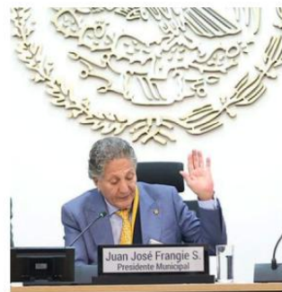
La Coordinación Municipal será autónoma.

Con esta acción, el Gobierno de Zapopan refuerza su capacidad institucional para salvaguardar la vida, la integridad y el patrimonio de las y los ciudadanos.