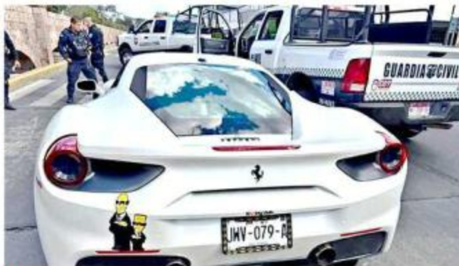
■ Se sospecha que un ex funcionario también estaría involucrado.

“Efectivamente, bueno, pues ahí era la trabajadora