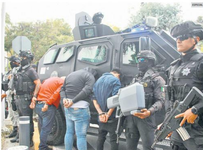
OPERATIVO. Los tres integrantes de una banda dedicada al robo de relojes de lujo fueron detenidos en Colinas de San Javier. Les aseguraron armas de fuego y vehículos.