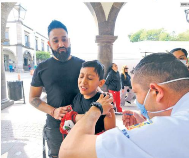
ATENCIÓN. Aquellos adultos y niños que no tengan completo su esquema de vacunación contra el sarampión deben atender de manera inmediata el llamado para recibir el biológico.

En la Entidad todavía hay disponibles alrededor de un millón de vacunas contra el sarampión para aplicar en unidades médicas y en los distintos módulos itinerantes. La vacuna es gratuita.