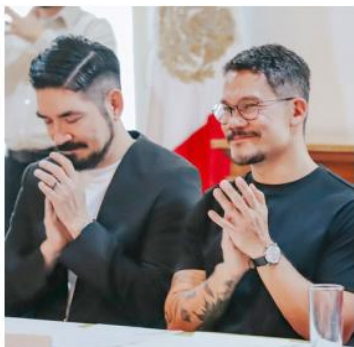
Gobierno de Guadalajara

Entre las actividades, destaca el videomapping en la Catedral Metropolitana.