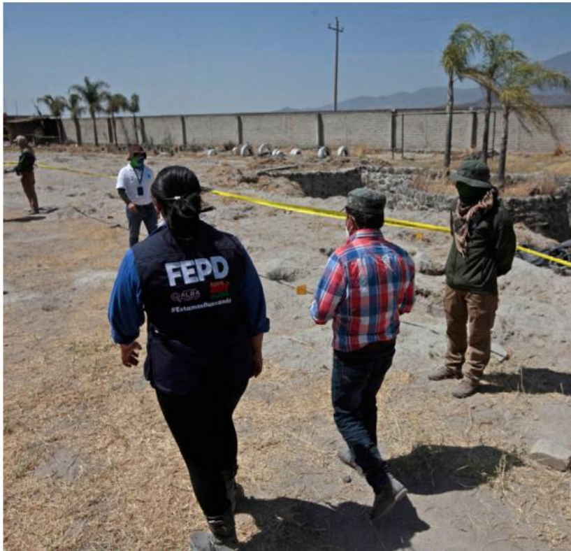
El rancho Izaguirre, en Teuchitlán, centro de adiestramiento. FERNANDO CARRANZA

Agentes de la Vicefiscalía se trasladaron al estado para entregarlos de manera segura a sus familiares, tras haber sido ubicados con vida. Según las indagatorias, presuntamente fueron trasladados en una primera instancia al estado de Zacatecas y luego llevados a Sinaloa, pero fue tras un enfrentamiento registrado en aquella entidad, que los jóvenes aprovecharon para escapar y ocultarse,