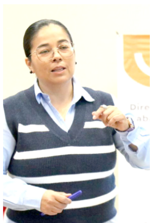
Se reunió Consejo de Vinculación del Departamento de Trabajo Social de la UdeG.