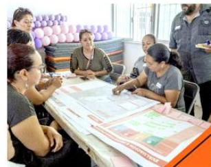
Anunció Quirino el inicio del proceso de consulta pública.

La consulta pública se llevará a cabo del 3 de febrero al 12 de marzo del presente año.