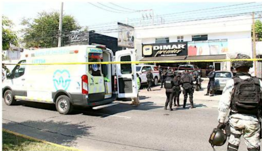
Tras la agresión del martes, dos personas quedaron detenidas.

2024, cuando van en un vehículo el padre y su hijo y son interceptados por un grupo armado, quienes los privan de la libertad a ambos, en el Municipio de Zapopan, y se hicieron operativos constantes, una búsqueda, trabajo conjunto de varias dependencias, y días después son localizados lamentablemente sin vida”, explicó la funcionaria.