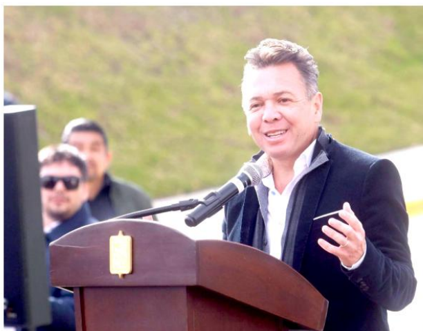
Insistió en que en Jalisco no tienen cabida esas ideologías de izquierda.

El Gobernador felicitó a los diputados naranjas por votar en contra de esta propuesta; en el Estado se protegerá a las niñas y niños, dijo