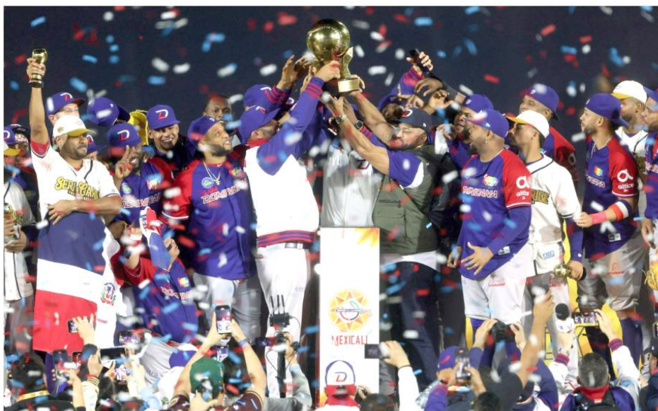
Leones de Escogido llega a la Serie del Caribe para defender su título.