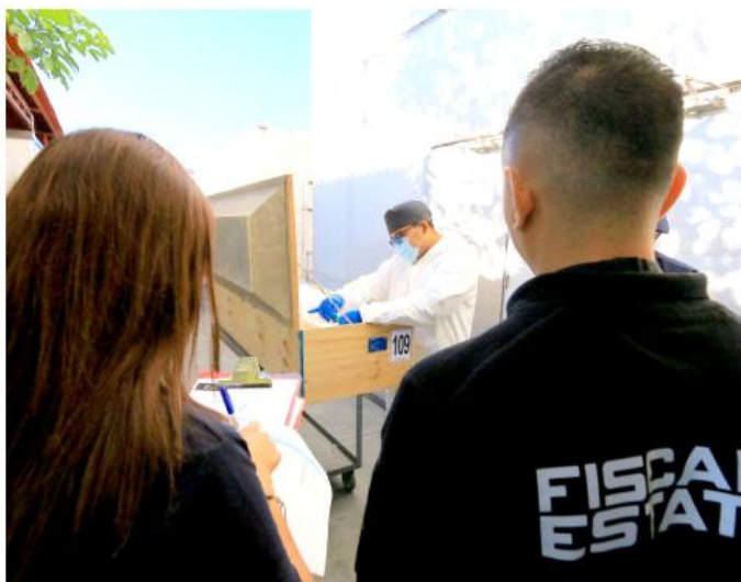
En el proceso participó una Comisión de Inhumación en la que están colectivos de búsqueda.