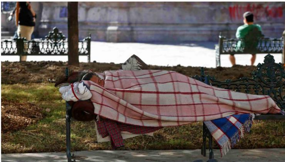
Hay quienes no tienen otra alternativa más que dormir en la banqueta, bajo puentes o en parques públicos. FERNANDO CARRANZA