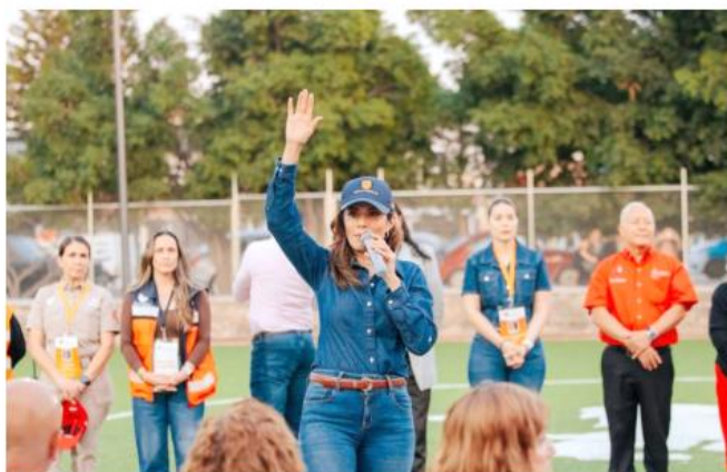
La intervención incluyó la rehabilitación integral de la infraestructura deportiva.