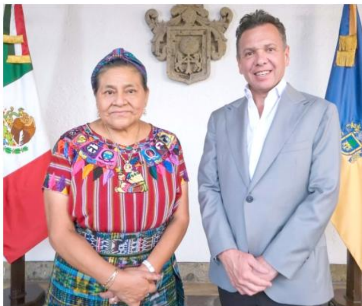
Buscan impulsar una agenda orientada a los pueblos originarios, las mujeres y la paz.

"Creo en la paz como cultura, como educación, como diálogo, creo en la paz como transmisión de experiencias, de conocimientos a nuestra juventud, a nuestras