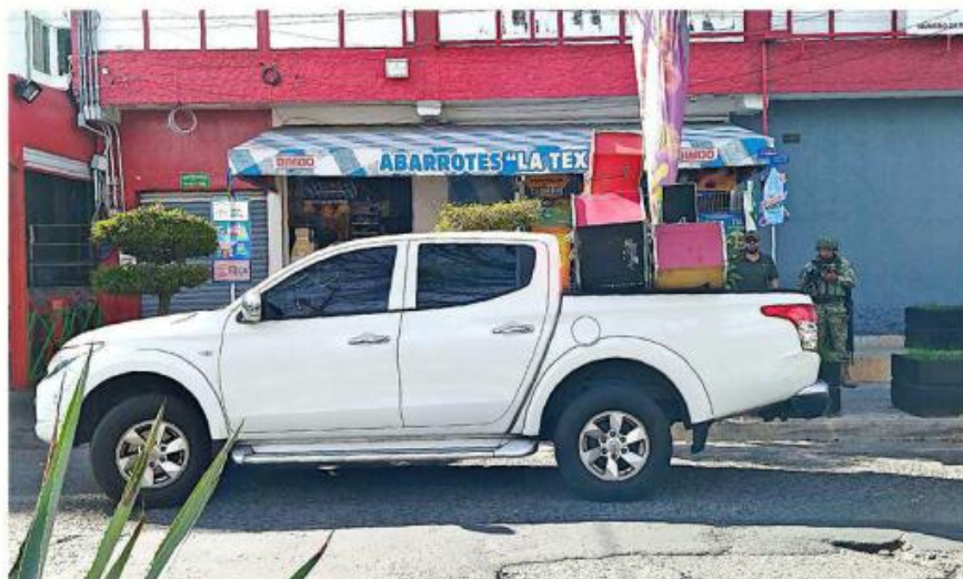
Los operativos para decomisar tragamonedas son encabezados por GN y el Ejército.

La Secretaría de Seguridad estatal informó que la estrategia para decomisar máquinas tragamonedas es di-