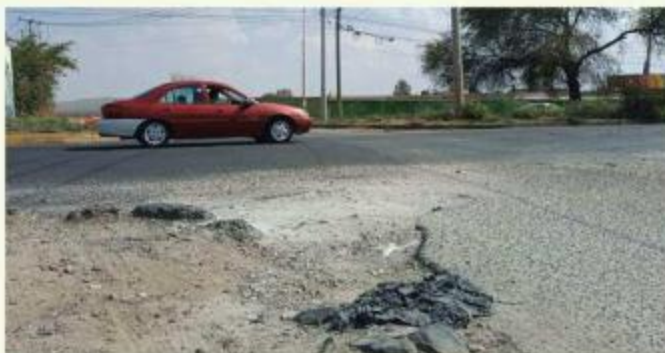
■ Automovilistas claman solución al mal estado de la Avenida Jesús Michel González, en Tlaquepaque.

“Tienes que bajar mucho la velocidad porque los baches están en mero en