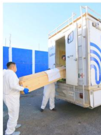
Gobierno de Guadalajara

Esta expectativa de honestidad la comparte el presidente de la