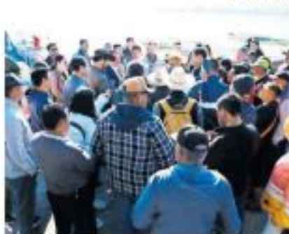
EJE. Varias de los programas del Municipio se enfocan en el desarrollo rural.