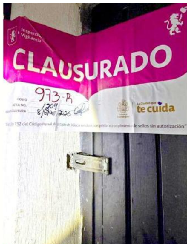
■ La clausura de establecimientos por parte de la autoridad municipal no ha resuelto el problema del ruido en la Colonia Americana.