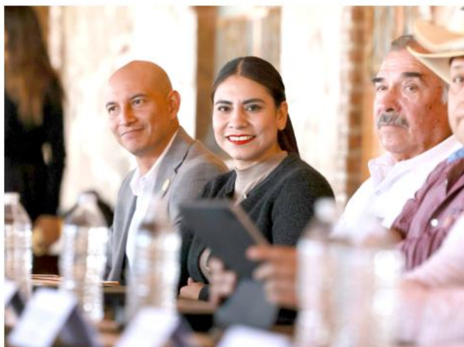
Los programas serán orientados al fortalecimiento del empleo formal.

En el rubro de Desarrollo Rural, se contemplan programas como el apoyo para la rehabilitación y conservación de suelos, que otorgará hasta 20 toneladas de cal agrícola por productor; el apoyo para la producción de maíz, con un incentivo de 150 pesos por tonelada comercializada; así como acciones para