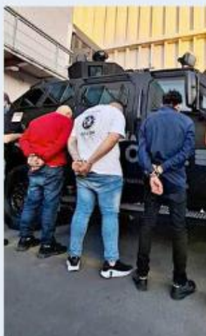
Los ladrones ya fueron enviados a Puente Grande.

De acuerdo con las investigaciones, los imputa-