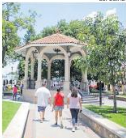
SEÑALA MORA. Tesisán es un espacio donde conviven tradiciones históricas con dinámicas urbanas modernas.