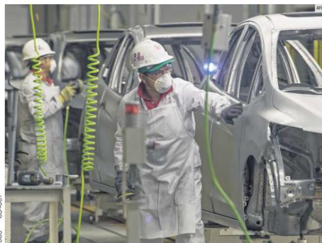
PANORAMA. La industria automotriz mexicana enfrenta un escenario de incertidumbre ante la revisión del T-MEC, con riesgos en la producción, en las exportaciones y en el empleo.

México y Estados Unidos también están en riesgo de perder ese estatus. Frente a este panorama, el Gobierno de Claudia Sheinbaum reactivó en 2025 la Semana Nacional de Vacunación y anunció un inventario de 23 millones de dosis contra el sarampión, además de la adquisición de 27 millones adicionales. Hasta ahora, se han aplicado más de 12 millones de vacunas.