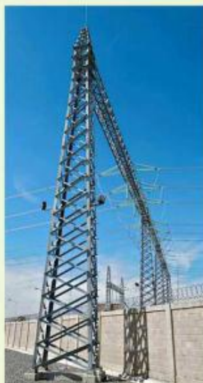
■ La CFE hará trabajos de mantenimiento este jueves en Jalisco.

En tanto, la CFE también informará que suspenderá de manera provisional el suministro de energía eléctrica en diversas comunidades del Municipio de Cuquío, Jalisco, como parte