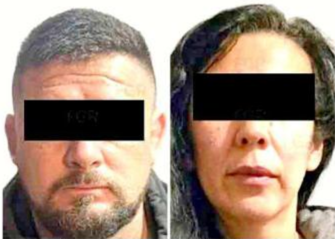
■ Sergio "N"

Como medida cautelar, se les dictó prisión preventiva oficiosa en el Reclusorio Preventivo y se concedió un plazo de cuatro meses para la investigación complementaria; tienen presunción de inocencia hasta la imposición de una condena.