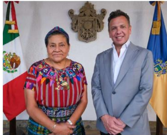
Se reunieron en Casa Jalisco.

Rigoberta Menchú fue ganadora del Premio Nobel de la Paz en 1992. A lo largo de su trayectoria, la lideresa social se ha consolidado como ejemplo, a nivel internacional, de conciliación, humanidad y respeto transgeneracional. ■