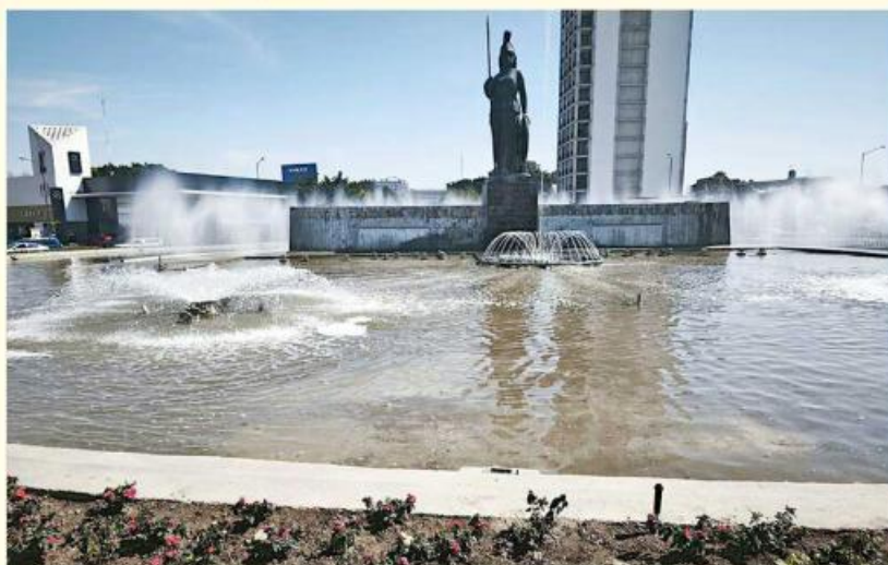
■ Una empresa utilizará la imagen de la Minerva en edición limitada de una marca de chocolates.

"No se hará un uso físico (de La Minerva) porque