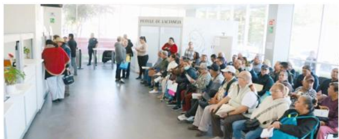
El ejercicio se desarrolla durante los primeros tres meses del año.

De acuerdo con información de la Coordinación de Cercanía y Corresponsabilidad Social, las propuestas incluidas en la boleta