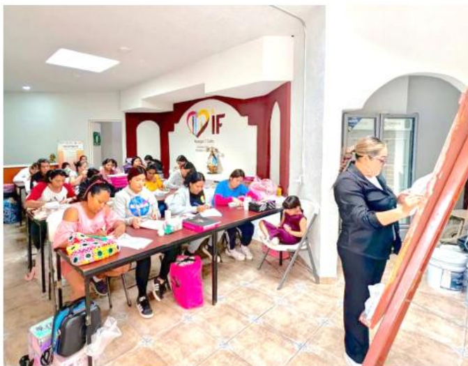
Se realizaron talleres de repostería, barbería, uñas, pintura y más.

Durante el año 2025 se registró un total general de 3 mil 460 personas beneficiadas, consolidando a los Centros de Desarrollo Comunitario