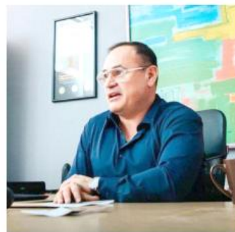
Se hará con luminarias y reflectores con tecnología LED.

"Queremos que los parques y jardines de Guadalajara sean espacios seguros, bien iluminados y vivos", señaló.