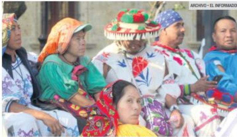
COSTUMBRES. Integrantes de la comunidad wixárika en Bolaños son parte del debate sobre el cambio en el sistema de elección de autoridades.