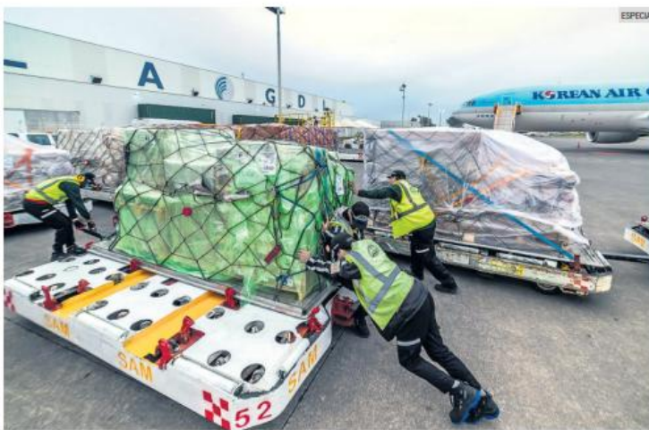
FUERZA. Cargamento de mercancías listo para exportación desde Jalisco, en un contexto de crecimiento histórico del comercio exterior en la Entidad.

Además, indicó que, de mantenerse esta tendencia, Jalisco podría consolidarse como el principal estado exportador del país. Para ello, aseguró que el Gobierno continuará impulsando acciones de promoción económica y garantizará condiciones como disponibilidad de agua, energía y certeza jurídica para las empresas.