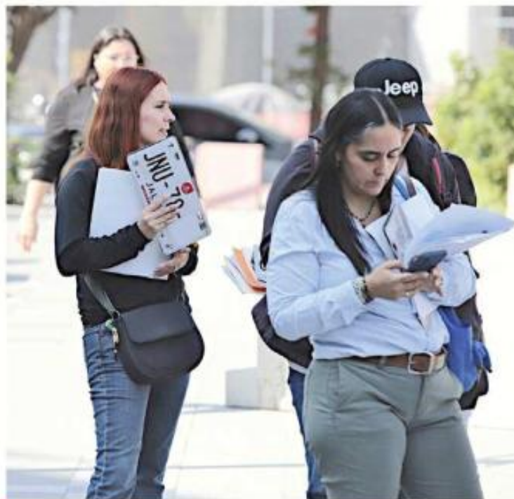
■ El plazo para recoger las placas se amplió hasta el 29 de mayo.

“Esta medida que tuvo a bien autorizar la Secretaría de Hacienda, atiende a un principio social. La gente tiene derecho al beneficio 3x1 (refrendo, verificación y sustitución de placas), y lo que se está haciendo es una extensión de plazo para que pue-