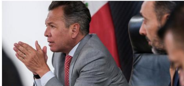
Legisladores no esperaron la resolución del TEPJF sobre elección por usos y costumbres.