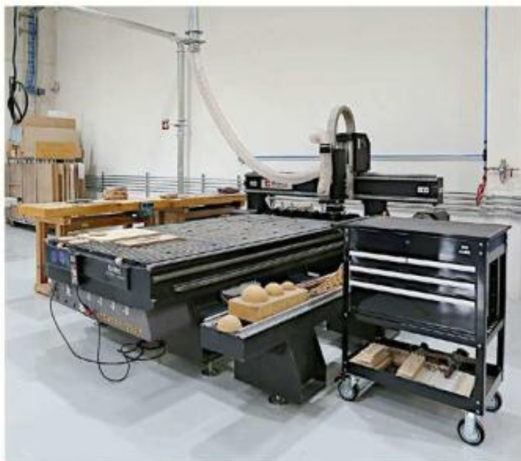
Emilio de la Cruz

El principal soporte de este resultado fue la industria manufacturera, que con-