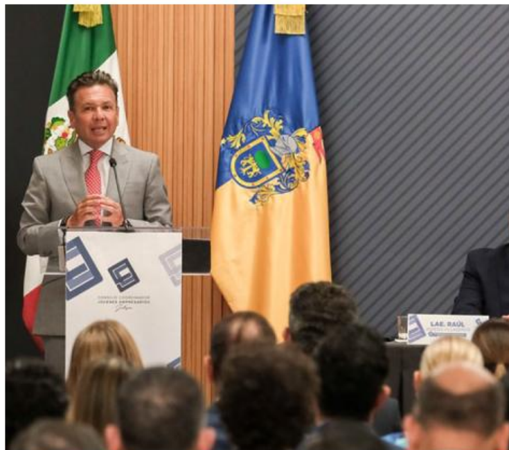
Lemus acudió a la renovación de la directiva del Consejo Coordinador de Jóvenes Empresarios.

No obstante, reconoció que para mantener este ritmo es imperativo garantizar cuatro ejes operativos: infraestructura básica, suficiencia energética, garantía hídrica y seguridad pública.