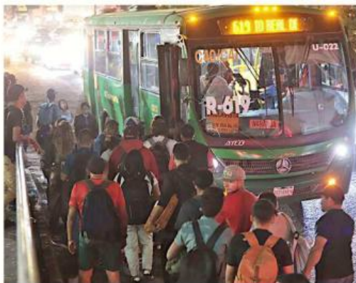
El Plan Estatal de Desarrollo y Gobernanza contempla la capacitación de los choferes, entre otras cosas.