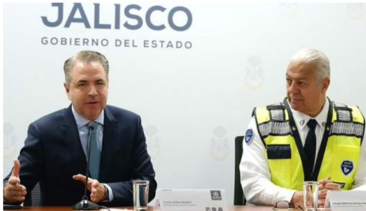
Quienes no han realizado el trámite pueden hacerlo en cualquiera de las 133 recaudadoras.

El Gobierno estatal aprobó una nueva prórroga; los automovilistas tendrán hasta el mes de mayo para realizar este trámite si pagaron su refrendo en 2025