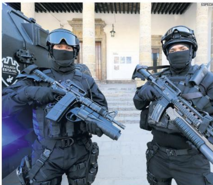
Para reforzar la seguridad, se adquirieron 28 patrullas para la Policía Metropolitana, una unidad blindada, más de 7 mil 500 uniformes, así como 4 drones.

A los elementos se les pidió hacer uso responsable de las nuevas herramientas y asumir el compromiso de fortalecer la seguridad. Con esta apuesta, Jalisco busca consolidar un modelo policial más preparado frente a los retos actuales, donde la innovación y la profesionalización se vuelven piezas clave para recuperar la tranquilidad ciudadana.