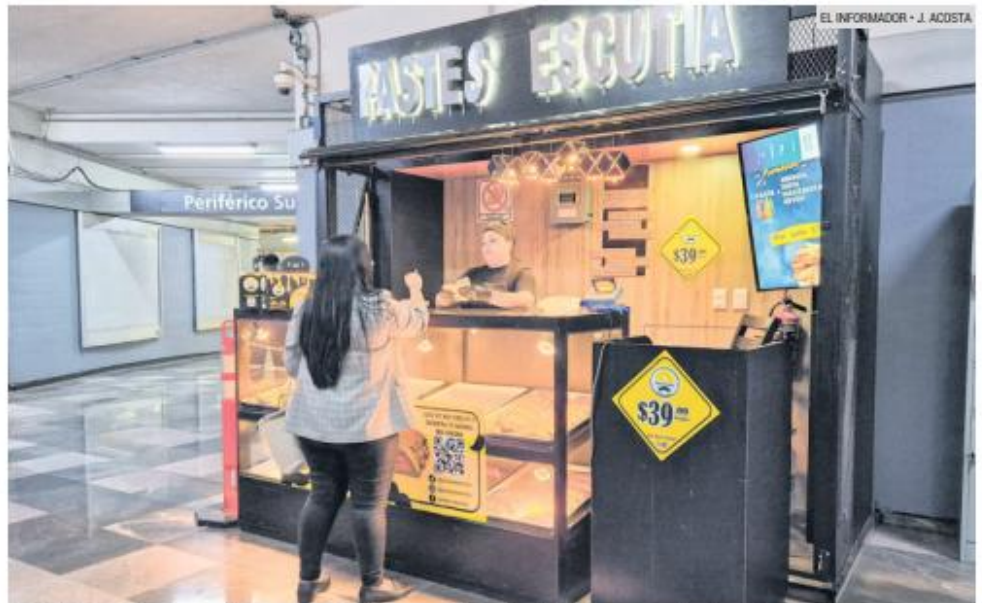
RECURSOS. Una joven utiliza una máquina expendedora instalada en una estación del Tren Ligero, como parte de los nuevos espacios comerciales habilitados en el sistema.

Estos espacios incluyen áreas disponibles en estaciones, como huecos que quedaron tras