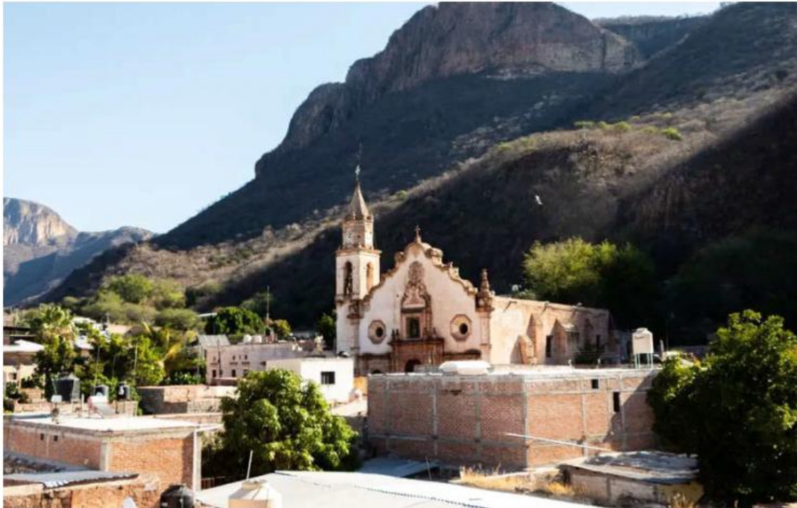
La decisión desató un conflicto social que ya tiene consecuencias en las calles de Bolaños.