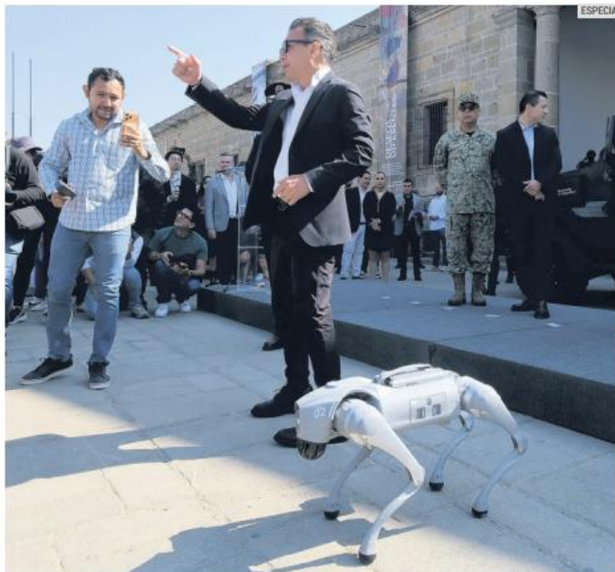
Como parte de la estrategia, se adquirieron dos perros robot antiexplosivos.