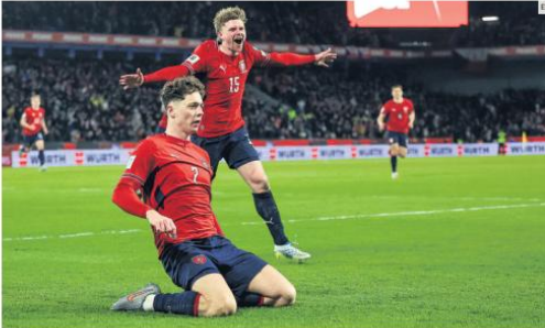
INVITADO. Tras su triunfo en penales por 3-1 sobre Dinamarca, la Selección de Chequia se ganó un sitio en el Grupo A de la Copa del Mundo, por lo que será el último rival de México en la Fase de Grupos el 24 de junio.

Jugadores de quienes se esperaba un golpe de autoridad, como los naturalizados Alvaro Fidalgo y Julián Quiñones, no lograron marcar la diferencia esperada en el último escalón previo a la lista, aunque el segundo tuvo un primer tiempo notable frente a los belgas. Por el contrario, quien parece haber ganado su lugar a pulso es Brian Gu-