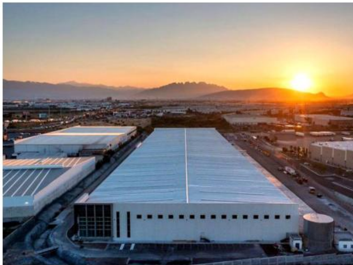
Lemus señaló que estos indicadores se presentan en un entorno económico internacional incierto.

Se prevé la construcción de más de 800 mil metros cuadrados, con una proyección de generación de alrededor de 19 mil empleos