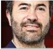
DAVID GÓMEZ-ÁLVAREZ @gomezalvarezd

El riesgo se ha normalizado dentro de Pemex; la negligencia es parte de su funcionamiento ordinario.