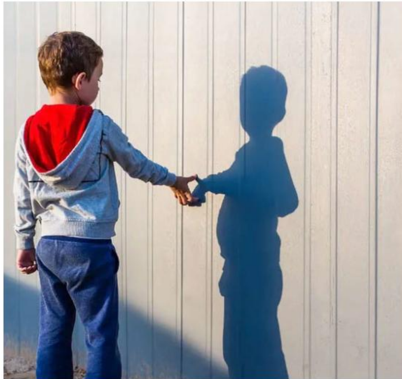
El acceso sigue marcado por listas de espera, cupo limitado y la falta de diagnósticos precisos.

Durante nueve años, su hijo estuvo fuera del sistema escolar. Cintia tocó puertas, cambió de escuelas y enfrentó rechazos. La vio-