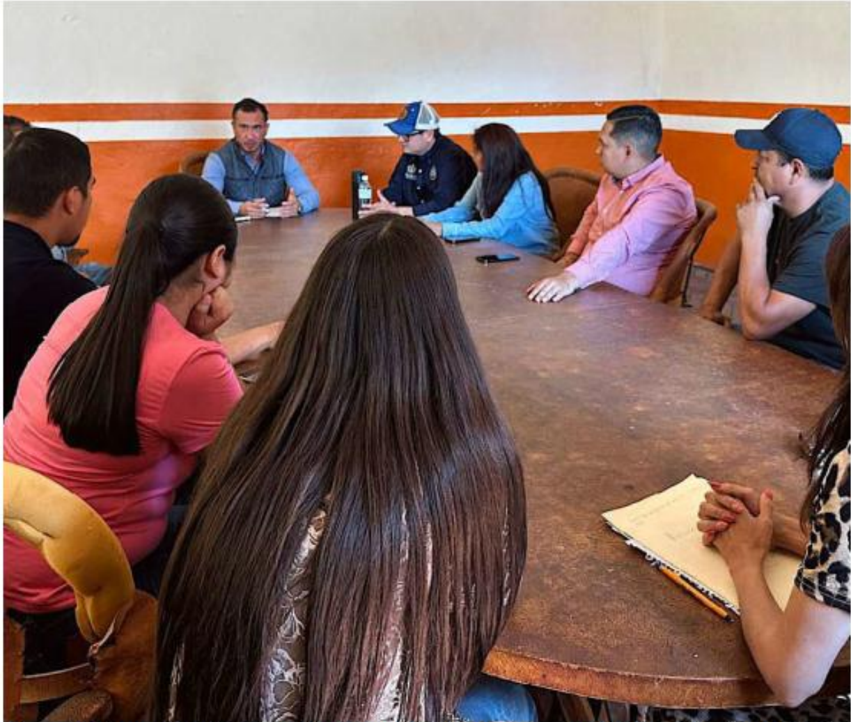
El resultado inmediato de la reunión fue la liberación de la carretera Bolaños-Tuxpan.

Legislativo. Recordaron que inició en 2020 y que fue el propio Tribunal Electoral quien ordenó en 2026 al Congreso emitir el decreto correspondiente. Añadieron que la medida fue aprobada por todas las fuerzas políticas representadas en la cámara e incluye garantías específicas para la población mestiza del municipio, lo que en su lectura descarta que se trate de una de-