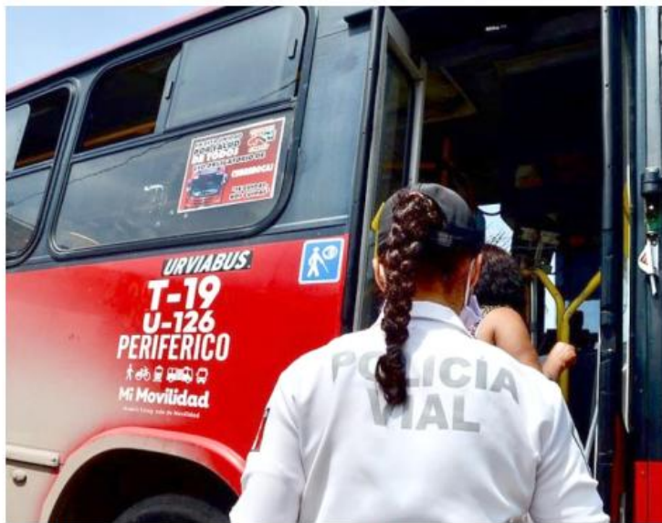
Durante los primeros tres meses de este año, se contabilizaron cinco decesos.

En lo que va del año, la Secretaría de Transporte reportó que la reducción se atribuye a una serie de medidas operativas