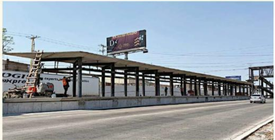
■ La Línea 5 correrá sobre Carretera a Chapala, de Periférico al Aeropuerto de Guadalajara.

El titular de la SIOP dijo que, por parte de la