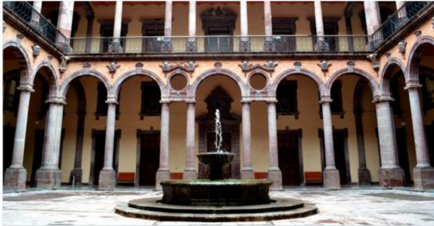
Secretaría de Cultura.

En "Proyecta Producción" se destinarán 8.5 millones de pesos para proyectos de creación, difusión y preservación en disci-