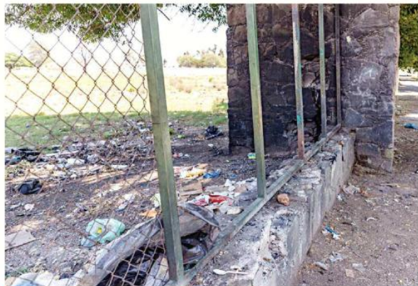
Una sección del alambrado perimetral está roto.