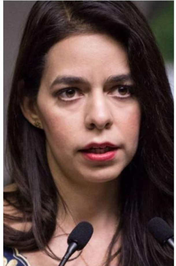
La dirigente priista lamentó no haber tenido contacto con autoridades estatales tras el crimen.

"Que la Fiscalía haga su chamba, que ojalá ya se animen a hacer