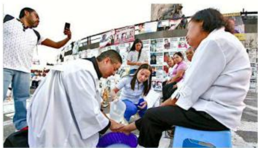
Se hizo el Lavatorio de Pies con madres de desaparecidos.