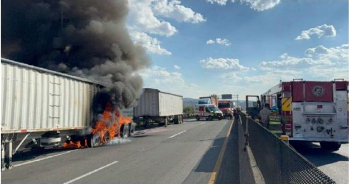
El siniestro afectó una de las dos cajas que transportaba la unidad.