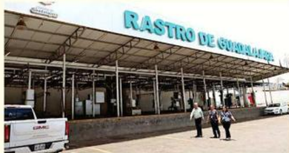
La iniciativa contempla medidas para un mejor funcionamiento del rastro municipal.

Otra de las reformas que contempla el nuevo reglamento es que los animales muertos puedan ser donados mediante un convenio vigente con el municipio