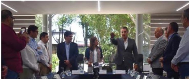
Toma de protesta.