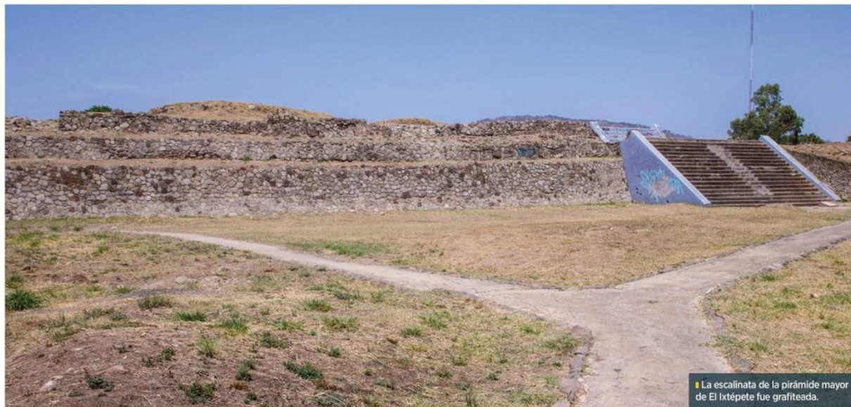
La escalinata de la pirámide mayor de El Ixtépete fue grafitada.