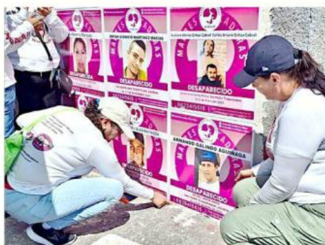
El Cepad pide al Gobierno no descalificar el informe sobre desaparecidos.