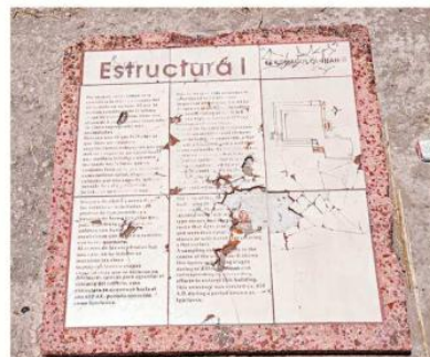
Una ficha de la zona arqueológica está con el mosaico dañado.