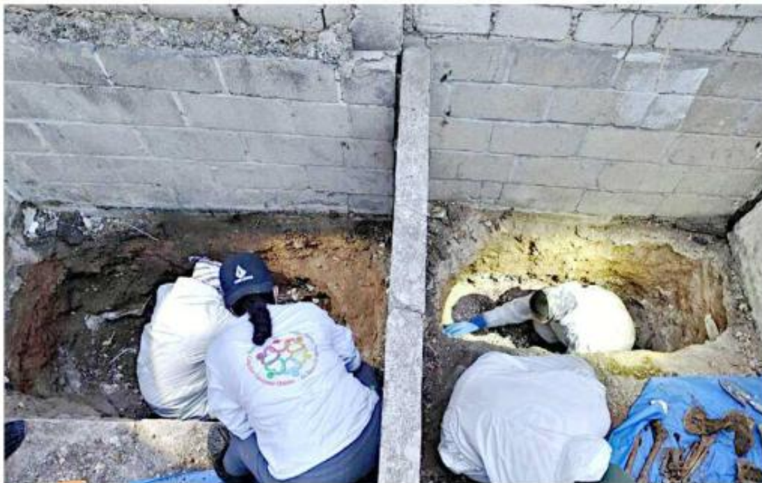
Corazones Unidos en Busca de Nuestros Tesoros está realizando búsqueda de cuerpos en Ixtlahuacán de los Membrillos.