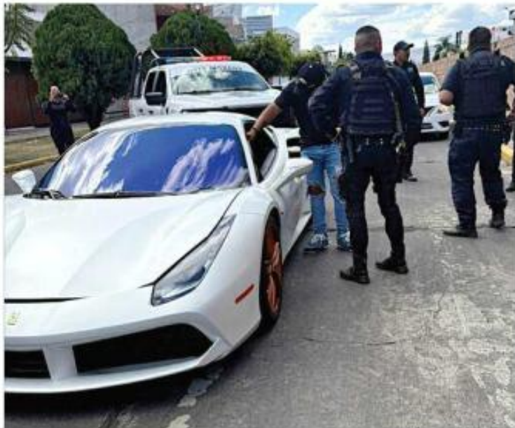
La mujer había arreglado las placas de un Ferrari robado.