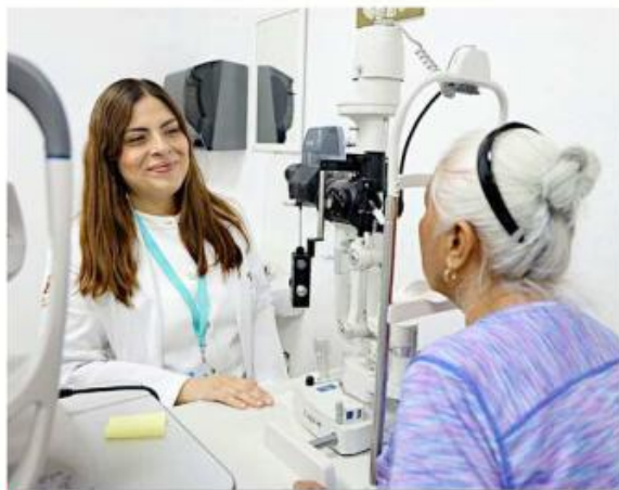
■ En octubre pasado se abrió el Centro de Oftalmología de la Cruz Verde Sur.

“Hay operación con oftalmólogos de lunes a domingo de 8:00 horas a 20:00 horas con la capacidad no solo de dar consulta, de hacer diagnóstico, porque tienen