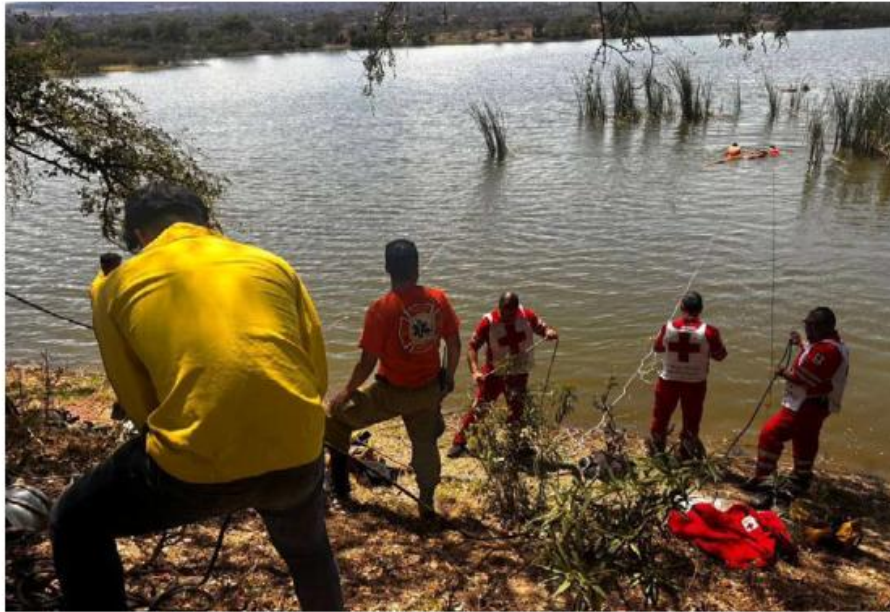
Bomberos municipales y estatales se encargaron de rescatar ambos cuerpos.

Posteriormente, a las 16:50 horas, se confirmó la localización del segundo, un hombre de 39 años de edad, con lo que concluyeron las labores de búsqueda