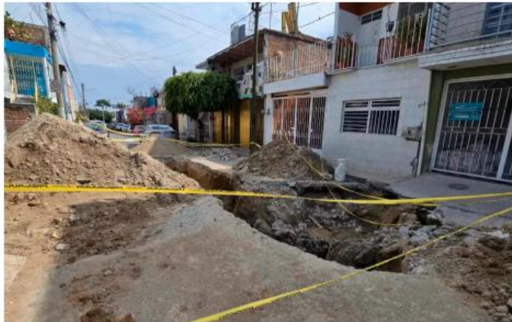
Tlaquepaque intervendrá socavón en Los Altos; señala omisiones del SIAPA.

“Lamentablemente, es una situación grave: se trata de un colector dañado a cuatro metros de profundidad, con una red obsoleta, con fallas y rupturas. Esto ha derivado en reparacio-