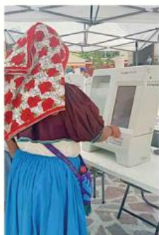
■ Habitantes de Bolaños votaron en mayo del 2025 a favor de cambiar de régimen.