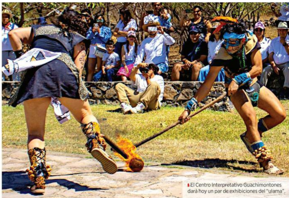
■ El Centro Interpretativo Guachimontones dará hoy un par de exhibiciones del "ulama".