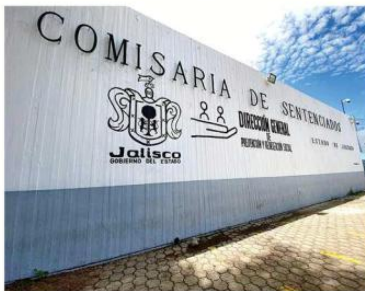
■ La Comisaría de Sentenciados tiene en el autogobierno a un criminal ligado al CJNG.

El hombre, quien recibió 75 años de cárcel por el caso referido y quien es liga-