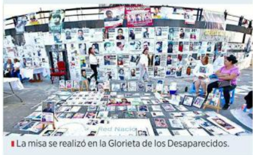
La misa se realizó en la Glorieta de los Desaparecidos.

Por último, llamó a los fieles a comulgar y agradeció a los asistentes a la misa por las personas desaparecidas.