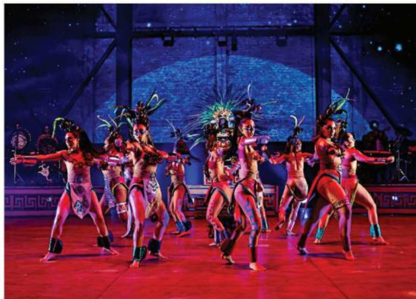
■ Más de 50 artistas forman parte del montaje de "Kopalli: El Espíritu Astral", que se presentará los domingos.