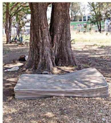
Hasta un colchón se observó debajo de un árbol dentro del lugar.

La demanda no especifica el terreno, pero detalla que el Juzgado impidió formalizar el acta de una asamblea general celebrada en marzo de 2025, pues faltaba una firma de la Procuraduría Agraria. Sin este paso, el Ejido no pudo hacer una transmisión definitiva de tierras en favor del Ayuntamiento de Zapopan, con el cual firmó un convenio.