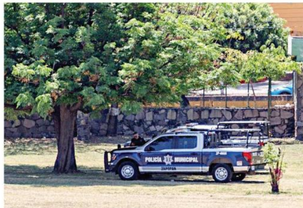
Dos patrullas de la Comisaría de Zapopan vigilan al interior de la zona arqueológica.