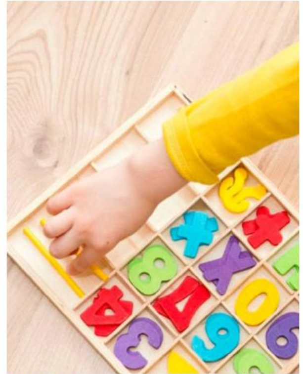
Cada caso debe ser evaluado en lo particular.