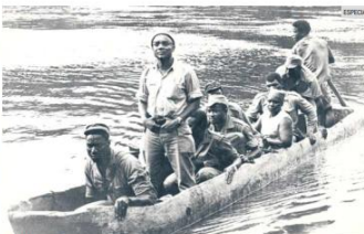
"AMILCAR". Foto del documental que aborda la vida de una figura clave en la independencia de Cabo Verde.

Rodada en 16 mm, la película apuesta por una experiencia sensorial que una memoria y subjetividad. En montaje —que tomó cuatro años— el relato se redefinió por completo. "Cuando te sientas en el montaje ves que todo eso que escribiste no sirvió prácticamente para nada". Sin duda, el proceso también llevó a Eek a cuestionar su propia mirada como cineasta europeo, reconociendo los sesgos al narrar una historia de descolonización.