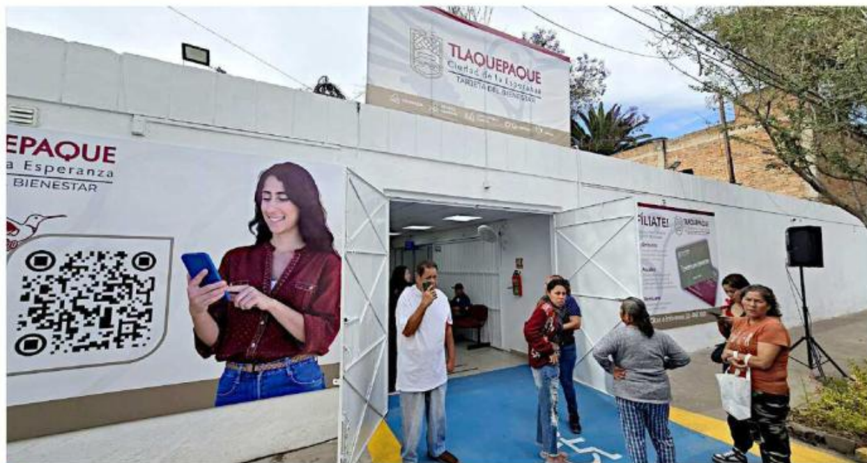
La Unidad Clínica del Bienestar que ofrece el servicio gratuito de ginecología se ubica en la Colonia San Pedrito.

Ofertan asistencia ginecológica a usuarias de programa