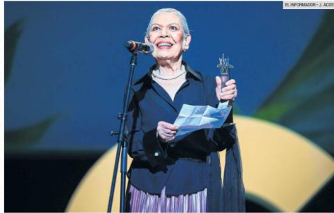
LUISA HUERTAS. Conmovida, la actriz recibió el Mayahuel de Plata en la gala inaugural del Festival Internacional de Cine en Guadalajara, celebrando una vida dedicada al arte y la memoria del cine.

La velada alcanzó uno de sus momentos más significativos con la entrega del Mayahuel de Plata por trayectoria a la actriz Luisa Huertas, figura clave del cine y del teatro en México. Visiblemente conmovida, ofreció un discurso íntimo y reflexivo en el que recorrió su vida y oficio, reivindicando la actuación como una vocación profundamente ligada a la memoria, la sensibilidad y el paso del tiempo. "Lo mejor que me ha pasado en la vida ha sido ser madre... y haber decidido desde niña ser actriz. Al recibir este Mayahuel de Plata por trayectoria, que otorga el primer y emblemático Festival Internacional de Cine en Guadalajara, me siento plena, de gratitud y alegría, y me hace pensar que ha valido la pena la vida, vivirla y trabajarla, porque actuar es mi forma de vida. El cine recoge el devenir de la humanidad... retrata el alma de los seres humanos... y estamos fijando la memoria, la de la actualidad y la del fu-