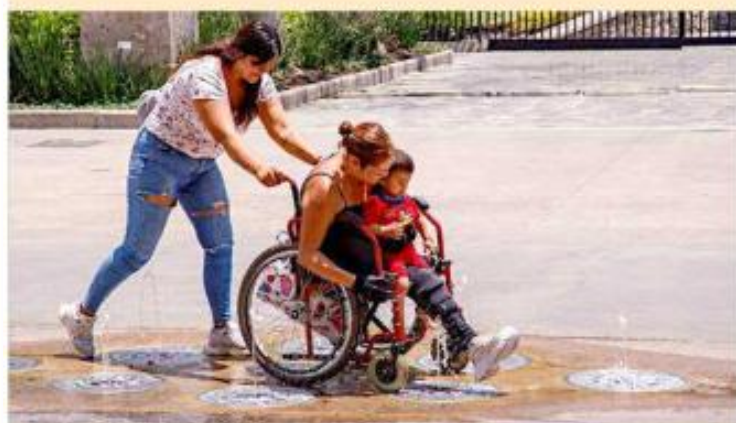
Incluso hubo quienes aprovecharon las fuentes para refrescarse un poco.