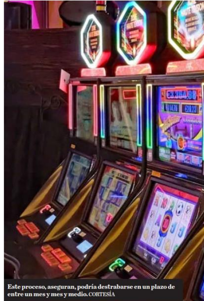
Este proceso, aseguran, podría destrabarse en un plazo de entre un mes y mes y medio.

En medio de la creciente presión del crimen organizado que azota a sus entidades, los gobernadores de siete estados del occidente del país, sellaron el martes un acuerdo de seguridad respaldado por la 5ª Región Militar, cuya participación fue una pieza clave para lograr la coordinación interestatal en esta lucha. Durante la Séptima Reunión de Seguridad Regional, celebrada en Aguascalientes, los mandatarios —Pablo Lemus (Jalisco), Indira Vizcaino (Colima), Libia Denise García (Guanajuato), Miguel Ángel Navarro (Nayarit), David Monreal (Zacatecas), Alfredo Ramírez Bedolla (Michoacán) y la anfitriona Tere Jiménez— se comprometieron a impulsar legislaciones locales homogéneas para frenar la operación ilegal de las llamadas “maquinillas tragamonedas”.