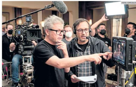
CARLOS BÁTIZ Y CARLOS CARRERA. Directores del documental "Azul Oscuro, Azul Celeste".