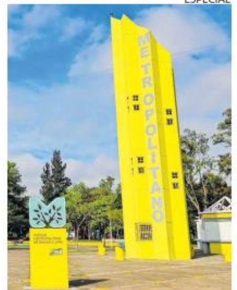
SEDE. El festejo será el martes 28 frente a las torres amarillas del Parque Metropolitano.