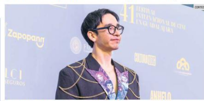
CRUZ CONTRERAS. El animador mexicano ha participado en proyectos como "Las guerreras K-pop".