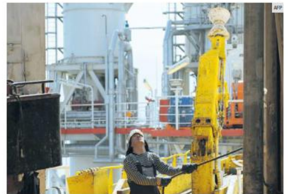
CAMPO PETROLERO. Poco a poco se regulariza la producción en diversos campos de las naciones de Medio Oriente.