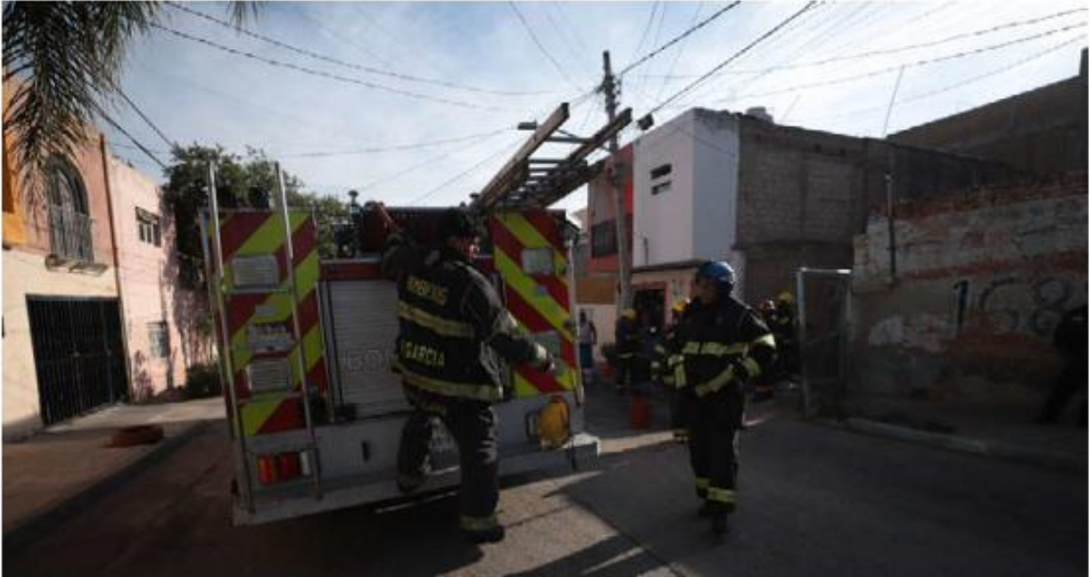
Bomberos desconocen las causas que originaron el incendio. USI TOLEDO