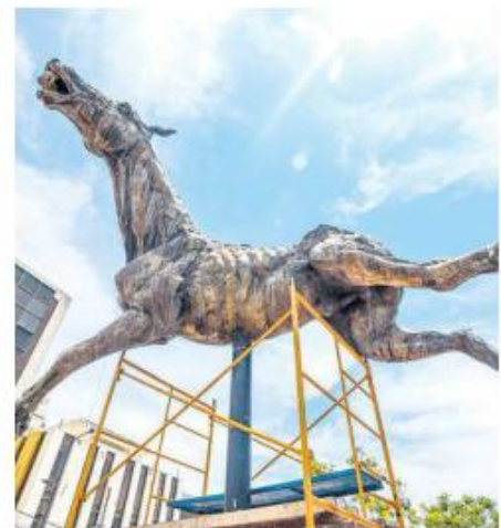
EXPRESIÓN. Las figuras de bronce representan valores como belleza, alegría y abundancia.