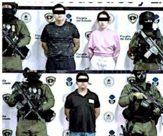
Los implicados terminaron en prisión preventiva.