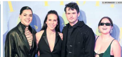
ACTORES. Ana Sofía Gatica, Kate del Castillo, Martín Barba y Diana Bovio posan desde la alfombra roja.