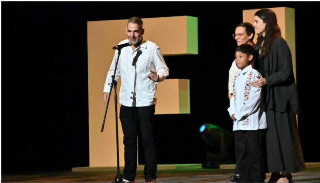
La cinta Moscas , de Fernando Eimbcke, abrió el festín.