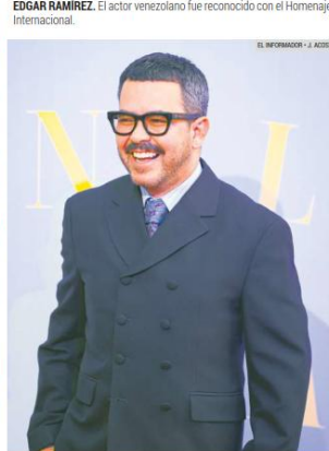
MANOLO CARO. El director de cine y series en plataformas estuvo presente en la apertura del FICG.