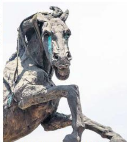
PASIÓN. El nuevo espacio fue acondicionado para albergar el conjunto escultórico en un camellón.