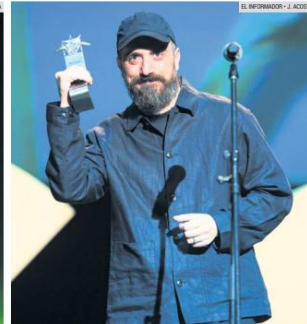
PABLO LARRAÍN. El cineasta recibió un galardón por su trayectoria y aprovechó para compartirlo con su colaborador más cercano: su hermano.