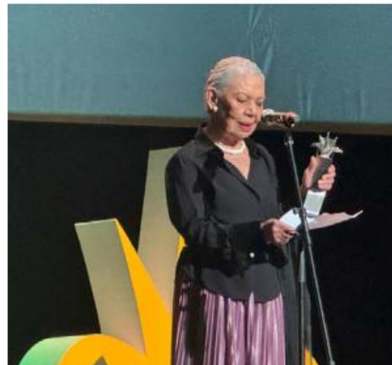
Huertas, Mayahuel de Plata. A. CASTELLANOS