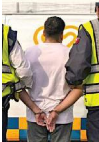
■ El conductor fue retenido por oficiales.

La sanción por manejar en estado de ebriedad es la retención del vehículo, arresto administrativo y multas que van de 16 mil 971 a 22 mil 628 pesos; además, puede haber montos extra por la operación de grúas.