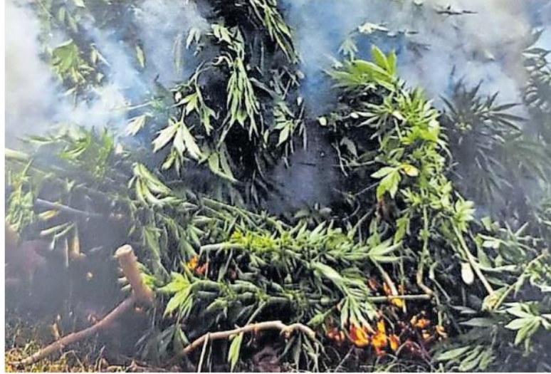
POCOS. En 2023 apenas se reportaron seis cultivos y 152 mil plantas localizados y destruidos.