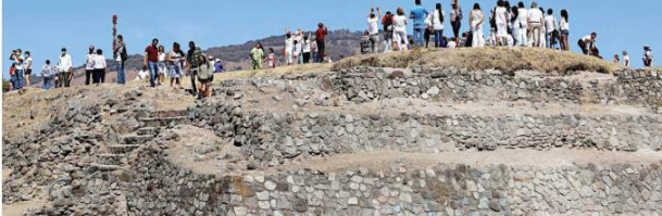
El sitio suele ser visitado en el equinoccio de primavera con la finalidad de recargar energía.

Los dos más importantes (sitios arqueológicos) en términos arquitectónicos serían Los Padres, que es donde hay más estructuras, y El Ixtépete, porque es la estructura más grande. Son estructuras todas a la mayoría del Periodo Grillo, que es del Siglo 5 d.C. al Siglo 10, o sea, 400-900 de manera muy aproximada.