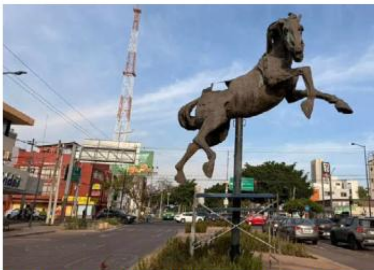
ESULTURAS. Cabildo aprueba traslado de Las Tres Gracias a la Plaza de la República, tras ser retiradas sin autorización de Lázaro Cárdenas; vecinos de la avenida México, a favor del cambio.