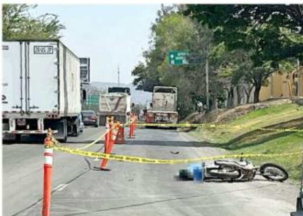
■ En la Carretera a Chapala falleció un motociclista.

El hombre, de entre 30 y 35 años, tuvo un percance que involucró un vehículo pesado, de acuerdo con la Comisaría municipal.