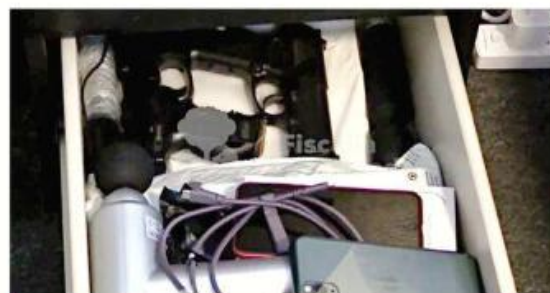
■ Tres armas fueron aseguradas en el cateo.

Además, al revisar la propiedad encontraron una pistola Beretta, un revólver