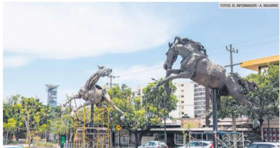
PATRIMONIO. La obra busca acercar el arte al espacio público y fomentar la convivencia ciudadana.