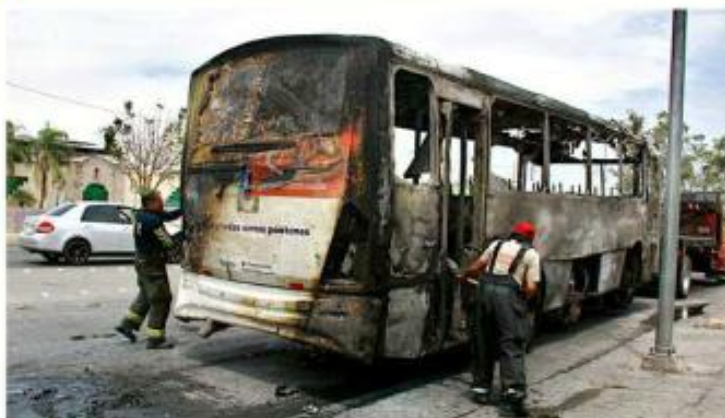
■ La unidad fue consumida por las llamas.

vehículo, pero no afectó a otros automotores cercanos ni causó otros accidentes.