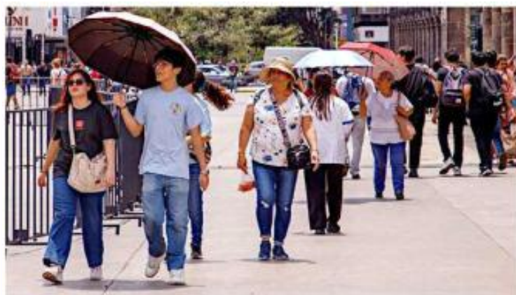
Diversas personas que caminaban por el Centro de Guadalajara buscaban resguardarse de los rayos del sol.

Ante este escenario, el especialista no descarta que haya lluvias aisladas a partir de mañana y que pudieran extenderse hasta el martes, aunque el ambiente caluroso seguirá predominando en buena parte del territorio jalisciense.