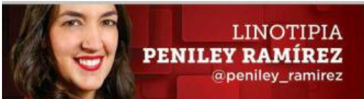
LINOTIPIA PENILEY RAMÍREZ @peniley_ramirez

Más allá de la polarización y la política, de votos y discursos, hablar de Cuba es hablar de su gente, de su dolor y su desesperación.