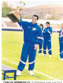
CARLOS HERMOSILLO. El futbolista jugó con Cruz Azul principalmente entre 1991 y 1998.