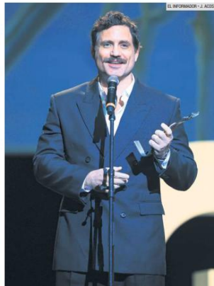
EDGAR RAMÍREZ. El actor venezolano fue reconocido con el Homenaje Internacional.