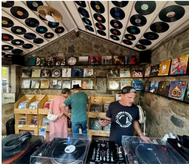
Bola decidió abrir una segunda sucursal de La Perla en Ajijic.

En 14 años de operación, el cambio más visible no está en el catálogo sino en quien entra. Al principio