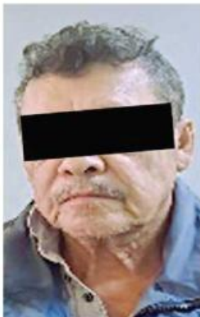
■ Roberto "N"