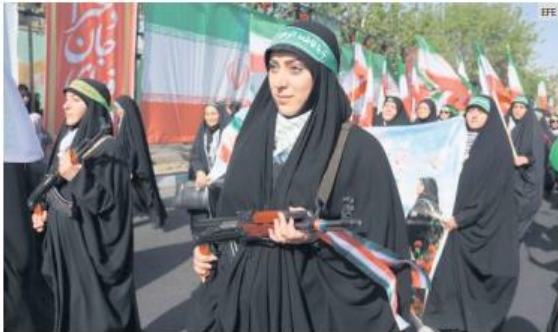
TEHERÁN. Las manifestaciones en apoyo al régimen persa y su política nuclear tomaron las calles de la capital.

El Ministerio de Asuntos Exteriores de Irán afirma que su uranio enriquecido no será transferido a ningún otro lugar: "La opción de transferir el uranio enriquecido de Irán al extranjero es inaceptable", declaró un portavoz del ministerio a los medios iraníes.