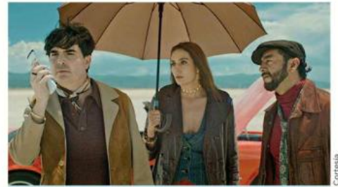
■ "Abracadáver" recibió la Iguana de Oro en el FICG 2025.