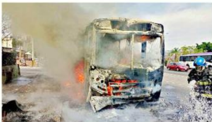
■ Bomberos tapatíos combatieron el fuego.