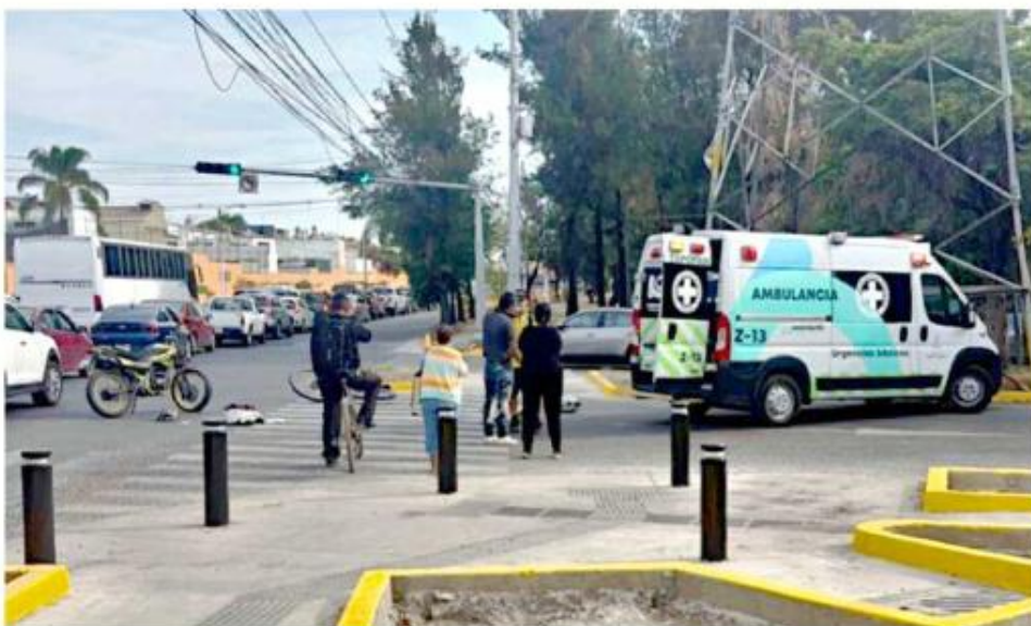
■ Uno de los casos sucedió en la Avenida Juan Palomar y Arias, al cruce con Novelistas.

Tres horas más tarde, otro motociclista fue atropellado en El Refugio, en Tlajomulco de Zúñiga.