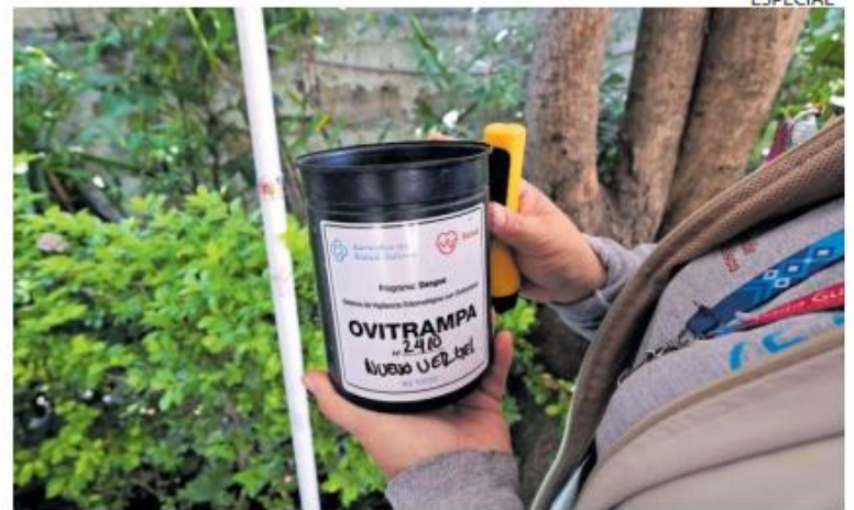
FUNCIÓN. Las ovitrampas permiten monitorear y medir la densidad del mosquito.

A la par, la SSJ llamó a la población a permitir el ingreso de brigadistas a sus domicilios para realizar acciones pre-