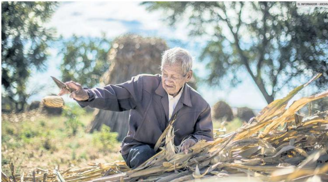
COSECHA DE MAÍZ. El costo de este alimento, presionado por el alza de los combustibles y fertilizantes, tiene relación con la guerra en Medio Oriente.

El organismo advierte que nuestro país será uno de los más afectados en la región