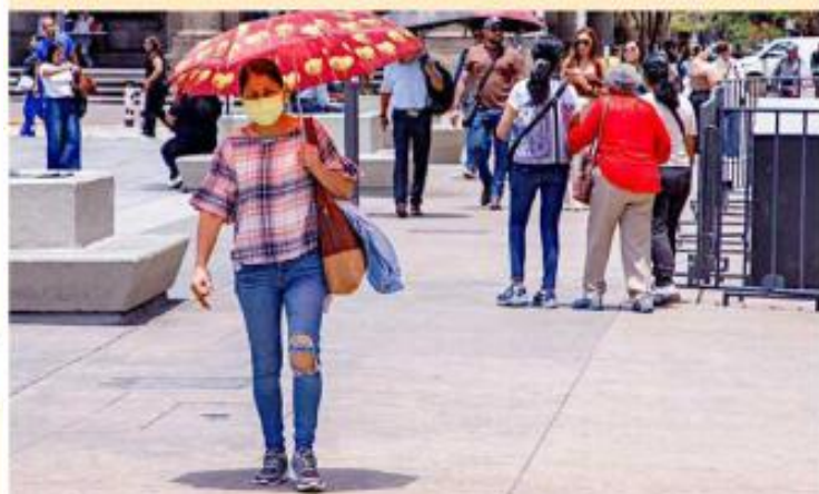
El uso de paraguas se ha vuelto cotidiano ante las altas temperaturas que imperan en la ZMG.