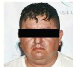
"El Jardinero" fue detenido el lunes.