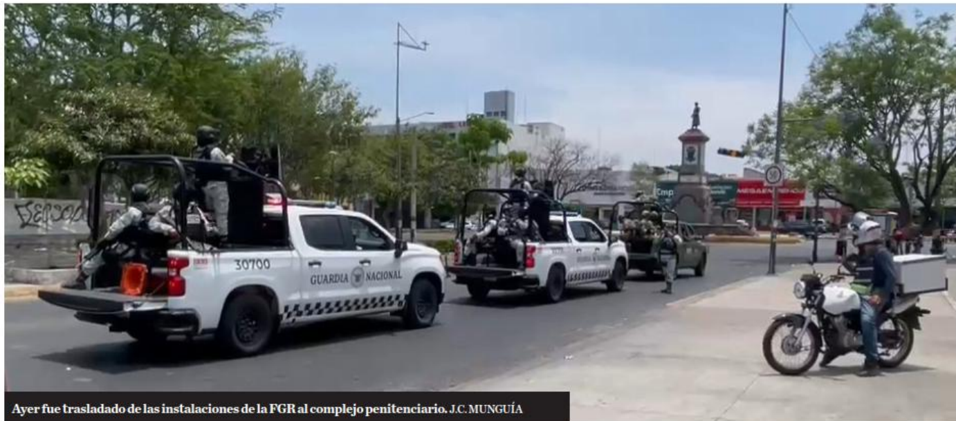
Ayer fue trasladado de las instalaciones de la FGR al complejo penitenciario. J.C. MUNGUÍA