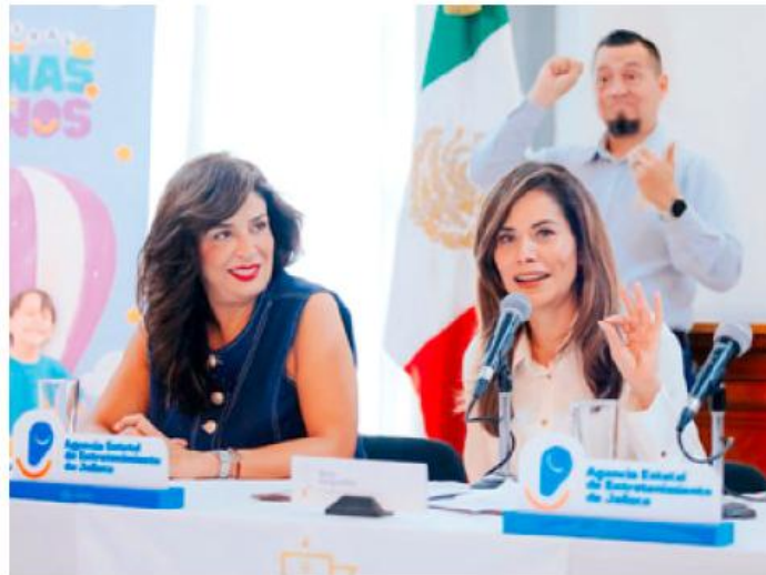
Las actividades se realizarán los días 2 y 3 de mayo, informó la alcaldesa.

El evento contempla espectáculos infantiles, juegos mecánicos, zonas interactivas y actividades deportivas a lo largo de Paseo Alcalde