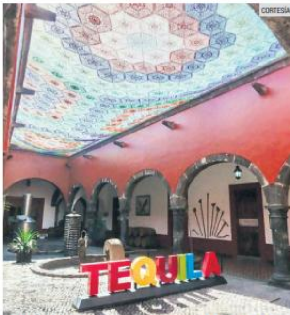
ARQUITECTURA. Interiores del Museo Nacional del Tequila.

Con una inversión de 15 millones de pesos, buscan que el recinto se posicione como el faro cultural de la región