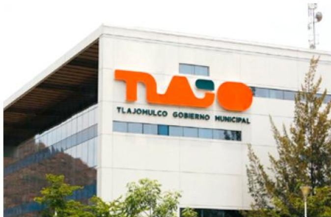
Esta medida responde a la buena respuesta ciudadana.

Además del descuento directo, se mantendrá vigente la condonación del 100 por ciento en multas y recargos para quienes presenten adeudos