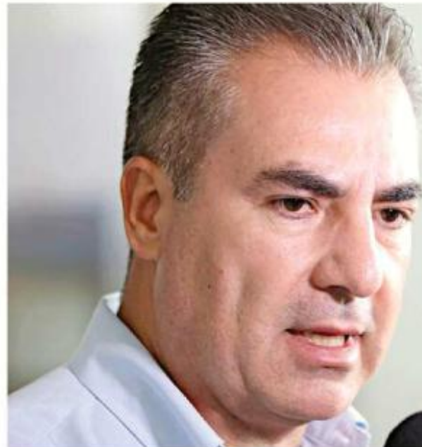
Ismael Jáuregui Director del Siapa

“No quisiera nada más ir con las malas, sino también quisiera llevar las propuestas, las propuestas en las que vamos a buscar la validación por parte de ellos (los diputados) en la materia presupuestal para poder buscar la renovación y los mejores trabajos en el organismo”, agregó.