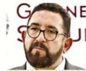
Ulises Lara, Fiscal de Asuntos Relevantes de la FGR.