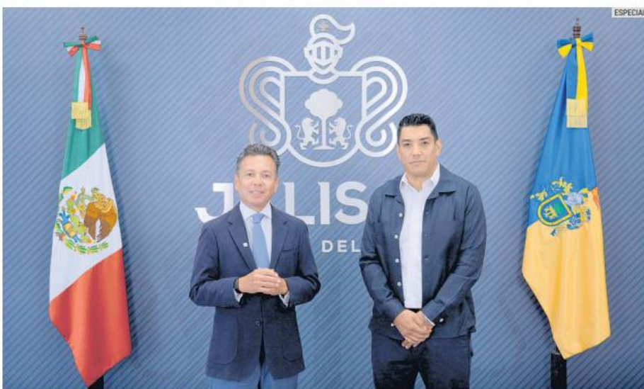
El anuncio fue hecho en conjunto por Pablo Lemus, gobernador de Jalisco, y Amilcar López, director del SITEUR.

tiona el sistema. Uno de los cambios más relevantes será el paso de un modelo de mantenimiento reactivo a uno preventivo, lo que permitirá anticipar fallas, optimizar recursos y mejorar la confiabilidad del servicio.