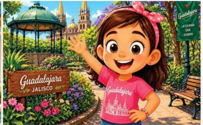
Ilustración: IA, Grupo REFORMA