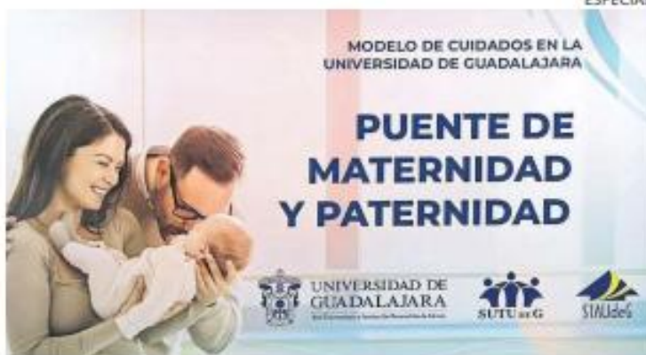
NUEVO MES. Las disposiciones del llamado "Puente de maternidad y paternidad" iniciarán el 1 de mayo.

La nueva disposición contempla que, además de las 12 semanas de licencia de maternidad establecidas por ley, las trabajadoras uni-