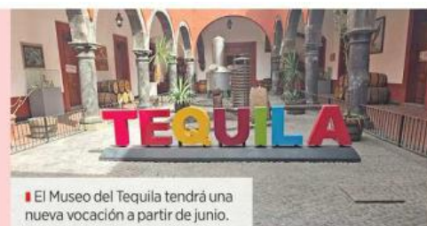
El Museo del Tequila tendrá una nueva vocación a partir de junio.

La Secretaría de Cultura de Jalisco informó que se destinarán alrededor de 15 millones de pesos