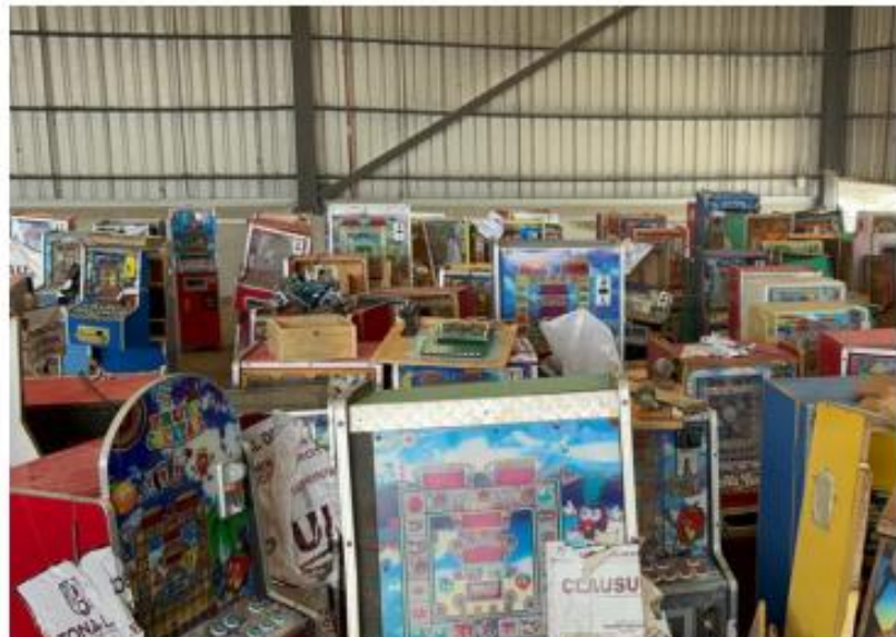
Autoridades refuerzan acciones contra tragamonedas.

El funcionario reiteró la importancia de la firma de convenios con municipios que les otorgará más facultades jurídicas para operativos, pero que la coordinación se mantiene a través de áreas de inspección y vigilancia, permitiendo actuar sin necesidad de acompañamiento directo en algunos ca-