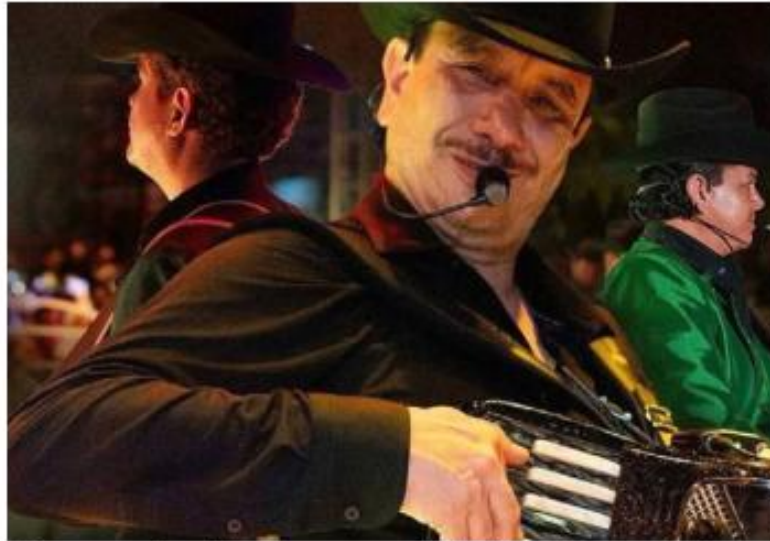
El grupo enfrentó cargos por apología del delito.