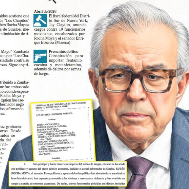
EXHIBIDA. El Departamento de Justicia de EU difundió el comunicado en el que acusa al gobernador Rubén Rocha Moya y nueve funcionarios.

Conspiración para importar fentanilo, cocaína y metanfetamina, además de delitos por armas de fuego.