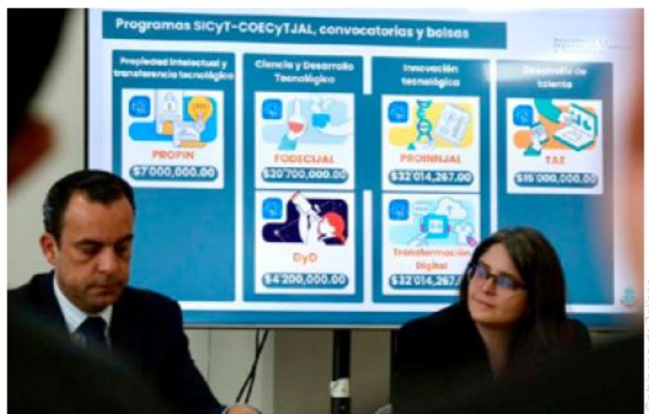
Las convocatorias son operadas por la Secretaría de Innovación, Ciencia y Tecnología.