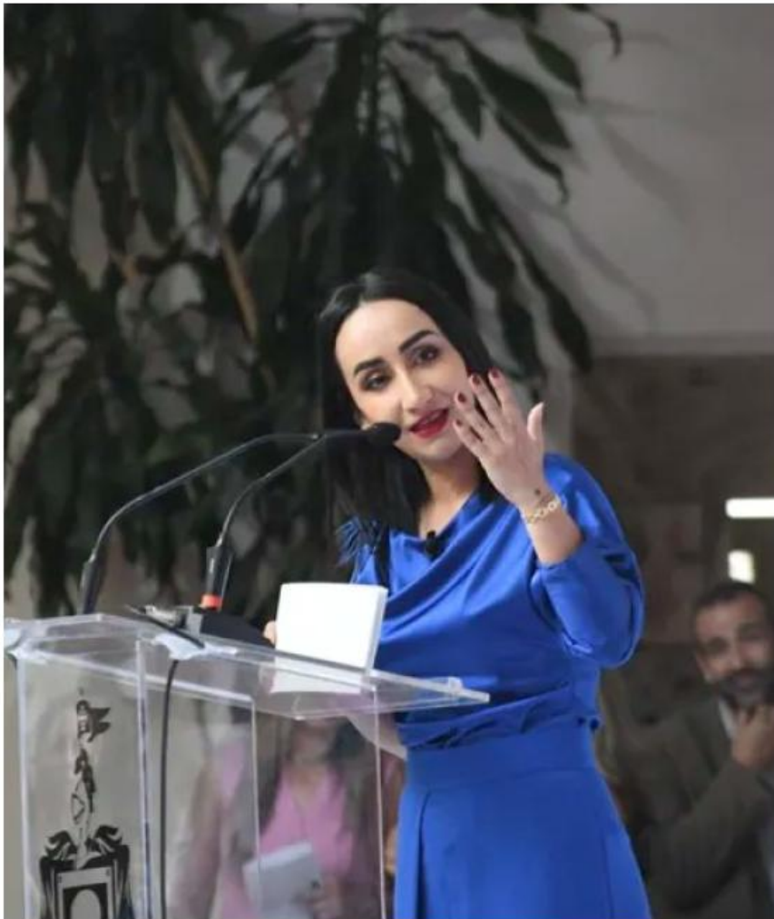
Murguía se convirtió en una figura clave; su postura llamó la atención a escala nacional.

Política. El frente que durante semanas tejieron legisladoras de PAN y PRI, terminó por desmoronarse justo el día de ayer