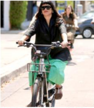
Las unidades fueron donadas por la Unión Europea.