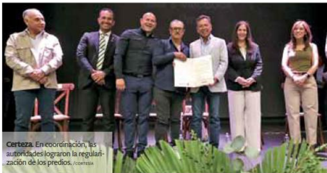
Certeza. En coordinación, las autoridades lograron la regularización de los predios.

El proceso se realizó mediante el Programa de Regularización y Titulación de Predios Urbanos y Es-