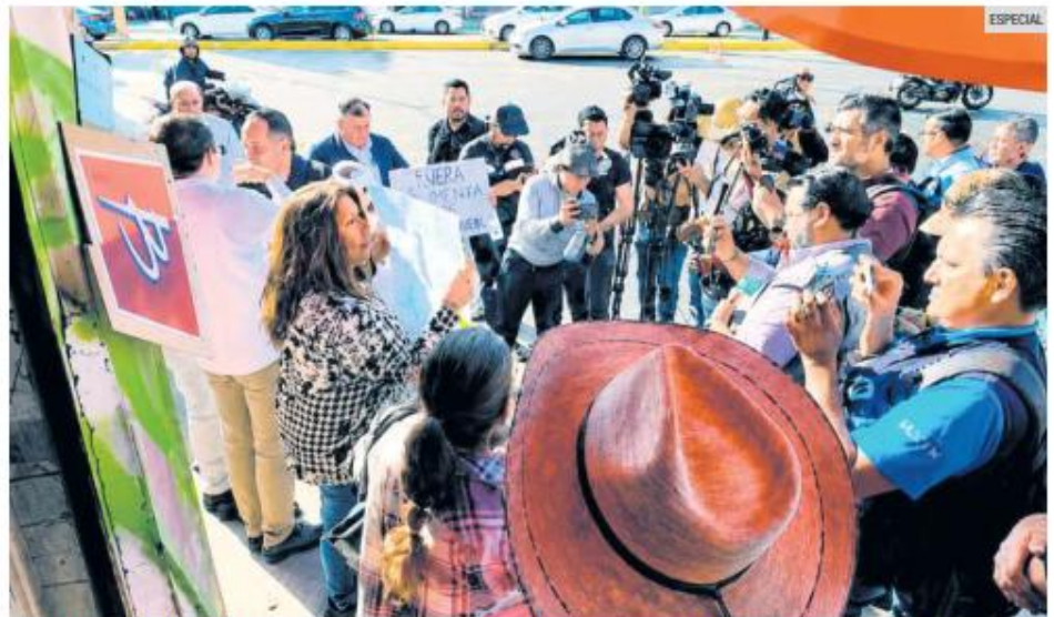
MOVILIZACIÓN. Habitantes del sur poniente de Zapopan bloquearon la avenida López Mateos para exigir una solución permanente a las fallas en el suministro de agua potable que afectan a varias colonias desde hace semanas.

Los manifestantes afirmaron que su principal demanda es la implementación de un proyecto hídrico permanente para la zona. También solicitaron infraestructura adecuada e información oportuna sobre el servicio, al considerar que la distribución de agua mediante pipas