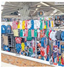
ILÍCITO. En el Mercado San Juan de Dios es común encontrar jerseys deportivos a bajo costo.