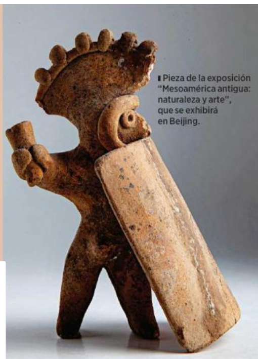
■ Pieza de la exposición "Mesoamérica antigua: naturaleza y arte", que se exhibirá en Beijing.

Aunque no hay todavía una itinerancia confirmada, Mercado señala que ya se han abierto conversaciones para que la exposición pueda viajar a una o dos ciudades más de China, en función de su recepción, de las condiciones de conservación y de las regulaciones aplicables.