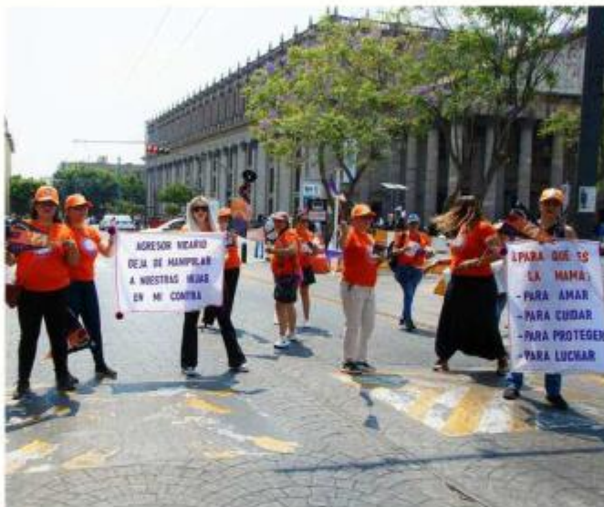
Integrantes del Frente Nacional Contra Violencia Vicaria pidieron afinar la colaboración con las autoridades.

más, que las víctimas buscan mecanismos que garanticen el cumplimiento de resoluciones judiciales y una atención efectiva por parte de las instituciones encargadas de impartir justicia.