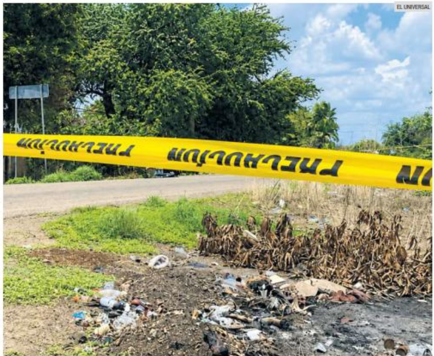
ESCENA. Autoridades realizaron diligencias e investigaciones en la zona donde fue localizado el cuerpo del empresario, mientras continúan los peritajes para esclarecer los hechos.

Ante estos hechos, la Comisión de Búsqueda de Personas del Estado de Jalisco emitió una ficha para solicitar apoyo de la ciudadanía en las labores de localización.