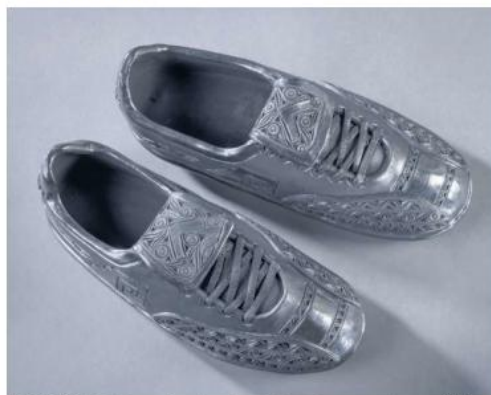
ARTESANOS. Talento mexicano transformó goles, equipos y recuerdos mundialistas.

La subdirectora destacó que esta es la tercera exposición impulsada por la institución que se presenta recientemente en Jalisco, luego de muestras instaladas en el Museo Cabañas y el Ex Convento del Carmen, consolidando así una presencia constante de proyectos culturales en el estado. "Estamos haciendo un esfuerzo por traer todas estas exposiciones y seguir difundiendo el patrimonio artístico mexicano", añadió.