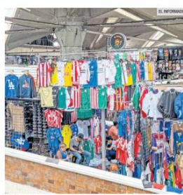
ILÍCITO. En el Mercado San Juan de Dios es común encontrar jerseys deportivos a bajo costo.