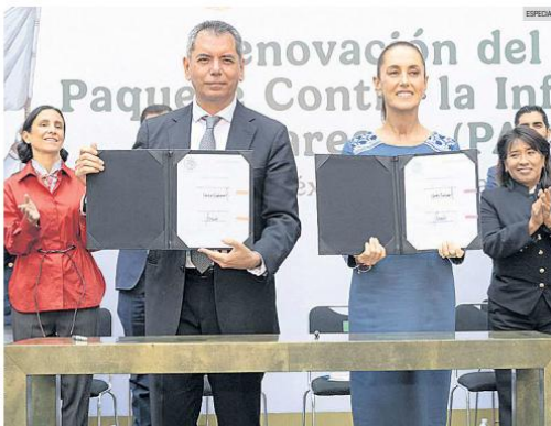
PALACIO NACIONAL. Claudia Sheinbaum renovó, junto al secretario de Hacienda, Edgar Amador Zamora, el Paquete Contra la Inflación y la Carestía para mantener la canasta básica en un máximo de 910 pesos. Mientras tanto, productos como el huevo, la carne, el limón y algunas verduras registran incrementos.

El Ayuntamiento informó que 25 aseadores de calzado que laboraban en la Plaza de la Liberación fueron reubicados temporalmente a la explanada del Mercado Corona y a los portales de la Plaza Universidad, donde continúan ofreciendo sus servicios.