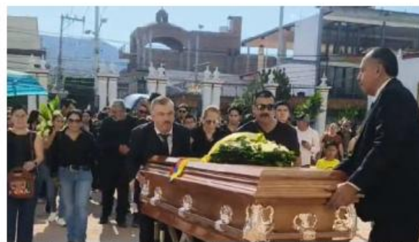
Este viernes se realizó el funeral para darle el adiós.