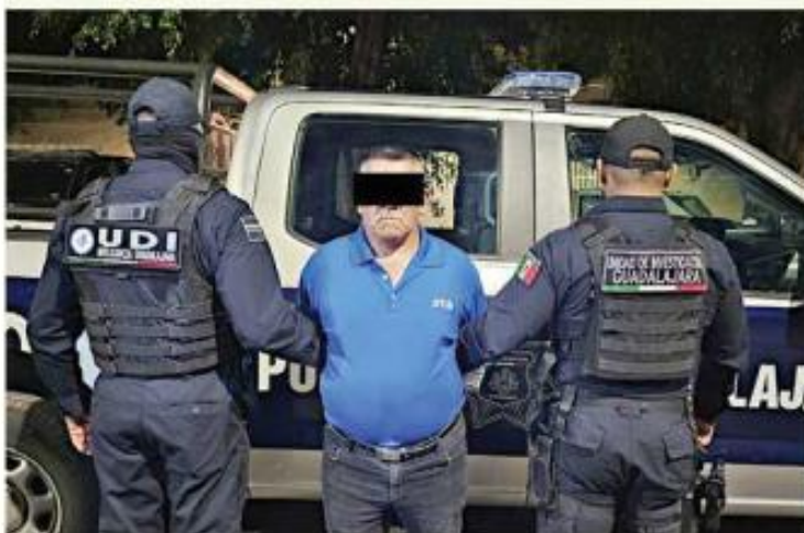
■ Enrique "N" fue capturado por policías tapatíos.

Usuarios de redes sociales difundieron videos en los que aparece el sujeto cuando se detiene en su bicicleta y se baja los pantalones frente a dos jovencitas.