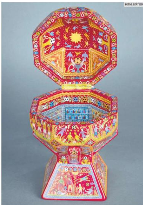
ARTE. La muestra está conformada por 70 piezas inspiradas en el balompié.

EN IMÁGENES | Transforman jugadas, estadios y pasión futbolera