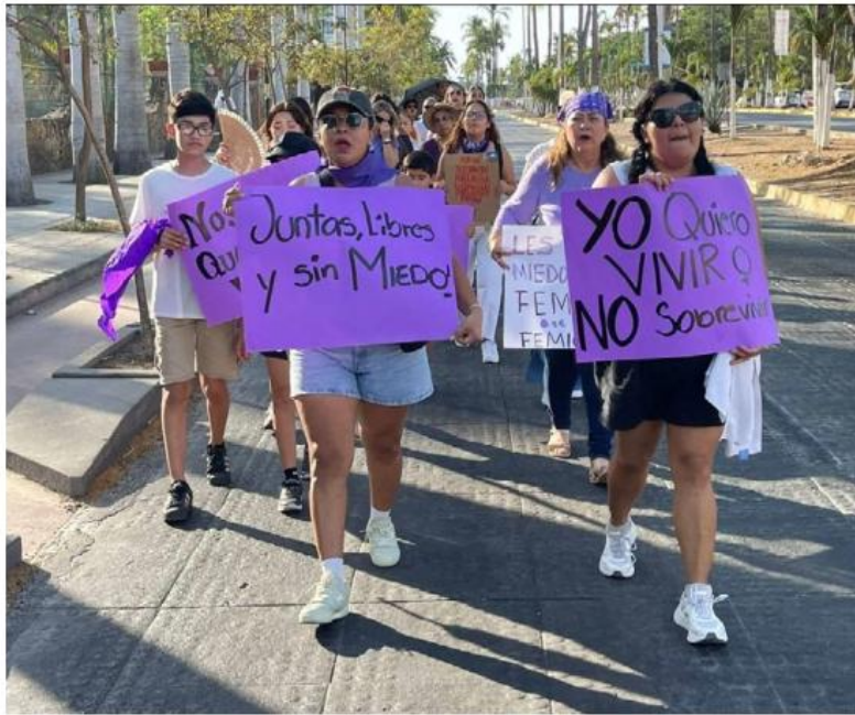
Este domingo, a las 16:00 horas, vuelven a salir a las calles.