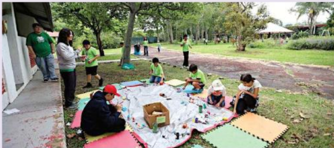
Los cursos de verano se realizarán en cuatro diferentes parques o bosques de la Zona Metropolitana.

“Una oferta pensada para que niños y niñas puedan vivir un verano lleno de aprendizaje, convivencia, deporte y contacto con la naturaleza. Es curar ese déficit de naturaleza del cual ahorita esta-