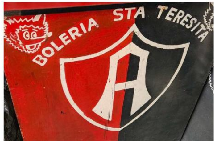
Al negocio acuden fieles del equipo rojinegro, también curiosos que valoran la importancia del brillo del calzado. ROBERTO HURTADO