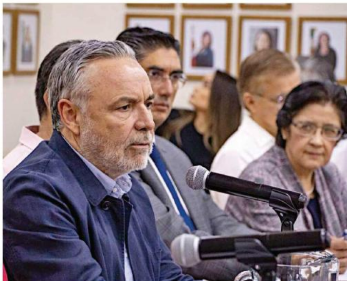
El diputado federal morenista participó ayer en una mesa de trabajo sobre mejoras al Código Fiscal de la Federación.