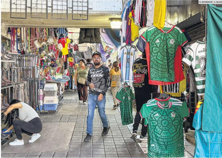
MERCADO SAN JUAN DE DIOS. Entre pasillos de mercados populares, comerciantes exhiben jerseys pirata de México y otras Selecciones mundialistas. Las réplicas de las camisetas se ofrecen desde 230 pesos, muy por debajo del costo de una prenda oficial, lo cual constituye un delito que genera pérdidas al sector formal.

Jalisco es segundo lugar nacional con más lugares con venta de productos apócrifos, como las camisetas de las Selecciones que participarán en el Mundial