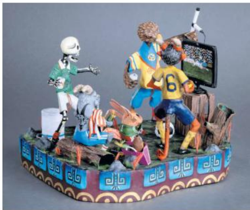
INSPIRACIÓN. La "Copa de Arte Popular Banamex" reúne obras creadas por artesanos de 29 Estados.

Tras su paso por la capital del país, la exhibición llegará ahora a Jalisco con una importante presencia de artesanos locales. Dos de las piezas ganadoras pertenecen a creadores jaliscienses y volverán a exhibirse en territorio estatal. "Tenemos varias piezas de artesanos de Jalisco. Dos fueron ganadoras y las trajimos aquí también para que las vuelvan a ver", comentó.