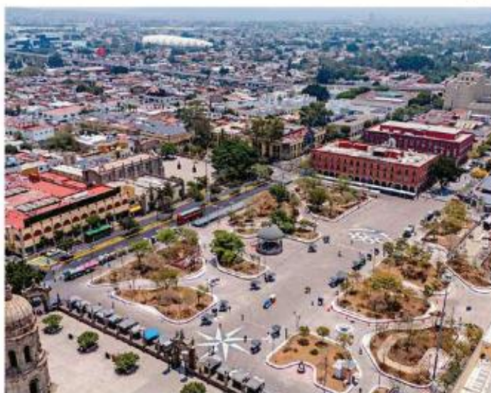
La Plaza de las Américas fue remodelada y albergará uno de los Fan Fest no oficiales.

Entre las novedades con las que recibirán a los aficionados al fútbol en los 39 días del Mundial, están bancas de concreto integradas a las jardineras, juegos infantiles y un sistema de captación pluvial, puntualizó Alvaro Orozco