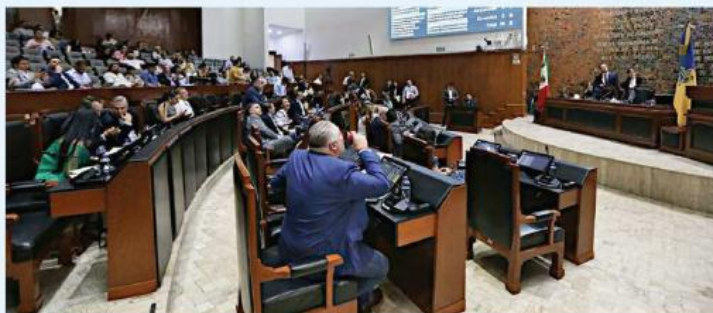
El Congreso rechazó el jueves por la noche el "Plan B" electoral en sesión del Pleno.

"El PAN procuró que dentro de esta reforma también se establecieran, lo que ha planteado el PAN, de evitar que lleguen narcopolíticos al gobierno, y eso es con base en los controles de confianza que ha propuesto también el PAN; y Morena, no