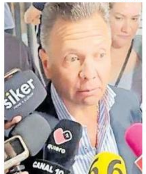
RECHAZO. El gobernador se mostró en contra de las acciones del colectivo #SoyPapáNoCriminal en la ciudad.