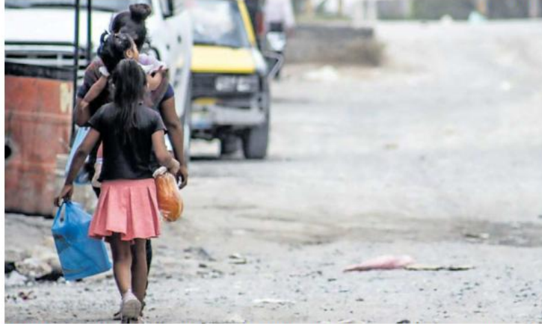
MONTOS. En el primer trimestre del año la canasta alimentaria alcanzó los mil 966.06 pesos en el sector rural y 2 mil 598.99 pesos en el urbano.