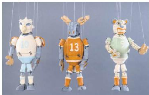
PIEZAS. Marionetas de madera que representan figuras antropomórficas vestidas con uniformes de fútbol.