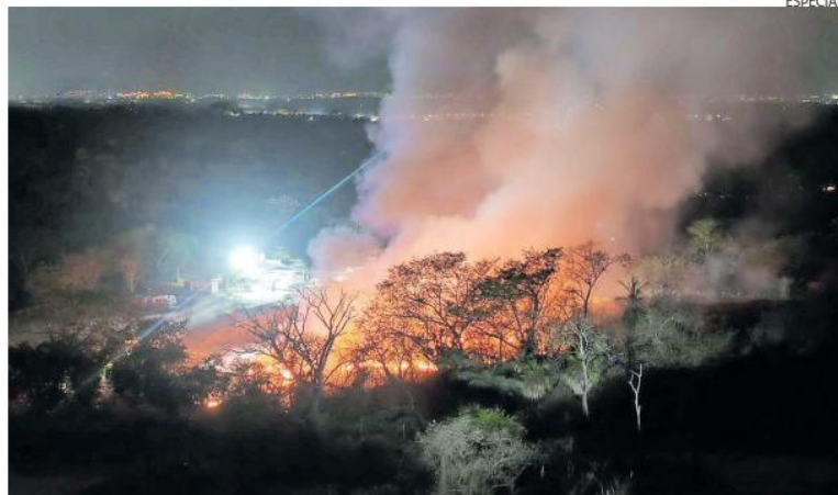
MENOS CALOR. Una de las acciones implementadas en el sitio ha sido la reducción de temperatura mediante el uso coordinado de agua y maquinaria pesada.