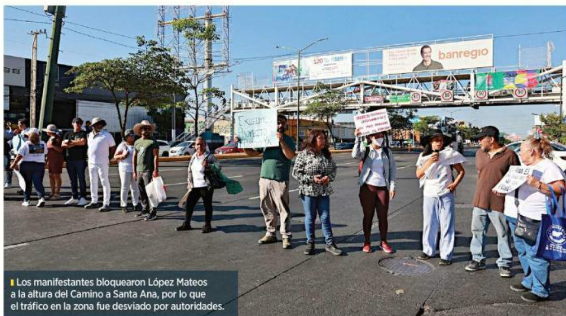
Los manifestantes bloquearon López Mateos a la altura del Camino a Santa Ana, por lo que el tráfico en la zona fue desviado por autoridades.