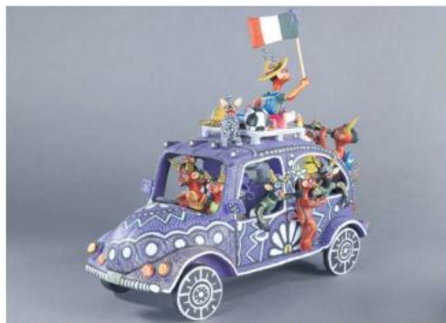
MATERIALES. La exposición reunirá piezas de barro, joyería, madera y miniaturas que reinterpretan la pasión futbolera mexicana.

"Lo que pretende Fomento Cultural Banamex es seguir apoyando y difundiendo el arte mexicano, las tradiciones, y seguir apoyando a todos los creadores, desde artistas plásticos, artesanos, fotógrafos y todo lo que podamos apoyar".