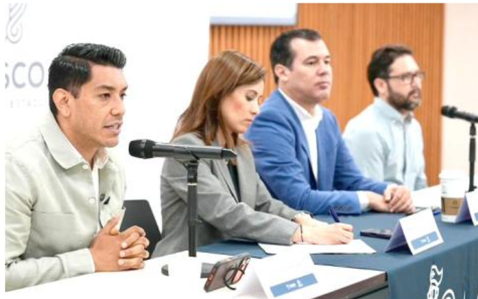
Este servicio no afectará las otras rutas del transporte público, detallaron funcionarios.

A partir del próximo lunes y a petición de los trabajadores del Aeropuerto de Guadalajara Miguel