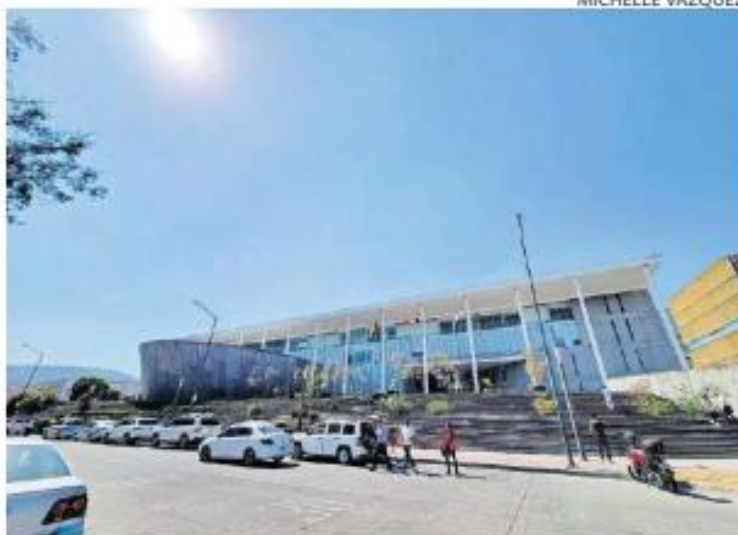
SOLO AHÍ. La suspensión aplicará exclusivamente para los juzgados del Primer Partido Judicial, ubicados en Ciudad Judicial Estatal.

Durante el 11, 18, 23 y 26 de junio de 2026, días en los que habrá partidos mundialistas en el Estadio Guadalajara, los juzgados de Ciudad Judicial suspenderán plazos y términos legales