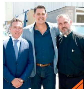
La ampliación fue inaugurada por el gobernador de Jalisco, Pablo Lemus.

Durante su intervención, Lemus Navarro señaló que dos de los principales motores económicos de la entidad son la agroindustria y el sector tecnológico.