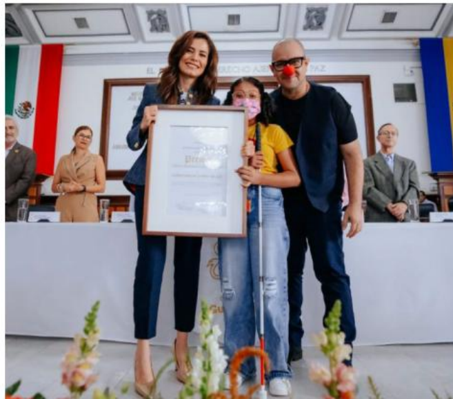
Campeones de la Vida Nariz Roja AC, fue una de las asociaciones galardonadas.

que decidieron no voltear el rostro, que entendieron que hacer una Guadalajara incluyente era necesario", expresó.