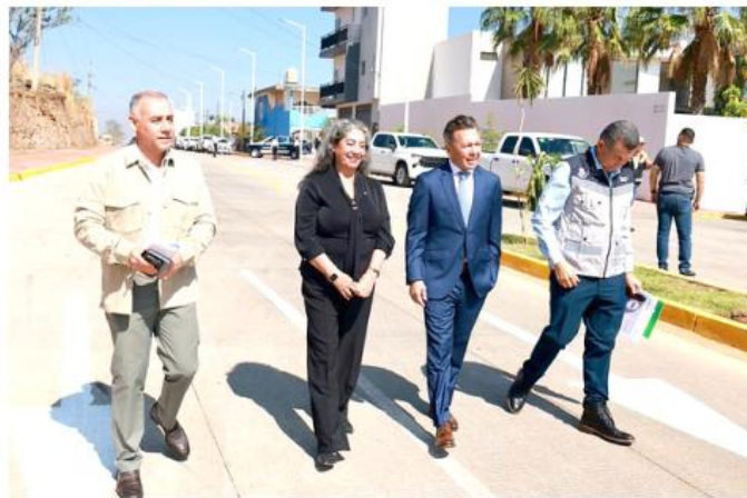
La obra entregada contempla 276 metros de pavimentación con concreto hidráulico.

La obra entregada contempla 276 metros de pavimentación con concreto hidráulico, además de banquetas, alumbrado público, señalamiento, áreas verdes e infraestructura hidrosanitaria. El proyecto integral forma parte de una estrategia para desahogar el tránsito pesado del centro del municipio y fortalecer la conexión con distintas