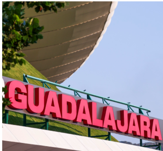
Estadio Guadalajara.