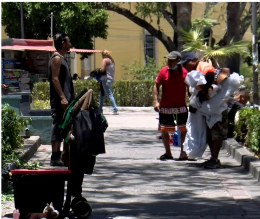
Cada vez más personas en situación de calle llegan al Jardín Botánico. RICARDO VALDIVIA

En el Jardín Botánico de Guadalajara, frente al Antiguo Hospital