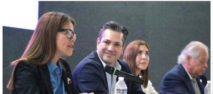
Se mostrará la identidad jalisciense a turistas nacionales e internacionales.

La iniciativa busca convertirse en una ventana para mostrar la identidad jalisciense a turistas nacionales e internacionales, además de generar oportunidades económicas para