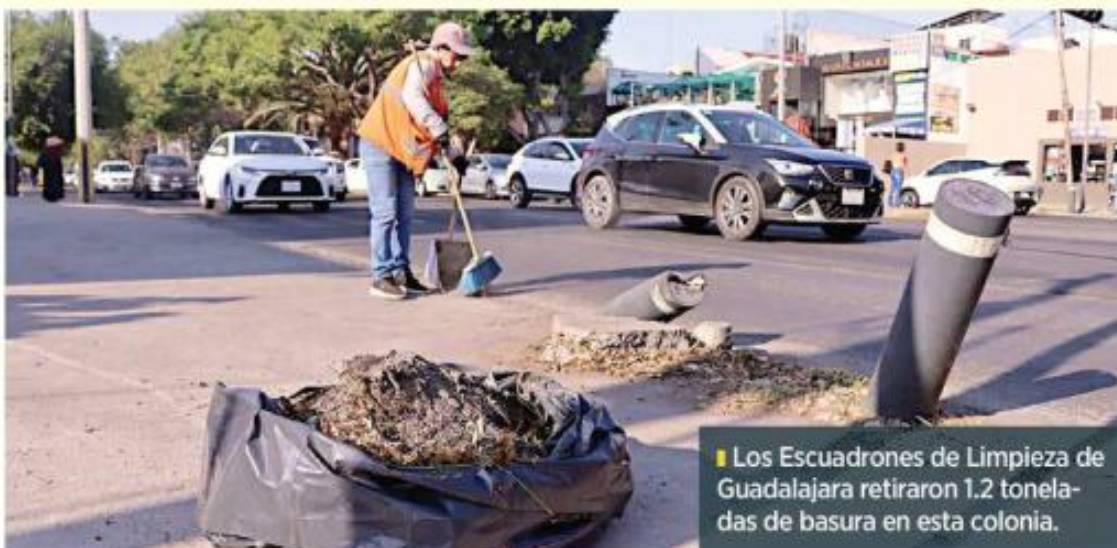
Los Escuadrones de Limpieza de Guadalajara retiraron 1.2 toneladas de basura en esta colonia.

Durante estos recorridos, el personal lleva a cabo las labores de limpieza, revisa la documentación de los establecimientos y firma oficios de compromisos con los comerciantes.