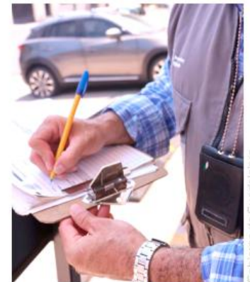
La sanción principal fue el incorrecto manejo de residuos.

El Ayuntamiento detalló que la mayoría de las sanciones ocurrieron porque los establecimientos no contaban con un contrato de recolección de basura, entre otras faltas.