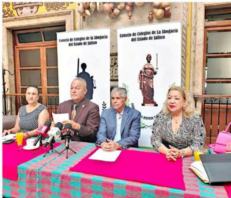
El Consejo de Colegios de la Abogacía de Jalisco pide los mejores perfiles para la elección judicial.

Propuso también que se libere más presupuesto constitucional, que actualmente es del 2 por ciento, para que pueda haber más jueces y magistrados. Lo ideal, recordó Tello, es tener un juzgado por cada 100 mil habitantes.