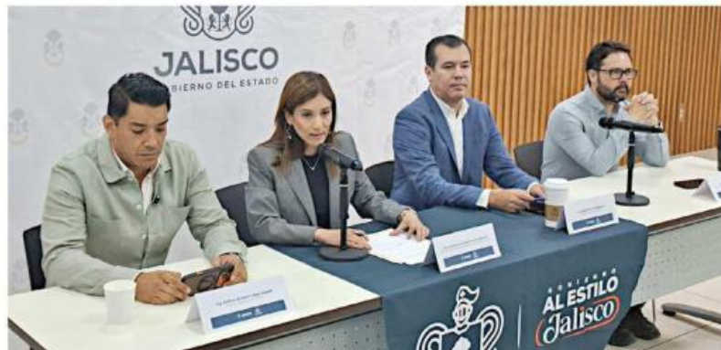
Las autoridades estatales informaron que a partir del 8 junio este transporte tendrá una tarifa de 11 pesos, con un horario de 3:30 a 22:30 horas.