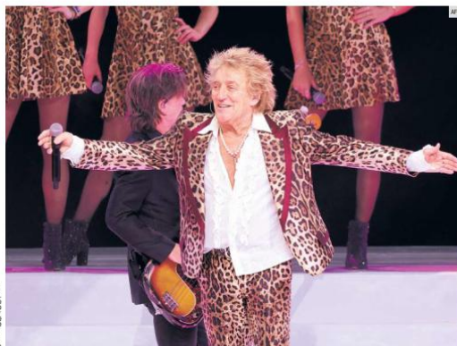
LEGENDARIO. Con más de cinco décadas de trayectoria y éxitos que marcaron generaciones, Rod Stewart llegará a Guadalajara el próximo 11 de septiembre para inaugurar el Coliseo GNP Seguros, como parte de su gira mundial de despedida, en una presentación que promete convertirse en un momento histórico para la ciudad.