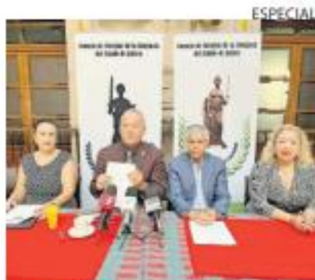
GASTO. Los integrantes del consejo también plantearon incrementar el presupuesto destinado al Poder Judicial.

En ese sentido, propusieron incrementar el presupuesto destinado al Poder Judicial hasta alcanzar el 5 por ciento del presupuesto estatal con el propósito de contratar más jueces, juezas y personal auxiliar, además de fortalecer la infraestructura judicial.