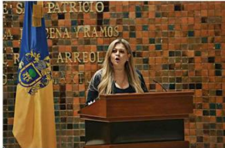
■ Celenia Contreras, diputada de MC, dejó su curul en el Congreso.

“Más de 10 años ya he sido servidora pública, he sido de elección popular; y creo que es momento de dar un paso más adelante. Desde el Congreso del Estado hemos dado muy buenos resultados, hemos defendido a las y los tlaquepaquenses, hemos presentado iniciativas que le han servido a los jaliscienses para mejorar su calidad de