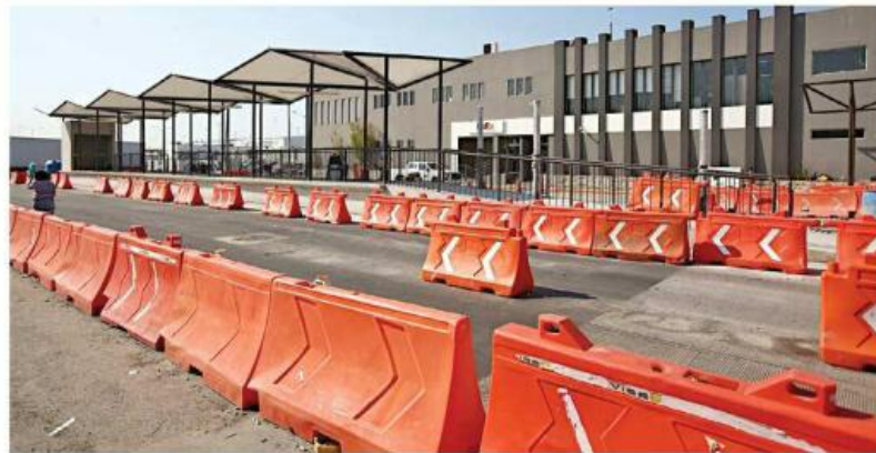
Del 4 al 7 de junio la Línea 5 será gratuita. Tendrá un horario de 6:00 a 22:00 horas.

“Varias colonias satelitales que se fueron construyendo con poca planeación urbana habían estado mal conectadas, teniendo que entrar al