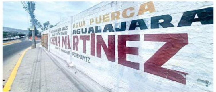
Se analizan quejas sobre presuntos actos anticipados de campaña, promoción personalizada de servidores públicos, entre otros.

"La atención que el Instituto debe dar a cada denuncia implica el desarrollo de diversas actuaciones técnicas, jurídicas y de investigación para la debida integración de cada uno de los expedien-