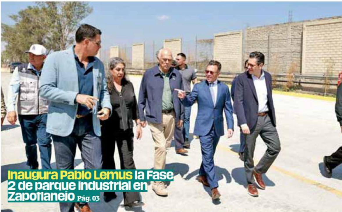
Inaugura Pablo Lemus la Fase 2 de parque industrial en Zapotlanejo Pág. 03

Afectación. A un mes del acuerdo para que el litro de diésel baje a 27 pesos, en estaciones de carga de al menos 15 estados del país se ofrece en casi 29 pesos al público. / Pág.02