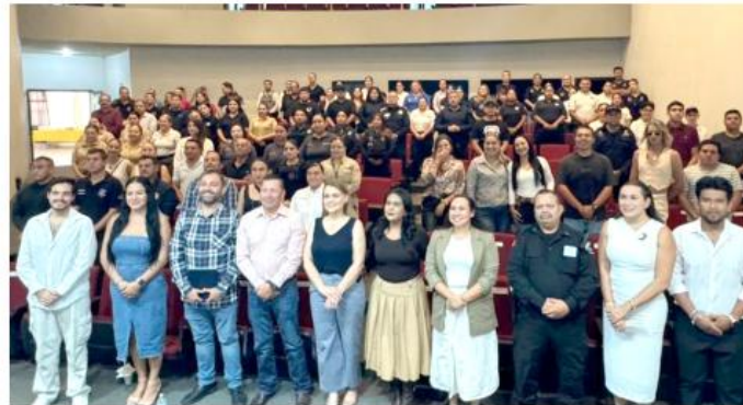
Las actividades se desarrollaron en la Clínica de Atención Especial.