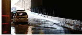
■ Cerca del mediodía de ayer, algunos túneles aún tenían agua de la lluvia del domingo, como el de las Avenidas Américas y Ávila Camacho.

De acuerdo con habitantes de la zona, dichas inundaciones provocaron caos vial, ya que se tuvo que cerrar la