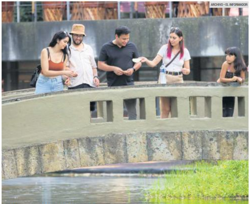
PROMOCIÓN INTERNACIONAL. Mundo Jalisco será difundido en el Aeropuerto Internacional de Guadalajara y entre embajadas con presencia en la ciudad para atraer visitantes extranjeros durante el Mundial de Fútbol de 2026.

También informó que se aprovechará la infraestructura del sistema Mi Bici para que los asistentes puedan llegar al festival en bicicleta. Asimismo, la promoción del evento estará presente en las pantallas del Aeropuerto