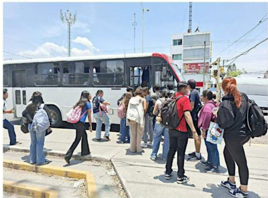
Las rutas del transporte público estatal tampoco aplican el subsidio correspondiente a los estudiantes, porque no cuentan con sistemas de recaudo.

“Probablemente son transporte suburbano federal que no entra a los beneficios del Estado (los que no aplican el subsidio), las rutas suburbanas que vienen de otros municipios más alejados como Tala (...) o algunos otros más lejanos del cualquier punto cardinal del Área