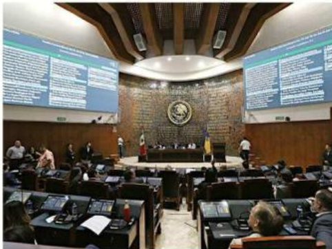
El Congreso aprobó una reforma al Código Penal para sancionar los "deepfakes", contenidos audiovisuales creados por Inteligencia Artificial.