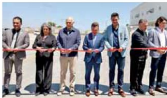
Desarrollo. El corte de listón de la segunda fase del complejo fue encabezado por el gobernador Pablo Lemus.

Según datos presentados por la Coordinación de Crecimiento y Desarrollo Económico, la entidad