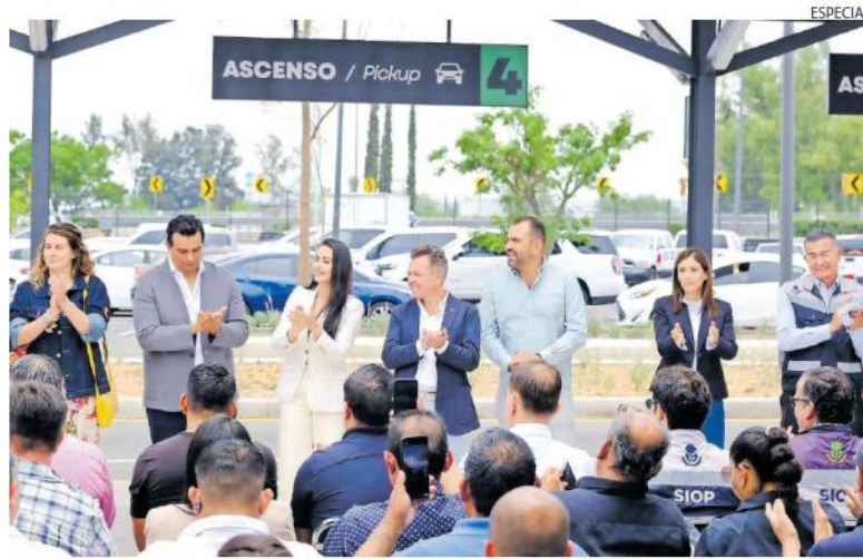
INAUGURACIÓN. El gobernador Pablo Lemus presumió la obra que permitirá que los viajeros que lleguen al aeropuerto puedan tomar Uber, Didi u otras plataformas digitales.