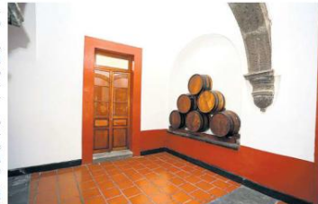
ESTAMPAS. En la imagen se observan barricas de madera apiladas en un nicho.