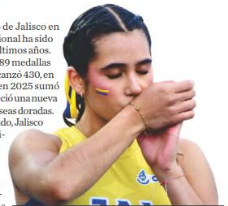
El nuevo récord: 501 oros.

Con este resultado, Jalisco reafirma su dominio en el deporte juvenil mexicano y amplía una hegemonía que ya suma 25 campeonatos nacionales consecutivos. —