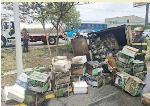
■ La carga de la camioneta también sufrió daños.