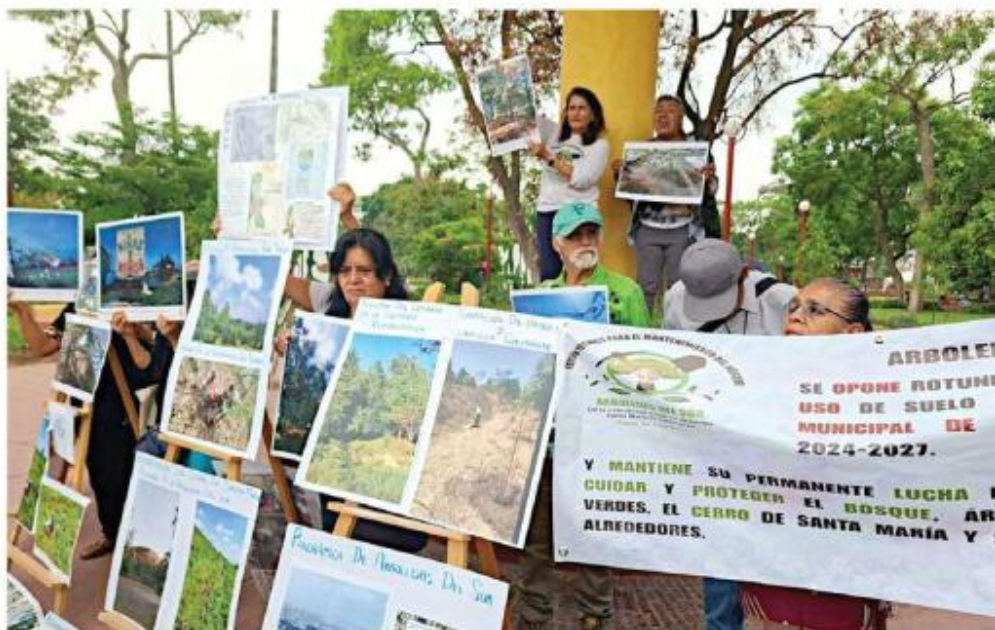
Los colectivos en pro del medio ambiente se manifestaron en el Parque Revolución.

El posicionamiento fue presentado por el Instituto de Derecho Ambiental (Idea), la Red Metropolitana en Defensa de los Parques, Áreas Verdes, Cerros, Arroyos, Lagos, Barrancas y Bosques, los Observatorios Ambientales Sur y Puerta Poniente, así como la Comunidad Indígena de Hecho de Santa María Tequepexpan.