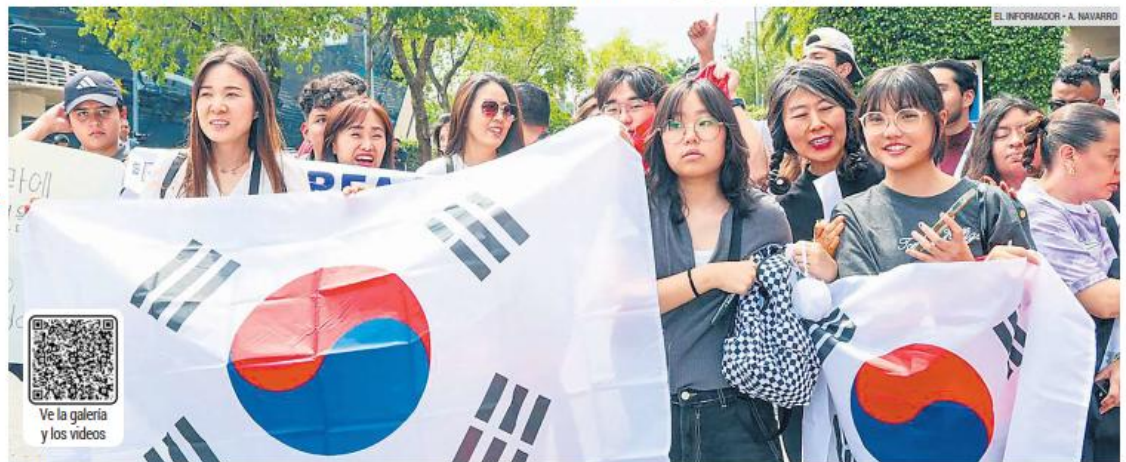
APOYO. La comunidad coreana en la ciudad mostró su apoyo a su Selección.