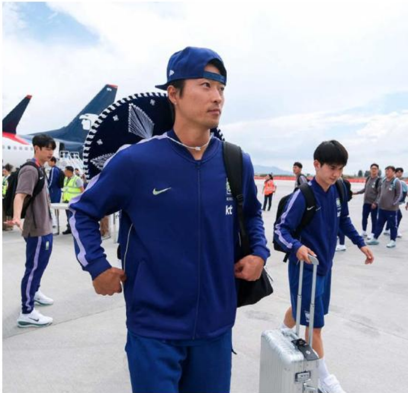
Al pisar suelo tapatío les regalaron sombreros de mariachi. ESPECIAL