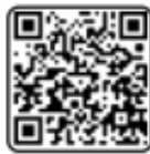
Así se llega al patio de plataformas

Con este modelo, Jalisco se convierte en la primera Entidad del país en establecer una solución operativa para la prestación de servicios de transporte por aplicación en las inmediaciones de un aeropuerto.