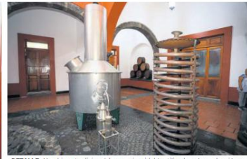
DETALLE. Alambique tradicional de acero inoxidable utilizado en la producción artesanal de tequila.