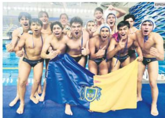
CAMPEONES. Las selecciones de polo acuático se distinguieron por ser una de las 24 disciplinas en las que el Estado se coronó a nivel nacional.