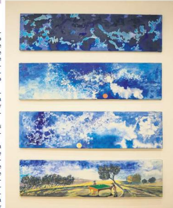
ORIGEN. La exposición de reapertura está inspirada en un verso de Ramón López Velarde.