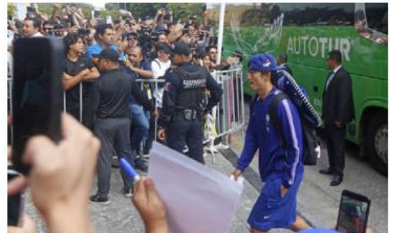
Casi 200 personas los recibieron en el hotel.