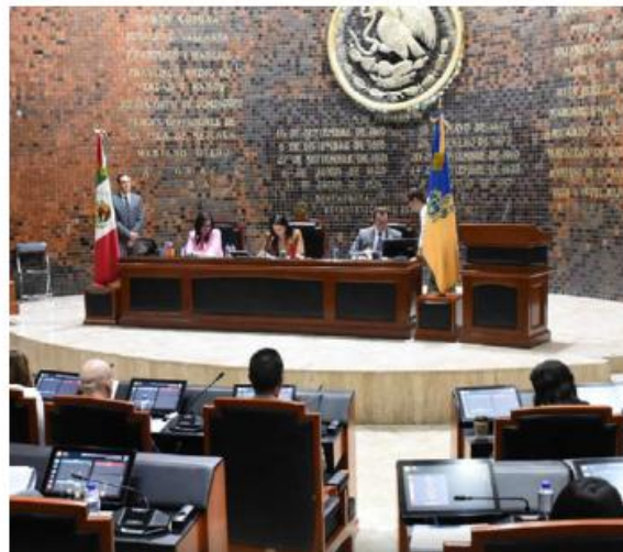
Falta consenso para modificar la disposición.

Por lo pronto, el llamado del gobernador Pablo Lemus no tuvo eco en el Poder Legislativo. El próximo 8 de junio seguirá siendo día inhábil en el Congreso de Jalisco, reflejo de la falta de consenso para modificar una disposición heredada de la administración anterior. —