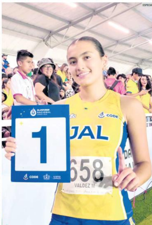
LOS NÚMERO UNO. Jalisco se ha destacado por ser la máxima potencia deportiva de México, y lo confirmó con un título más de Olimpiada Nacional.