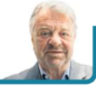
X: @JorgeGCastaneda Jorge Castañeda G.