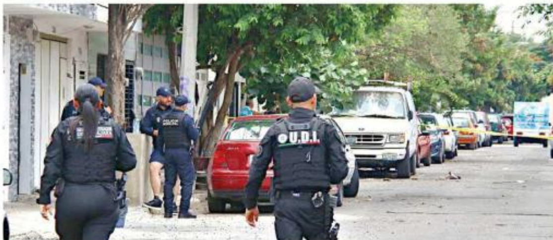
■ Oficiales tapatíos establecieron un cerco de seguridad en el sitio del ataque.