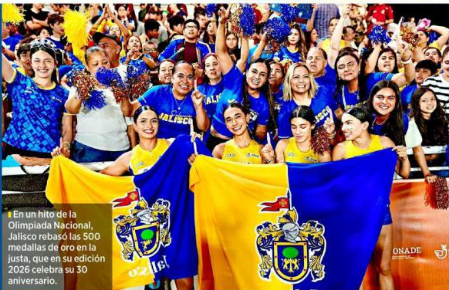
En un hito de la Olimpiada Nacional, Jalisco rebasó las 500 medallas de oro en la justa, que en su edición 2026 celebra su 30 aniversario.