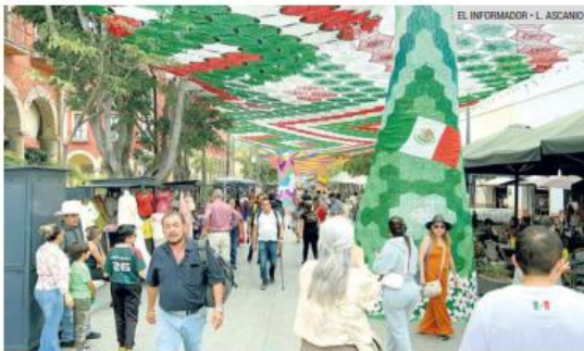
LLAMATIVO. El cielo tejido en el Andador 20 de Noviembre se roba las miradas.