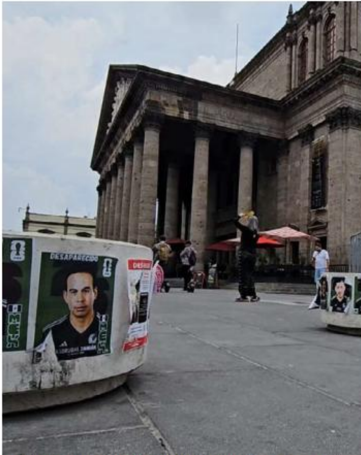
Las imágenes llenan el Centro de Guadalajara. J.C. MUNGUÍA