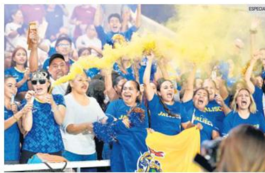
APOYO. Las familias de los atletas jugaron un papel vital en la obtención de este éxito para la Entidad.