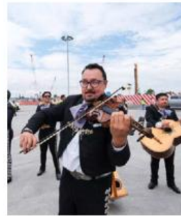
El mariachi. ESPECIAL