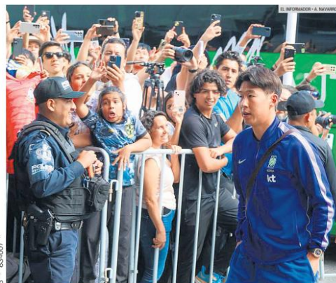
RECEPCIÓN. Entre banderas, cánticos y música de mariachi, aficionados dieron una cálida bienvenida a la Selección de Corea del Sur en Guadalajara. La llegada de Son Heung-min desató la euforia de los seguidores, que ya comienzan a vivir el ambiente mundialista.