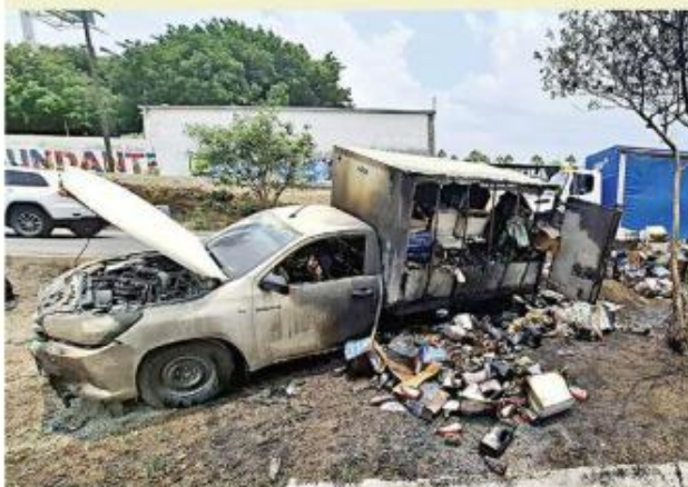
■ Bomberos controlaron otro incendio la vía a Nogales.