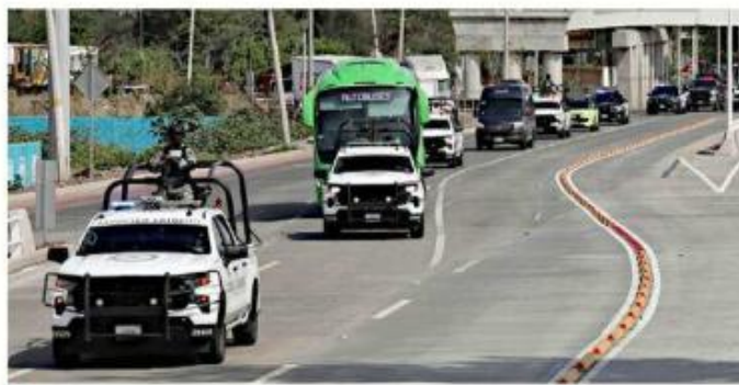
El dispositivo de seguridad que llevó a los coreanos a su hotel.

Corea del Sur, que concluirá su actividad en el Grupo A el 24 de junio ante Sudáfrica en Monterrey, entrenará hoy en Verde Valle, complejo que servirá como su Base Camp durante la Copa del Mundo.