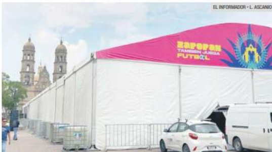
PREPARACIÓN. Un gran toldo con amenidades se alista en el centro zapopano.