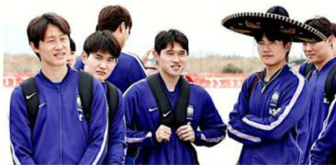
Algunos futbolistas coreanos se pusieron el sombrero de charro.