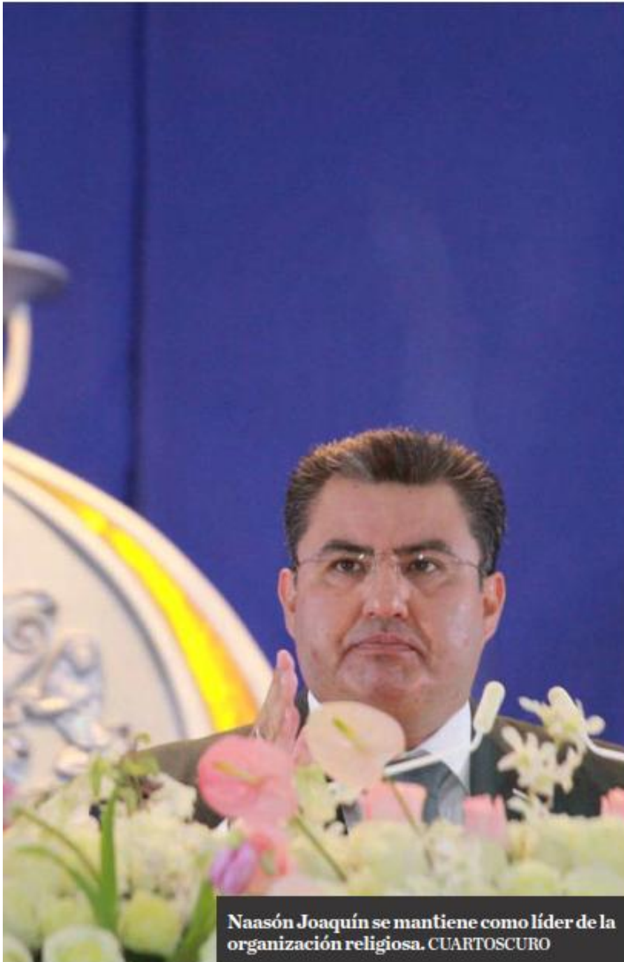
Naasón Joaquín se mantiene como líder de la organización religiosa.

del Mundo, A.R. SGAR/7:2/93; Jurisdicción Norte de la Iglesia del Dios Vivo, Columna y Apoyo de la Verdad La Luz del Mundo, A.R. SGAR/7:3/93; y Fraternidad Levítica, A.R. SGAR/7:4/94.