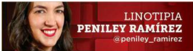
LINOTIPIA PENILEY RAMÍREZ @peniley_ramirez

Es importante revelar el lado truculento del Mundial, pero más allá del ruido y el negocio, el fútbol significa mucho más.