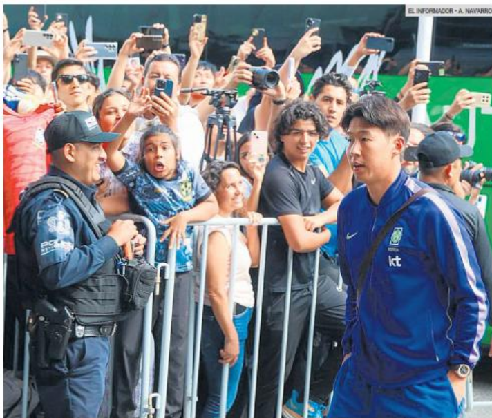
RECEPCIÓN. Entre banderas, cánticos y música de mariachi, aficionados dieron una cálida bienvenida a la Selección de Corea del Sur en Guadalajara. La llegada de Son Heung-min desató la euforia de los seguidores, que ya comienzan a vivir el ambiente mundialista.