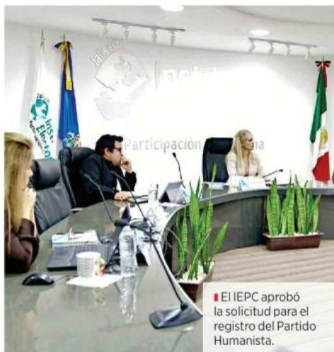
■ El IEPC aprobó la solicitud para el registro del Partido Humanista.