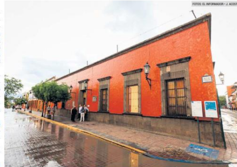
MUNAT. Fachada del recinto cultural que abre sus puertas. El edificio data del siglo XIX.

"Yo creo que los tiempos van bastante ágiles para los trámites que normalmente se tienen que hacer en gobierno. Es un edificio patrimonial, es muy importante y tenemos que tener todos los cuidados", indicó.