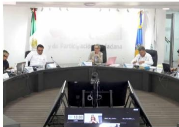
El instituto la aprobó ayer en sesión extraordinaria.