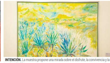
INTENCION. La muestra propone una mirada sobre el disfrute, la convivencia y la contemplación.