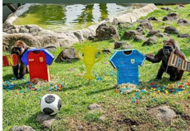
■ Chenchu, la gorila de tierras bajas, inclinó su pronóstico hacia Uruguay para el encuentro entre España y la selección charrúa.