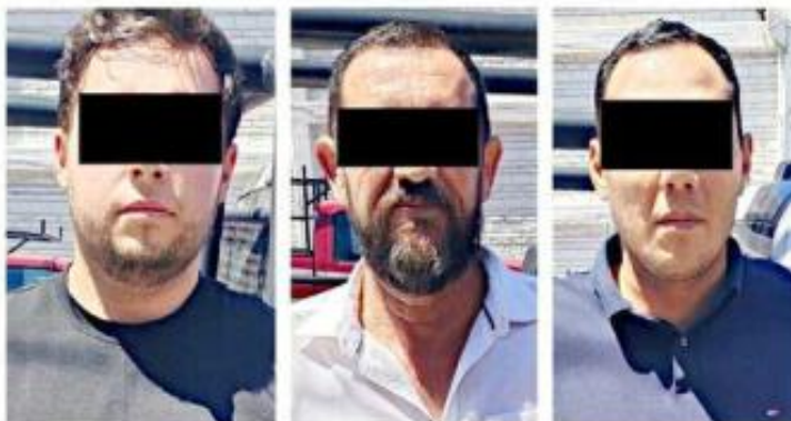
■ Los servidores públicos quedaron en prisión preventiva.

taria de un establecimiento ubicado en la Colonia Morelos. Ella relató que los inspectores llegaron a su negocio y señalaron que le hacía falta un permiso de Protección Civil para continuar sus operaciones comerciales.