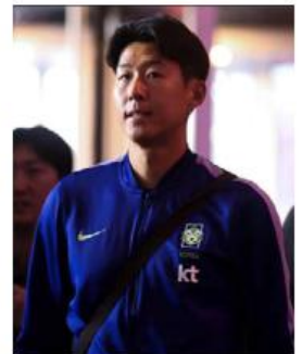
Son Heung-Min. GDL2026

Corea del Sur debuta en la Copa del Mundo el 11 de junio ante Chequia en el Estadio Guadalajara.