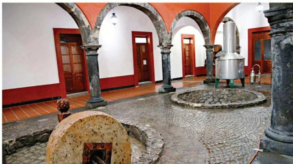
■ EL recinto en Tequila ya fue abierto pero su rehabilitación terminará hasta 2027.

El recinto volvió a abrir tras casi un año cerrado, aunque sólo dos salas están listas