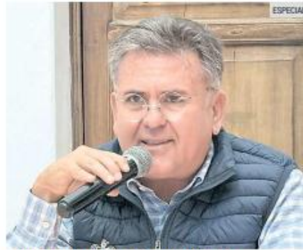
GUILLERMO MEDRANO BARBA. El director general del IJALVI presentó el Plan Estatal de Vivienda.