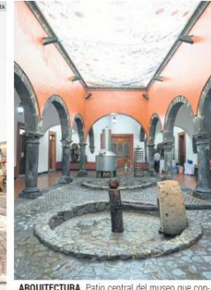
ARQUITECTURA. Patio central del museo que conserva detalles característicos de la zona tequilera.