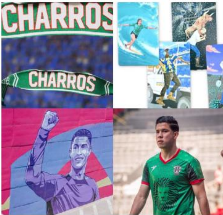
La ciudad ya vibra con el Mundial. ESPECIAL

Especial. Jalisco comienza a teñirse de ambiente mundialista con iniciativas deportivas, sociales y culturales