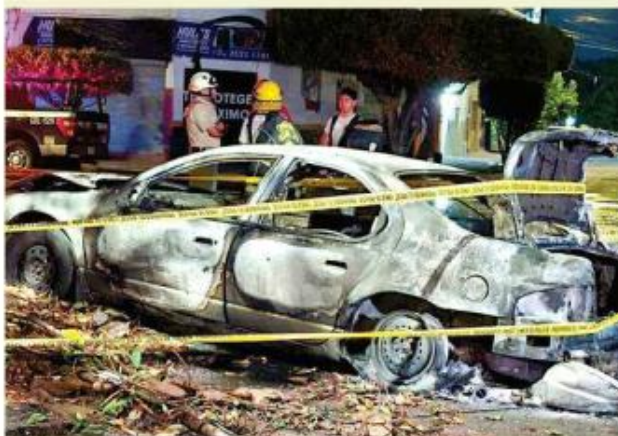
■ Un auto fue consumido por las llamas en San Juan Bosco.

Dos vehículos resultaron con daños tras incendiarse en hechos distintos registrados ayer en Guadalajara y Zapopan. En un caso, autoridades investigan una posible agresión; en el otro, el fuego consumió una camioneta que transportaba aceite automotriz.