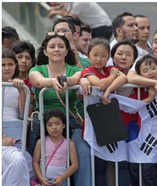
Hubo fans mexicanos y coreanos.

El arribo de Corease hizo con un fuerte dispositivo de seguridad, pe-