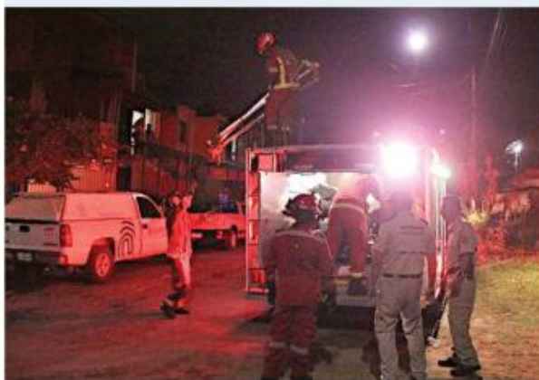
■ Bomberos usaron un sistema de cuerdas para extraer el contenedor de la alcantarilla.

Fuentes policiales indicaron que tres sujetos arribaron al domicilio de la víctima y, tras sostener una discusión, le dispararon dos veces.