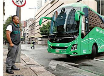
Uno de los conductores detalló su plagio.

“La CNTE ha convertido el chantaje en una estrategia de negociación y el Gobierno ha convertido la rendición en una forma de gobernar. Los mexicanos no pueden seguir pagando el costo de ambas cosas”, protestó.