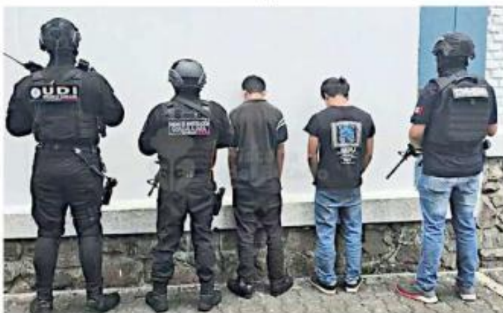
Personal de la Fiscalía localizó a los adolescentes.

Los adolescentes llegaron juntos y entraron al establecimiento con un cuchillo, pero el comerciante se resistió y comenzó a forcejear con uno de ellos, mientras el otro buscaba la caja registradora.