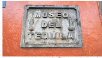
IDENTIDAD. Placa de piedra tallada que identifica al Museo Nacional del Tequila.